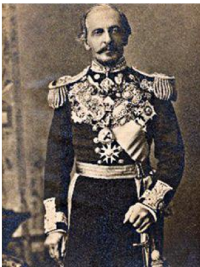
Лорд Ф. Дафферин, вице-король Индии в 1884–1888 гг.

О значимости Суэцкого канала в развитии российско-индийской торговли писал К.А. Скальковский в своей монографии, ставшей очень популярной не только в России, но и за рубежом. Автор, в частности, отметил, что морской путь до Бомбея от важнейших портов Юга России через Суэцкий канал составил: от Одессы — 3 948 морск. мили, от Севастополя — 3 894, от Таганрога — 4 195, от Поти — 4 175 м.м. [Скальковский, К.А., 1870, с. 77]. С открытием нового пути в Индию предприниматели из Бомбея и Калькутты выразили намерение открыть склады для хлопка-сырца в Москве, но затем изменили свое мнение и предпочли Одессу. К.А. Скальковский привел конкретные примеры выигрыша во времени для транзита европейских товаров в Индию через южные порты Российской империи. Автор отмечал: «Ост-Индия и ее многочисленные порты представляют важнейшее поприще и для русской торговли по Суэцкому каналу, по необыкновенному разнообразию своей производительности и обширному потреблению товаров своим многочисленным населением» [Там же, с. 162].