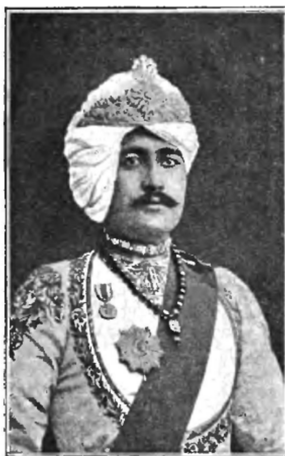
Магараджа Кучъ Бехара.

Индійскіе владѣтельные князья — магараджи, участвовавшіе въ торжественномъ празднованіи въ Дэли восшествія на престолъ императора Индіи, короля Великобританіи Эдуарда VII.