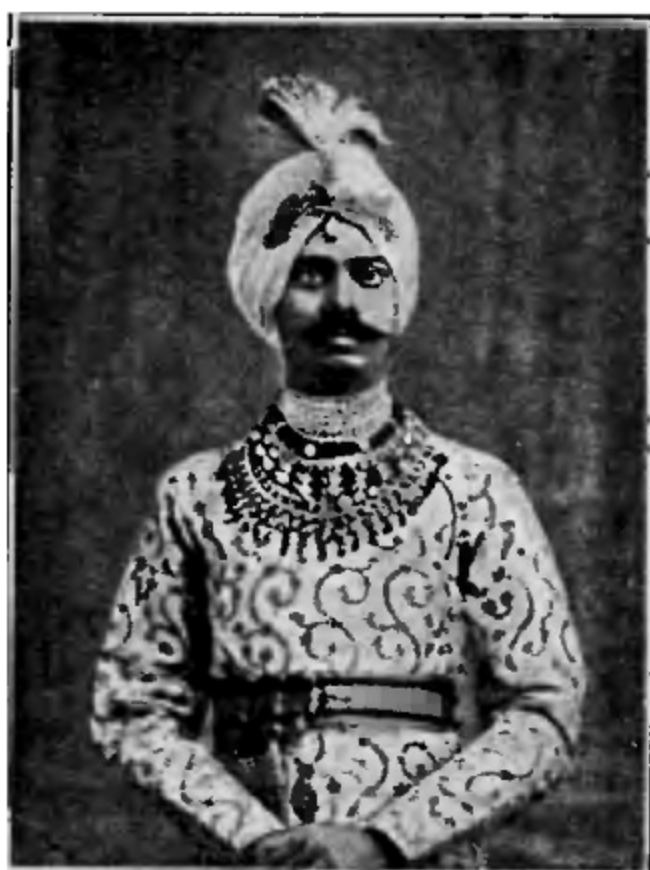
Магараджа Прадіють Кумаръ Ягоре.