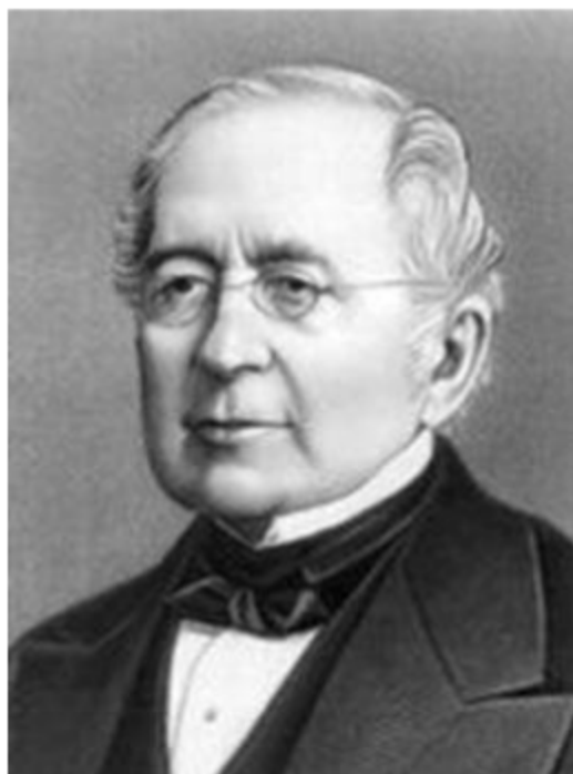
Государственный канцлер А.М. Горчаков

В 1871 г. в порты Индии прибыло два российских корабля, которые доставили отечественные товары общим весом в 1396 т. [Annual, p. 704]. В этот же год в российские порты из Индии отбыли с грузом 7 кораблей под отечественным и британским флагами (общий вес товаров составил 4 537 т).