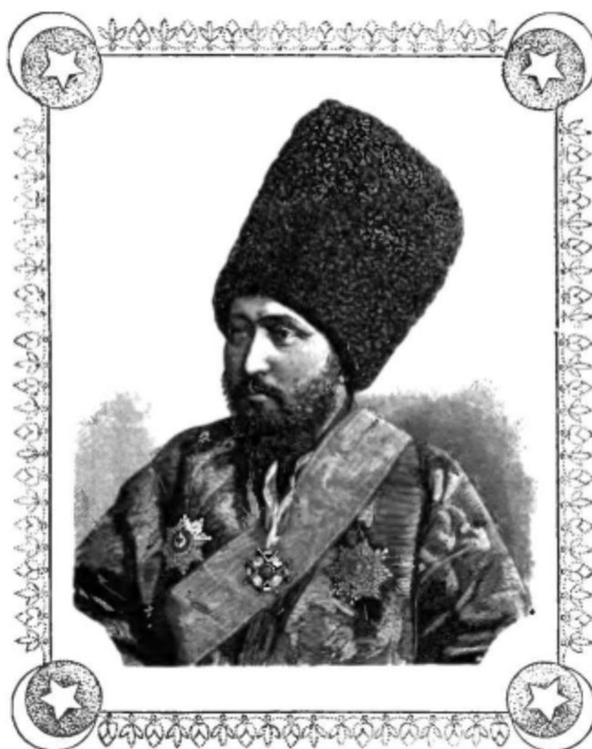
Покойный Ханъ Хивинскій Семдъ-Магометъ-Рахимъ-Ханъ.