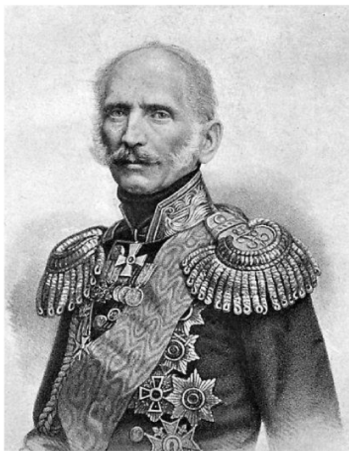
Военный министр Николай Онуфриевич Сухозанет

Подобного рода докладных записок о возможных вариантах развития и исхода англо-русского противоборства в Средней Азии зимой и ранней весной 1857 г. появилось немало. Все они были внимательно изучены, обобщены на уровне Генерального штаба, затем военного министра Н.О. Сухозанета и направлены для изучения министру иностранных дел Российской империи А.М. Горчакову. Человек мудрый и дальновидный, истинный дипломат, Александр Михайлович в ответном письме военному министру прямо отметил свое несогласие ни с военным вариантом решения проблемы, ни с нагнетанием «страстей» вокруг индийского вопроса: «Если в Англии какими-либо приготовлениями с нашей стороны укрепитя мнение, что мы стремимся уничтожить ее владычество в Индии, то при этом для нее жизненном вопросе, не только нынешнее Министерство (имеется в виду Правительство Г. Пальмерстона. — В.Ш.), но какое бы Министерство ни существовало в Англии, двинет все народные силы, употребит все дипломатические средства, чтобы заставить нас дорого заплатить за таковой замысел. Симпатии для нас существуют в Европе, но союзников мы не имеем...» [Там же, л. 76 об.].