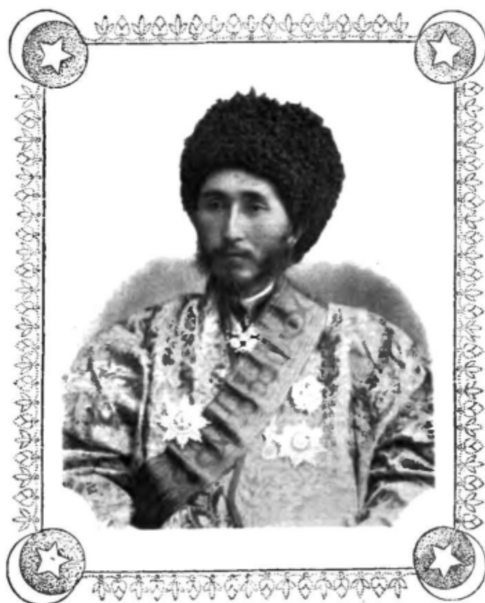
Новый Ханъ Хивинскій Сеидъ-Асфандіаръ.