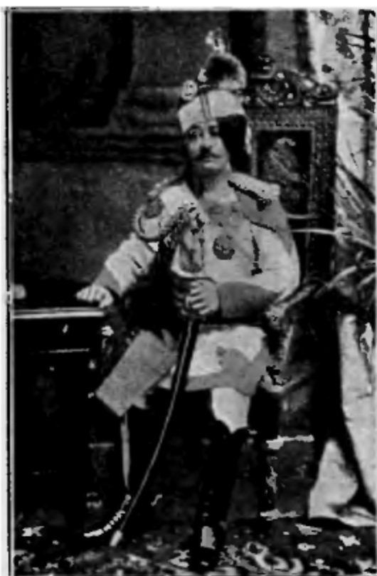
Магараджа сэръ Бертахъ Сени Идаръ.