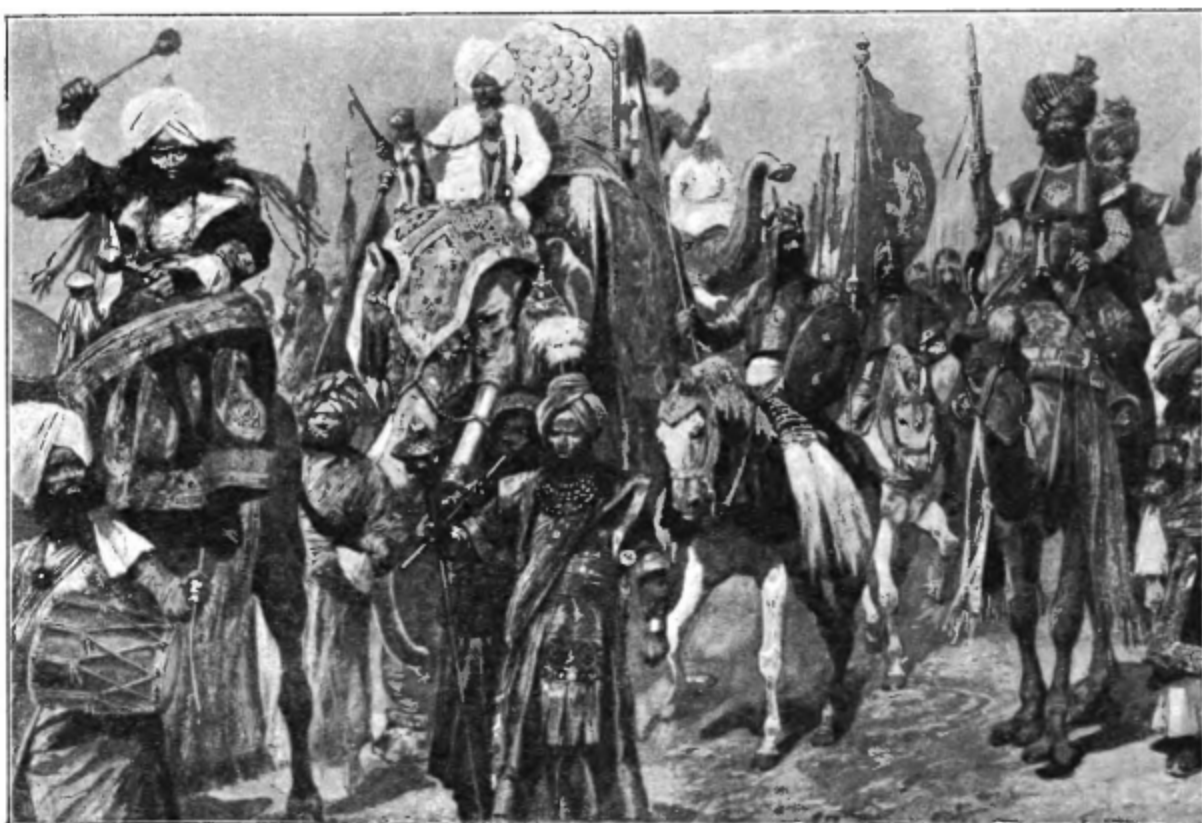
Дурбаръ—торжественное празднованіе въ Дели восшествія на престолъ императора Индіи, короля Великобританіи Эдуарда VII. Процессія магараджей—владѣтельныхъ князей Индіи. По рис. Р. К. Вудвилля авт. «Нивы».