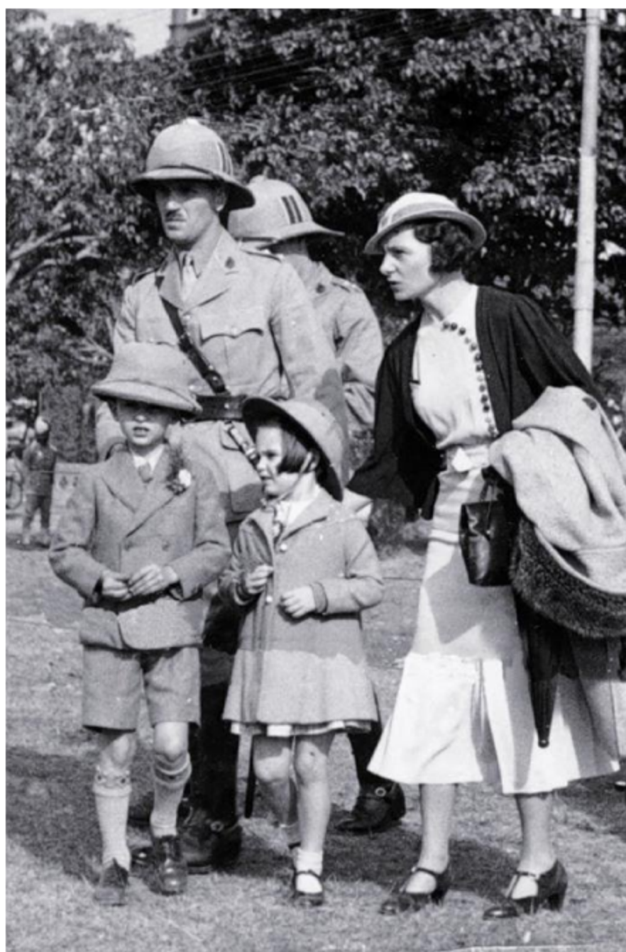
Англичане в Индии

ном и юго-восточном берегах Каспийского моря. Во что бы то ни стало мы не должны допустить столь опасного для нас соседства: появление британского флага на Каспийском море будет смертельным ударом не только нашему влиянию на Востоке, не только нашей торговле внешней, но ударом для политической самостоятельности Империи. Повторяю, что мы ни под каким видом, ни под каким предлогом не можем позволить даже приближения англичан к странам, прилежающим к Каспийскому морю» [РГВИА, ф. 846, оп. 2. д. 3, л. 10]. Отметим, что такой подход сохранялся в правительственных российских кругах и на протяжении последующих десятилетий.