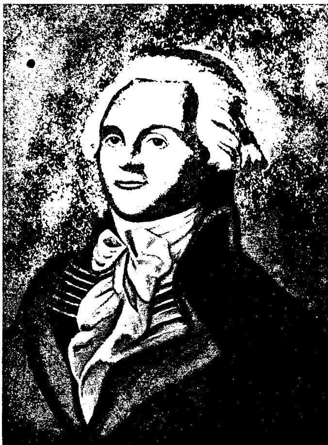
Робеспьер (по анонимному рисунку из музея Карнавале).