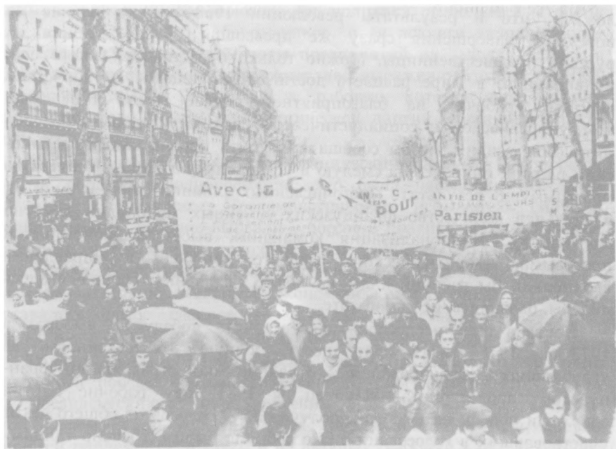
Борьба продолжается. Париж, 1972 год.

рабочие организовали марши к загородным виллам министров, чтобы предупредить их, что вся Франция может остановиться.