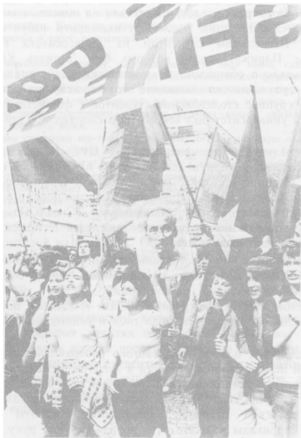
Франция солидарна с борющимися Вьетнамом.