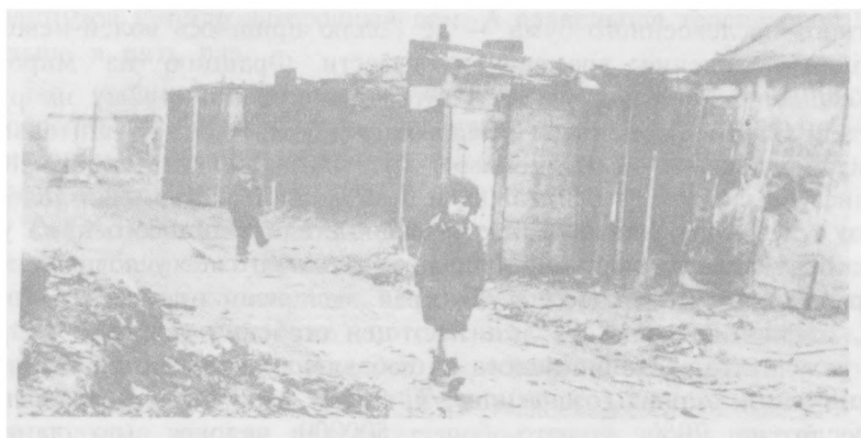
«Лучшая доля» иммиграции.

Во время бума во Франции, как грибы после дождя, повсюду вырастали гигантские автозаводы, на которых самые современные машины производились в допотопных условиях. Как и в Америке 30-х гг, производственные линии здесь охранялись частными армиями вооруженных головорезов. Труд иммигрантов применялся намеренно с тем, чтобы разъединить рабочих. На конвейерах рабочих распределяли по национальному признаку таким образом, чтобы рядом стоящие не говорили на одном языке.