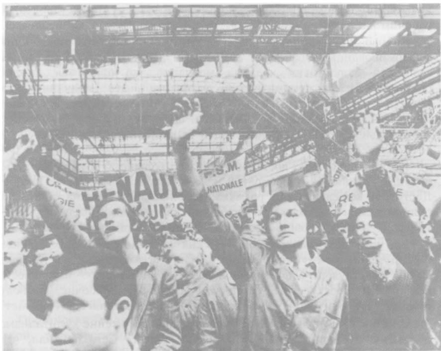
Рабочие завода «Рено» отвергают компромиссы.

царило затишье. Фондовая биржа и банк Франции бездействовали. Служащие министерства финансов избрали комитет для контроля за деятельностью вышестоящих чиновников. Но в общем последние дни мая не отличались особым оживлением и на этом фронте. «Экономист» отмечал, что «власть предпочитает созерцать творящиеся беспорядки со стойким молчанием», а «предпринимательские организации так же безмолвны, как и их члены!»