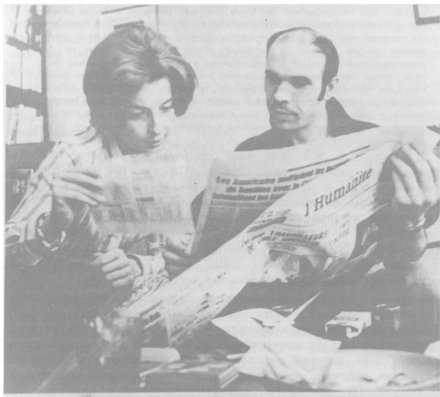
Газета французских коммунистов — «рулевой» рабочего движения.

и Троцким их требований привели массы к выводу о том, что только большевики могли обеспечить успешное завершение революции.