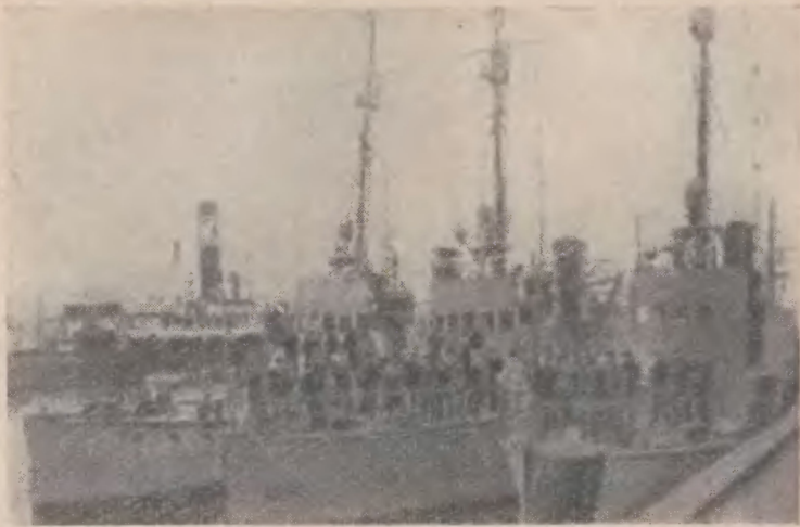
Торпедные катера под красным флагом в гамбургском порту