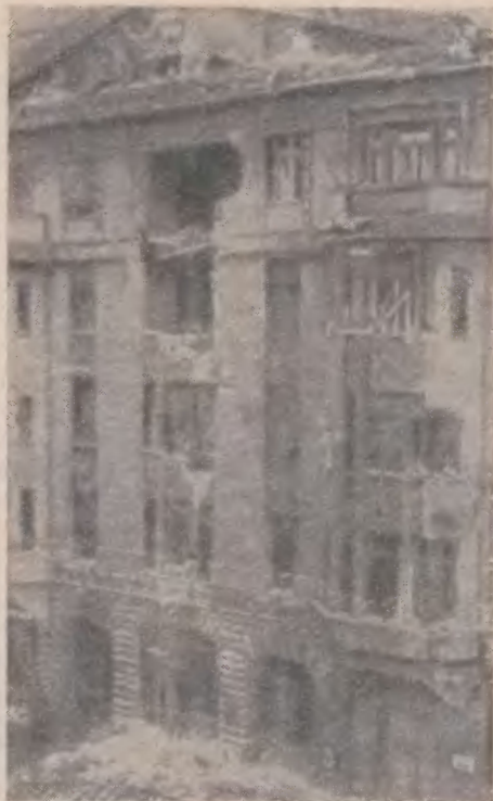
Здание «Vorwärts» после обстрела его правительственными войсками

хотной дивизии и батальона фон Редера 1 . Наконец-то контрреволюционным заговорщикам удалось осуществить то, к чему они стремились: Берлин был в руках вооруженных карателей.