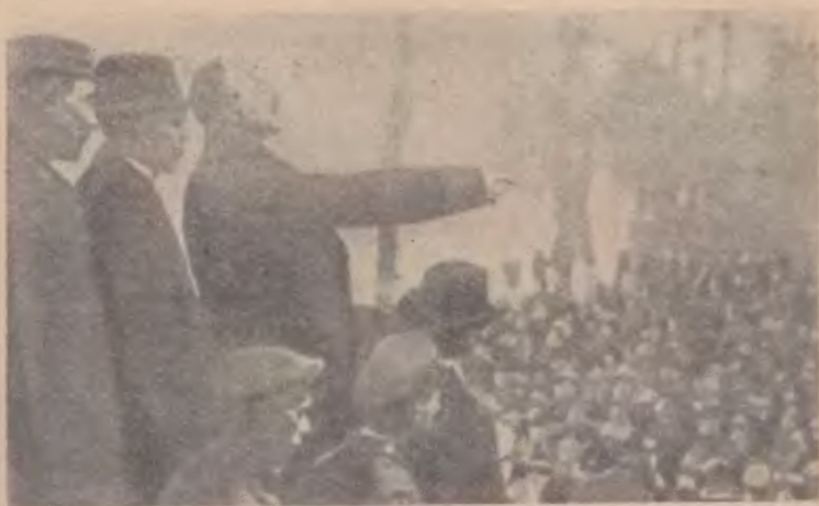
Выступление К. Либкнехта в Берлине в январские дни 1919 года