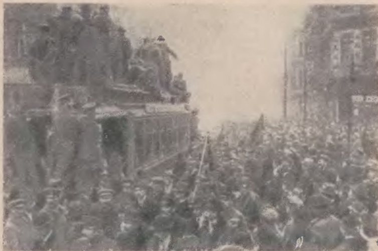
Митинг на площади Бель-Альянс в Берлине 9 ноября 1918 года

Эберт с большой готовностью принял титул рейхсканцлера 1 и тотчас выпустил прокламацию к населению, в которой призывал народ покинуть улицы и позаботиться о «спокойствии и порядке», а также обращение к чиновникам с просьбой остаться на местах. Но сам Эберт не мог не видеть, что титул, о котором он давно мечтал, не так уж много значил в момент революционного взрыва. Революция разворачивалась под знаком свержения старых властей и титулов. Доверием народа пользовались лишь возникавшие повсюду Советы.