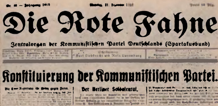
Газета «Die Rote Fahne» от 31 декабря 1918 года с сообщением об образовании Коммунистической партии Германии

ноты власти в центре и на местах в руки рабочих и солдатских Советов; конфискации собственности и доходов династий; аннулирования государственных долгов и военных займов; отчуждения банков, шахт, крупных заводов, торговых и транспортных предприятий, а также крупных землевладений; создания революционного трибунала для осуждения главных виновников войны, в том числе Го-генцоллернов, Людендорфа, Гинденбурга и др., а также контрреволюционных заговорщиков; немедленного разоружения полиции, офицеров и всех представителей господствующих классов; вооружения пролетариата, создания рабочей милиции и ее активного ядра — Красной гвардии; немедленного установления связей с братскими зарубежными партиями для развития международной революции и т. п. 1