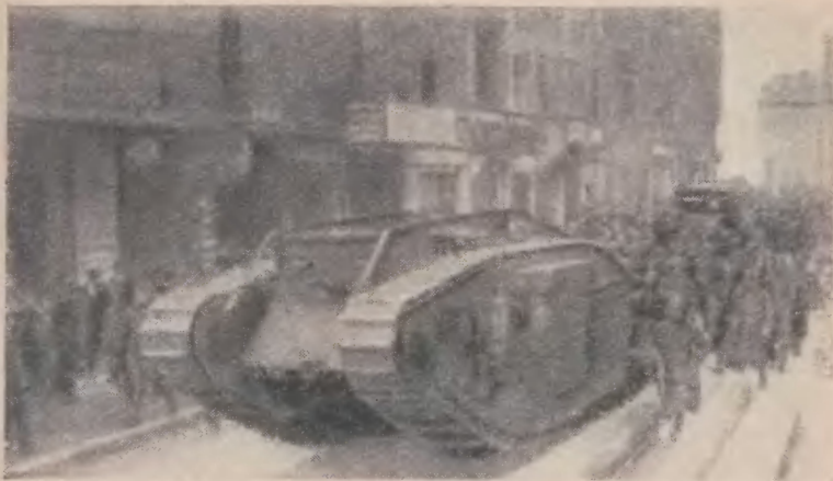
Танк на улицах Берлина во время мартовских боев 1919 года

руководством майора Найветта, посетившая в конце марта Силезию и Берлин, в донесении от 30 марта признавала: «Массы дошли до грани голода и болезней на почве недоедания. Доверие трудящихся классов к правительству Эберта подорвано. Чиновники и образованные классы бес- силны отвратить развал и гибель социального строя, которые происходят на их глазах...» 1 Выступая в Совете четырех в Париже, Ллойд-Джордж указал на серьезность внутреннего положения в Германии и сослался на донесение английского агента, который сообщил, что правительство и Национальное собрание «потеряли доверие страны», забастовки и волнения носят все более «ярко выраженный политический, то есть антишейдемановский характер», идея Советов распространяется все шире 2 .