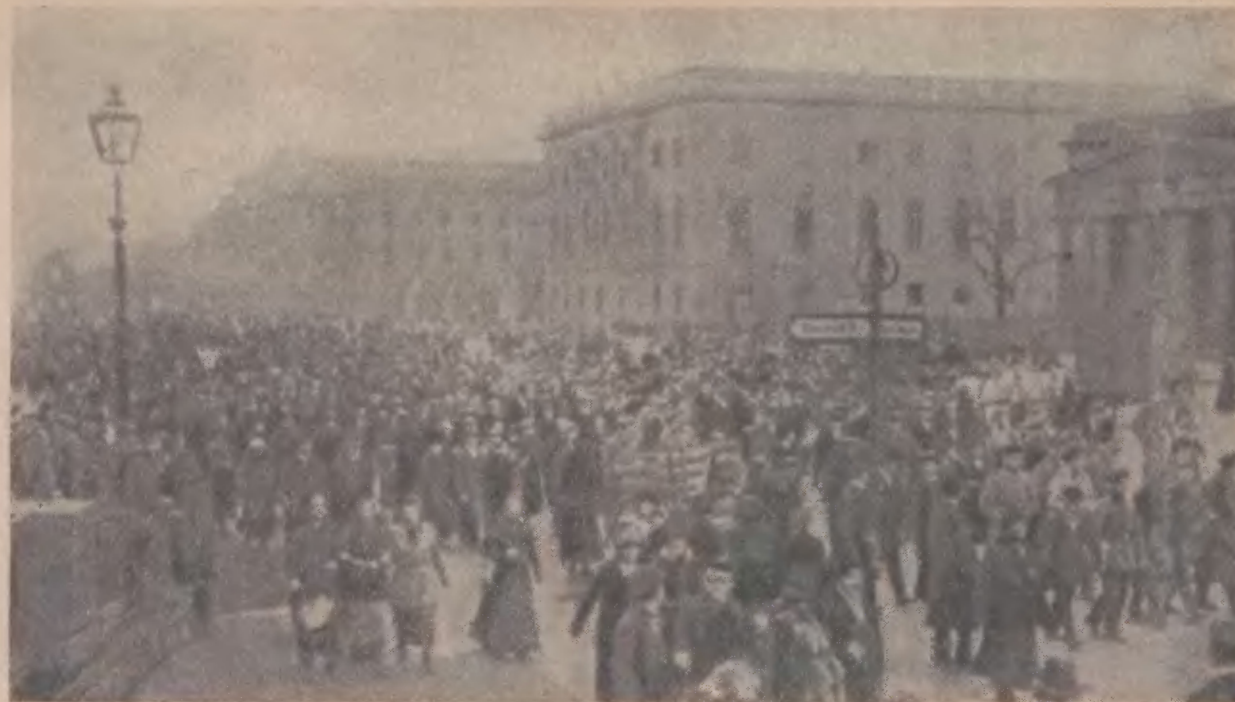
Демонстрация в Берлине на Унтер-ден-Линден 9 ноября 1918 года