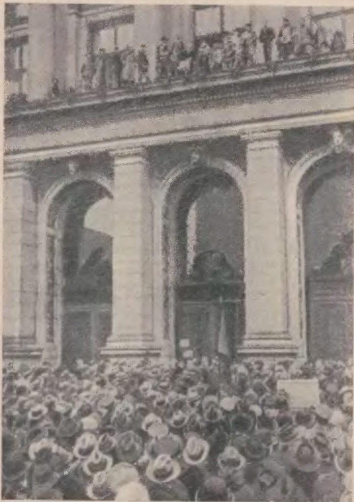
Демонстрация трудящихся перед зданием, где заседал Всегерманский съезд рабочих и солдатских Советов