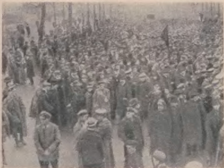
Демонстрация рабочих и солдат в Берлине 5 января 1919 года

берлинским рабочим с призывом выйти на улицы. «Дело идет не о личности Эйхгорна, — говорилось в нем, — а о том, что вас хотят насильственным образом лишить последних оставшихся завоеваний революции... Удар против берлинского полицей-президента — это удар против всего германского пролетариата, против всей германской революции» 1 .