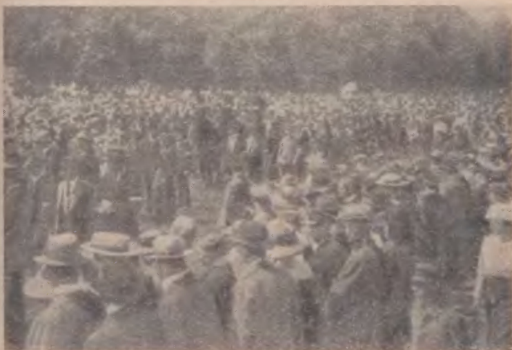
Похороны Розы Люксембург 13 июня 1919 года