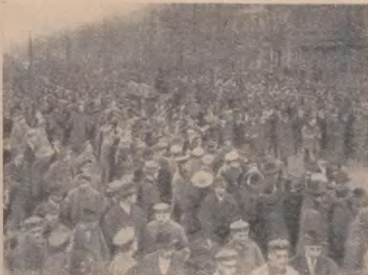
Похороны Карла Либкнехта 25 января 1919 года