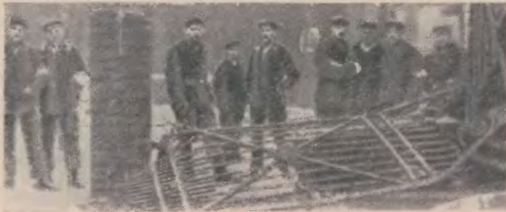
Революционные матросы в Вильгельмстафеле у разбитых ворот тюрьмы

благодарны матросам и солдатам, мужественно сражавшимся на улицах Гамбурга... А вам, русские братья, которые первыми призвали трюмовым голосом народы к свободе, которые с огромным мужеством преодолели самые страшные трудности и лишения, когда-либо выпадавшие на долю революции, вам мы радостно кричим: мы идем. мы придем!.. Это — начало германской революции, мировой