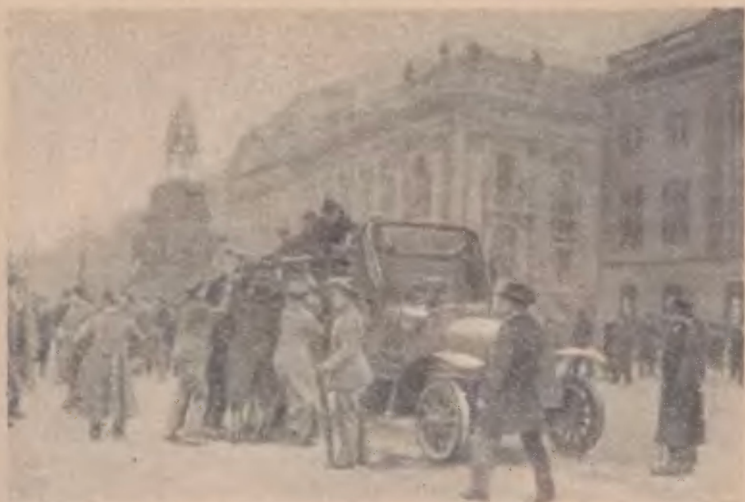
Революционные рабочие и солдаты на улицах Берлина в дни январских боев 1919 года

контрреволюционные силы, а «добровольческие корпуса» сосредоточить в районе Гросс-Лихтерфельде и в благоприятный момент использовать для нанесения решающего удара 1 .