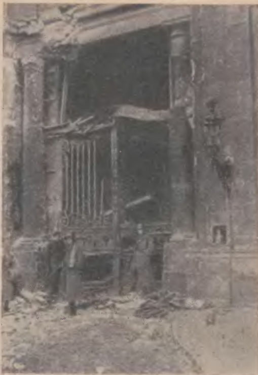
Ворота дворца после артиллерийского обстрела правительственными войсками 24 декабря 1918 года

ная морская дивизия была включена в состав «республиканской охраны», обязавшись оставить дворец и не участвовать в будущем в выступлениях против правительства.