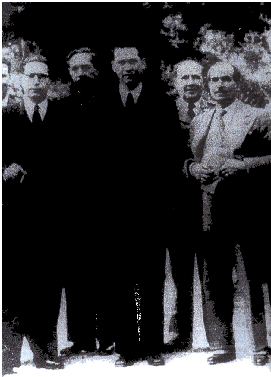
Х.Буш (в центре) в окружении ближайших сподвижников. Слева – Э.Бальдивьесо, справа – В.Гевара Арсе