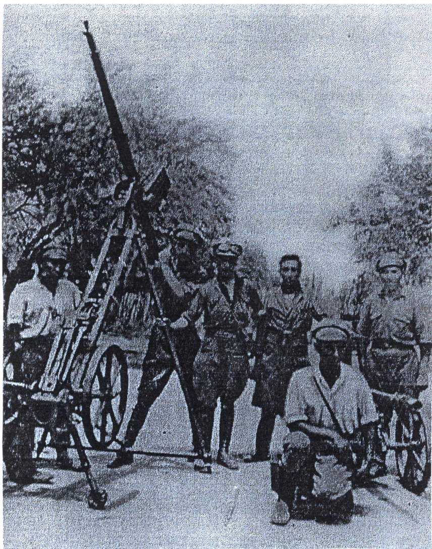
Боливийская часть противоздушной обороны на фронте в Чако.