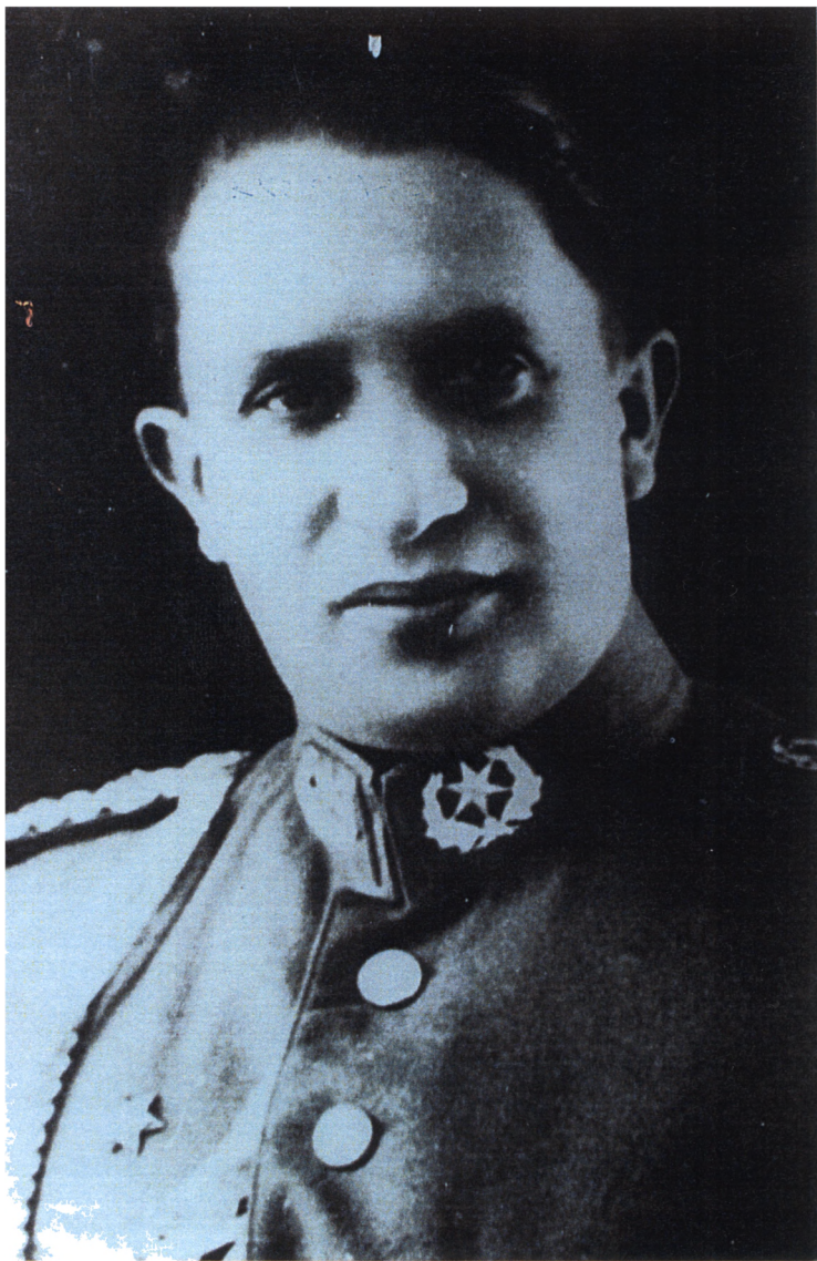
Давид Торо.