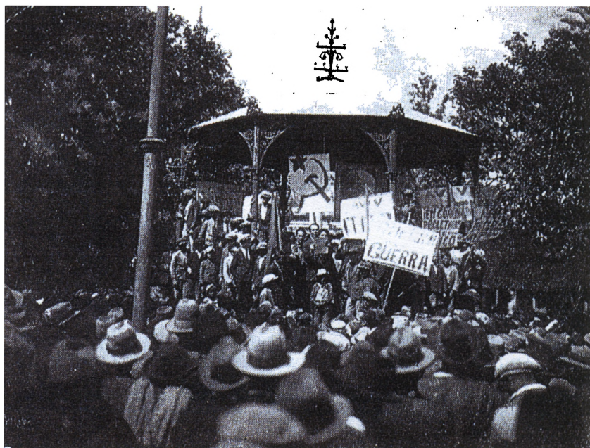
Антивоенный митинг в Кочабамбе. 1 мая 1932 г.