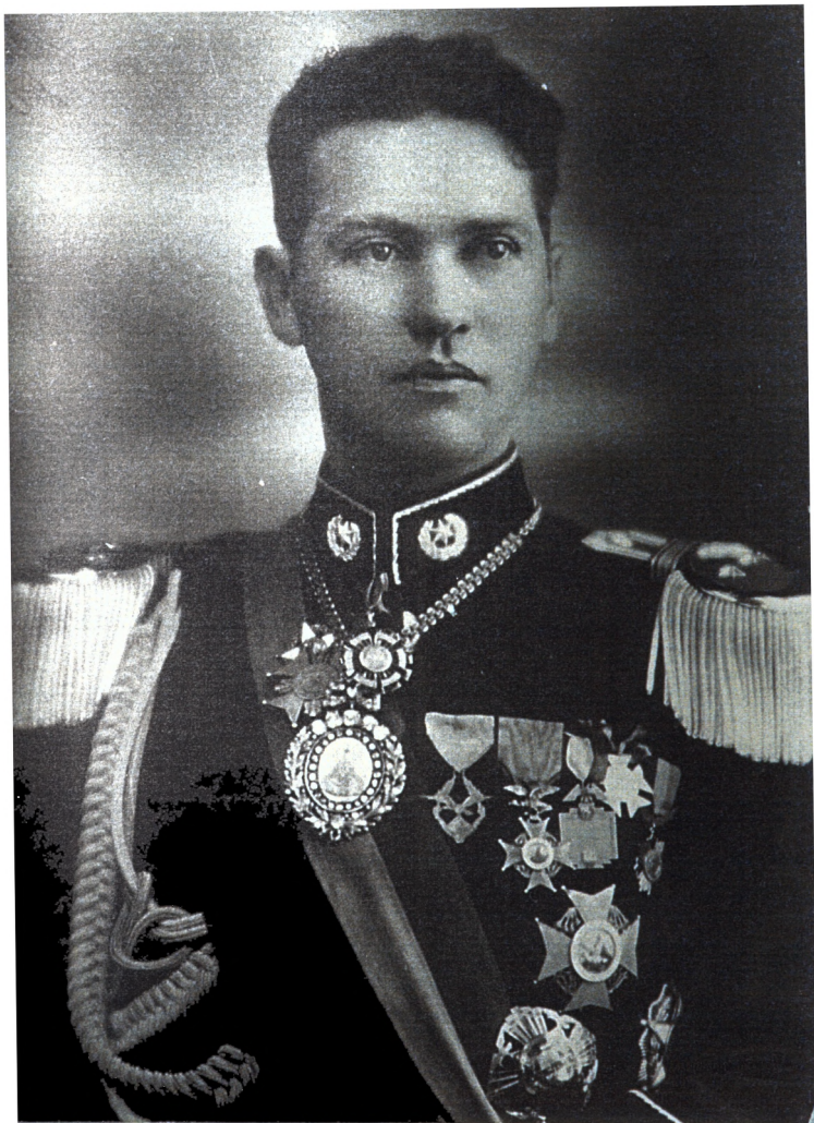
Президент Херман Буш.