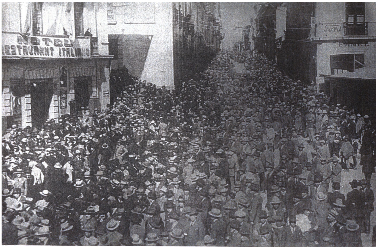
Патриотическая демонстрация в Ла-Пасе, 1932 г. Начало войны в Чако.