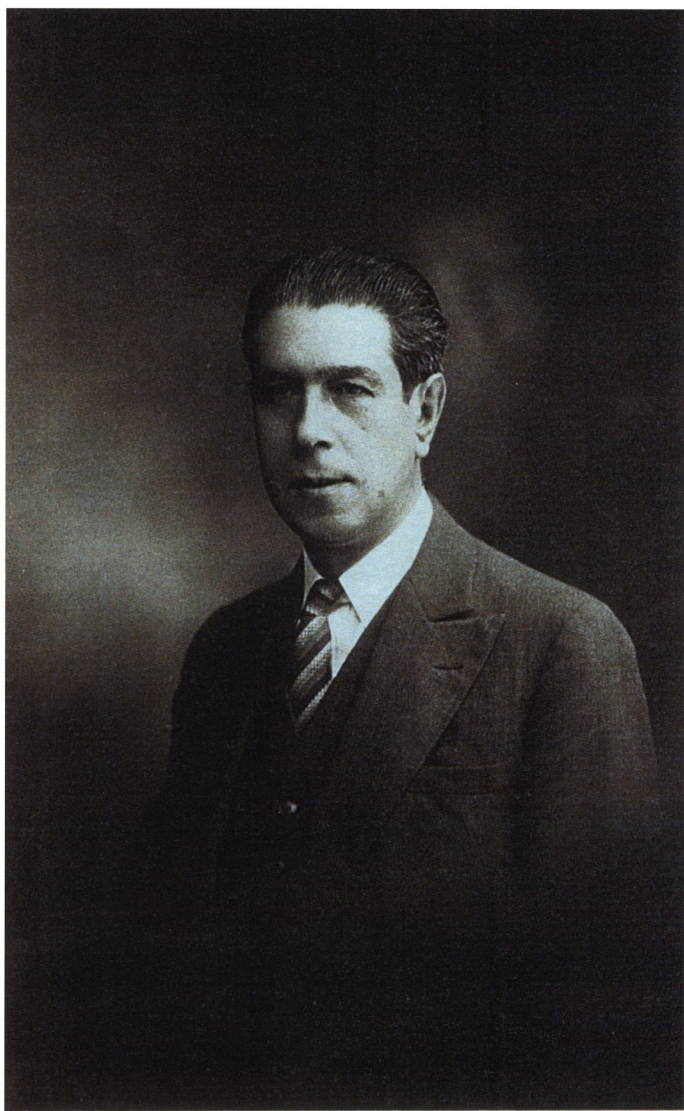
Альсидес Аргедас. 20-е годы.