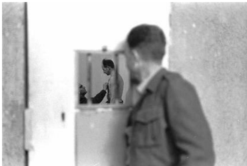
Надзиратель в тюрьме Рамле, контролирует заключенного Эйхмана

ЭЙХМАН. Будапешт постепенно превращался во фронтовой город. О работе, тем более об эвакуации евреев нечего было и думать. Надо было готовиться к военным действиям, о чем я мечтал уже долгие годы. Чем ближе подходила линия фронта, чем сильнее становился обстрел, тем мне было спокойней и радостней, я был буквально окрылен. Своих людей я давно отпустил. Со мной остался только водитель, я уже ничего не делал, только следил за сводками и ждал с нетерпением, когда меня позовут к военному коменданту. А вместо этого появился... В общем, мне снова не повезло. Пока я все это переварил, наступило 24 декабря. После полудня мне пришлось убраться с последней машины из Будапешта. Таков был приказ.