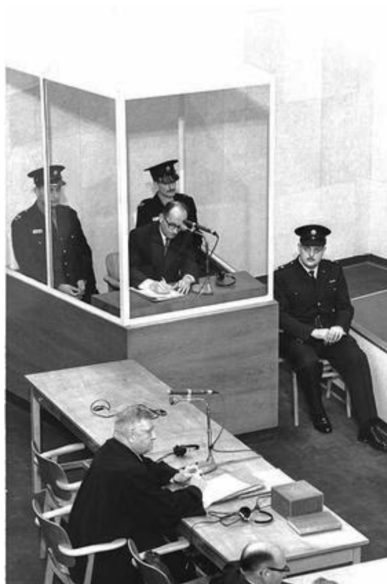
Иерусалим. Эйхман в суде

ЛЕСС. Можете сказать мне точно, с какого по какое время вы были в Венгрии?