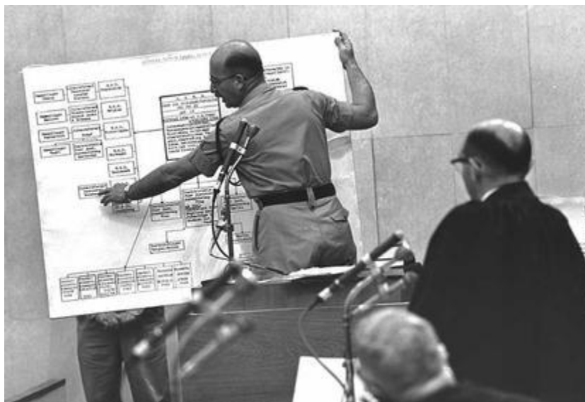
Следователь капитан израильской полиции Авнер Лесс

В первый раз я увидел Адольфа Эйхмана в 16 часов 45 минут 29 мая 1960 года.