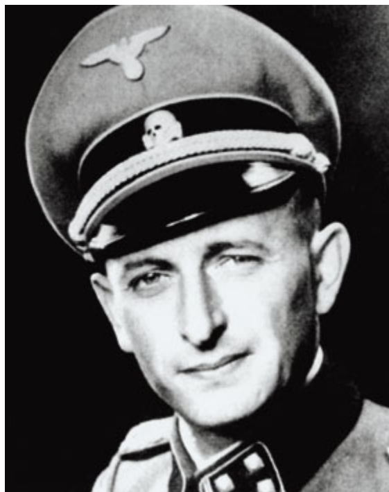
Нацистский военный преступник Адольф Эйхман

ЛЕТОПИСЕЦ. Гитлер не раз заявлял публично, что "с еврейством будет покончено". Восьмого ноября 1942 г. в мюнхенской пивной "Лёвенброй" он цинично шутил перед "старыми бойцами" своей партии: