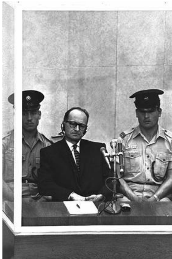
Эйхман и израильские полицейские

ЛЕСС. Если какие-либо ведомства в оккупированных областях обращались к вашим тамошним представителям с запросами о судьбе и месте нахождения депортированных евреев - вы санкционировали ответ или отказывались отвечать?