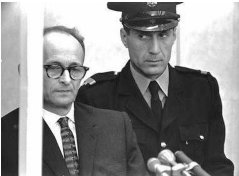
Эйхман и израильский охранник в зале суда

ХОФШТЕТТЕР. Сегодня 6 июня 1960 г. Сейчас 2 часа 10 минут. Вам известно, кто я?