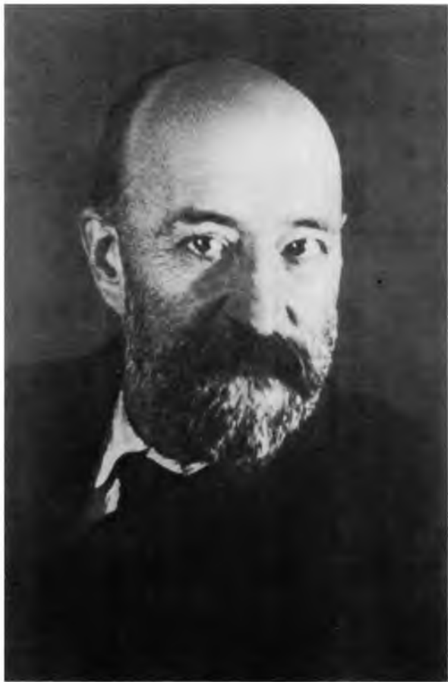
АЛЕКСАНДР ЕВГЕНЬЕВИЧ ПРЕСНЯКОВ (1870—1929 гг.)