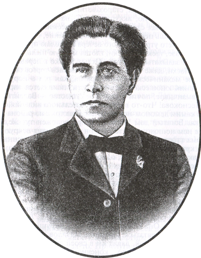
КАРАБЧЕВСКИЙ НИКОЛАЙ ПЛАТОНОВИЧ