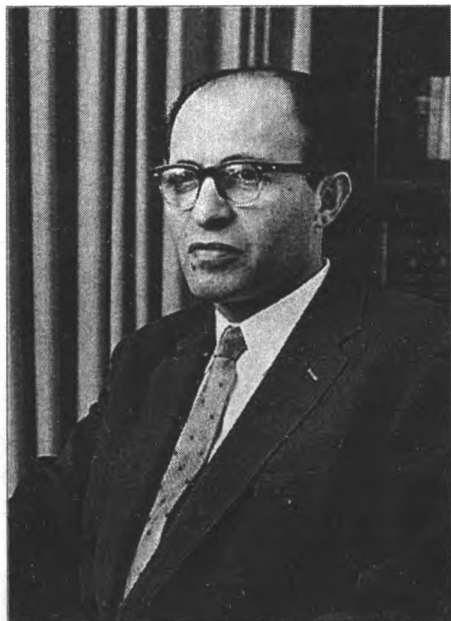
М. Бегин. 1959 г. 13526, фото Cohen Fritz, D705-057, 11/11/1959