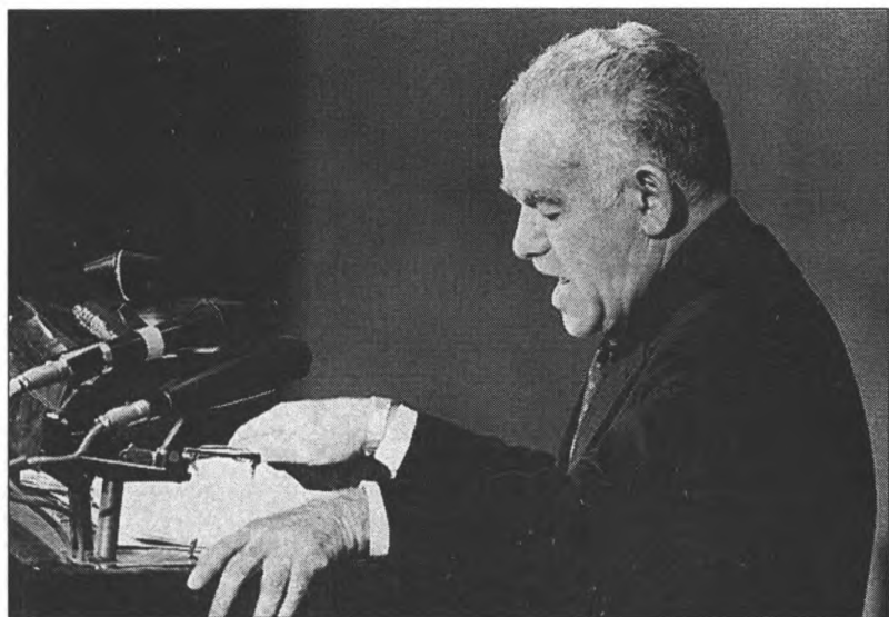
Выступление И. Шамира в Кнессете. 1986 г. 6134, фото Saar Yaacov, D44-109, 20/10/1986