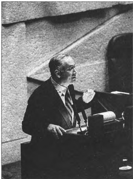
Бывший премьер-министр Израиля и вновь избранный лидер партии Ликуд Б. Нетаньяху. 1993 г. 6318, фото Ohayon Avi, D46-015, 21/09/1993