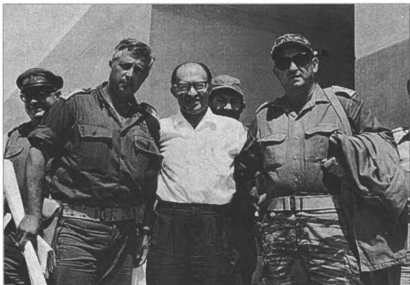
Новый премьер-министр М. Бегин с будущим главой правительства Израиля А. Шароном. 1977 г. 13518, D705-051, 07/06/1977