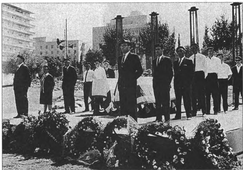
Церемония перезахоронения Вл. Жаботинского в Иерусалиме. 1967 г. 19578, D740-084, фото Ilan Bruner, 11/08/1967