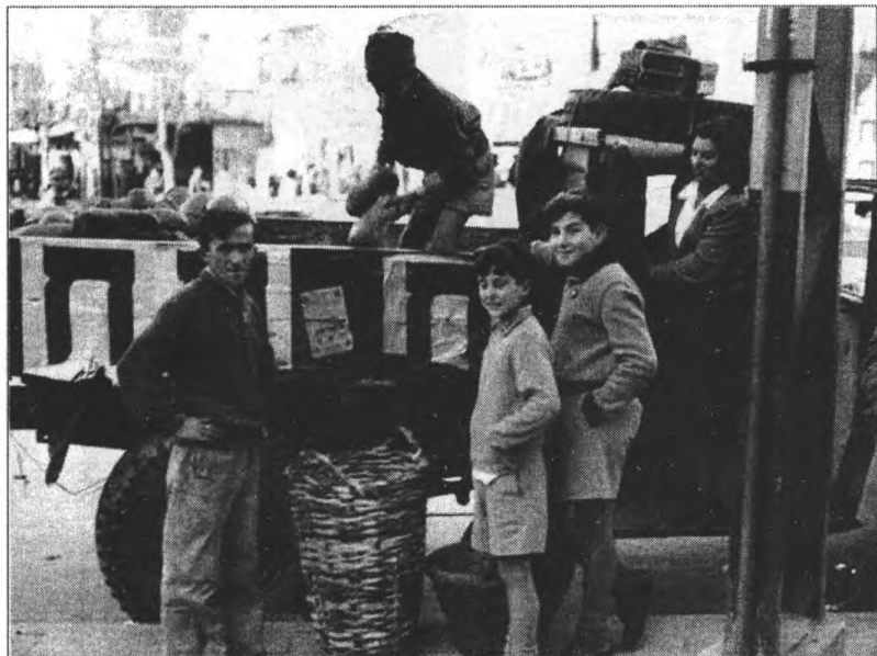
Раздача хлеба населению активистами партии накануне съезда Херута. 1949 г. 82627, фото Mendelson Hugo, D715-032, 22/01/1949