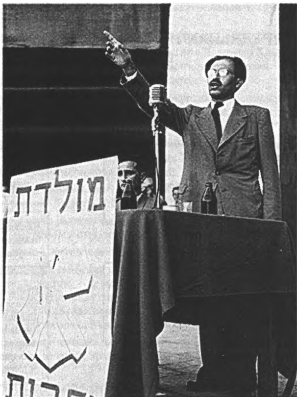
Речь М. Бегина на первом съезде партии Херут. 1948 г. 1325, фото Pinn Hans, D705-056, 14/08/1948