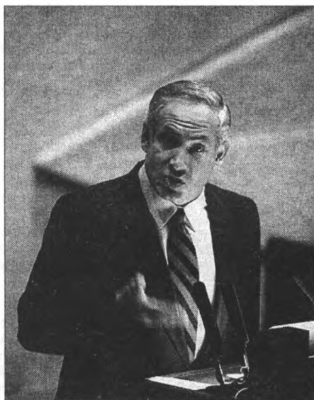
Выступление Б. Нетаньяху в Кнессете. 1993 г. 6319, фото Ohayon Avi, D46-016, 21/09/1993