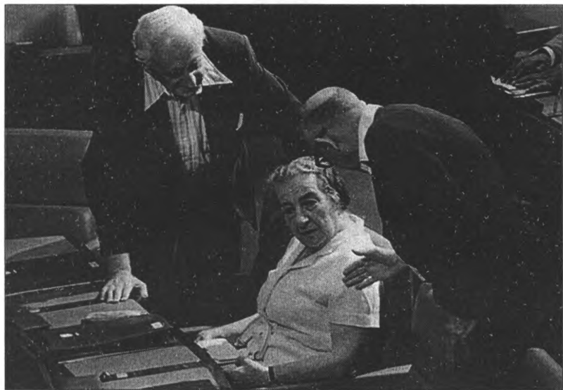
Г. Меир и М. Бегин в Кнессете. 5903, фото Saar Yaacov, D44-024, 20/03/1989