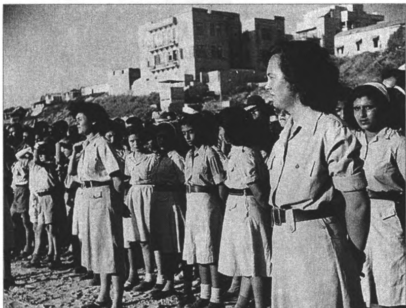
Девушки Херута у мемориала памяти расстрела Альталены. 1949 г. 85723, D745-002, 01/06/1949