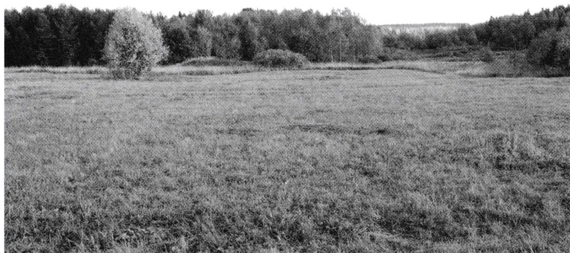
Просторы бывшей деревни Уросово

Черд. Коми урӧс – ‘слабый, хилый’, по суеверным представлениям, ‘испорченный колдунами’. Возможно, таким представлялся местным жителям первопоселенец» 39 . Кроме того, она анализировала и фамилию, образованную от того же корня: «УРАСОВ, иногда в дореволюционных документах Уросов, от Урӧс, нарицательное урӧс ‘болезненный, хилый, испорченный колдунами’. В чувашском языке Урас – личное имя, которое было известно также северным удмуртам. В 1623/24 гг. в погосте Искор жил Тимошка Еремеев сын Урасов» 40 .