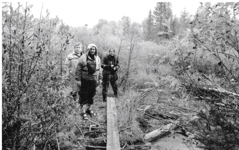
По дороге в заброшенную деревню Симаново

кого-л.'. 'двойник человека' (ССКЗД); ures 'порча' (Диал. сл.). В.И. Лыткин связывает это слово с удм. 'плохой', 'дурной', 'худой'... (Ист. вок., 211)» 41 . Название «Урос» прямо указывает на сакральный, «колдовской» характер места, в котором было расположено родановское святилище.