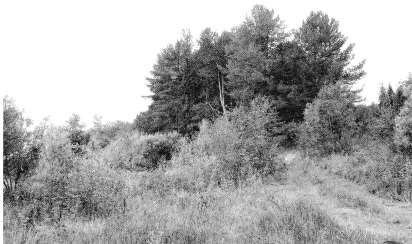
Мыс в Покче