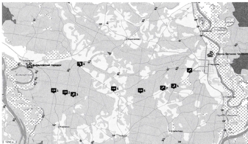
Рис. 1. Реальный маршрут автопробега Кольчуг (город Анфаловский) – Чердынь, пройденного 25 июля 2013 г. Значками со стрелками отмечены перекрёстки и дорожные развилки, в которых происходило определение GPS координат

июля 2013 г. 23 Значками со стрелками отмечены перекрёстки и дорожные развилки, в которых происходило определение GPS координат. Точка 4 фиксирует вынужденный отворот к пос. Лесоруб, поскольку между точками 3 и 5 не было сколь-нибудь проходимой автодороги, а просеки заросли так, что нельзя было проехать даже на автомобиле УАЗ. На рис.2 показан реконструированный на основе результатов автопробега маршрут рати кн. Ф. Пёстрого в 1472 г.