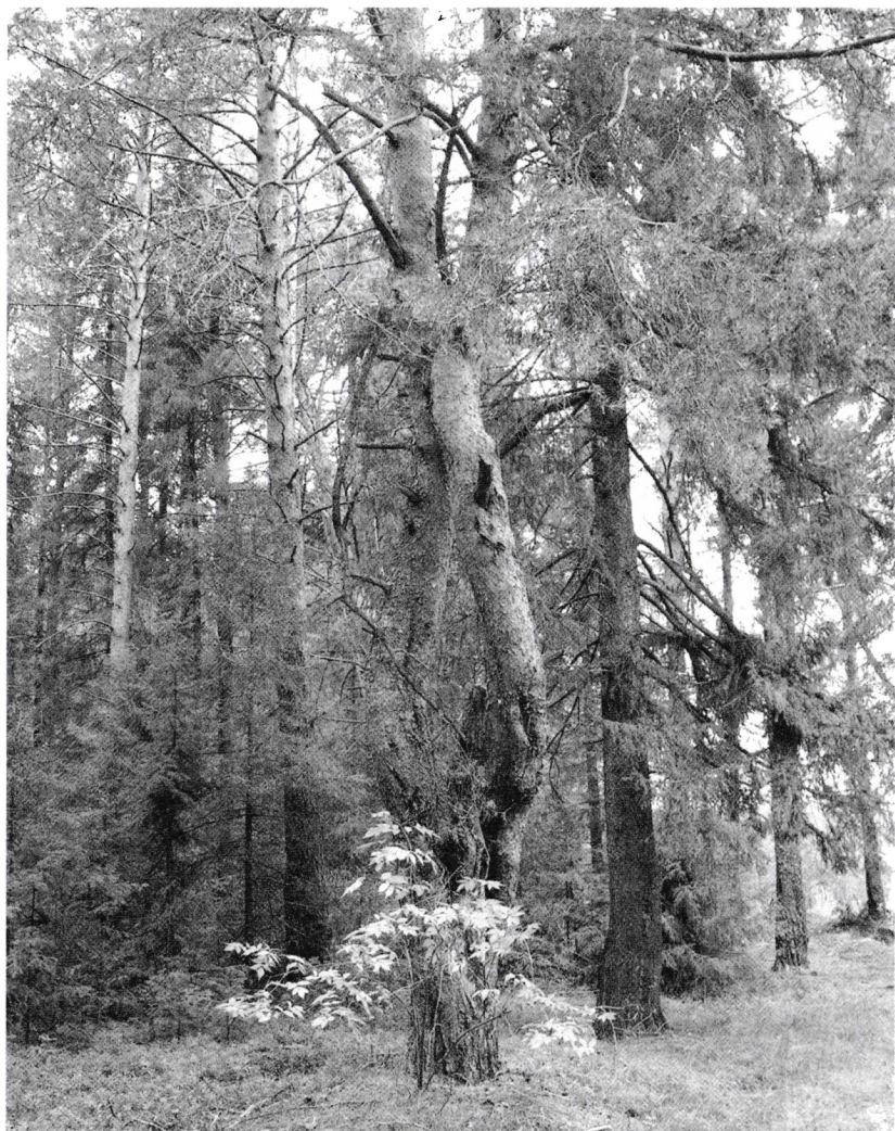
Сосна в Покче