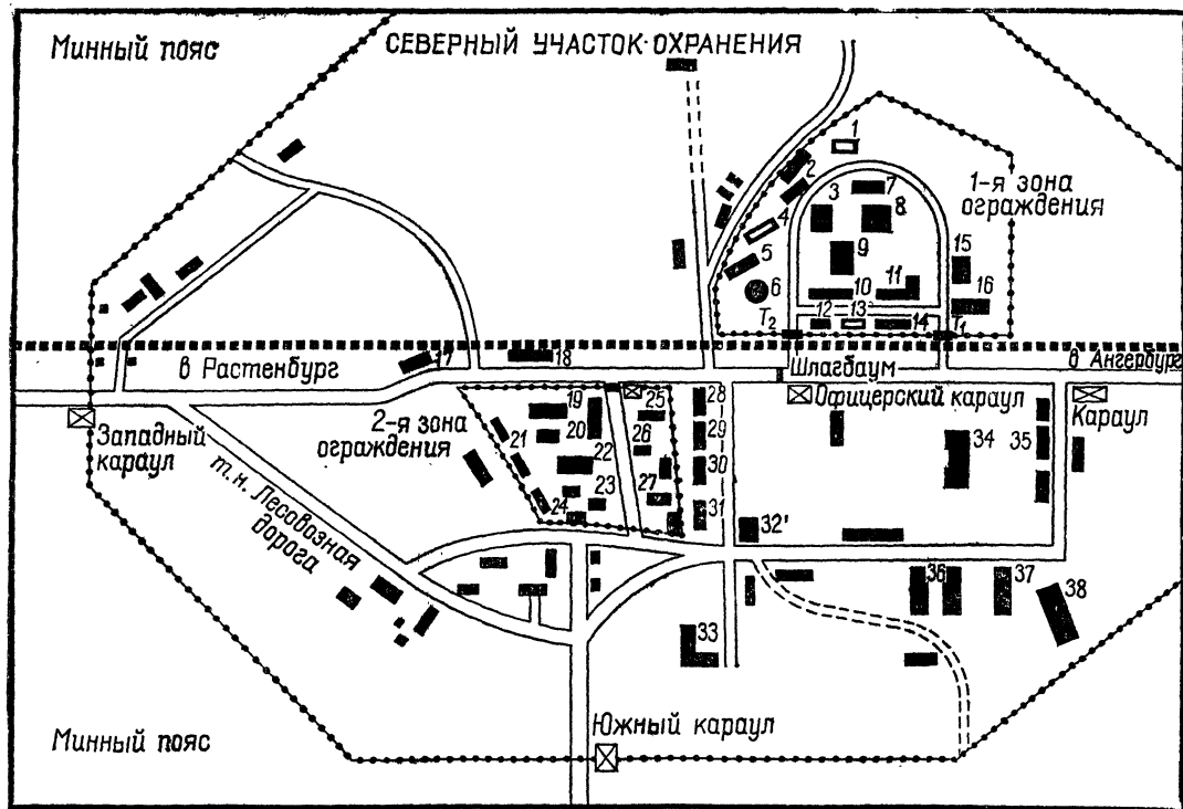
Рис. 1. План «Волчьего логова» — ставки Гитлера в Растенбурге