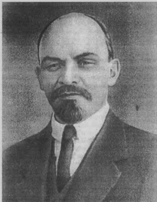
Ленин (Ульянов) В. И.