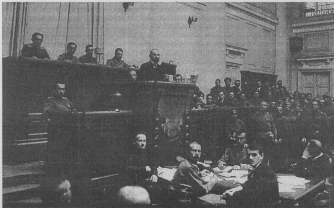
Выступление министра продовольствия Пошехонова на фронтовом съезде.