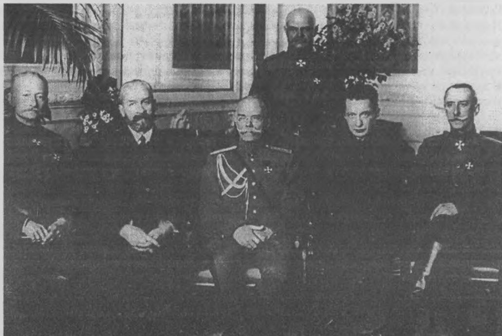
Слева направо (сидят) Брусилов, Львов, Алексеев, Керенский