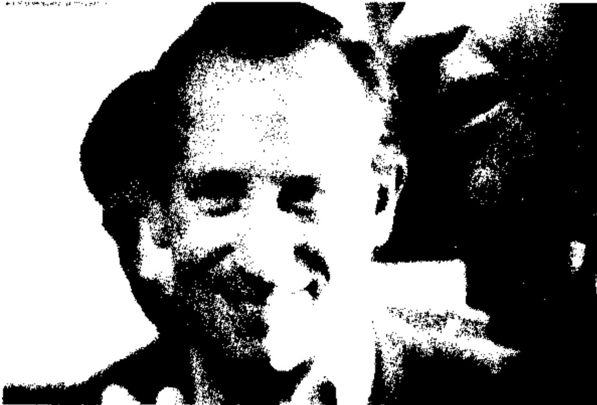
Исполняющий обязанности резидента КГБ в Лондоне Олег Гордиевский