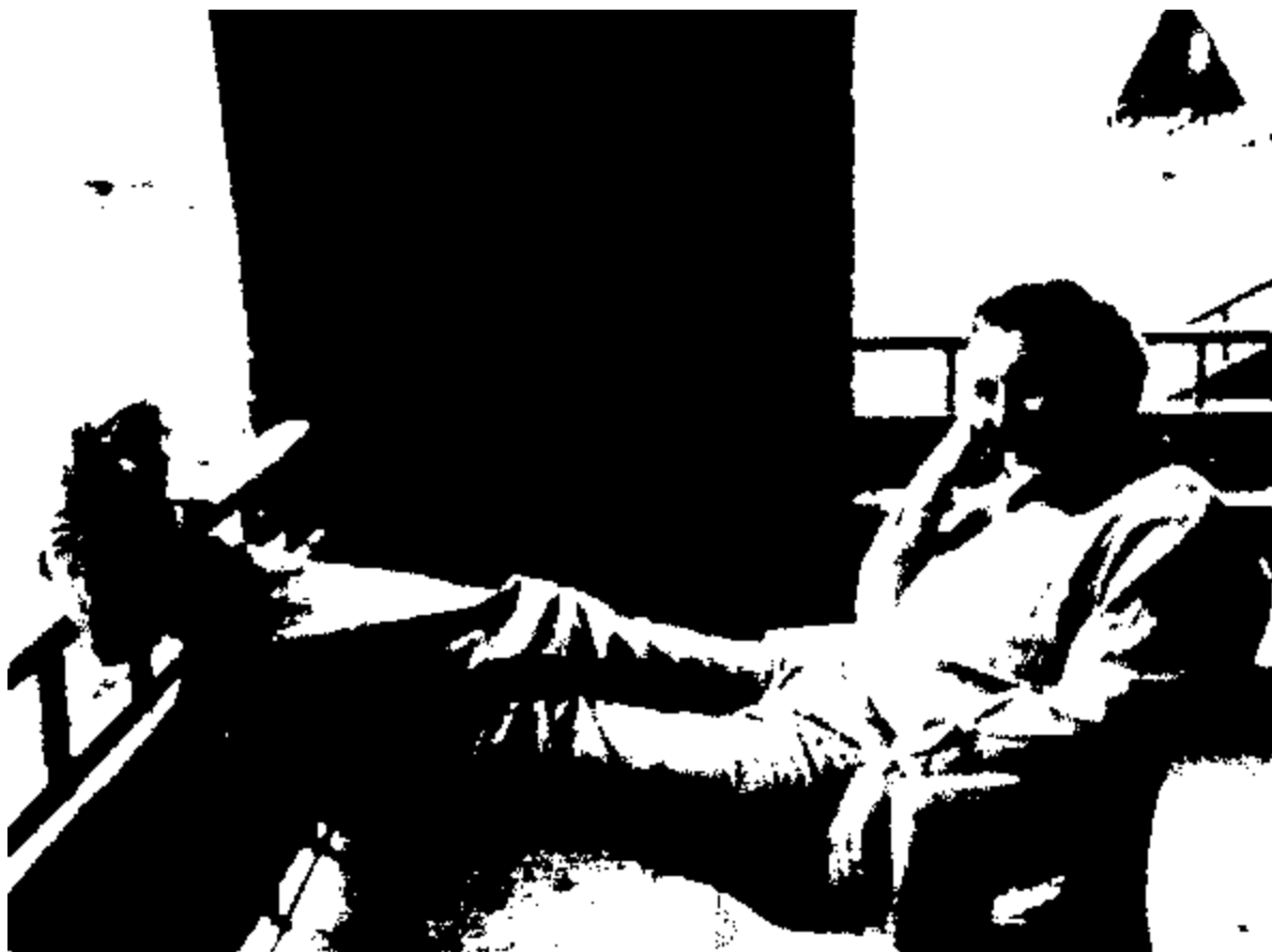
Эдвард Ли Говард на даче в поселке Жуковка