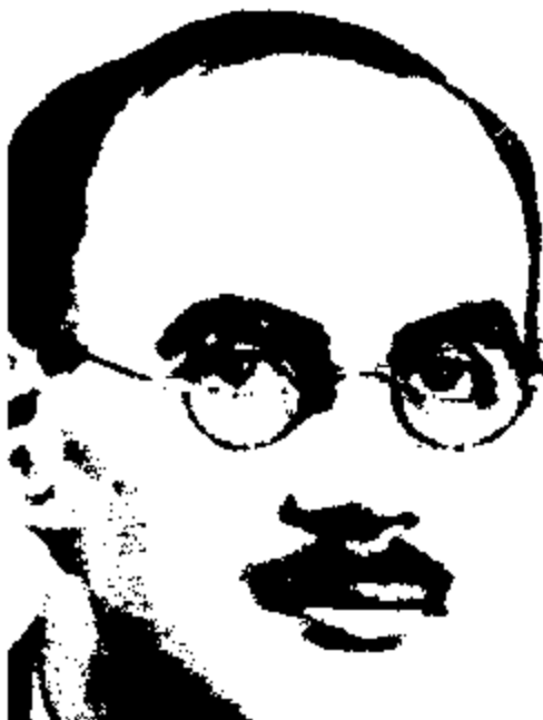
Доктор Аллан Нан Мэй, жертва предательства Гузенко