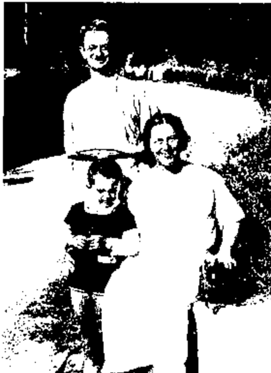
Один из руководителей советской разведки М.А. Трилиссер с семьей