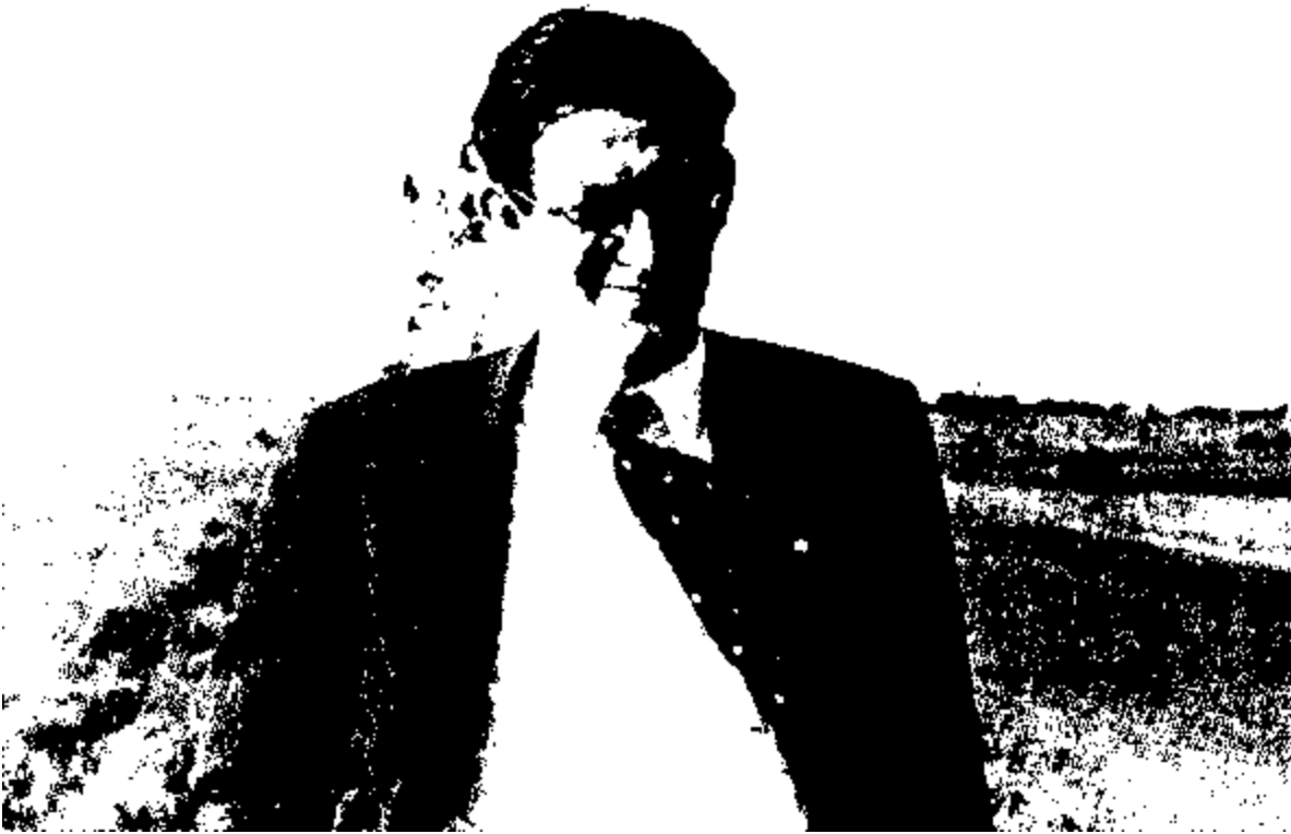
Джеймс Энглтон — руководитель внешней контрразведки ЦРУ, легендарный охотник за «кротами»