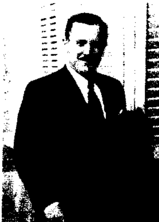
Резидент НКВД в Испании Александр Орлов (Барселона. 1938 г.)