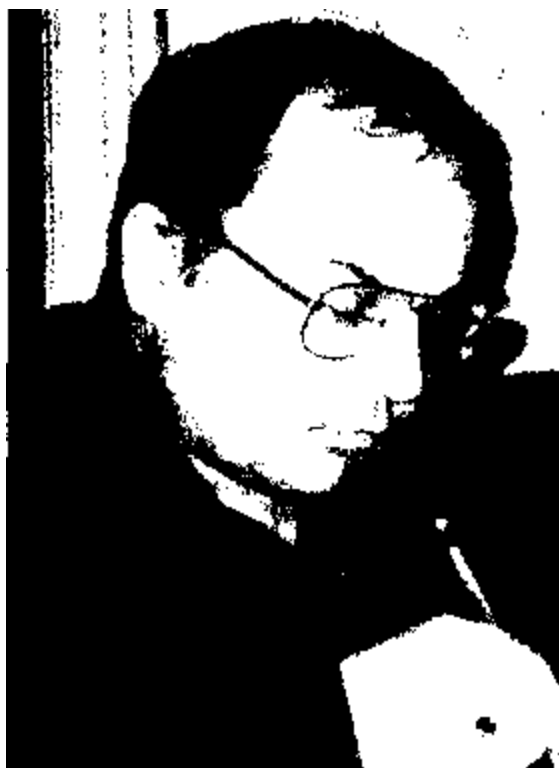
Офицер женевской резидентуры ГРУ Владимир Богданович Резун (Под псевдонимом Виктор Суворов написал книги «Аквариум» и «Ледокол»)