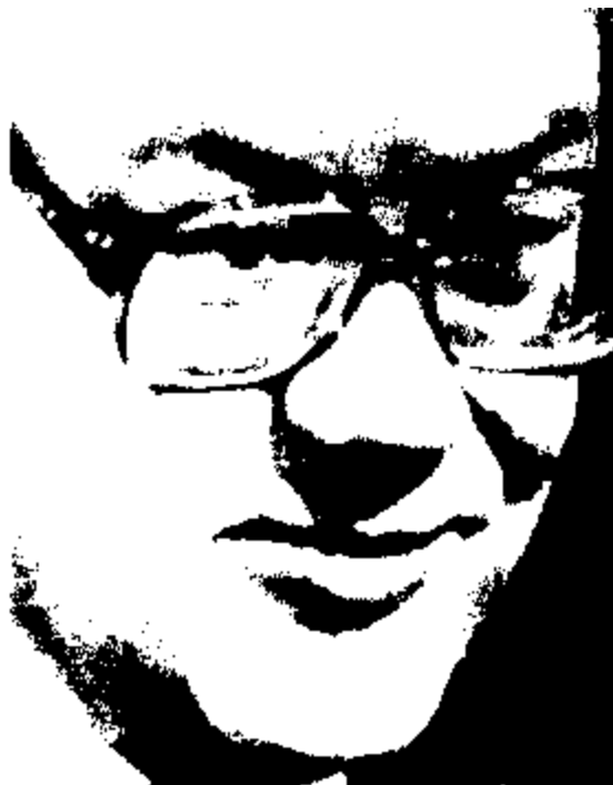
Аркадий Шевченко — заместитель Генерального секретаря ООН по делам Совета Безопасности