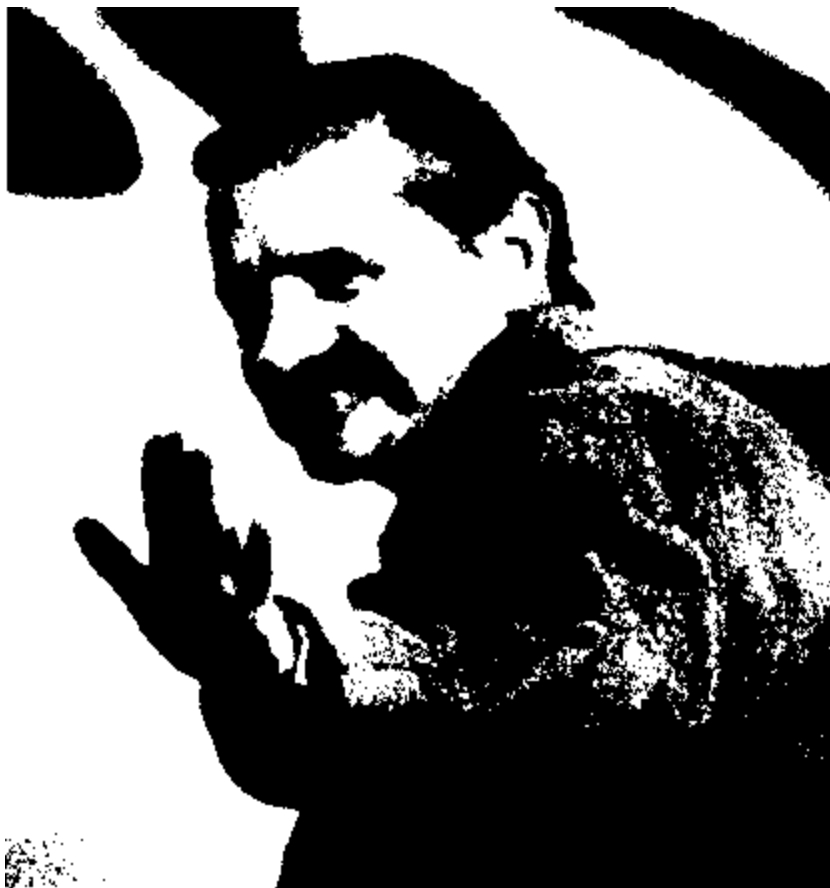
После «похищения» Виталий Юрченко отбывает назад в СССР. 1985 год