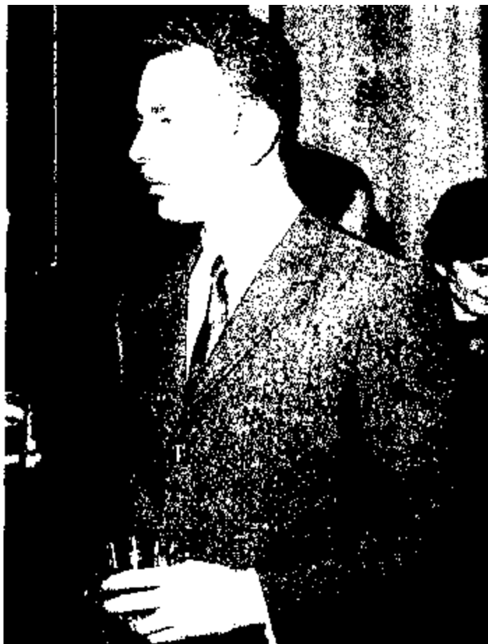
Олег Лялин. После его предательства из Лондона выслали 145 советских дипломатов