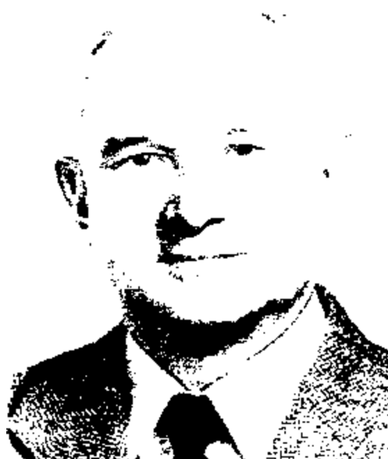
Генерал-лейтенант ГРУ, Дмитрий Поляков с 1961 по 1965 год работал на американскую разведку