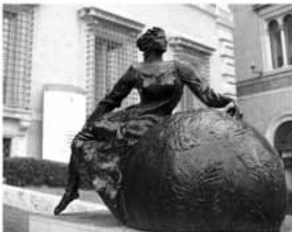
Европа. Изображена прекрасная молодая женщина, восседающая на земном шаре