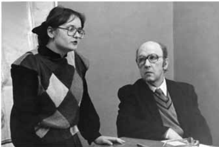
На экзамене, 1983 г. *)