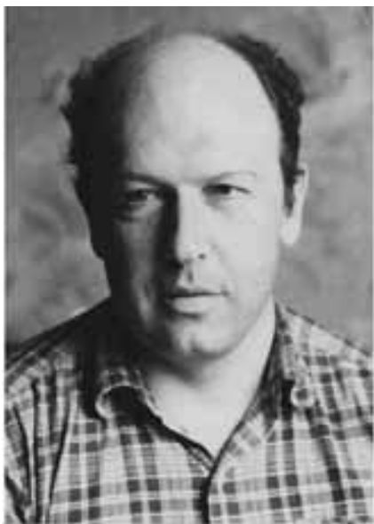
Г. С. Кнабе, 1964 год *)