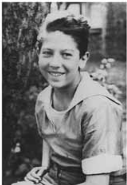
Детство на Арбате *)