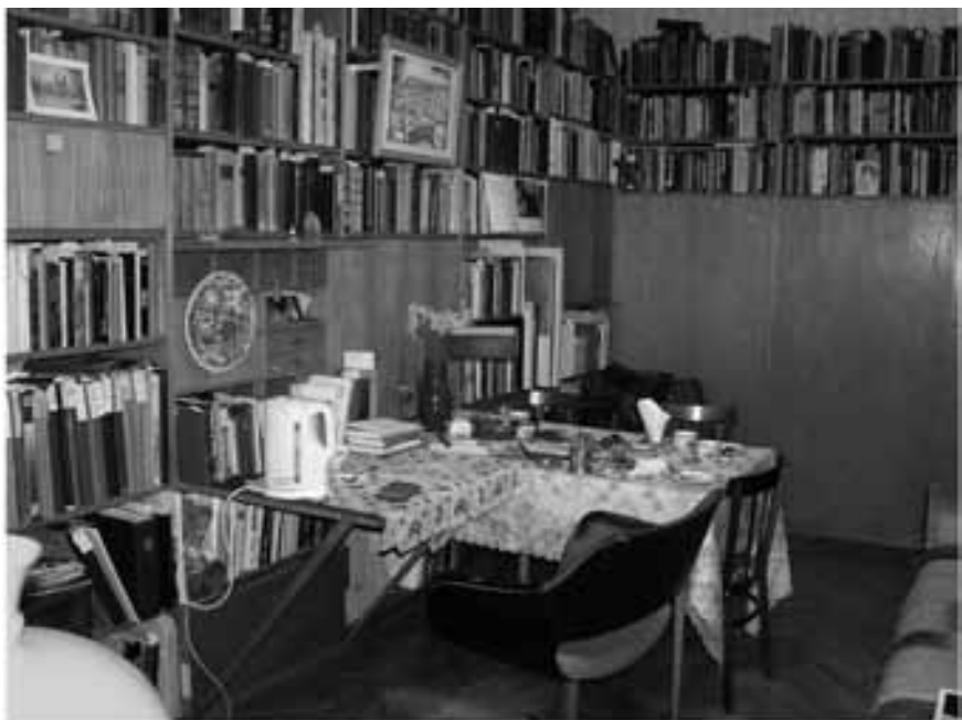
Кабинет Г. С. Кнабе, 2008г. **)