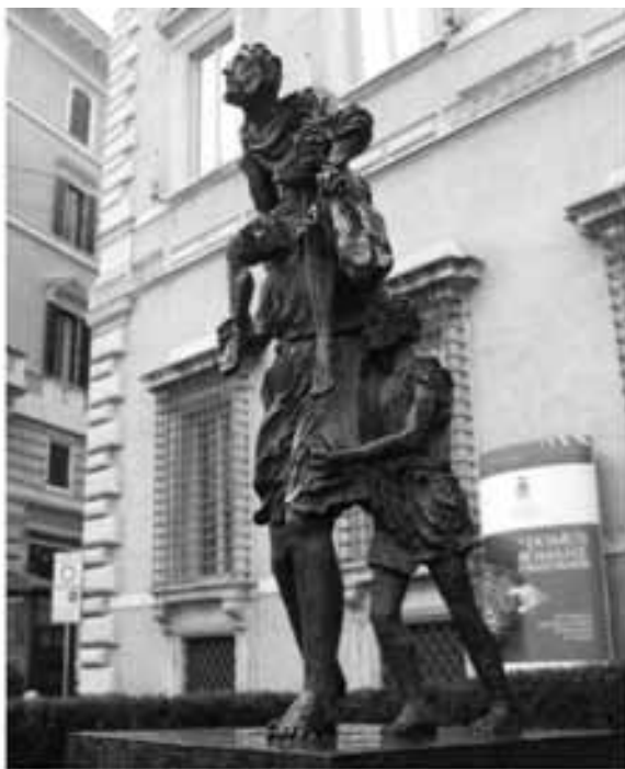
Эней, на плечах выносящий из горящей Трои престарелого отца – Анхиса; за руку он держит малолетнего сына Аскания