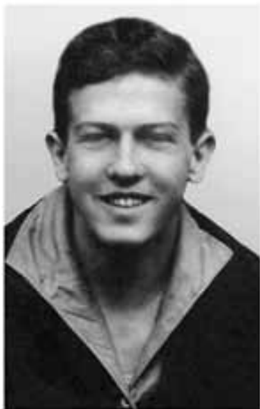
1936 год *)