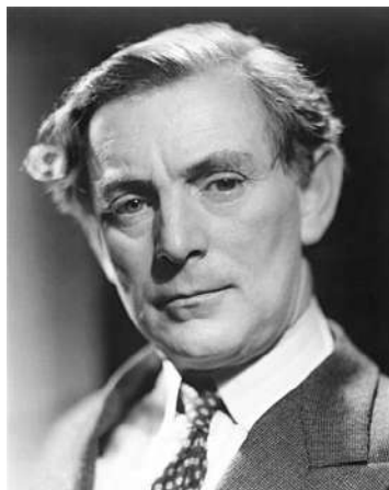
Герберт Баттерфильд после Второй мировой войны

В 1922 году, закончив трехлетнее обучение, он получил диплом историка и занялся преподавательской и научной деятельностью. После 20 лет работы в Питерхаусе он получил профессорское звание (1944 год).