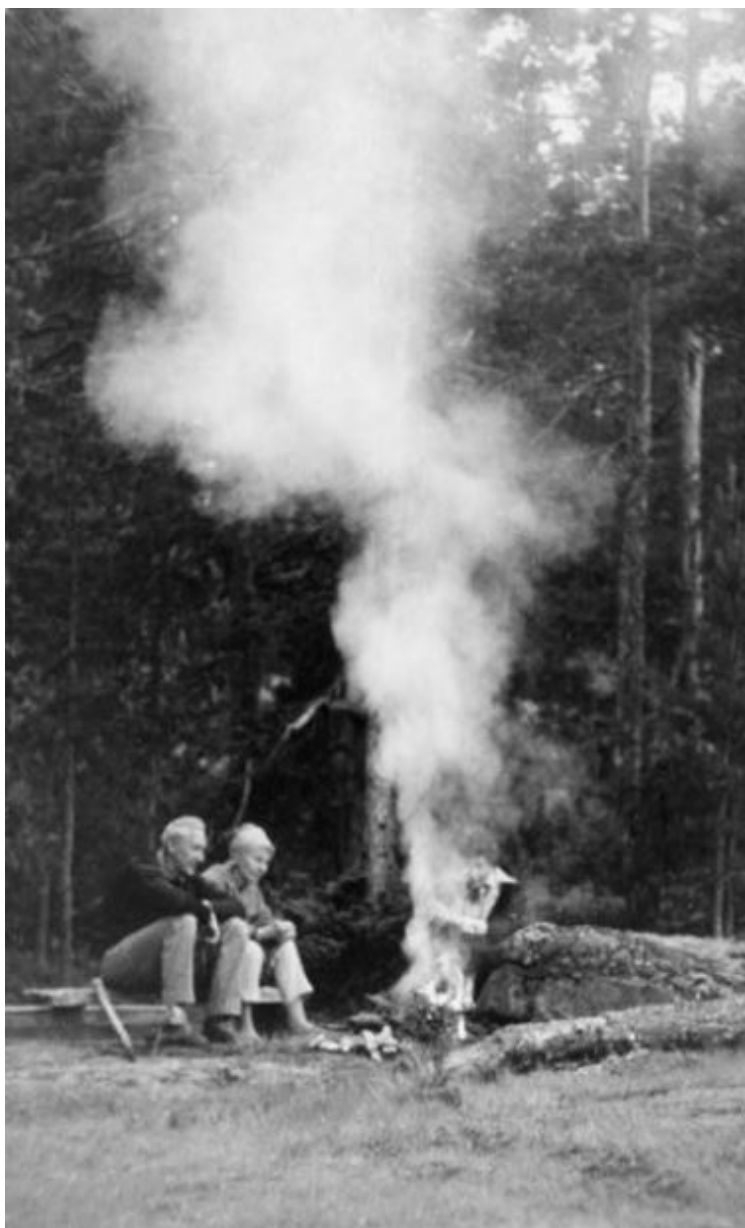
Ночной костер. О. Кий, 1965