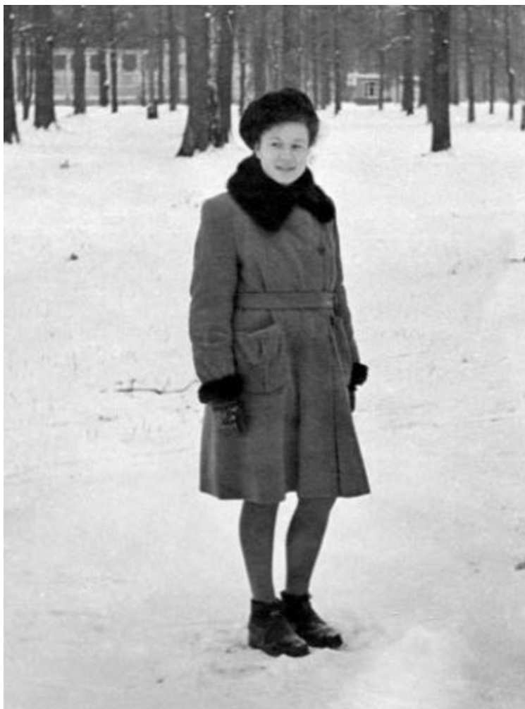
Мое нелюбимое пальто, 1953

Надо сказать, что наше поколение тоже испытало на себе все «прелести» борьбы за красоту и моду в советских условиях.