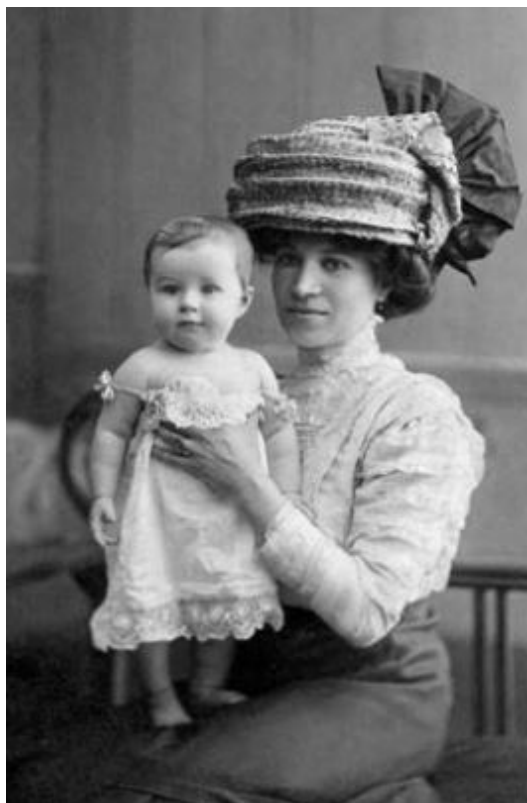
Маме 1 год

Эта идиллия закончилась в 1918 году, когда в Казани окончательно утвердилась власть большевиков. И хотя дед был первым, кто наладил в городе изготовление буденовок, он разделил участь всех «богачей»: магазин и мастерскую опечатали и объявили, что отныне все принадлежит народу. Тем не менее под покровом ночной темноты с черного хода, который опечатать не догадались, настоящие хозяева все-таки ухитрились вынести и припрятать у многочисленных родственников несколько штук сукна и кое-что из мехов. Дедушку выслали, предварительно экспроприировав все, что было ценного в квартире. При этом дележ добычи происходил тут же, на глазах у детей. Победившие пролетарии рассовывали по карманам золотые часы, цепочки, брошки, выронив только одну из дедушкиных запонок. Эта запонка была изготовлена в виде первой буквы дедушкиной фамилии – «М». Дед оставил ювелиру