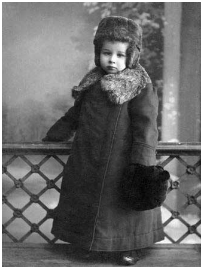
Маме 2 года, (котиковая шуба, по-видимому, еще не сшита)

свою подпись, и тот в точности воспроизвел «М» из золота и мелких хризолитов. Позже одинокая запонка была преобразована в брошку.