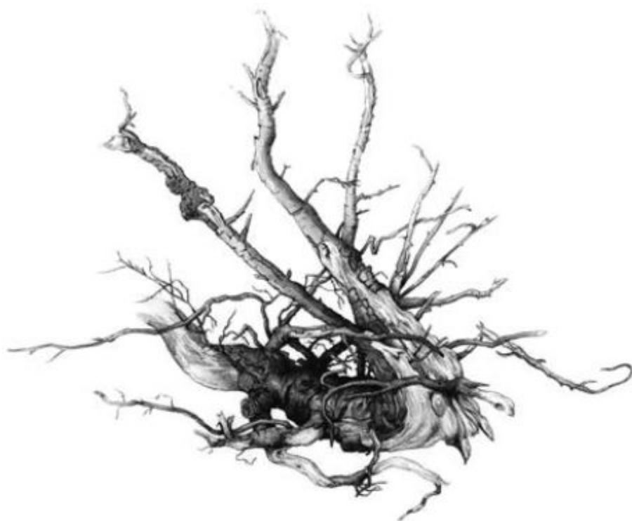
Старосельские корни. Бумага, акварель, тушь, 1996