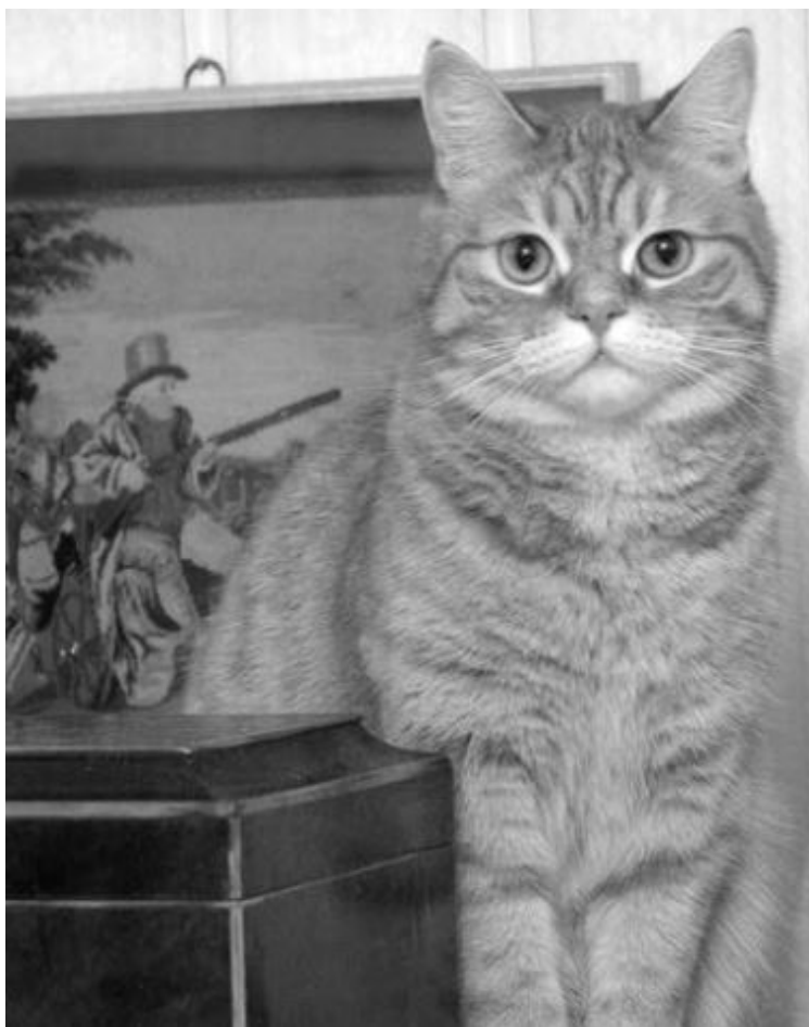
Трифон на фоне бисерной вышивки, 2005

человеческий интеллект одержал победу, что бывало, впрочем, далеко не всегда.