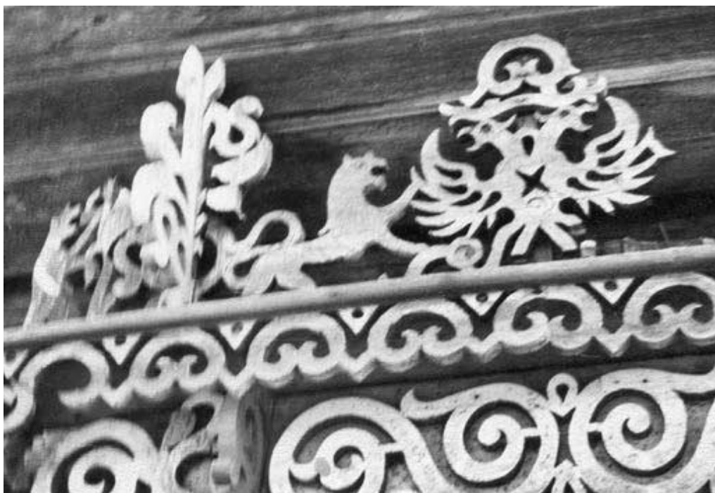
Резные наличники в Солигаличе, 1970

В окне одной из изб виднелась бабуля, тщетно пытавшаяся продать свой никому не нужный дом за какую-то бешеную цену. Единственным привлекательным моментом были в этом доме резные наличники, украшавшие его окна. Подобные были почти на каждой избе и в Нож-кине, и в Солигаличе, куда мы потом переехали. Конечно, это была простая плоская прорезная работа, но они были все разные и выглядели, на наш взгляд, очень живописно.