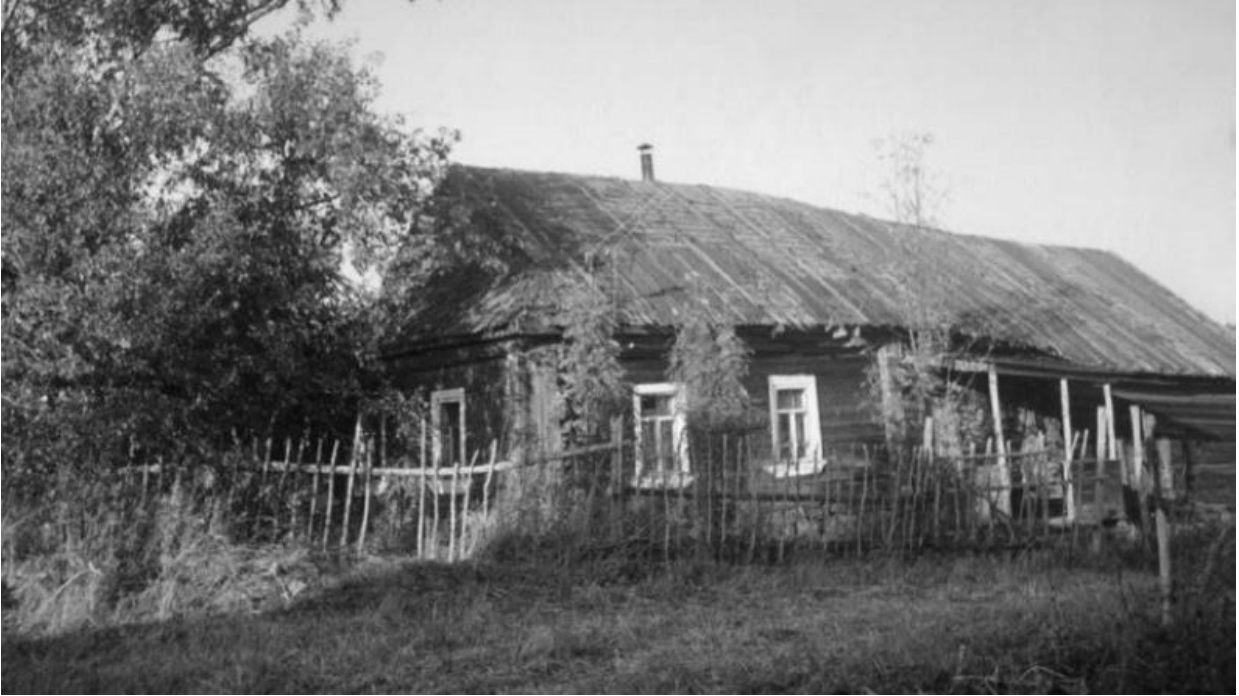
Дом в Староселье, 1989