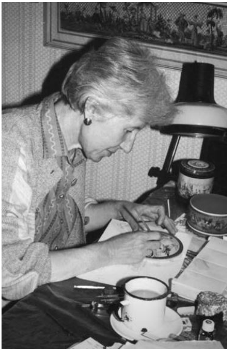
Кофточка из «егерского» белья, середина 1990-х годов

В начале семидесятых была полоса увлечения шитьем из платков. Наподобие того, как Жозефина сшила себе несколько платьев из драгоценных кашмирских шалей, привезенных Наполеоном из египетского похода, мы кроили себе туалеты из рижских штапельных и павловопосадских шерстяных платков. Из штапельных платков шили летние платья, сарафаны, юбки. От стирки они теряли форму и садились, а затем переходили последовательно ко все более и более