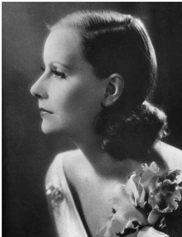
Грета Гарбо, 1940-е годы

А самым лучшим привезенным папой подарком неожиданно оказалась обыкновенная открытка. Однажды, будучи в Германии, он заблудился и решил спросить дорогу. Подойдя к ближайшему дому, папа постучался. Дверь была приоткрыта, но никто не ответил. Тогда он открыл дверь и увидел пустой дом, весь пол которого был покрыт брошенными в спешке бумагами, документами, письмами, фотографиями, открытками. Каково же было его изумление, когда среди этого хлама он увидел валяющуюся на полу мамину фотографию! При ближайшем рассмотрении это оказалась открытка с изображением снятой в профиль Греты Гарбо. Гладко зачесанные назад волосы с пучком на затылке, черты лица, взгляд – сходство было просто