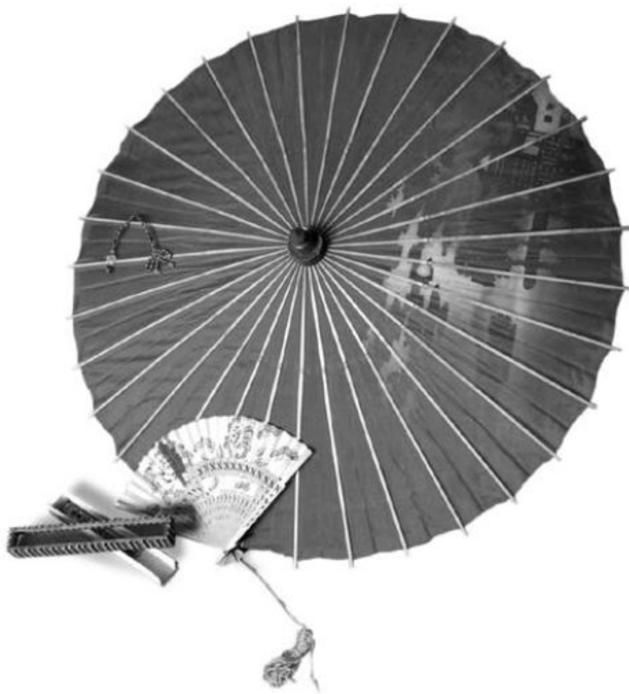
Зонтик и веер. Китай, 1950-е годы