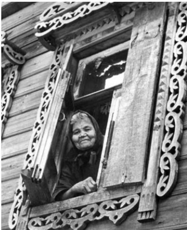
Деревня Мироханово, 1970

Она нам указала направление, мы поблагодарили и повернулись, чтобы продолжать свой путь, как вдруг раздался возмущенный окрик: «Ангелы! Да кто ж так делает? Да куда же вы пошли? Да разве можно так?» Оказывается, бабушка была настроена попить с нами чайку и расспросить, откуда мы такие нездешние появились. Ничего не поделаешь, пришлось пойти ей навстречу. После чаепития мы все-таки добрались до Мироханова и увидели полуразрушенную церковь с неплохими росписями, по стилю похожими на живопись Нестерова. Жалко, что там было слишком темно для фотографии. На полу валялись обрывки риз, из которых, как мы потом узнали, сшили мешки для картошки. Долгое время церковь служила складом, но в то время