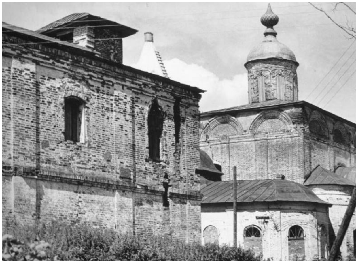
Паисиев монастырь, Троицкая церковь. Галич, 1970

Расстояние от Галича до Чухломы – 52 километра – мы преодолевали часа три. Автобус мотало из стороны в сторону то вверх, то вниз, но при этом он все же как-то незаметно продвигался вперед. Мы, как самые молодые, сели на заднее сиденье и подпрыгивали на нем почти до самой крыши. Посередине пути автобус сделал зеленую остановку. Я еле выбралась из него, а бабуля, сидевшая на боковом сиденье недалеко от нас, выпорхнула, как козочка, и принялась закусывать яичком и хлебушком. Когда мы у нее поинтересовались, как она переносит эту дорогу, она бодро ответила: «Так я всегда с Николаем Угодничком езжу, он в пути очень помогает!» Разница была действительно не в нашу пользу.