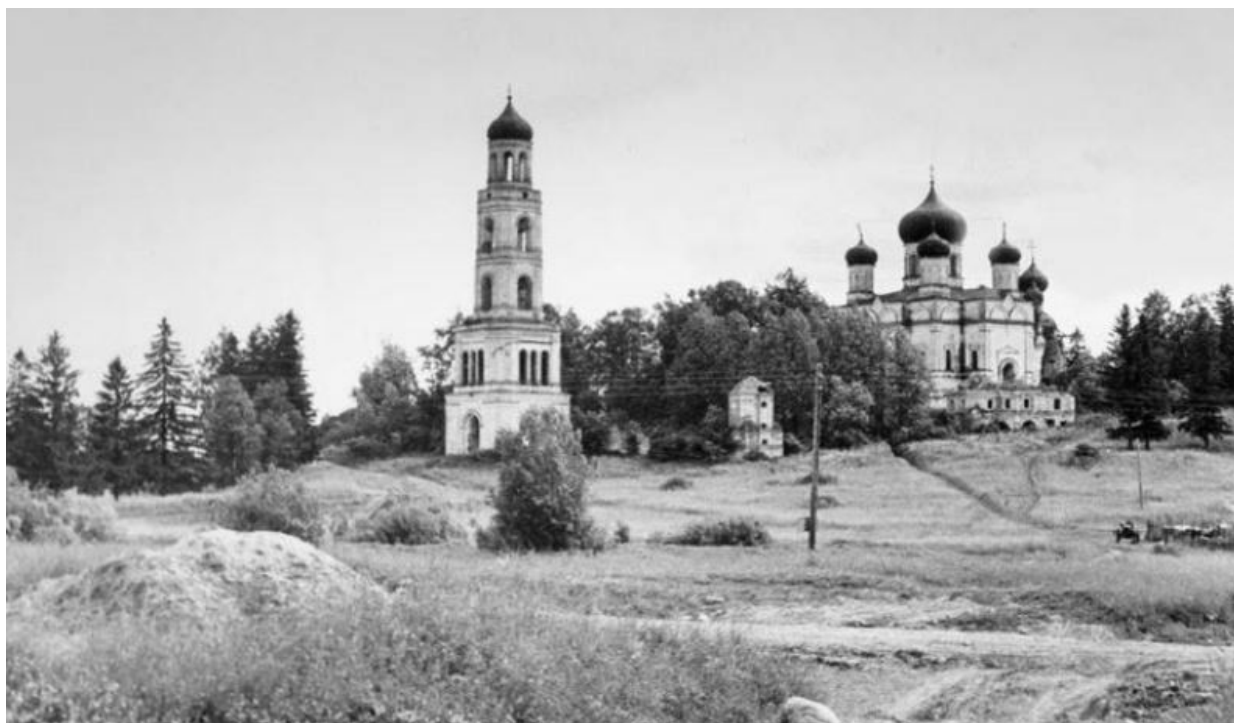
Покровский Авраамиево-Городецкий монастырь, 1970

Услышав от одной из бабушек обращение «ангел», мы сначала приписали это своей благотворительности и стали отказываться от такого звания. Но нам объяснили, что раньше это было общепринятым обращением и старые люди до сих пор так друг друга именуют.