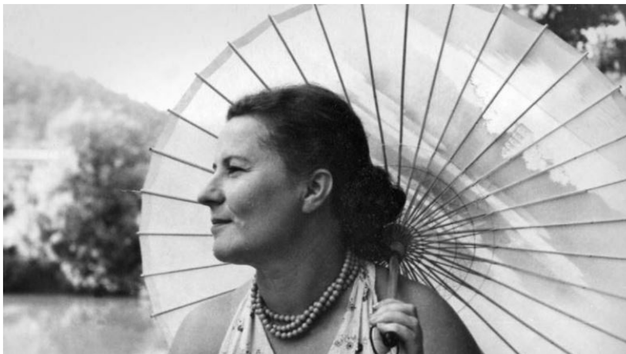
Мама. Архипо-Осиповское, 1954

тряпках он не соображал ничего, и поэтому ему были даны подробнейшие инструкции, что и какого размера нужно купить. Но, как известно, «красота – это страшная сила», и, прогуливаясь по улицам Парижа, он вдруг увидел в витрине платье, против которого устоять не смог. В результате своей немолодой и довольно корпулентной супруге он купил платье 46-го размера, сделанное из темно-серого материала в дырочку, имитирующего шитье. Сквозь дырочки просвечивал чехол из розового атласа. Фасон был самым модным: вырез – «лодочка», короткие рукава «японка», отрезной, обтягивающий по талии лиф и широкая, сложенная бантовыми складками юбка. Под чехлом была еще крахмальная нижняя юбка. Никакая переделка не смогла бы приспособить этот туалет к тете Кате, и он был отдан мне в своем исходном состоянии. Надела я его, по-моему, всего один раз на институтский весенний бал, но зато от произведенного этим платьем эффекта получила полнейшее удовольствие.