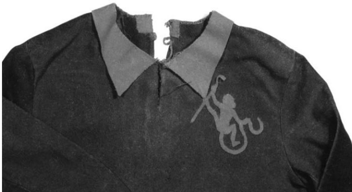
Кофточка с обезьянкой