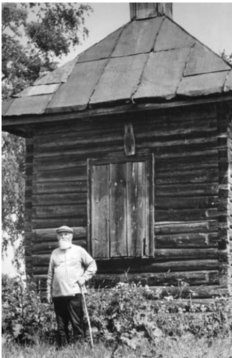
Часовня в деревне Федорино, 1970

берегу Чухломского озера, был исключительно живописным. Правда, при ближайшем рассмотрении он оказался таким же запущенным, как все прочие «культовые» сооружения в то время, но зато хозяева встретили нас очень приветливо и выделили нам для проживания дортуар человек на двенадцать.