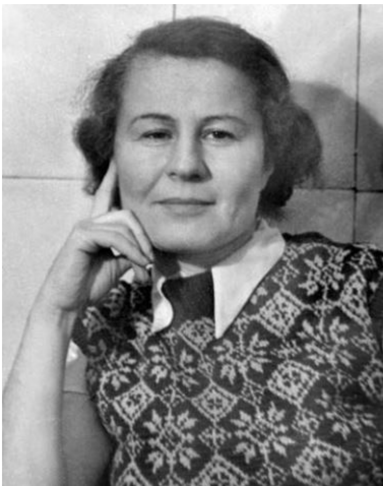
Мама в зеленом жилете собственного изготовления, 1952

мой взгляд, очень удачная. Искусством вязания мы с мамой овладели позже, когда нас в школе на уроке труда научили, как надо начинать вязание и вывязывать лицевые и изнаночные петли. Я показала это дома, и мама незамедлительно начала вязать красную жилетку. Правда, когда дело дошло до проймы, пришлось подождать следующего урока, на котором нам объяснили, как закрывать петли. Как их надо прибавлять, мы узнали еще позже. Несмотря на некоторые недостатки, мне эта жилетка казалась тогда шедевром рукоделия.