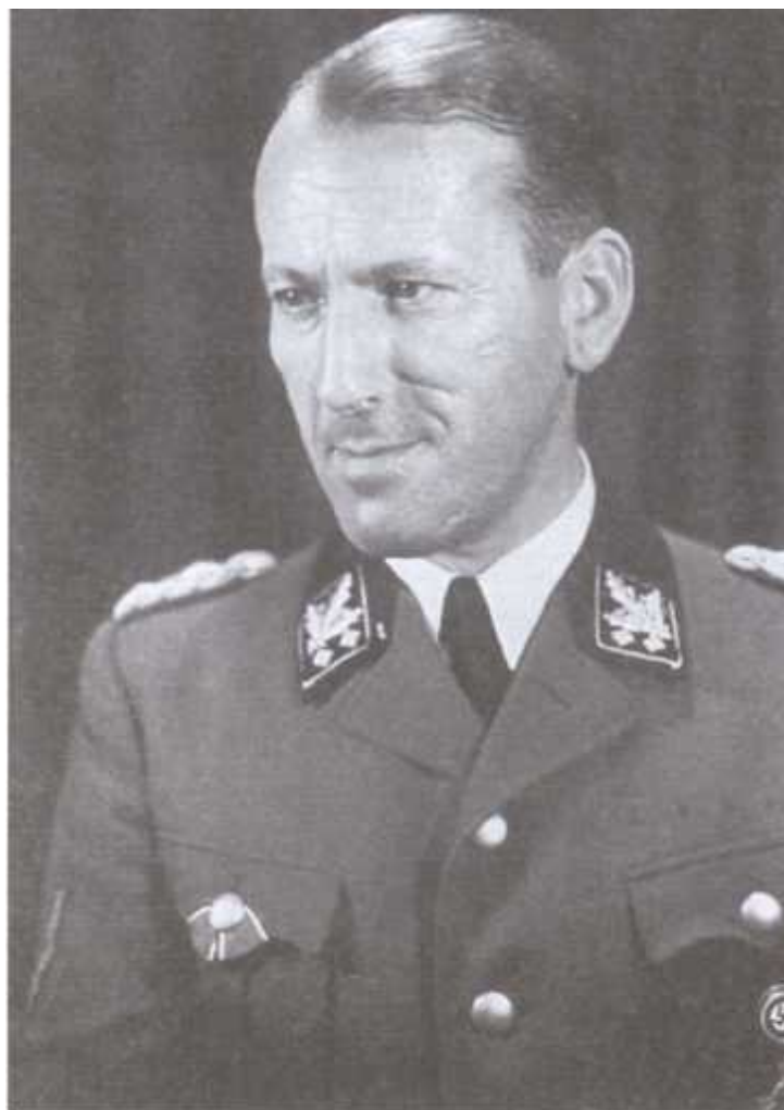
Начальник Главного управления имперской безопасности СС Эрнст Кальтенбруннер