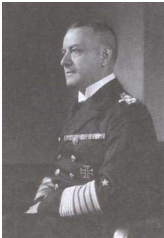
Главнокомандующий кригсмарине гросс-адмирал Эрих Редер