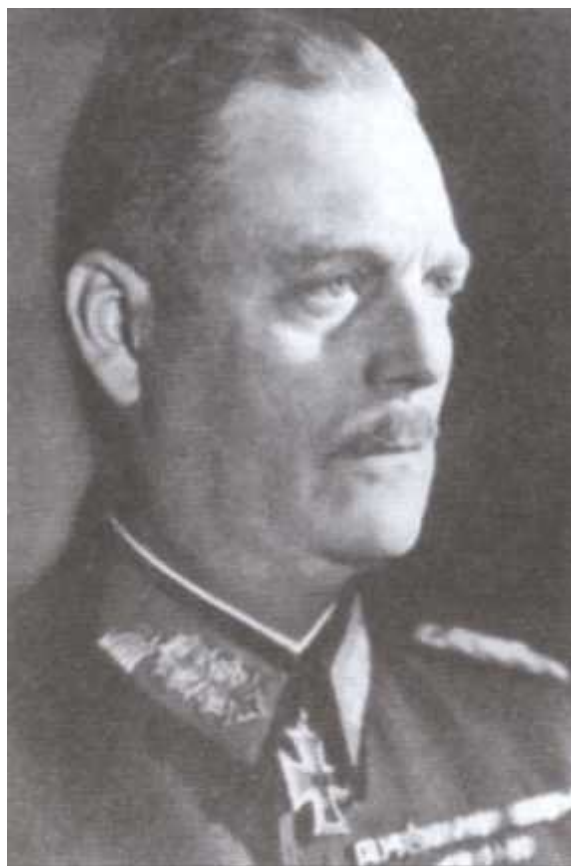
Начальник штаба Верховного главнокомандования вооруженными силами Германии фельдмаршал Вильгельм Кейтель