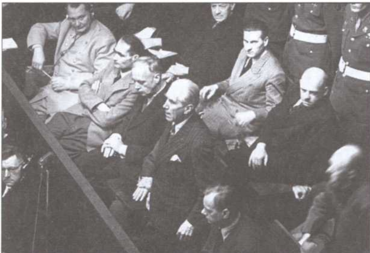
Франц Папен дает показания на Нюрнбергском трибунале