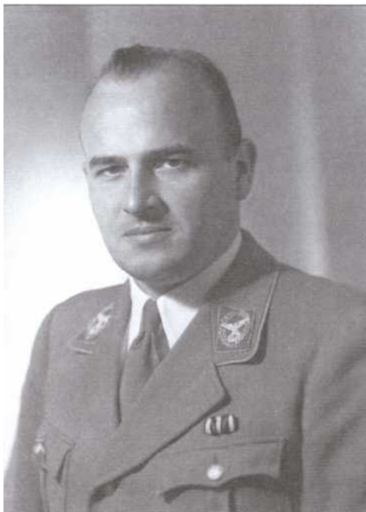
Генерал — губернатор оккупированной Польши Ганс Франк