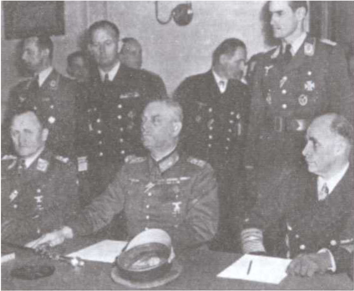
Фельдмаршал Вильгельм Кейтель во время подписания акта о безоговорочной капитуляции Германии