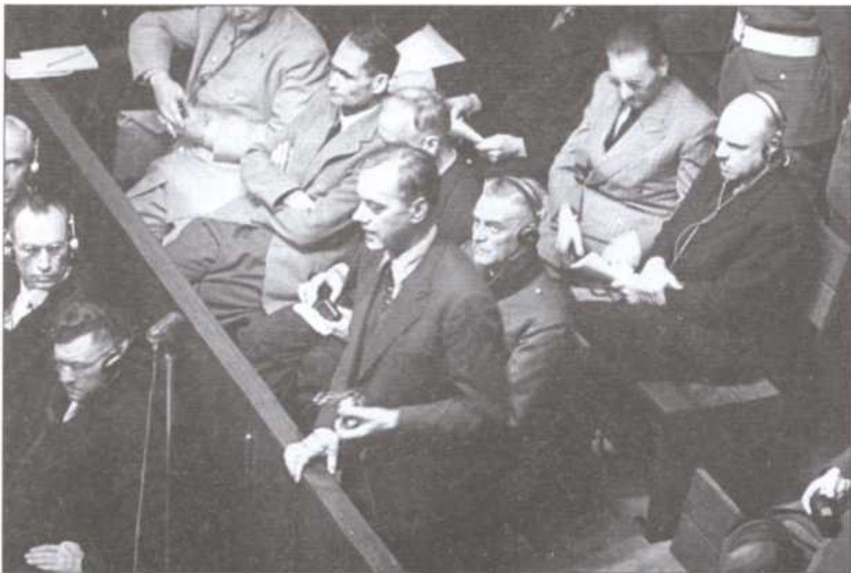
Альфред Розенберг дает показания на Нюрнбергском трибунале