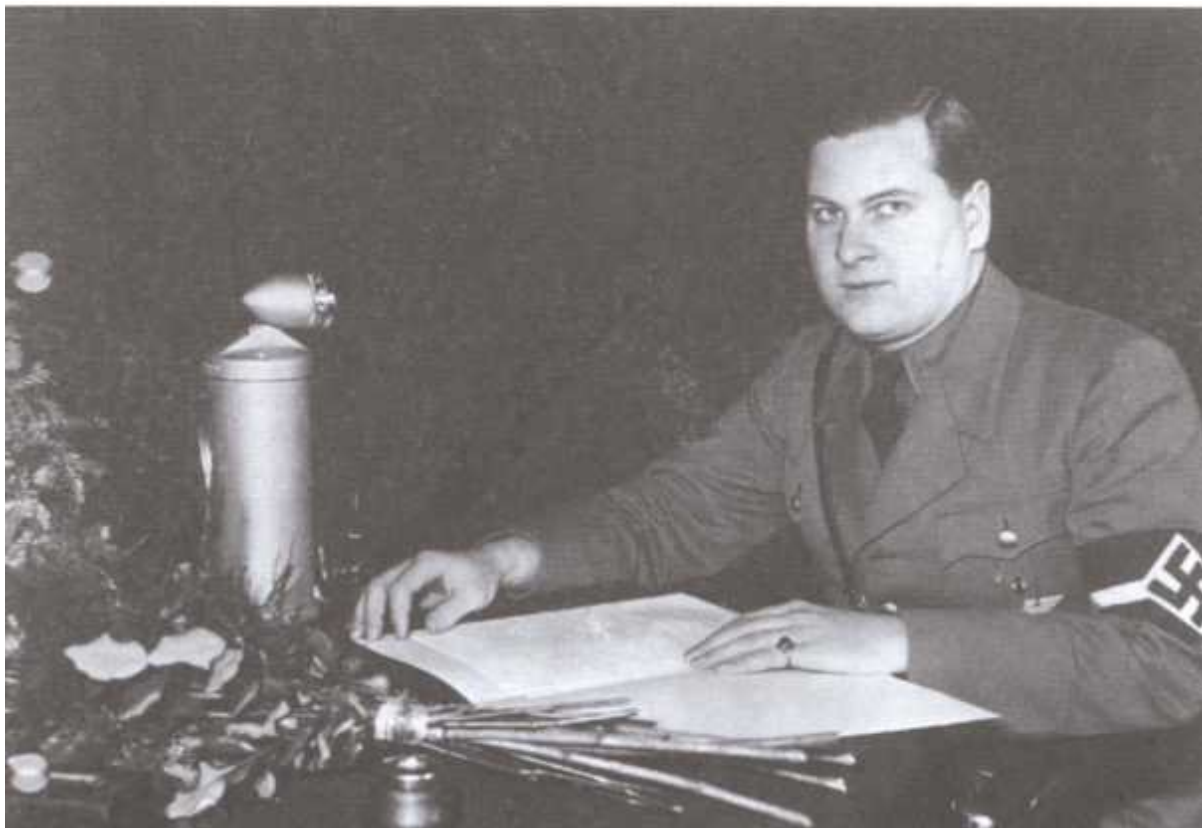
Рейхсюгендфюрер, позже — гауляйтер Вены Бальдур фон Ширах