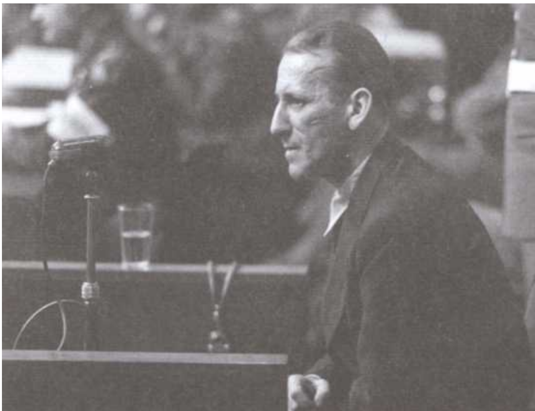
Эрнст Кальтенбруннер отвечает на вопросы судьи