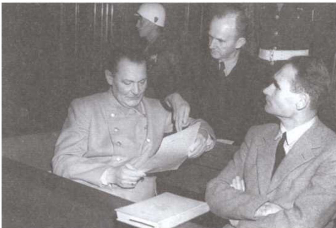
Герман Геринг, Карл Денниц и Рудольф Гесс на скамье подсудимых Нюрнбергского трибунала.