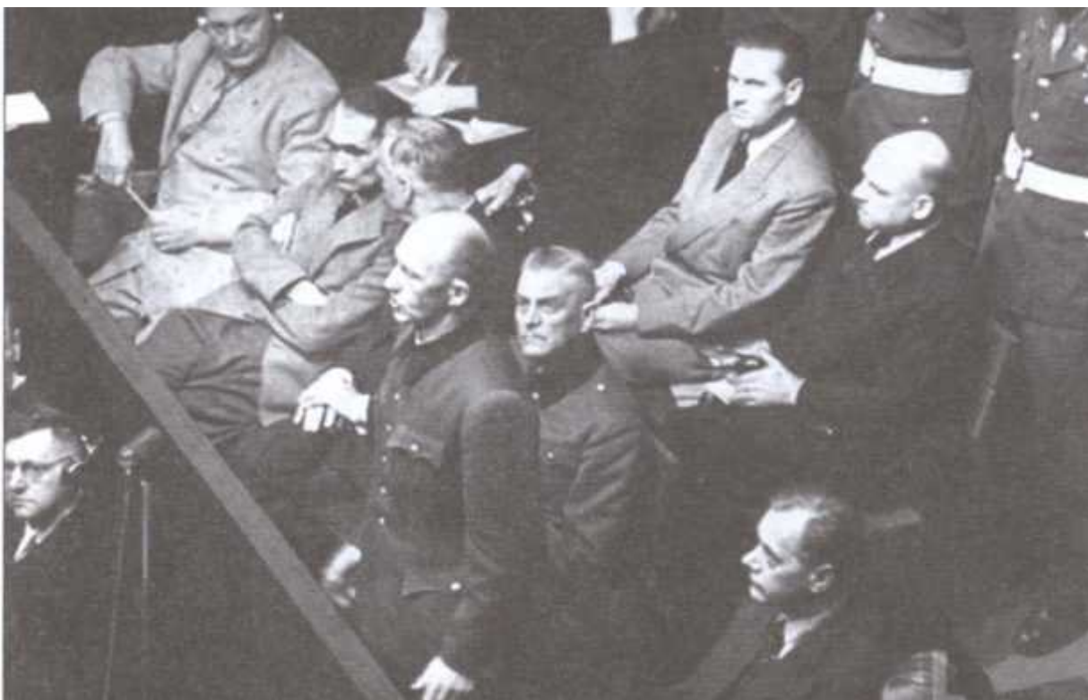
Альфред Йодль дает показания на Нюрнбергском трибунале