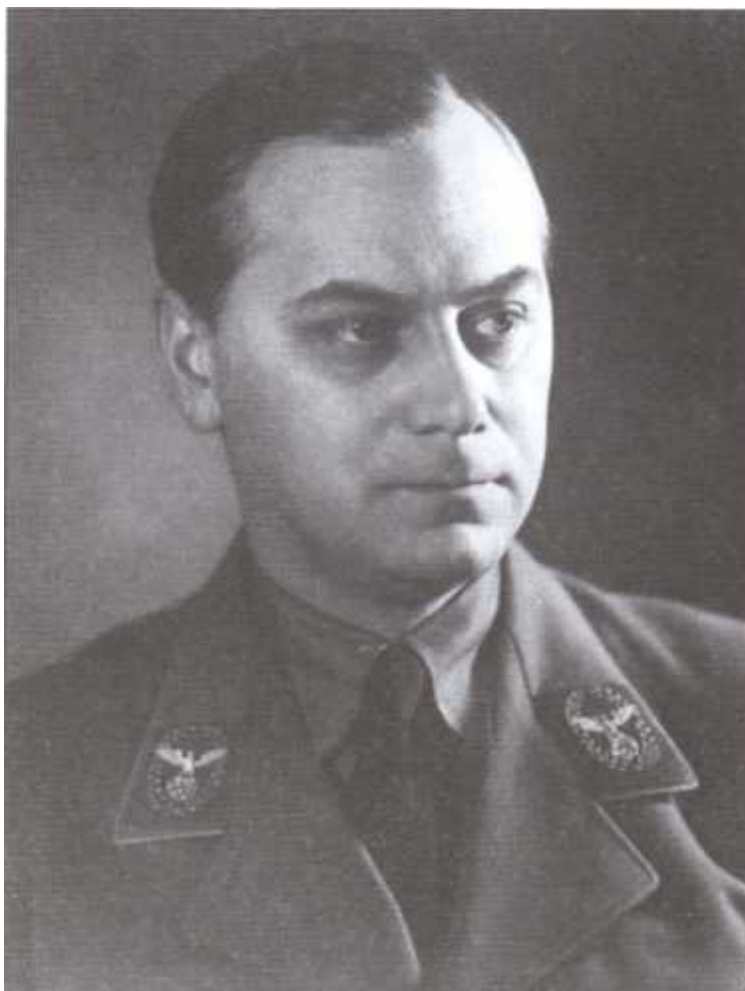
Главный идеолог НСДАП Альфред Розенберг