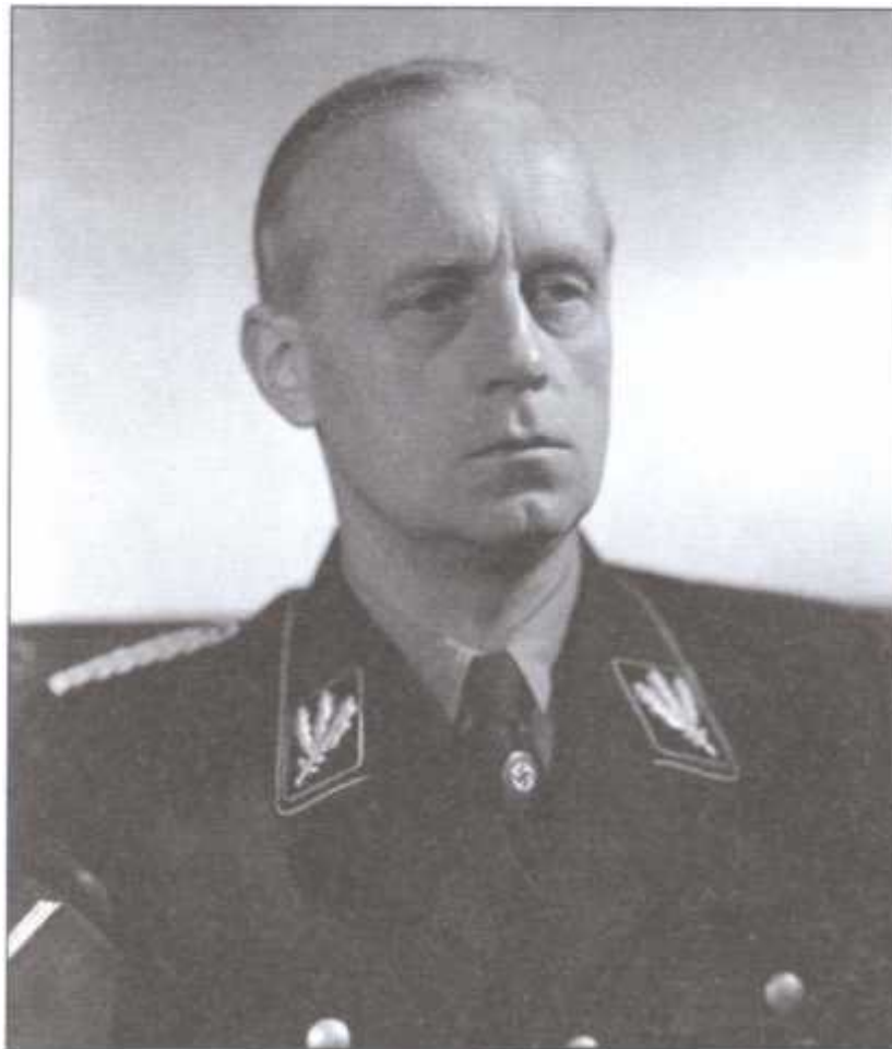
Министр иностранных дел Германии Иохим фон Риббентроп