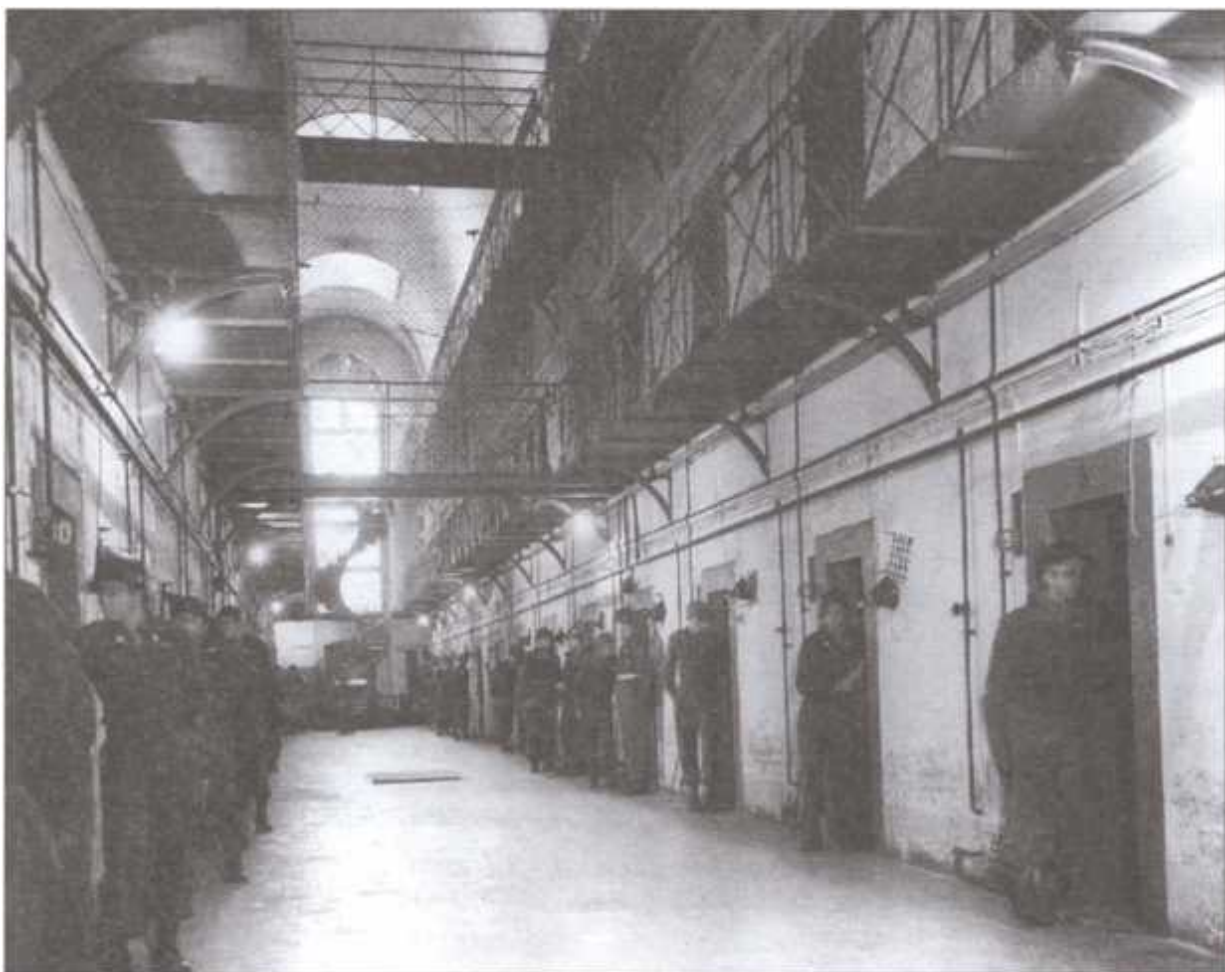
Внутренний зал тюрьмы