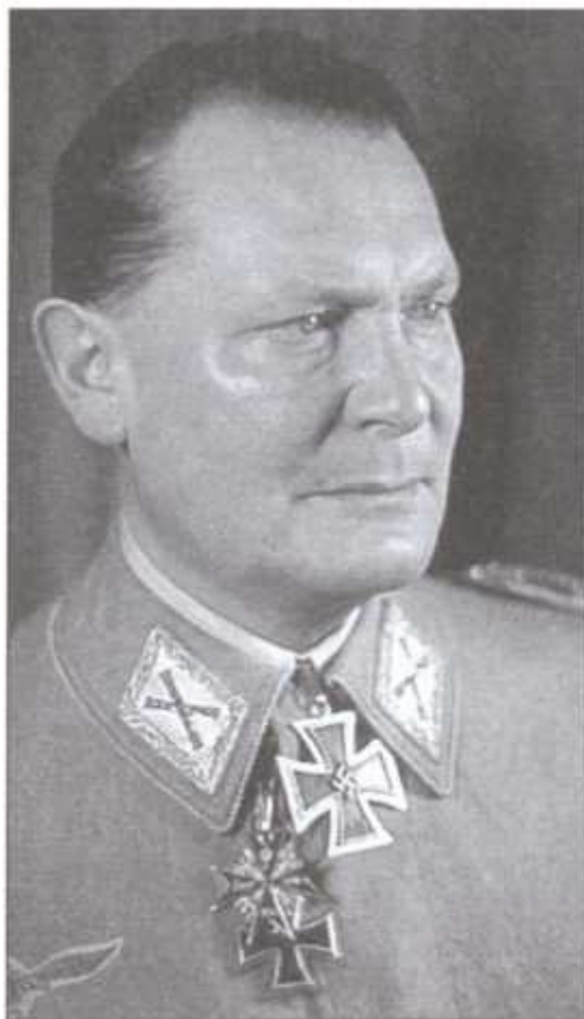
Рейхсминистр Имперского министерства авиации, рейхсмаршал Герман Геринг