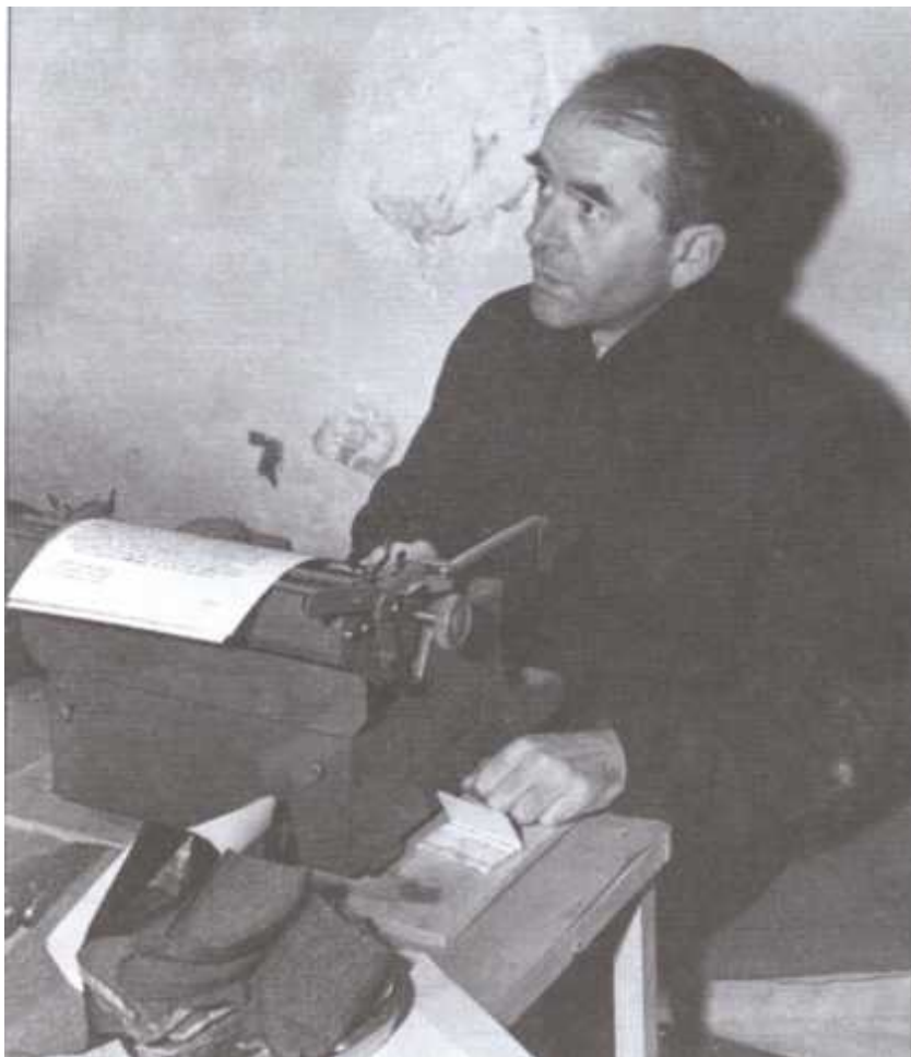
Альберт Шпеер в Нюрнбергской тюрьме