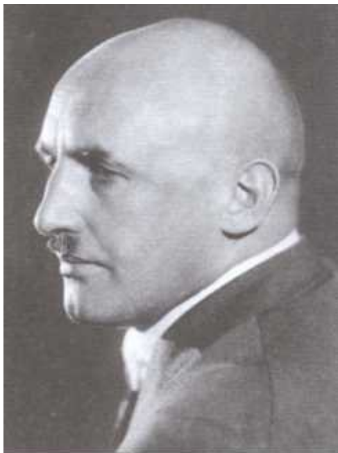
Гауляйтер Франконии Юлиус Штрайхер

На заседании Нюрнбергского трибунала (слева направо): Константин Нейрат, Вальтер Функ, Альберт Шпеер и Ганс Фриче