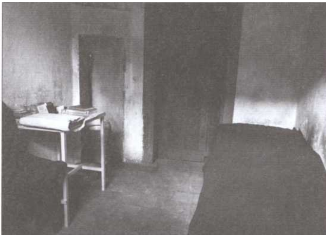
Камера для подсудимых