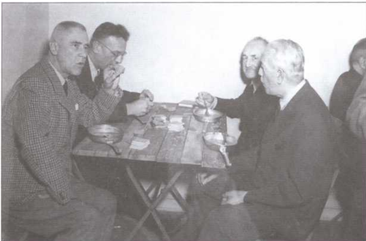
Вильгельм Фрик, Артур Зейсс-Инкварт, Юлиус Штрайхер, Константин фон Нейрат за тюремной трапезой