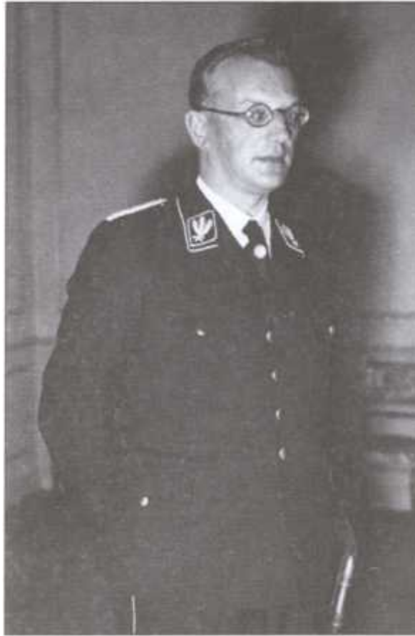
Рейхскомиссар Нидерландов Артур Зейсс-Инкварт