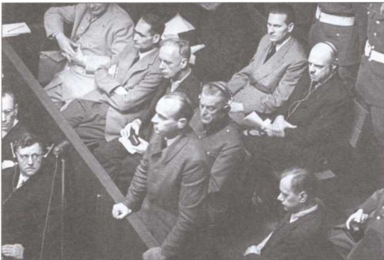
Ганс Франк дает показания на Нюрнбергском трибунале