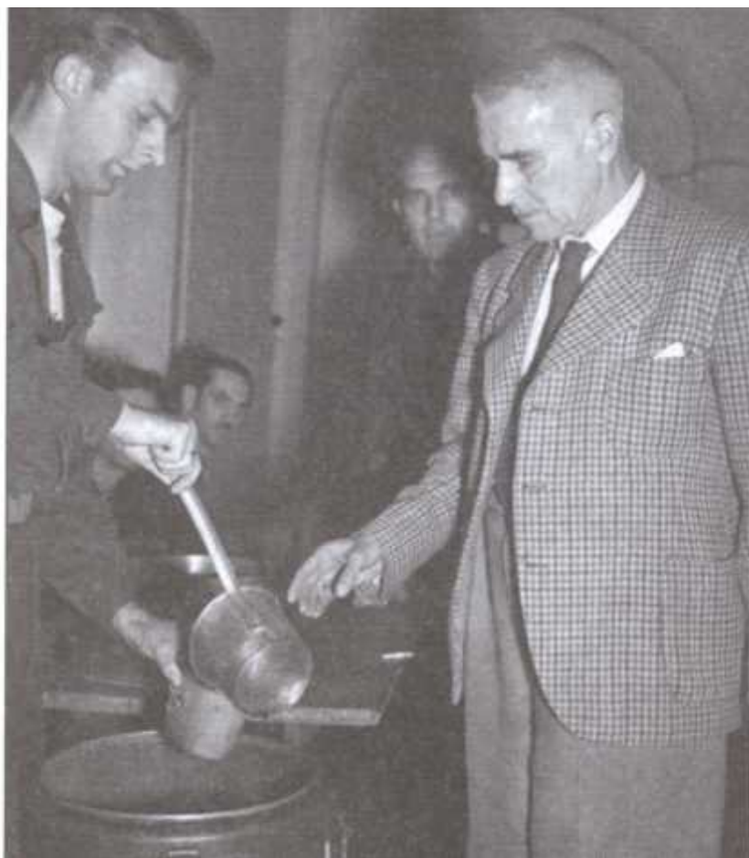
Вильгельм Фрик получает тюремный обед