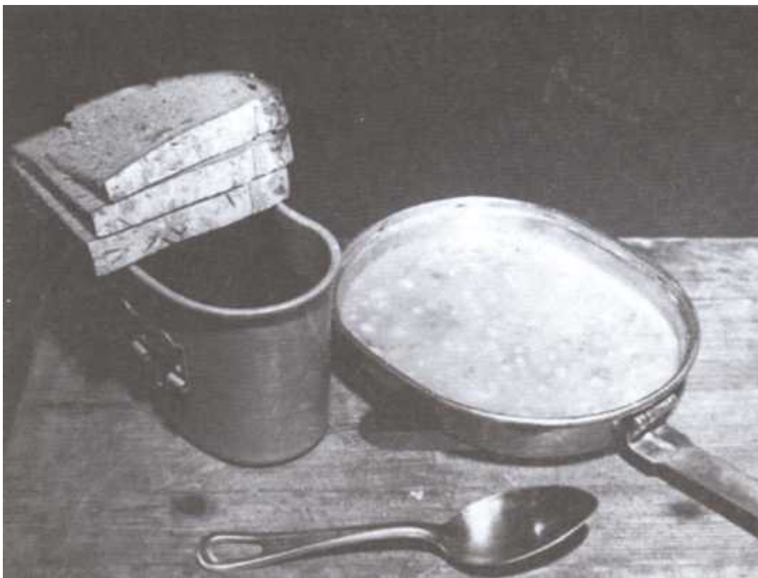
Обеденный рацион для заключенных Нюрнбергской тюрьмы