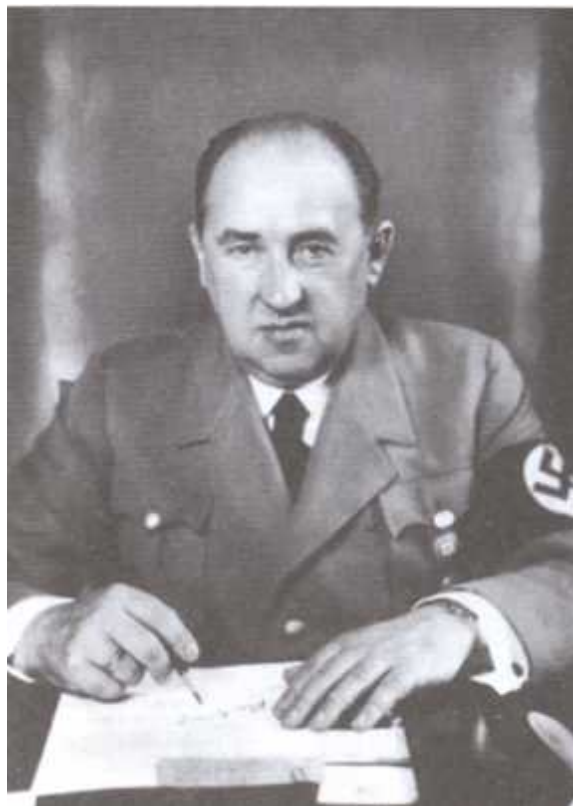
Министр экономики в Третьем рейхе, президент Рейхсбанка Вальтер Функ