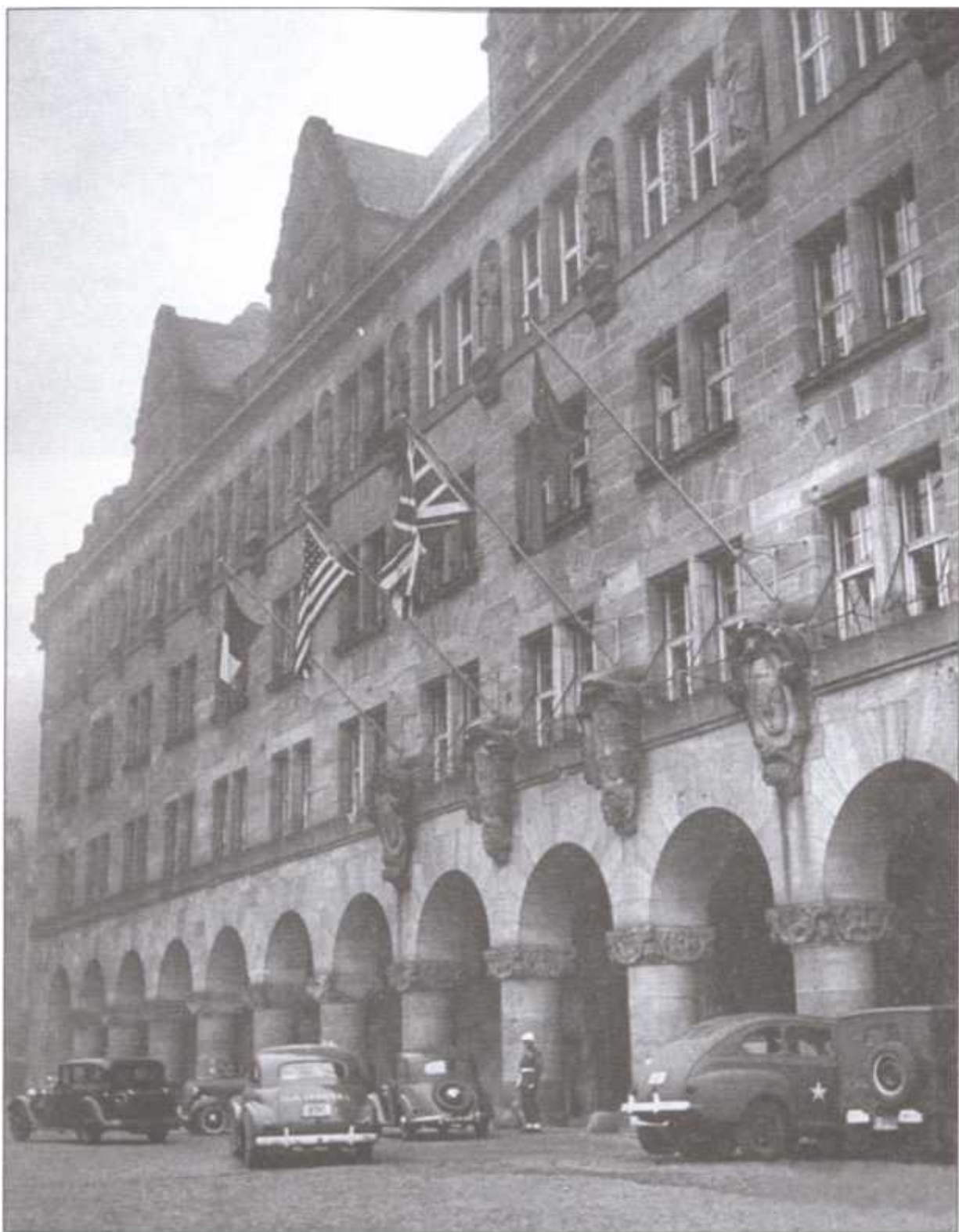
Здание, в котором проходили заседания Нюрнбергского трибунала