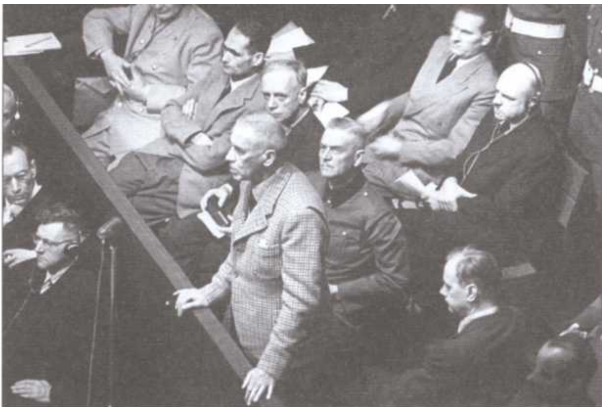
Вильгельм Фрик дает показания на Нюрнбергском трибунале