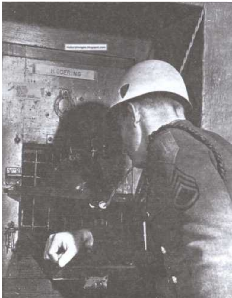
Охранник заглядывает в камеру Геринга