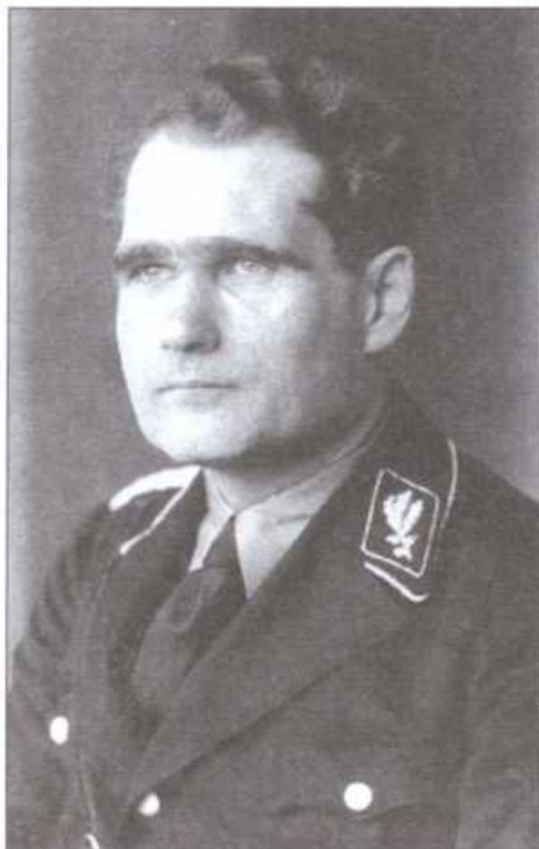
Заместитель Гитлера по партии, рейхсминистр без портфеля, рейхсфюрер Рудольф Гесс