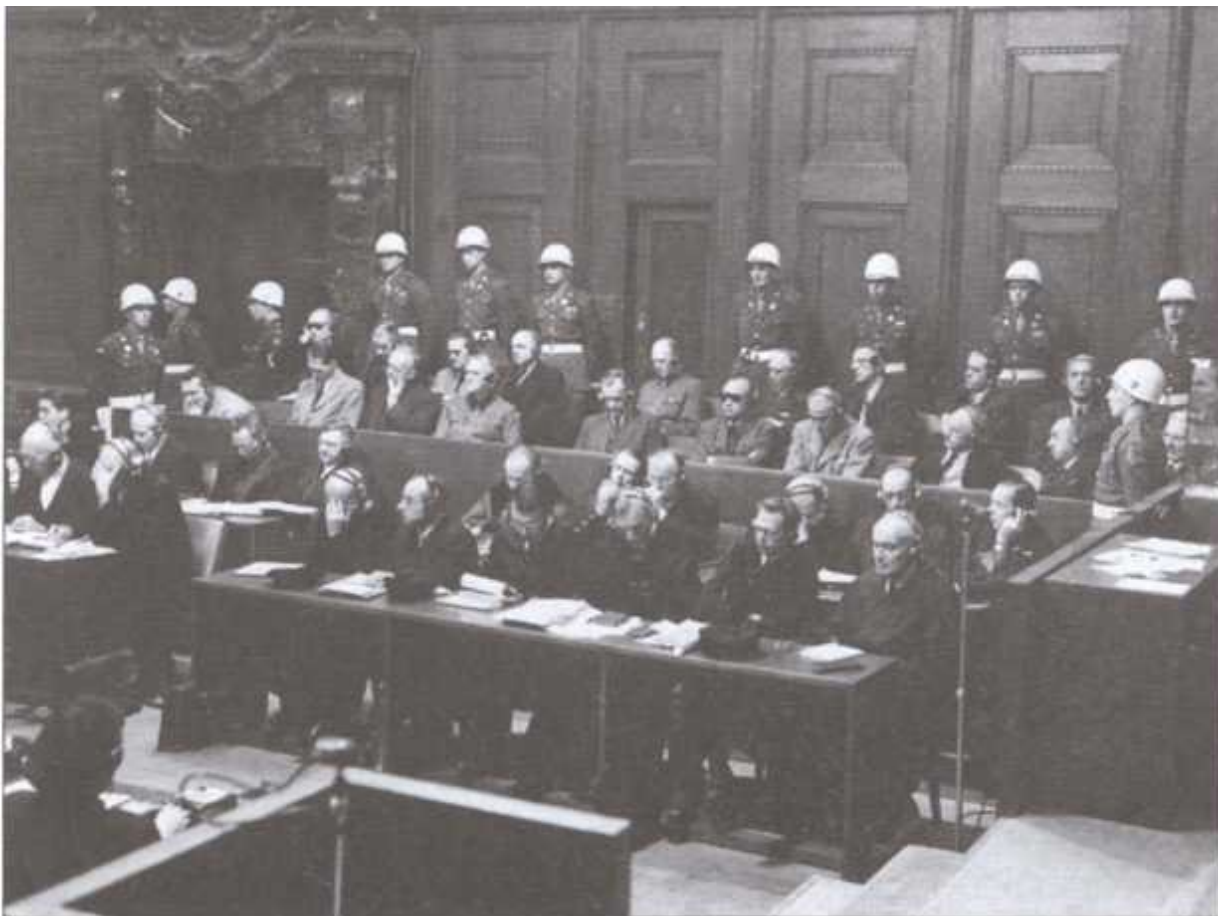
Главные военные преступники на скамье подсудимых во время заседания Нюрнбергского трибунала

Я спросил у Кейтеля, сколько солдат погибло за эту войну. Он ответил мне: