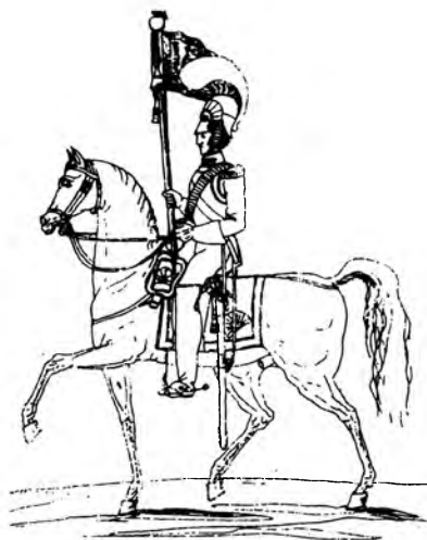
Офорты, сделанные императором Николаем I собственноручно