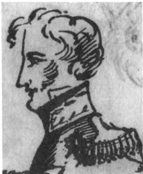
Великий князь Николай Павлович. Рисунок А. С. Пушкина в черновиках поэмы «Руслан и Людмила». 1818–1819 гг.