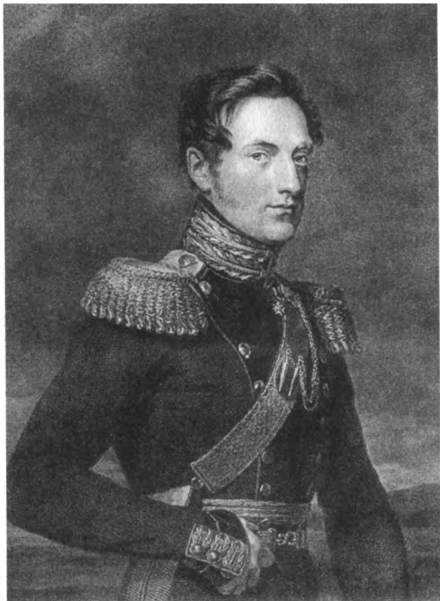
Император Николай Павлович. Гравюра с портрета Д. Доу