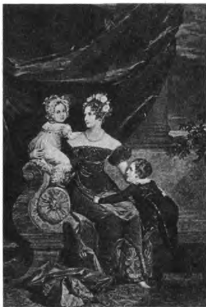
Императрица Александра Федоровна с великим князем Александром Николаевичем и великой княжной Марией Николаевной. Гравюра Т. Райта с портрета Д. Доу