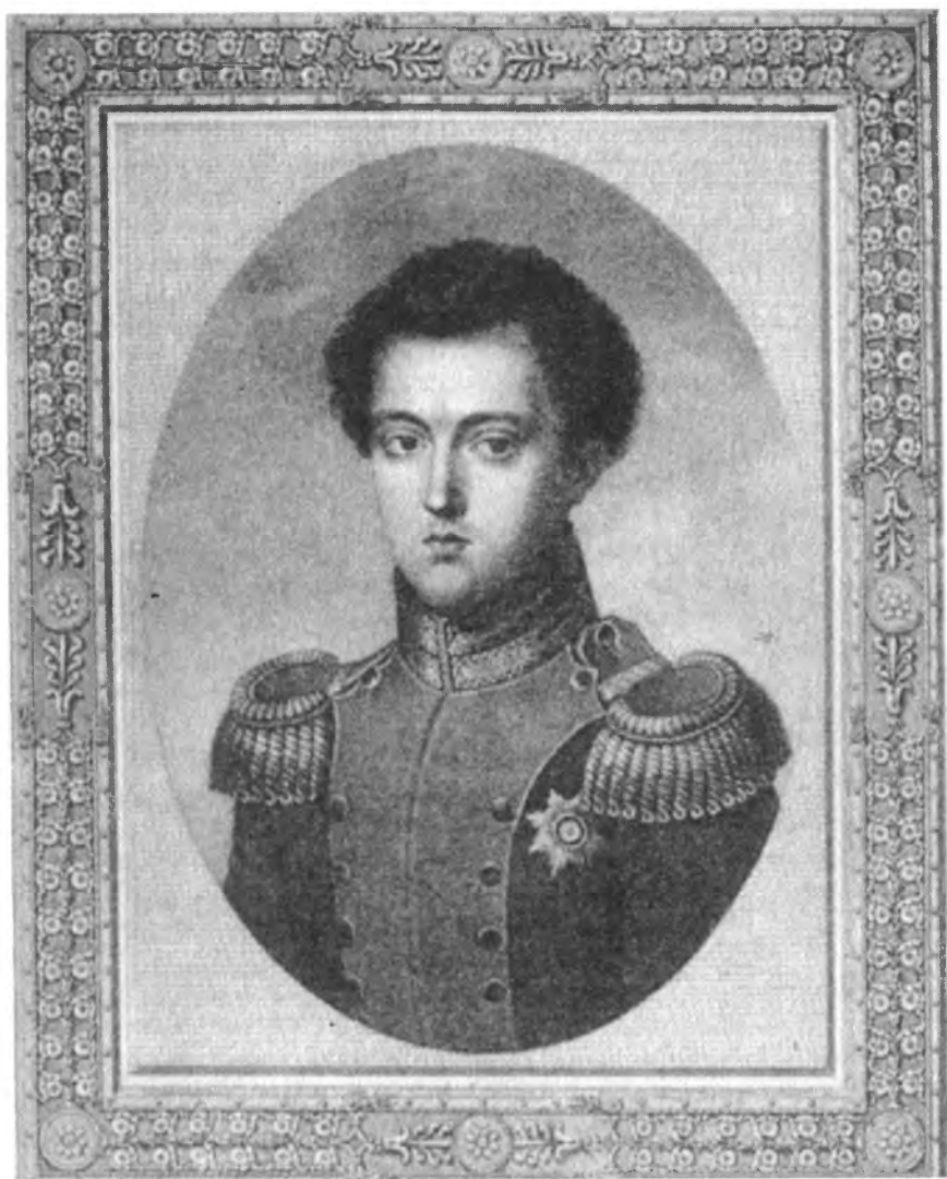
Великий князь Николай Павлович. Гравюра Жоно с портрета А. Беннера