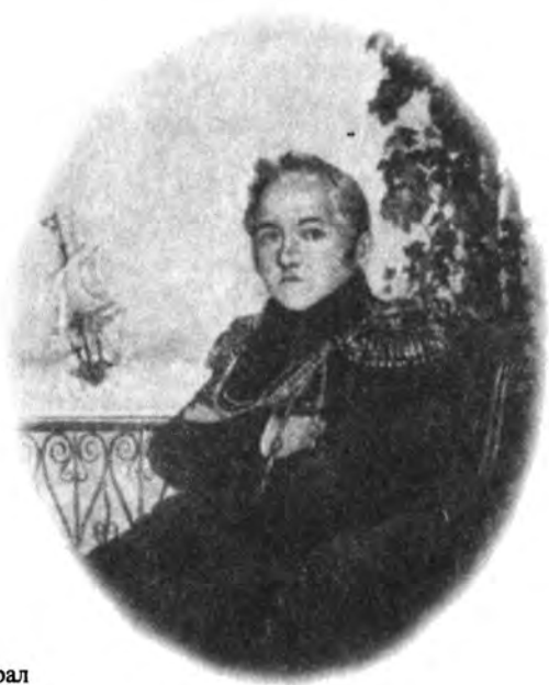
М. П. Лазарев, русский адмирал