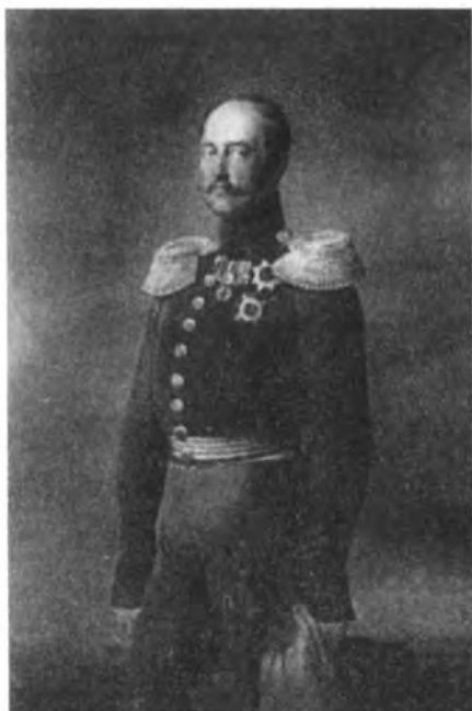
Император Николай I в начале 1850-х гг. Портрет масляными красками, некогда принадлежавший Кавалергардскому полку