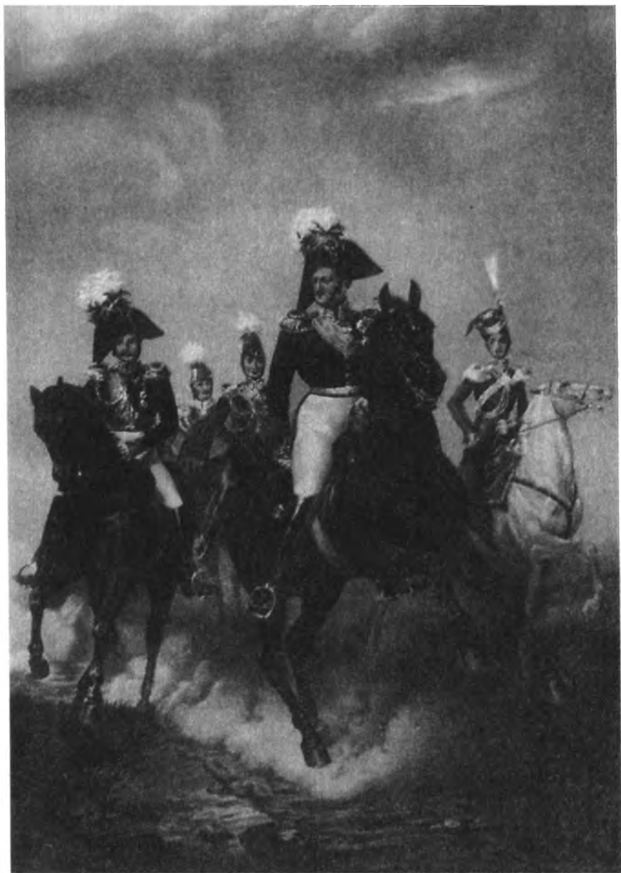
Император Николай I, великий князь Михаил Павлович, цесаревич Александр Николаевич, князь П. М. Волконский и граф А. Х. Бенкендорф. Портрет работы Ф. Крюгера