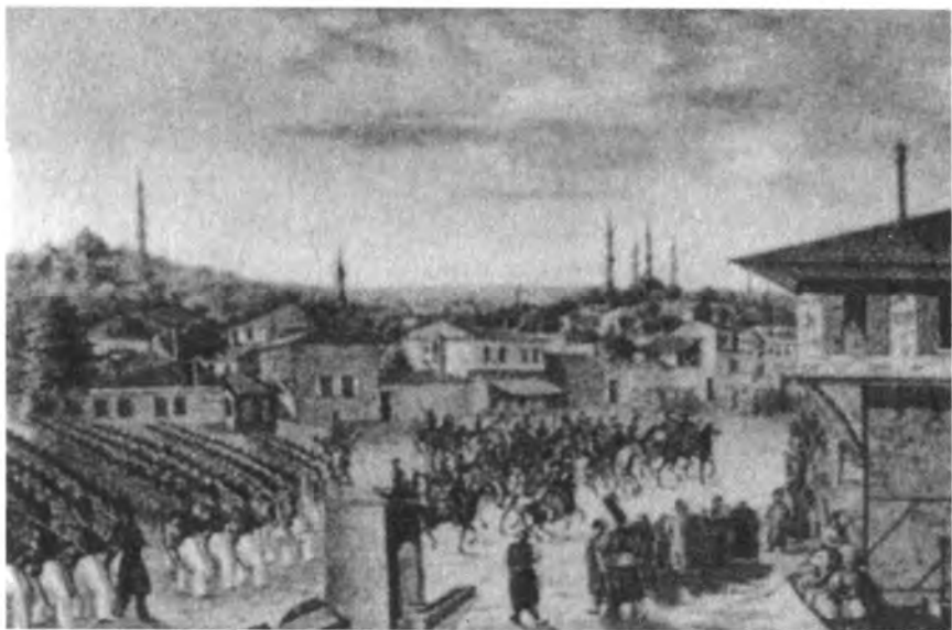
Вход русских войск в Адрианополь