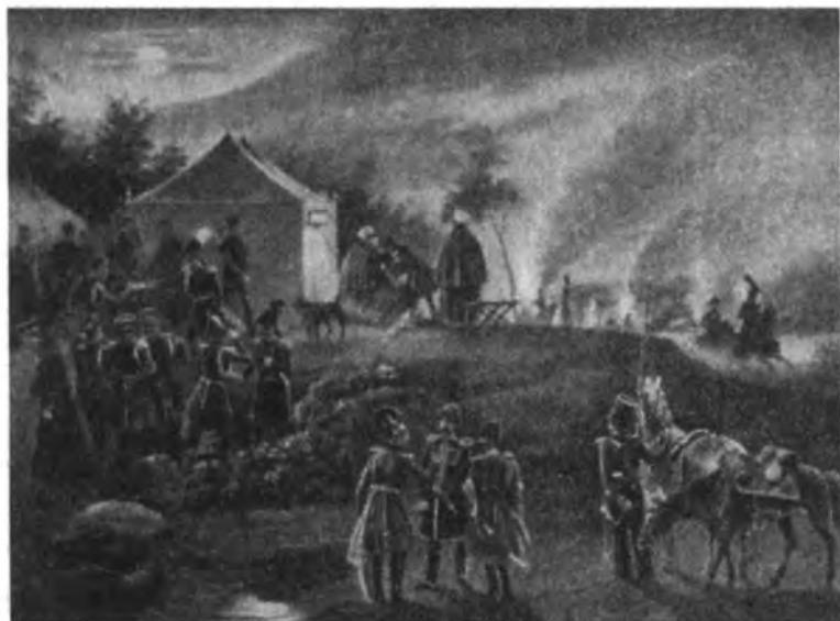
Николай I на ночных маневрах (с русской литографии)