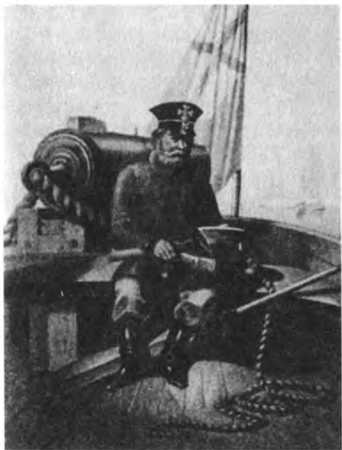
Русский морской ополченец 1854 г.