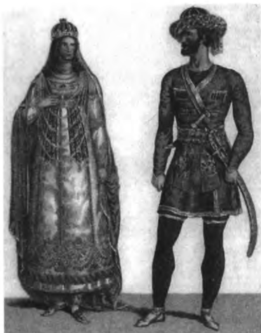
Великий князь Николай Павлович в costume Алариса, царя Бухарского и великая княгиня Александра Федоровна в costume Лалла-Рук. Из книги «Lalla-Roukh. Divertissement executé au chateau royal de Berlin le 27 Janvier 1821, pendant le séjour de L. L. A. A. J. J. Magr. Le grand duc Nicolas et Mad. La grande duchesse Alexandra Feodorowna» (Berlin, 1822)