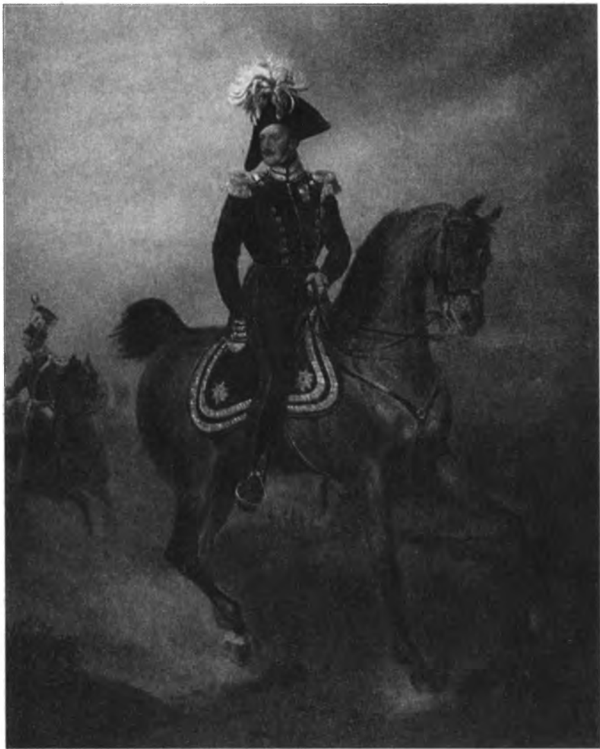
Император Николай I. Портрет работы Ф. Крюгера