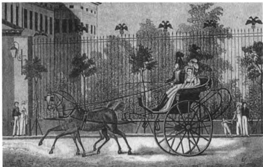
Прогулка великого князя Николая Павловича и великой княгини Александры Федоровны в кабриолете. Гравюра начала 1820-х гг.