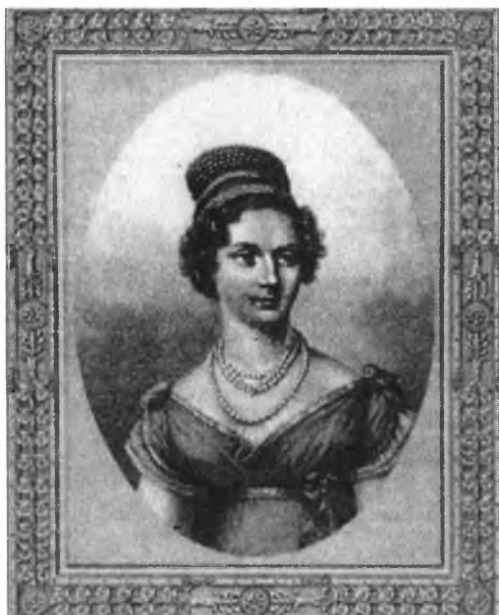
Великая княгиня Александра Федоровна. Гравюра Ж. Меку с портрета А. Беннера