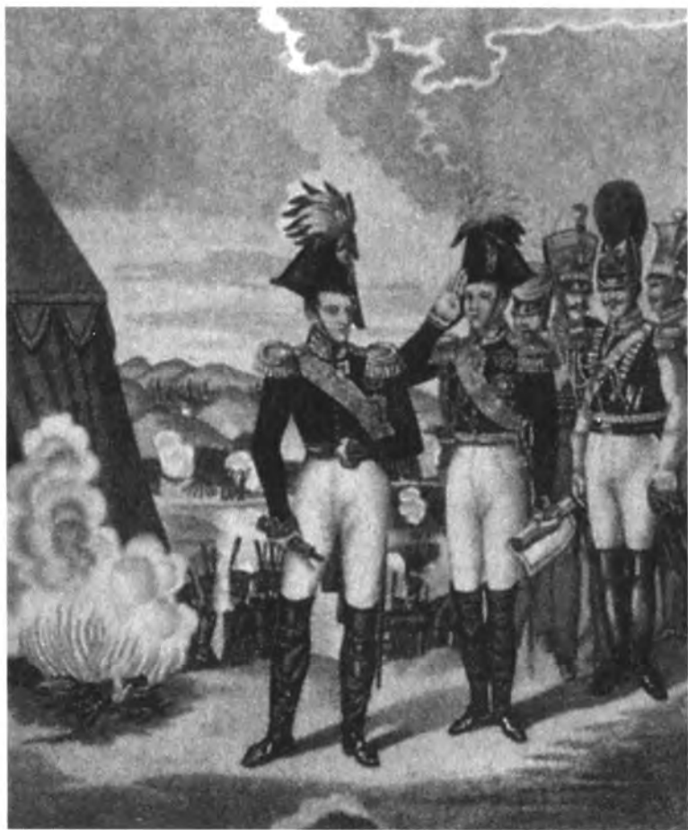
Император Николай I у Шумлы