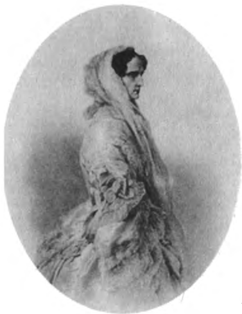
Императрица Александра Федоровна. Акварельный портрет, некогда при- надлежавший Кавалергардскому полку