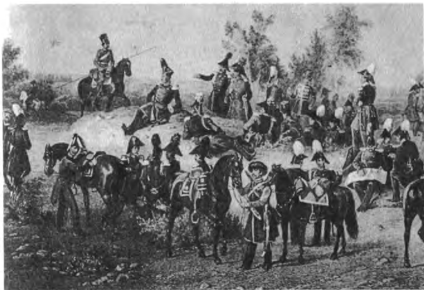
Император Николай I на бивуаке. Литография с рисунка В. Г. Шварца