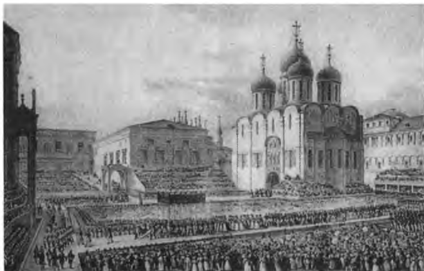
Торжественное шествие в Успенский собор в день коронации императора Николая I. Гравюра из «Коронационного альбома», 1828 г.