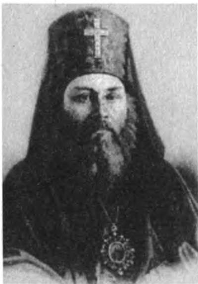
Архиепископ Херсонский и Таврический Иннокентий (Борисов)