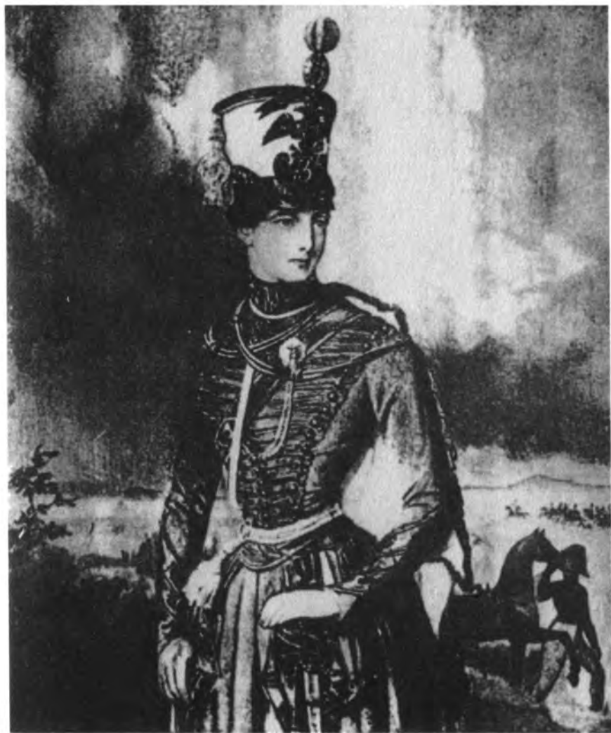
Великая княжна Ольга Николаевна в форме 3-го гусарского Елисаветградского Ее Имени Полка