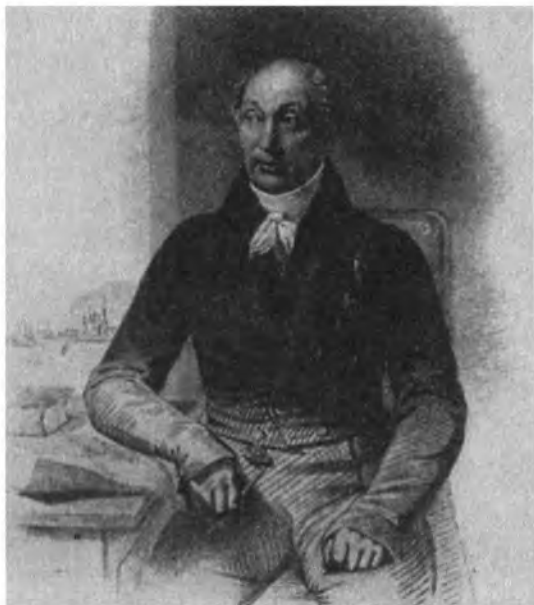
М. М.: Сперанский. С гравюры Т. Райт