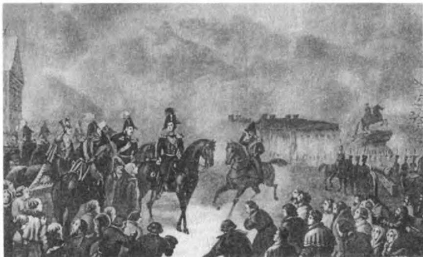
Император Николай I на Сенатской площади 14 декабря 1825 г. Литография Рябцова с рисунка В. Садовникова