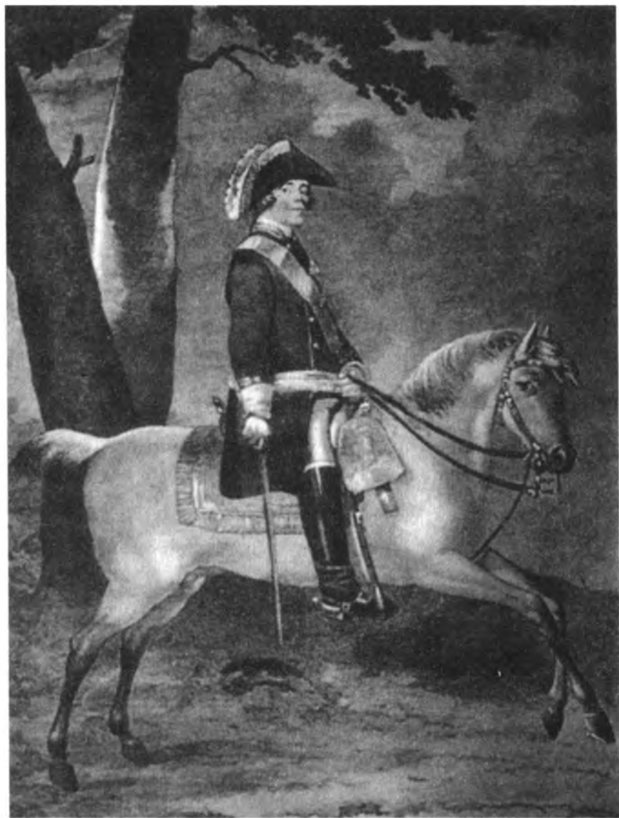
Император Павел I. Гравюра Д. Вилькера с портрета Д. Аткинсона