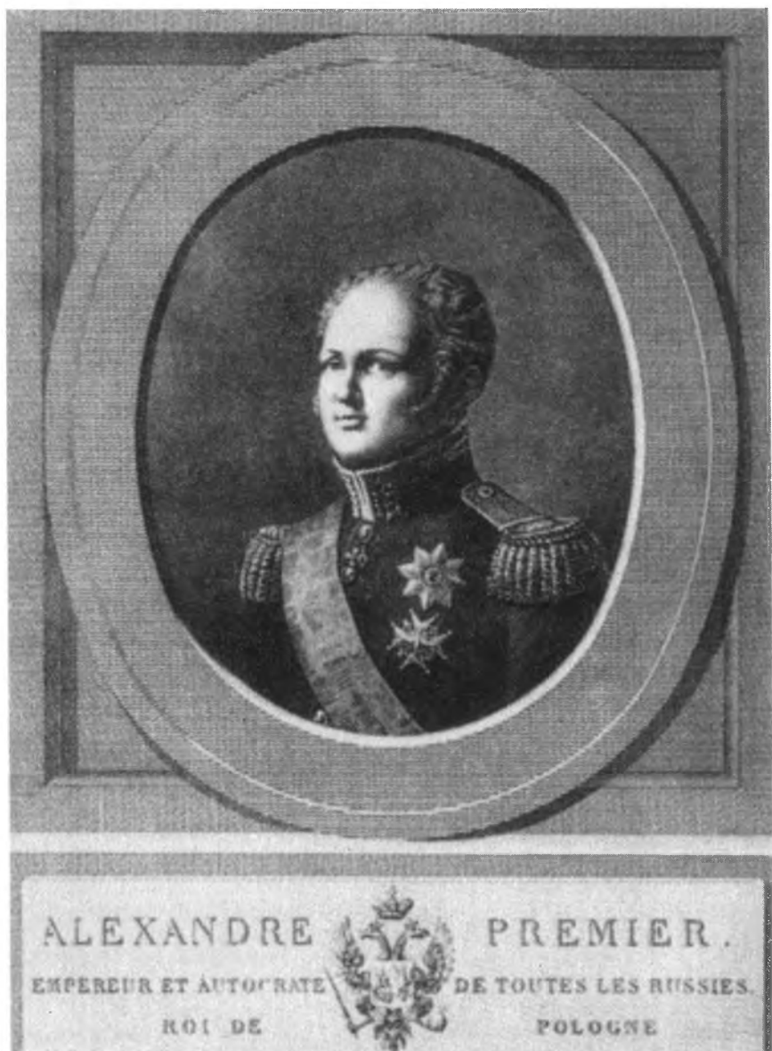
Император Александр I. Гравюра Одуена с портрета Бурдона