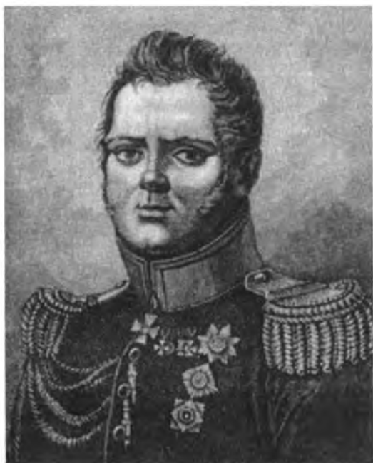
Великий князь Константин Павлович. Гравюра С. Карделли