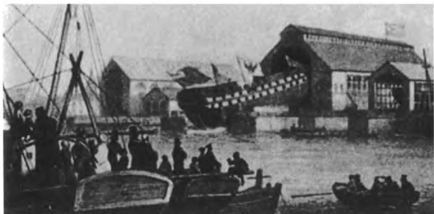
Спуск линейного корабля в Петербурге, 1851 г. (с русской литографии)