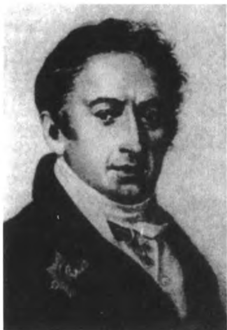
Н. М. Карамзин