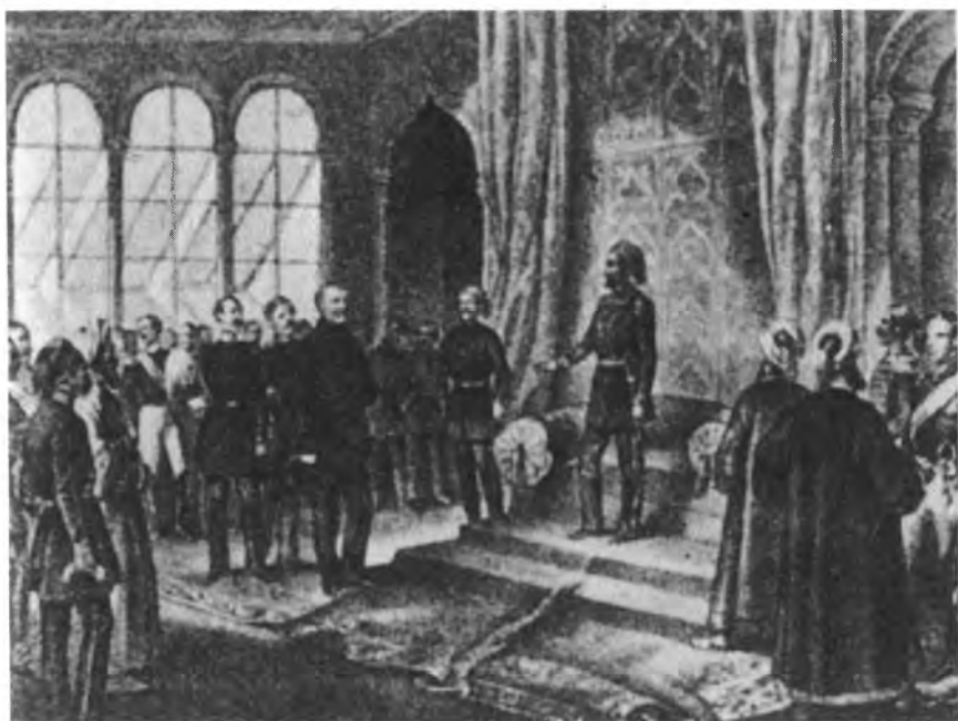
Аудиенция князя Меншикова у султана. Май 1853 г.