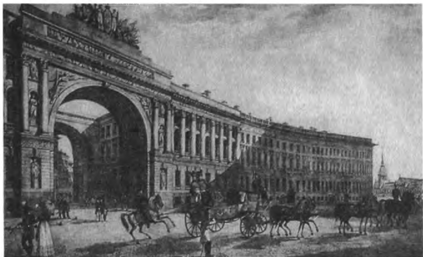
Арка Главного штаба. Литография К. Бегрова. Начало 1820-х гг.