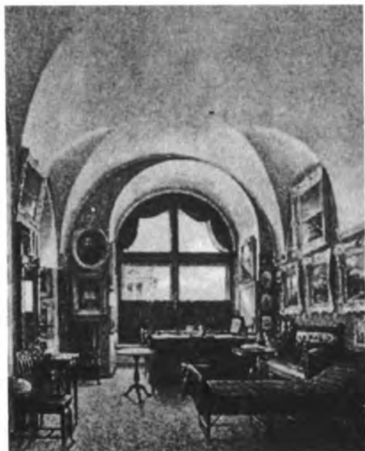
Кабинет Николая I в Зимнем дворце