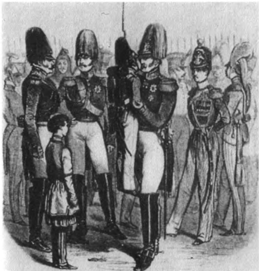
Христосование Николая I с кадетами (с французской гравюры на дереве)