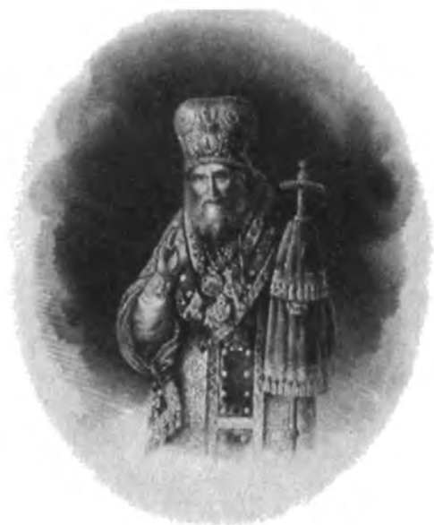
Филарет, митрополит Московский и Коломенский. С литографии Дарленг