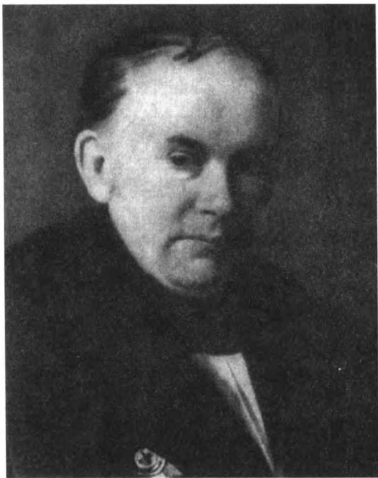
В. А. Жуковский