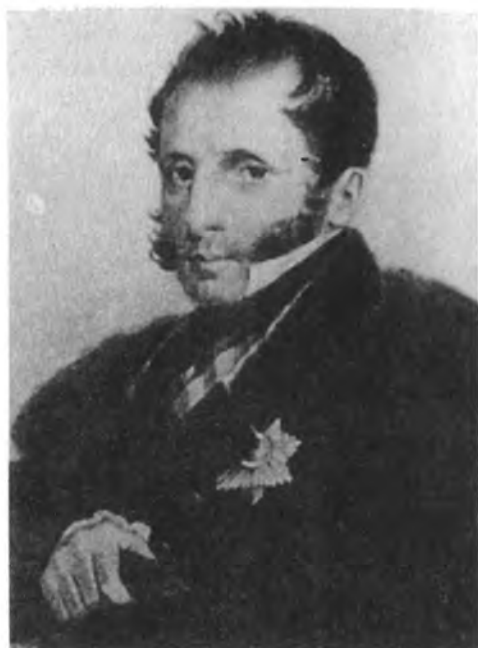
Граф С. С. Уваров. Портрет работы С. Дица, 1840 г.