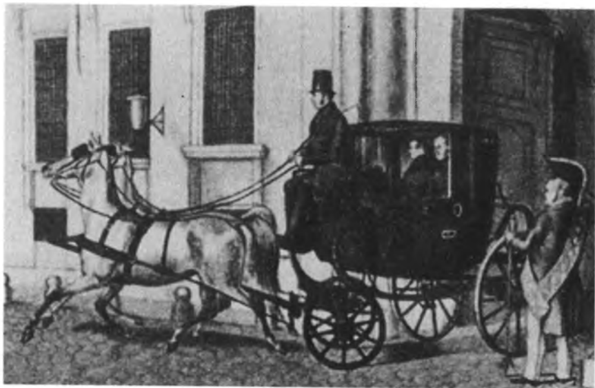
Император Николай I, выезжающий в фиакре из посольства в Вене в 1835 г. С литографии по рисунку А. Бенуа