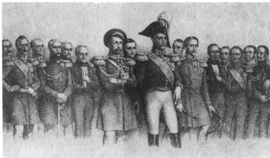
Николай I и его сподвижники в 1854 г. (с французской литографии)