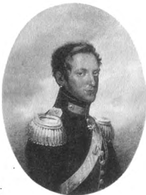
Великий князь Николай Павлович. Портрет работы Рокштуля. 1821 г.