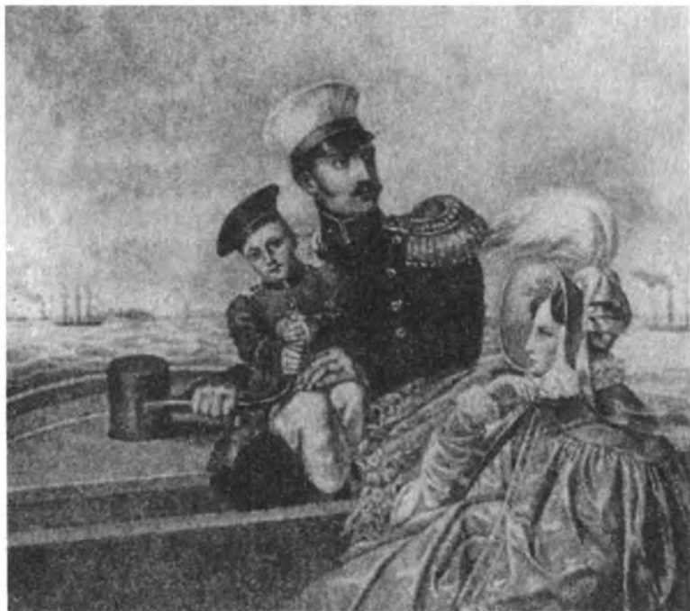
Николай I с семейством на катере (с русской литографии)