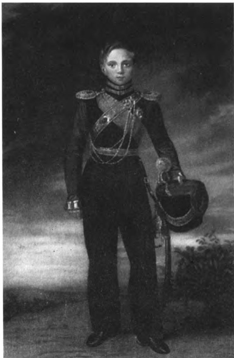
Цесаревич Александр Николаевич. Портрет работы Д. Доу