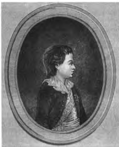
Великий князь Николай Павлович в детстве. Гравюра начала XIX в.

Манифест 6 июля 1796 г. о рождении великого князя Николая Павловича