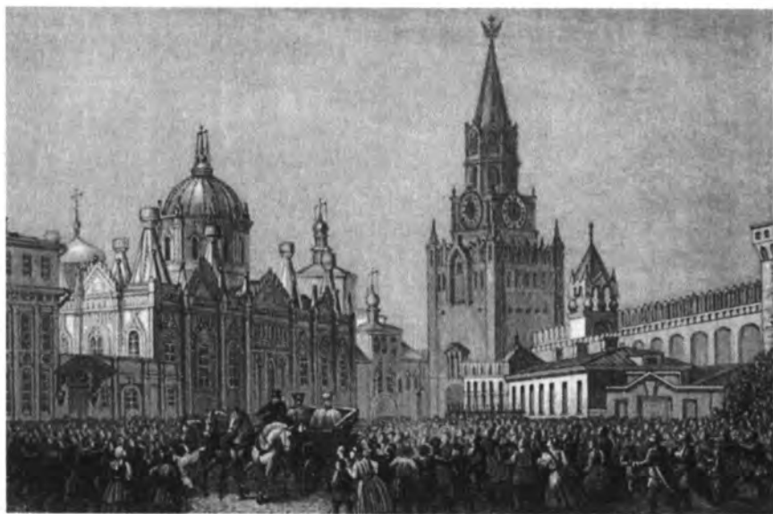
Въезд императора Николая I в холерную Москву в 1830 г. Литография 1830-х гг.