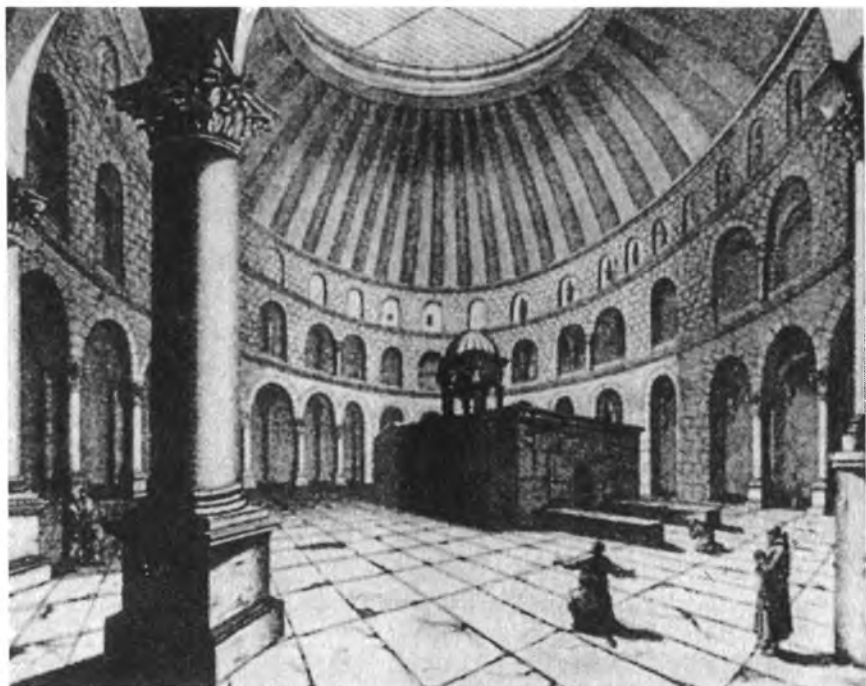
Внутренний вид храма Гроба Господня (с голландской гравюры)