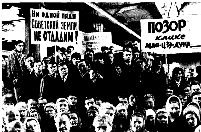
Митинг на советском предприятии после советско-китайского пограничного инцидента на острове Даманский в марте 1969 г. Еще десять лет назад эти люди пели: «Русский с китайцем – братья на век»