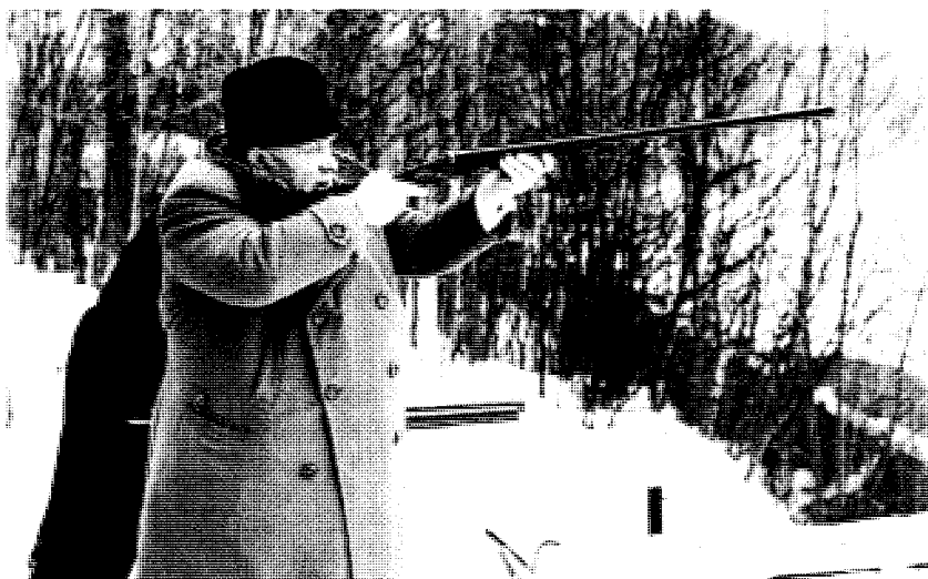
Вооружен и опасен. Хрущев любил рисковать в международной политике, но еще больше любил охоту