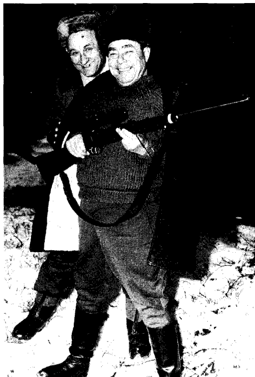
«Разрядка» при Брежневе происходила не только в международных отношениях. Генеральный секретарь и Эгон Бар, советник канцлера Федеративной республики Германия, расслабляются в охотничьем хозяйстве Завидово