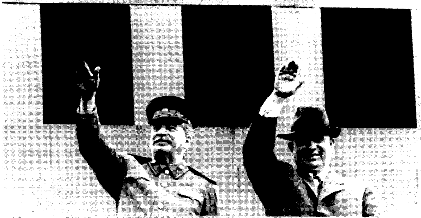
Иосиф Сталин и его будущий разоблачитель Никита Хрущев на трибуне Мавзолея Ленина (1949 или 1950 г.)