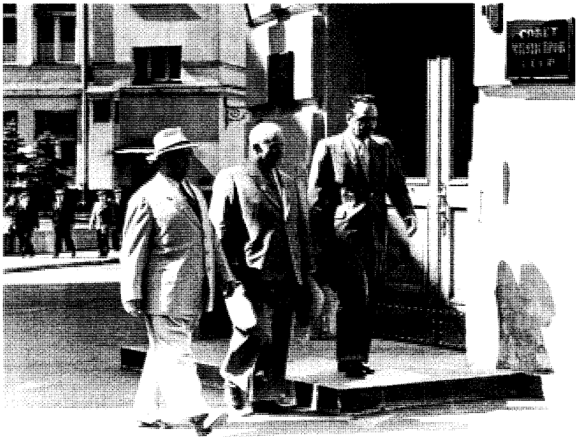
Никита Хрущев, Анастас Микоян и Георгий Маленков идут на работу в Кремле (1954 г.)