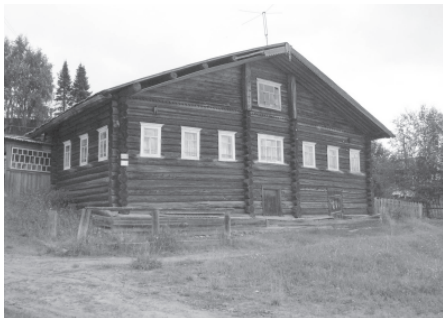
Традиционный дом удорских коми. Село Кослан, Удорский район Республики Коми. 2007 г.