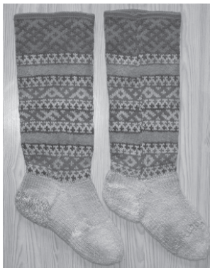
Традиционные вязанные узорчатые чулки удорских коми. Село Вильгорт, Удорский район Республики Коми. 2006 г.

пожилые женщины. До сих пор среди коми населения соблюдается запрет на обряжение покойного в вязанные чулки с орнаментальным мотивом косого креста.