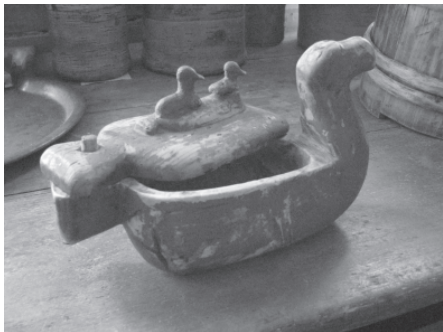
Деревянная солонка в виде утки. Село Ижма, Ижемский район Республики Коми, 2007 г.

ским делом. Практически каждый взрослый крестьянин владел технологией и навыками работы по дереву и был способен изготовить из него любой предмет, необходимый в личном хозяйстве. Вплоть до середины XIX века в деревообработке у коми преобладали простейшие технологические операции: рубка, обтесывание, долбление, сверление. Основными рабочими инструментами были: топор ( чер ), тесло ( керанчер ), скобель ( гöгын ), долото ( öжин ), резец ( кандрас ) и нож