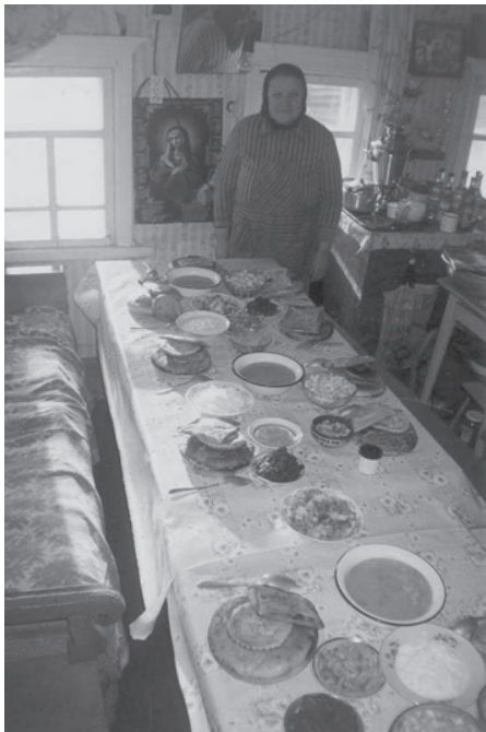
Традиционный поминальный стол удорских коми. Село Чупрово, Удорский район Республики Коми. 2006 г.