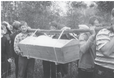
Похороны в с. Соколово. Печорский район Республики Коми, 1997 г.