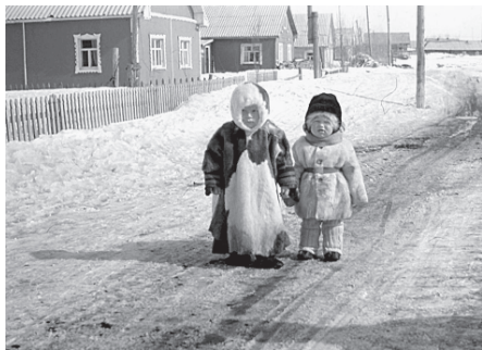
Детская меховая одежда ижемских коми. Село Петрунь, Интинский район Республики Коми, 1993 г.

15–20 см из летней шкуры оленя с более низким и плотным волосом. Обязательным элементом малицы стал пришитый наглухо капюшон ( юра малича ) с опушкой из меха по краю и вшитыми замшевыми тесемками, позволяющими регулировать степень открытости лица. Поверх повседневной малицы мужчины и в настоящее время носят сатиновый или хлопчатобумажный чехол-накидку ( малича кышед или кышан ), в целом повторяющий по покрою малицу. Многие муж-