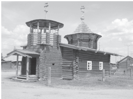
Часовня Параскевы-Пятницу, д. Кривой Наволок, Удорский район Республики Коми, 2006 г.

живых и миром мёртвых был нежелателен (например, в случае смерти зловредного колдуна), похороны рекомендовалось производить с нарушением ряда общепринятых норм, чтобы отправленный в мир мёртвых потенциально опасный для живых покойник утратил какую-либо связь с миром земным. В целом, у коми пережитки культа предков и вера в сохранение, необходимость и желательность взаимодействия между мирами