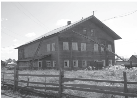
Традиционный дом ижемских коми. Село Ласта, Ижемский район Республики Коми, 2007 г.