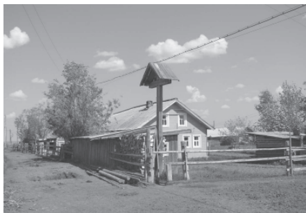
Обетный крест на въезде в с.Гам. Ижем- ский район Республики Коми, 2007 г.