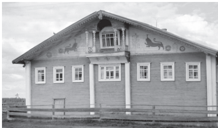
Традиционный дом коми-зырян с росписью на фронтоне, конец XIX века. Село Остров, Удорский район Республики Коми. 1990 г.

охлупня (массивного бревна, венчающего двухскатную крышу). Ей придавалась форма головы фантастического существа, объединяющего в своем облике коня и птицу. Стилизованные деревянные изображения птиц иногда укрепляли на специальных шестах и использовали в качестве флюгера. В северных районах – на Вашке, Печоре, Ижме – охлупень украшали рогами оленя или лося.