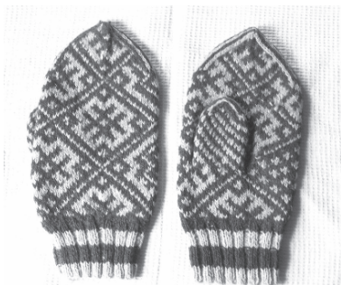
Традиционные вязанные узорчатые варежки. Село Чупрово, Удорский район Республики Коми. 2006 г.

нам, но и по принадлежности к определенному полу и возрасту. Например, на подростковых вязаных чулках украшается только верхняя часть паголенка чулка. На мужских верхняя часть паголенка всегда украшается семиричными бордюрами, а внизу – сетчатым или каким-либо другим узором. На женских чулках сетчатый узор может располагаться и в верхней части паголенка. Чулки с орнаментом в поперечную полосу по всему полю паголенка чаще носили