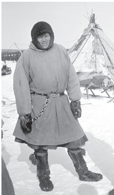
Традиционная меховая одежда ижемских оленеводов. Село Адзьвавом, Интинский район Республики Коми, 1993 г.