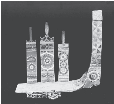
Традиционная роспись по дереву вычегодских коми, нач. XX века. Национальный музей РК.

воды и кваса, ведра, колодезные бадьи, ушаты, подойники, банные шайки, кадки, лохани и другая деревянная утварь из ели, сосны, березы, ольхи, осины. В начале XX века в пригородном селе Слобода выделкой деревянной посуды на продажу занималось до 30 человек. На Печоре спросом пользовались бочки для засолки рыбы. Крупнейшими бондарными