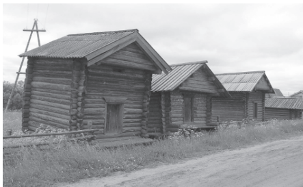
Традиционные амбары на столбах у удорских коми. Село Чупрово, Удорский район Республики Коми. 2006 г.