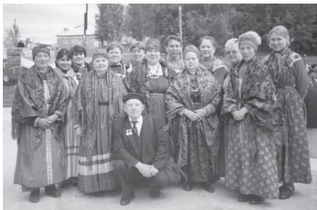
Фольклорный женский коллектив удорских коми. Село Коптюга, Удорский район Республики Коми. 2006 г.

ныне широко распеваются в коллективах художественной самодеятельности современные песни самодеятельных авторов. Все старое и новое в песенно-музыкальном народном творчестве составляет ценный фонд национальной музыкальной культуры народа коми.