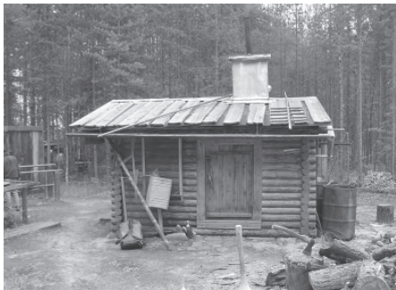
Современная промысловая избушка печорских коми-охотников. Село Якша, Троицко-печорский район Республики Коми, 2006 г.