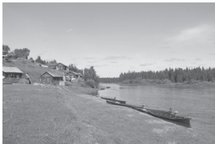
Традиционная лодка печорских коми. Троицко-печорский район, с. Усть-Унья, Республика Коми. 2006 г.