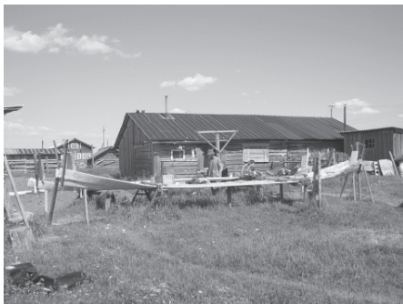
Изготовление традиционных лодок у современных ижемских коми. Село Ласта, Ижемский район Республики Коми, 2007 г.

ли запоры для ловли рыб. При передвижении на плотях отталкивались шестами. Использовали плоты и в качестве паромов.