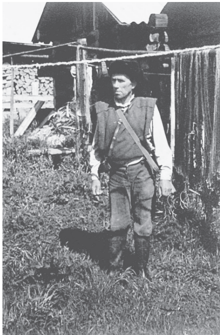
Традиционная одежда промысловиков у летских коми. Прилузский район Республика Коми, 1993 г.