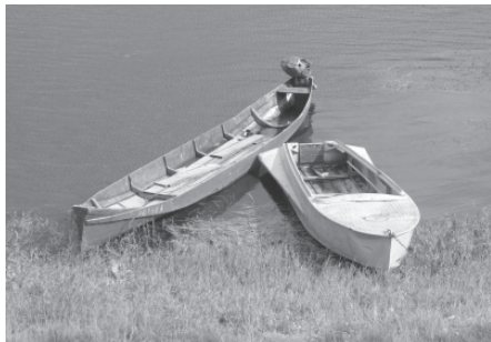
Традиционные и современные лодки удорских коми. Село Пысса, Удорский район Республики Коми. 2007 г.