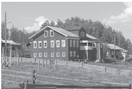
Традиционный дом ижемских коми. Село Мохча, Ижемский район Республики Коми, 2007 г.