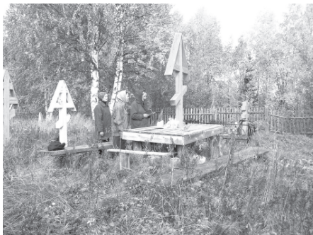
Поминки у обетного креста на кладбище в с.Парч, Усть-Куломский район Республики Коми. 2003 г.

живых и мёртвых доминировали над христианскими представлениями о пребывании душ умерших либо в раю, либо в аду.