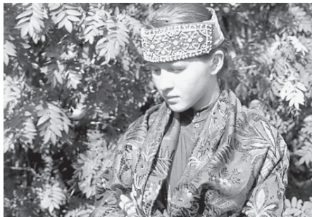
Бисерный орнамент на головном уборе невесты у печорских коми-зырян. Село Соколово, Печорский район Республики Коми, 1993 г.

(Ижма), юркӧртӧд или сорока (Прилузье, Сысола). Головные уборы на твердой основе – сборник (Вычегда, верхняя Печора), самшура и кокошник (Печора, Вычегда, Вымь). Сборник имел коническую форму и состоял из мягкого чепца и твердого околышка. Самшура – чепец неправильной трапецевидной формы, сшитый из кумача, с твердым дном, по краям обшит твердым валиком. Кокошник представлял собой чепец, сшитый из кумача, на холщовой подкладке. Спе-