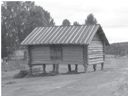
Традиционный амбар на столбах. Село Якша, Троицко-печорский район Республики Коми, 2006 г.

также пывсян (банька). Охотничья избушка представляла собой бревенчатую постройку 3х3 или 3,5х3,5 м высотой 2–2,5 м. Наиболее крупные по размеру избушки редко превышали в длину и ширину 4,5–5 м. Основная, или базовая, вөр керка обычно имела также рубленные из бревен сени, находившиеся под одной с ней крышей. Сруб ставился прямо на землю. Крыша обычно была односкатной, для покрытия использовались доски, вытесанные из половинок бревна.