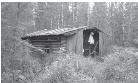
Традиционная охотничья избушка. Село Покча, Троицко-печорский район Республики Коми, 2007 г.