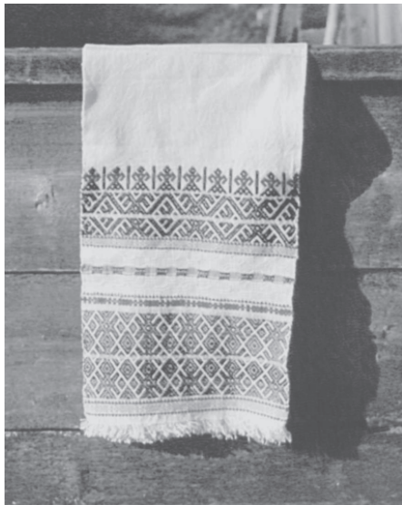
Традиционные тканые узорчатые полотенца. Село Чупрово, Удорский район Республики Коми. 1993 г.

мя видами браной техники – одноуточное и двууточное, которая характерна для населения западной части