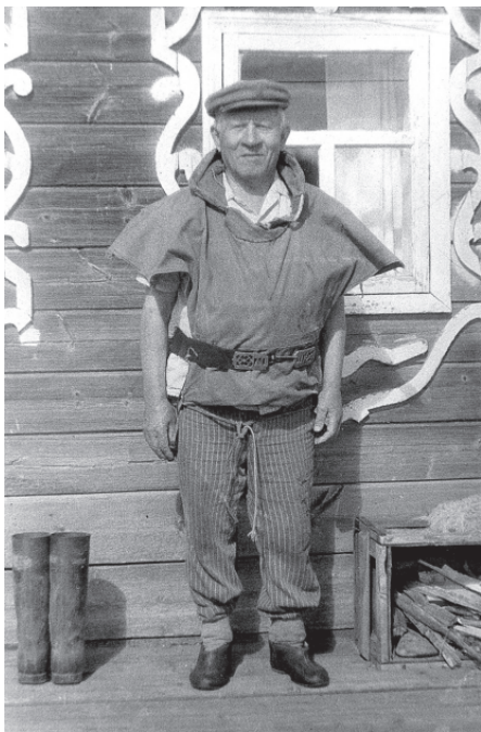
Традиционная одежда промысловиков у ижемских коми. Село Сизябск, Ижемский район Республика Коми, 1993 г.