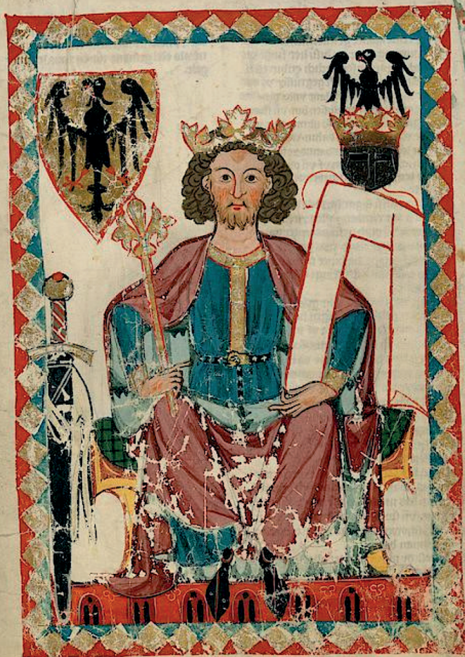
Император и король Германии и Сицилии Генрих VI