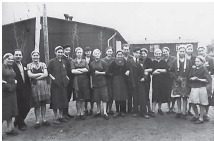
Фото 1. Остарбайтеры 1943—1945 гг.