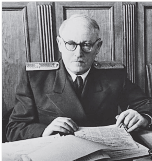
Фото 5. А.Я. Вышинский, в 1949—1953 гг. министр иностранных дел СССР

Оп. 6. Д. 91. Л. 108]. Предвидя такую ситуацию, советское руководство издало директиву, в которой определение гражданства СССР было четко прописано и указывалось, что «эти люди будут репатриированы, каково бы ни было их личное желание». К.Д. Голубев сообщал А.Я. Вышинскому, что в американских лагерях большое количество советских граждан, преимущественно жителей Прибалтики, западных областей Украины и Белоруссии, которые, желая избежать репатриации, выдавали себя за поляков или «бесподданных» [Там же. Д. 89. Л. 127].