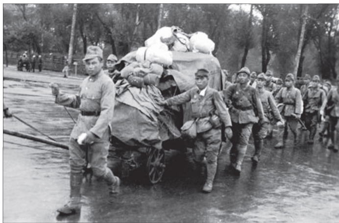
Фото 13. Раздача риса японским военнопленным

В стране действовала жесткая карточная система, обеспечивавшая людям лишь полуголодное существование. В.С. Дергачев, бывший инспектор учетного отдела лагеря № 153, расположенного в Нижнем Тагиле, вспоминал: «Кормили (военнопленных. — Авт. ) сносно, но не стабильно. Узники ГУПВИ в полной мере ощутили на себе всю тяжесть повседневной жизни в советском плену. Набор продуктов был разнообразным. Военнопленным давали шоколад, масло, красную рыбу, сыр, но в мизерных количествах. Как правило, они это копили с тем, чтобы обменять их на что-то более существенное в столовой, например на макароны» [51, с. 130].