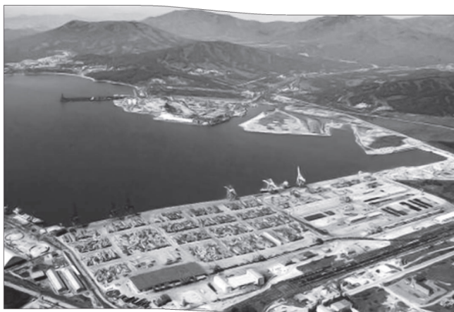
Фото 20. Порт Восточный (современный вид)

Показатели развития сельского хозяйства в 1970-х гг. в регионе характеризовались следующими данными: среднегодовой объем валовой продукции сельского хозяйства в Приморском крае составил 395,5 млн руб., в Амурской области чистый доход совхозов и колхозов — 225 млн руб. В первой половине 1970-х гг. на Дальнем Востоке построены 12 свиноводческих комплексов, 4 — по производству мяса, 24 — по производству молока, 4 — овощеводческих и 21 птицефабрика. В Приморье были открыты Надежденская, Лучковская, Пограничная птицефабрики, в Хабаровском крае — Березовская, Партизанская, Комсомольская, Некрасовская, Майская, на Сахалине — Центральная, в Амурской области — специализированный совхоз Средне-Бельский. В 1970-х гг. на Дальнем Востоке насчитывалось около 600 колхозов и совхозов [14, с. 126].