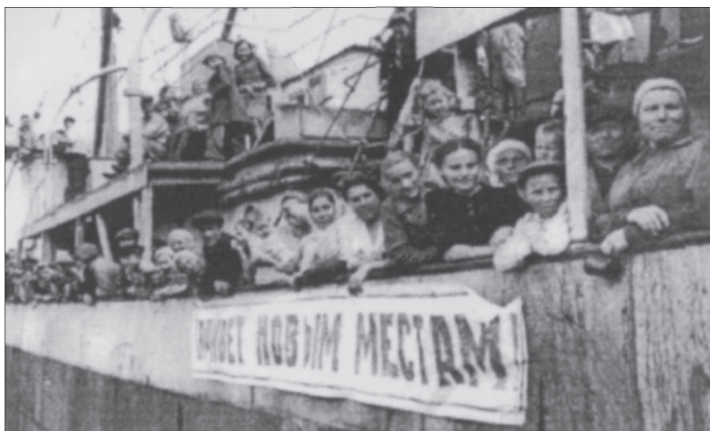
Фото 10. Сахалинские переселенцы в 1948 г.

встретили, накрыли столы [13, с. 104]. Конечно, такое отношение «старожилов» к новоселам было бы невозможным без участия и заинтересованности в переселенцах руководства колхозов. Однако чаще председатели колхозов ограничивались тем, что посылали кого-нибудь из правления колхоза для встречи переселенцев на станциях высадки, так как согласно инструкциям начальники эшелонов должны были передать переселенцев по «акту». В нем указывался пофамильный список прибывших, номера переселенческих билетов, имущество (корова, домашняя утварь). Если количество вселяемых семей не соответствовало документам, то дополнительно составлялся акт об изменении численности иждивенцев. Люди в пути находились 1—1,5 месяца. За это время в эшелонах менялась их численность. Так, в 1950 г. Московская контора направила в Сахалинскую область 1545 иждивенцев, к месту прибыло 1538 чел.: в пути 1 чел. родился, а 8 чел. умерли. Если в дороге кто-то заболел и нуждался в госпитализации — всю семью или частично снимали с поезда. После выздоровления их сажали в такой же переселенческий эшелон [ГАРФ. Ф. 9507. Оп. 2. Д. 842. Л. 192—193].