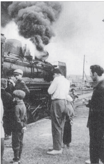
Фото 9. На юг — обживать новые места (Северный Сахалин, 1945)

Из-за недостатка рабочих рук постоянно срывались колхозами планы поставок мяса, молока, зерна и т.д. Несвоевременный расчет с государством по госпоставкам грозил для председателей большими неприятностями, чем срыв планов набора переселенцев. Колхозы-доноры никаких «преференций» не имели. Председателей колхозов поддерживали управленцы районов. Они всевозможными способами противодействовали оттоку работоспособного населения, что также влияло на выполнение планов отправки переселенцев. Так, в 1948—1950 гг. план от-