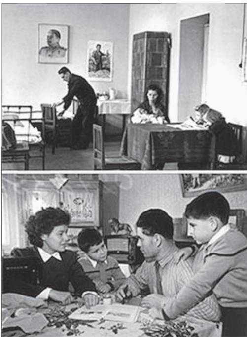
Фото 7. Переселиться из приемного пункта (вверху) в собственную квартиру (внизу) семья, вернувшаяся в СССР из Франции) удавалось немногим репатриантам

репатриация бывших российских подданных [14, с. 305]. Вернуться в СССР некоторые эмигранты хотели и ранее. Кроме эмоциональных и политических мотивов паспорт гражданина СССР давал им защиту и покровительство от некоторых притязаний японских и китайских властей.