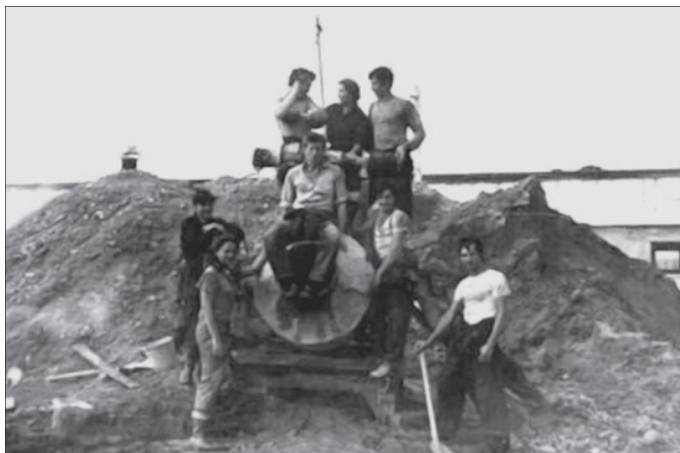
Фото 21. Стройотряд на строительстве коровника

студентов в развитие некоторых отраслей Дальнего Востока был значительным, особенно в условиях постоянного дефицита трудовых ресурсов.