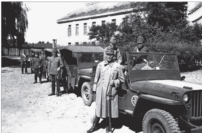
Фото 11. Эвакуация в тыл пленных японских генералов Квантунской армии советскими войсками

23 августа 1945 г. вышло постановление ГКО за № 9898сс «О приеме, размещении и трудовом использовании военных японской армии», а в шифровке № 3248 за подписью И.В. Сталина предписывалось 1-му Дальневосточному фронту (Мерецков и Штыков), 2-му Дальневосточному (Пуркаев и Леонов) и Забайкальскому (Малиновскому и Тевченко)