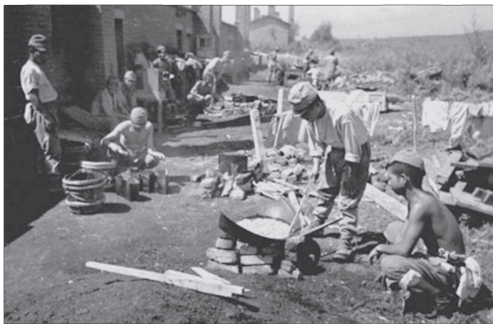
Фото 12. Японские военнопленные по пути следования в Чанчунь

фронтам совместно с представителями ГУПВИ НКВД отобрать 500 тыс. японских военнопленных. Основным условием переброски в Советский Союз японских военнопленных было их хорошее физическое состояние. Предполагалось, что их будут привлекать на работу в отрасли, где постоянно не хватало кадровых рабочих, — на лесозаготовки, строительство (гражданское, промышленное, железнодорожное) и т.д. Перед отправкой в СССР из них формировали рабочие батальоны по 10 тыс. чел. в каждом [57, с. 55—56]. С августа 1945 г. в восточной части страны начали функционировать 19 лагерей для их временного содержания. С ростом числа поступавших японцев количество лагерей увеличилось до 49. Они располагались в Красноярском крае, Узбекской и Казахской ССР, Бурят-Монголии, на Дальнем Востоке. Советскими военными органами было взято на учет 639 776 солдат и офицеров Квантунской армии [58], из них японцев — 609 448 чел., китайцев — 15 934 чел., корейцев — 10 206 чел., монголов — 3633 чел., маньчжуров — 486 чел., русских — 58 чел., малайцев — 11 чел. [ГАРФ. Ф. 9526. Оп. 6. Д. 385. Л. 205; 59, с. 22].