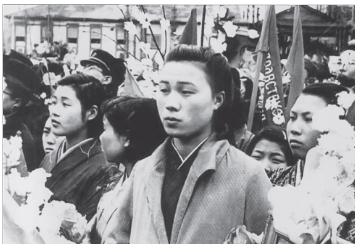
Фото 16. 1 мая 1946 г. (Сахалин)