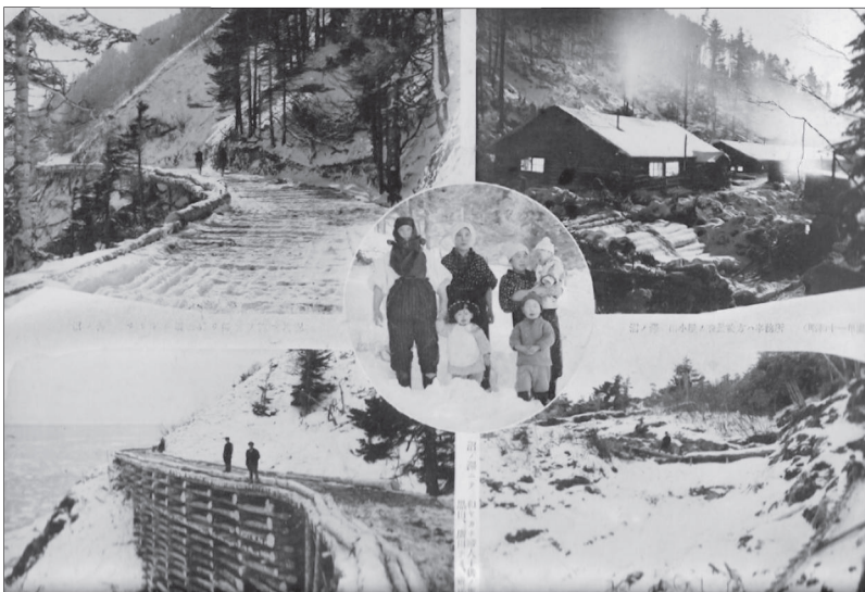
Фото 14. Японцы на Сахалине

и коммунальных предприятий и т.д. правительство СССР выделило 7900 тыс. руб. [ГАРФ. Ф. А-259. Оп. 6. Д. 3636. Л. 1]. Однако выполнение плана освоения выделенных сумм было возможно только при условии наличия на Сахалине советских кадров. Вопрос обеспечения Сахалина трудовыми ресурсами оставался наиболее острым. К моменту прихода советских войск в южную часть Сахалина насчитывалось 132 тыс. трудоспособных, в том числе в сельском хозяйстве — 41,7 тыс. чел., в рыбной промышленности — 13,6 тыс. чел., в угольной промышленности — 26,9 тыс. чел., в других отраслях промышленности — 27,2 тыс. чел., на железнодорожном транспорте и связи — 10,5 тыс. чел. Численность служащих различных контор достигала 12,1 тыс. чел. [ГАХК. Ф. П-35. Оп. 1. Д. 1854. Л. 52].