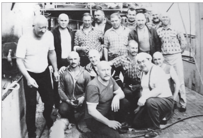
Фото 18. Сахалинские рыбаки

Рыбная отрасль также являлась традиционной для Дальнего Востока. В 1971—1980 гг. главным направлением в ее развитии стало укрепление материально-технической базы