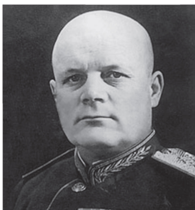
Фото 3. Уполномоченный по делам репатриации начальник ГРУ генерал Филипп Голиков

(военнопленные и беженцы), поступали в разные органы. 11 ноября 1944 г. газета «Правда» опубликовала интервью Ф.И. Голикова корреспонденту ТАСС, в котором была изложена позиция руководства СССР по вопросу репатриации советских граждан. В нем говорилось: «Люди, враждебно настроенные к Советскому государству, пытаются обманом, провокацией и т.п. отравить сознание наших граждан и заставить их поверить чудовищной лжи, будто бы Советская Родина забыла