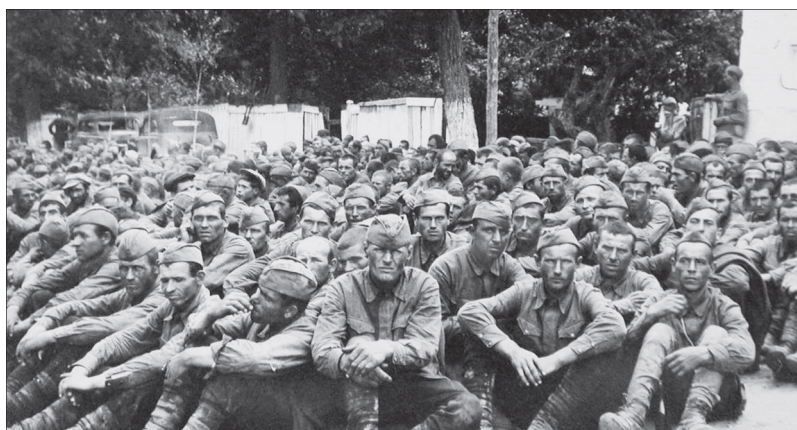
Фото 2. Советские военнопленные. Эти фотографии делали солдаты Вермахта, чтобы потом в родном фатерланде показывать, как они покоряли «великую Россию»