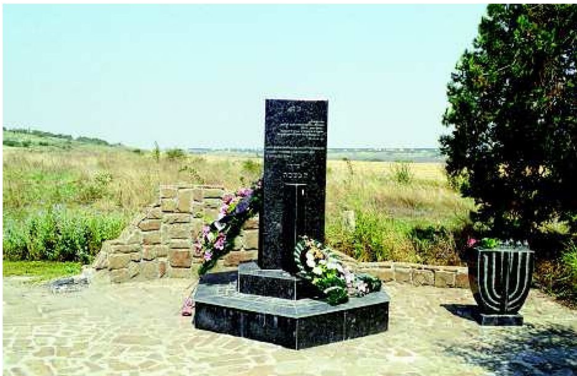
Памятный знак на месте гибели и захоронения евреев и крымчаков Симферополя, 10-й км шоссе Симферополь-Феодосия. Фото: Г. Россоланский, 2005

К выявлению евреев по приказу коменданта города была привлечена полевая жандармерия, которая обнаруживала евреев и передавала их в СД [254] . Этот же карательный орган осуществлял расправу с теми горожанами-неевреями, которые пытались укрыть обреченных: на столбах города висели люди с табличками «За укрывание евреев» [255] .