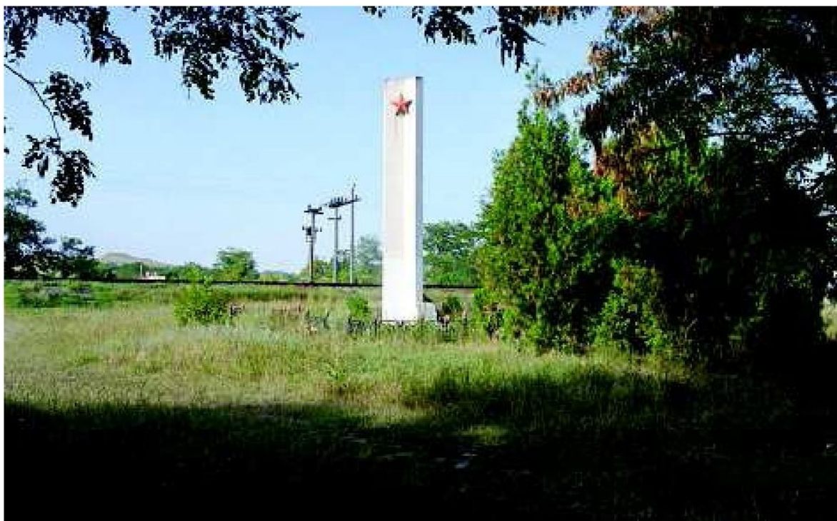
Памятный знак на месте расстрела евреев, пгт. Багерово. Фото: Г. Россоланский, 2005

Из ведомости, составленной статистическим бюро городской управы Симферополя в феврале 1942 г., следует, что накануне немецкой оккупации Бахчисарай покинули 680 человек, в том числе 120 евреев [65] . Из района эвакуировались 410 человек, в том числе 40 евреев [66] .