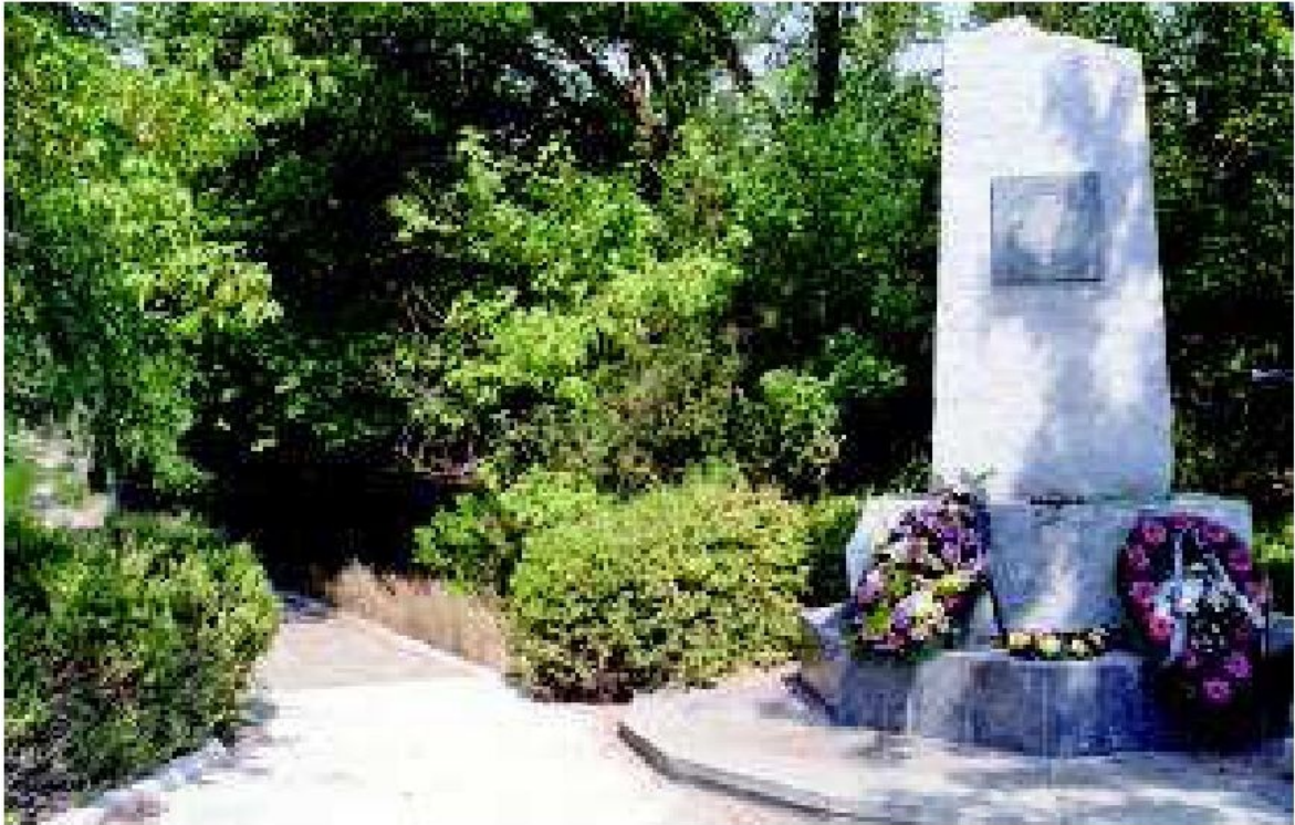
Памятный знак расстрелянным советским гражданам, установленный на 10-м км шоссе Симферополь-Феодосия.

Помимо органов СД, розыск и поимку скрывавшихся евреев в городе осуществляла вспомогательная полиция под командованием полицмейстеров Грановского, затем Федова, затем Буртышева, а также криминальная полиция под руководством Адамовича [265] . После ареста лиц, чье еврейское происхождение было установлено, арестованного и дело на него передавали в СД.