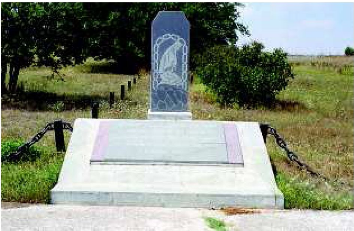
Памятный знак на месте захоронения погибших крымчаков Белогорска. Фото: Г. Россоланский, 2005

Из ведомости, составленной статистическим бюро городской управы Симферополя в феврале 1942 г., следует, что накануне немецкой оккупации Карасубазар покинули 870 человек, в том числе 250 евреев [71] . Из района эвакуировались 250 человек, в том числе 20 евреев [72] .