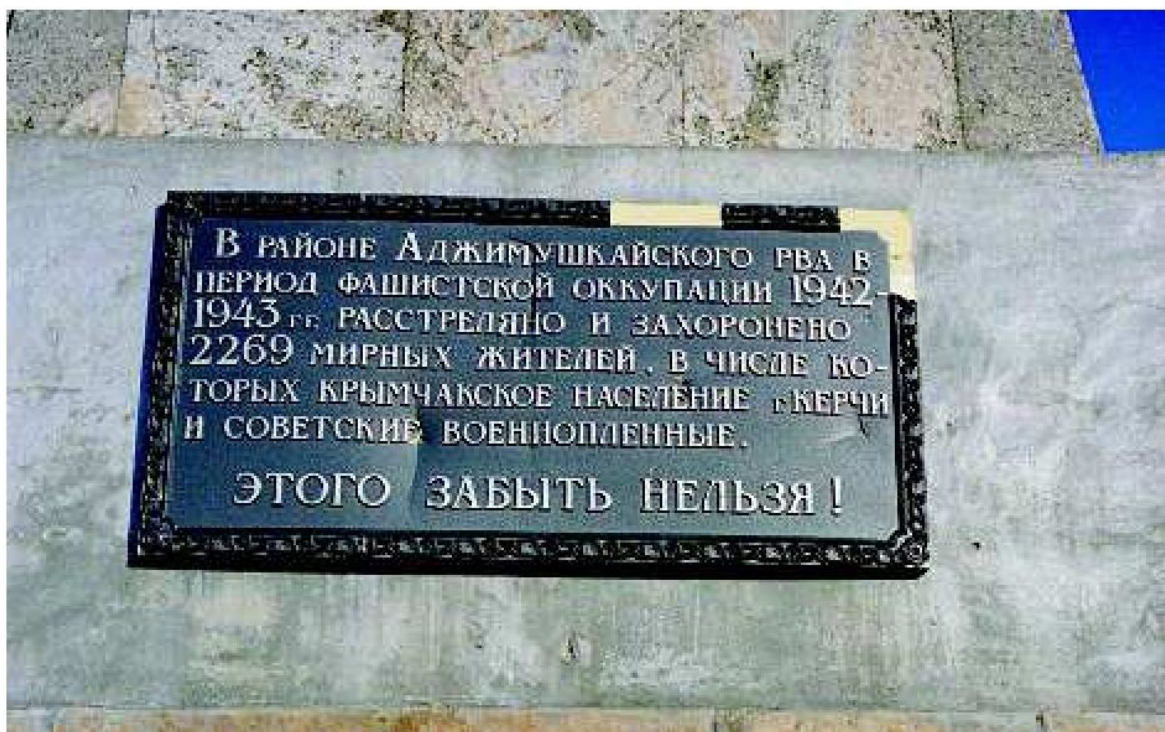
Фрагмент памятника погибшим крымчакам и советским военнопленным на Аджимушкайском перевале у г. Керчь. Фото: Г. Россоланский, 2005

В отчете ортскомендатуры I (V) 287 от 15 июля 1942 г. сообщалось, что Керчь «свободна от евреев и крымчаков» (die Stadt frei von Juden und Krimtschaken ist) [159] . Однако во второй половине июля керченская полевая жандармерия снова обнаружила в городе несколько евреев и крымчаков и передала их службе безопасности «для дальнейшего расследования» [160] . В первой половине августа полевая жандармерия снова обнаружила в городе и передала в СД евреев, которые, «обладая фальшивыми документами, пытались уклониться от ареста» [161] .