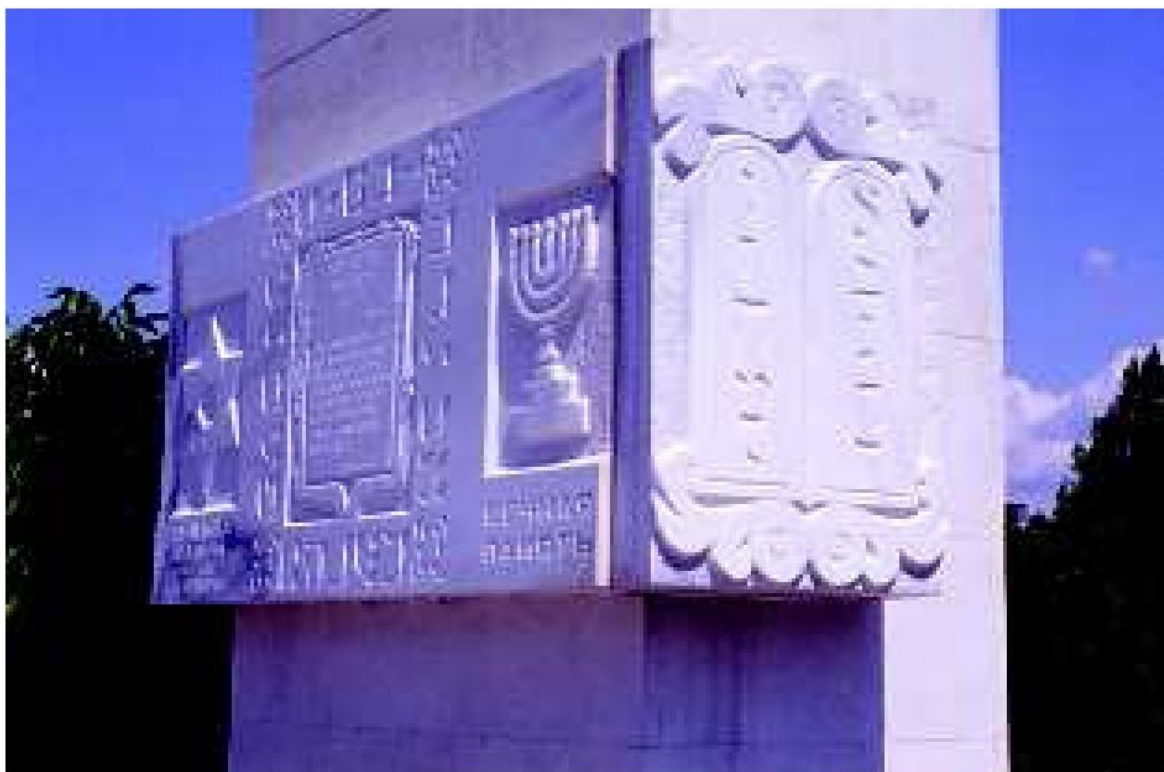
Фрагмент памятника погибшим евреям Евпатории. Фото: Г. Россолинский, 2005

11 ноября 1941 г. был подписан и издан приказ всем евреям собраться 20 ноября в назначенном месте под предлогом эвакуации. 20 ноября евреев города собрали в трехэтажное здание, в котором до войны находились курсы усовершенствования командного состава зенитной артиллерии (горожане называли это здание «Военный дом»).