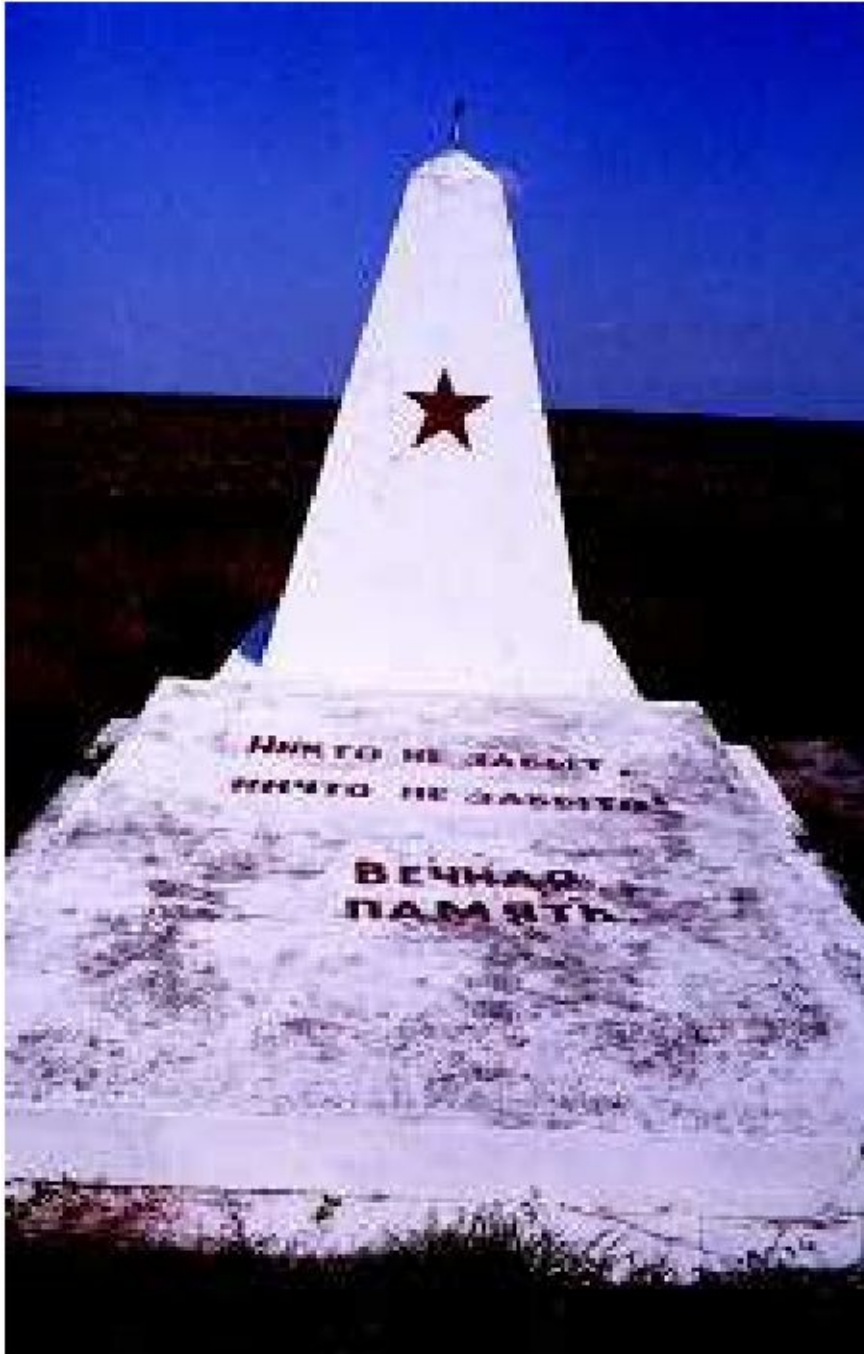
Памятный знак на месте гибели и захоронения евреев с. Березовка Раздольненского р-на. Фото: Г. Россоланский, 2005

Как сообщала местная комендатура 19 января 1942 г., после «выселения» крымчаков освободились 70 домов, вследствие чего армия получила возможность обеспечить личный состав 600–700 новыми квартирами [78] . Немногим менее месяца спустя та же ортскомендатура докладывала, что местное население сотрудничает с ней, в том числе и в