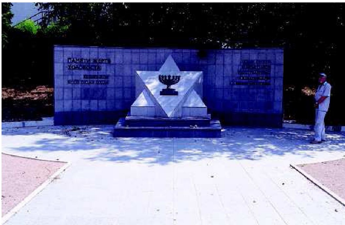
Памятный знак погибшим евреям Севастополя.

По переписи 1959 г. в Севастополе проживали 3100 евреев.