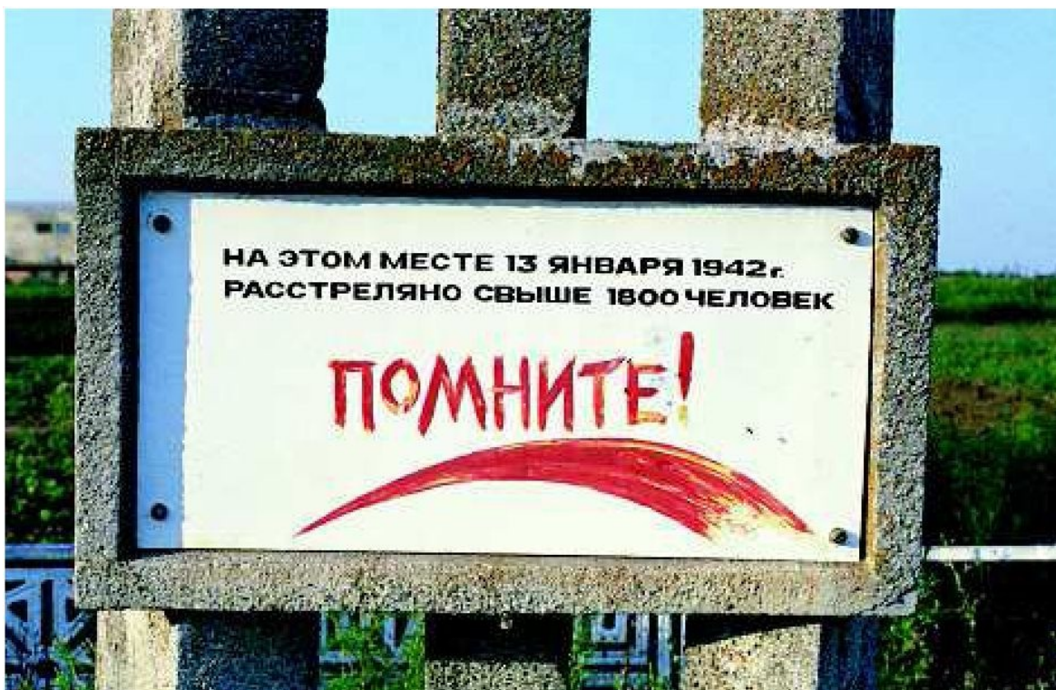
Фрагмент памятника на месте гибели и захоронения евреев в с. Майское Джанкойского р-на. Фото: Г. Россоланский, 2005

По сведениям ЧГК, до войны в колхозе проживали около 80 евреев, а также несколько русских, украинских и одна татарская семья. Перед оккупацией в колхоз прибыли несколько еврейских семей из других областей страны.