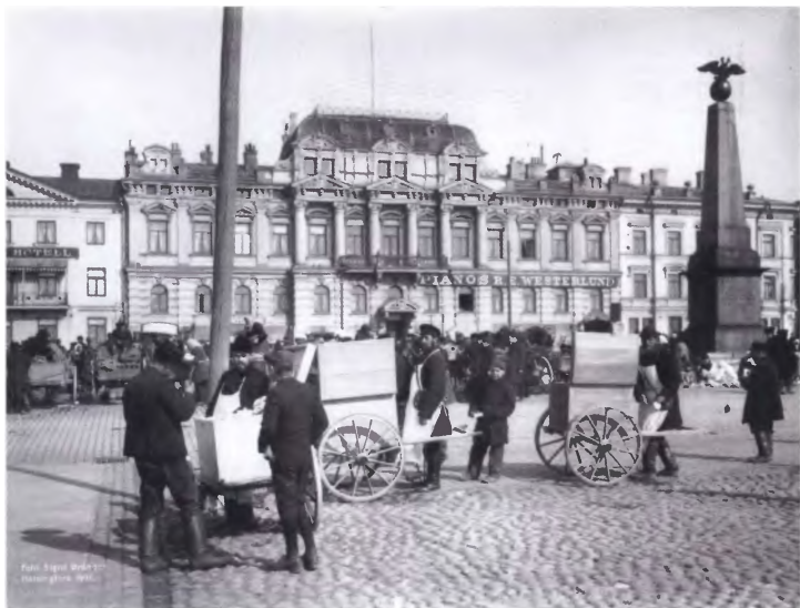
Продажа мороженого. Хельсинки. 1907 год