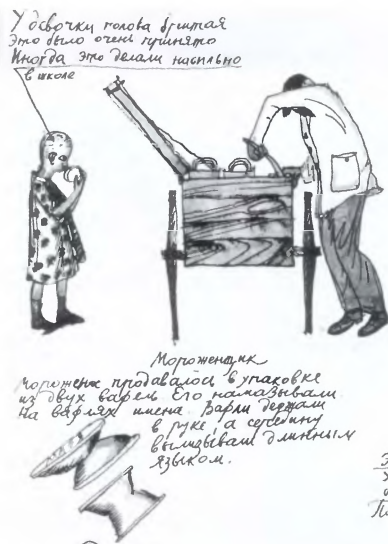
Художник В.С. Васильковский. Рисунок 1930-х годов