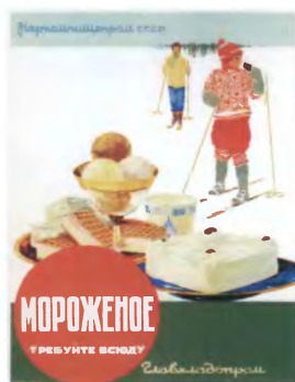
Рекламные плакаты. Ленинград. 1940—50-е годы