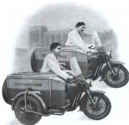
Мотоциклы с изотермическими колясками. Начало 1950-х годов