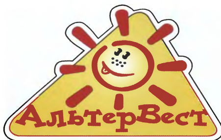
Логотип московской компании «АльтерВЕСТ»