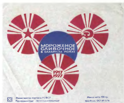
Обертка мороженого Ленхлагокомбината. 1977 год