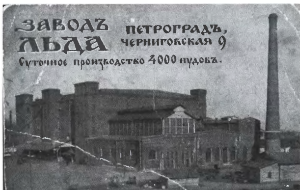
Завод льда в Петрограде. Открытка середины 1910-х годов