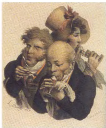
Любители мороженого. Художник Л. Бойи. 1825 год