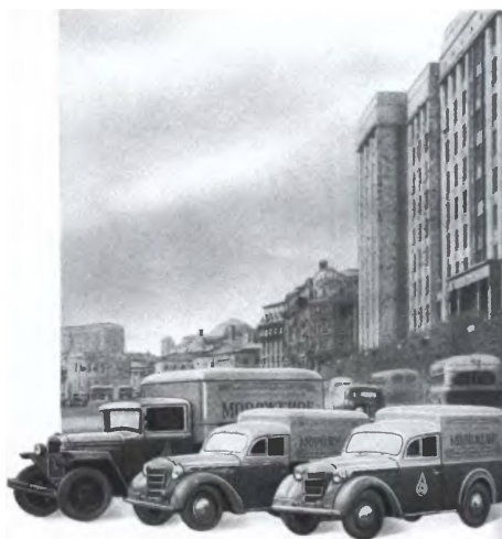
Авторефрижеры. Начало 1950-х годов