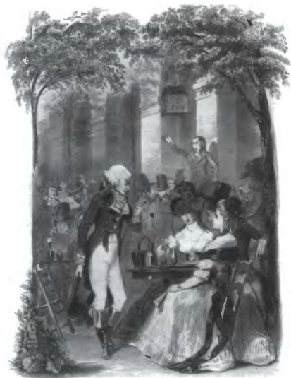
Мороженое в парижском «Кафе де Фуа». 1789 год