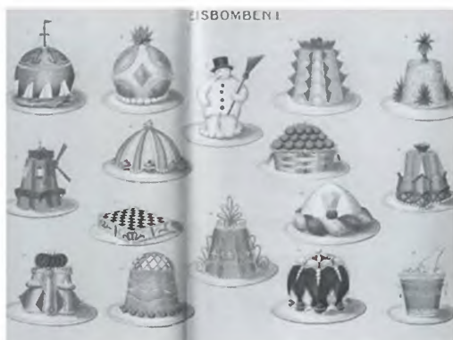
Бомбочки. Художник К. Шарер. 1907 год