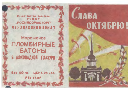
Обертки мороженого. Ленинград. 1960-е годы