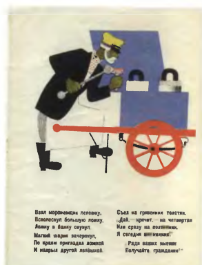
Иллюстрации В.В. Лебедева к книге С.Я. Маршака «Мороженое», 1925 год