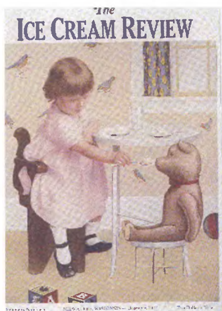
Обложка журнала The Ice Cream Review . Декабрь 1922 года