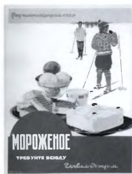
Рекламный плакат. 1938 год