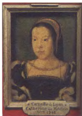
Екатерина Медичи. Художник Делион. Около 1548 года