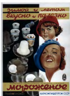
Рекламный плакат. 1937 год