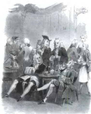
Кафе «Прокоп» в Париже. 1743 год