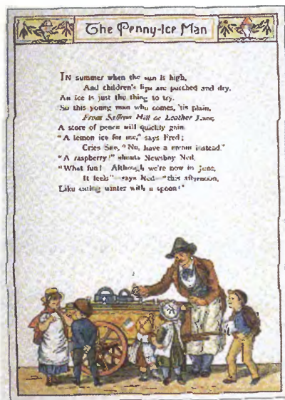
Продавец мороженого. Англия. 1900 год