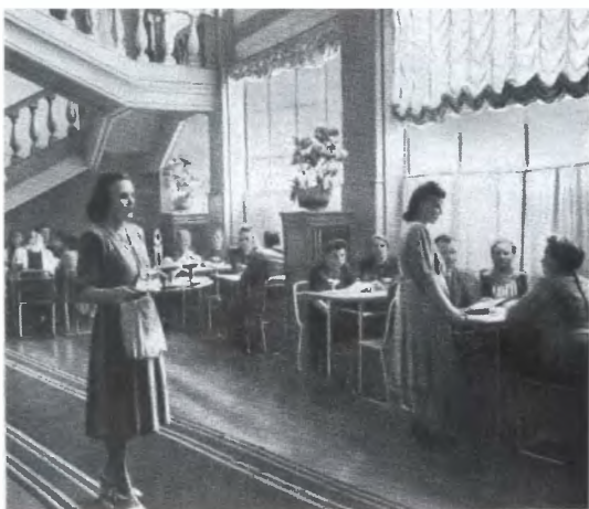
В московском кафе-мороженом. Начало 1950-х годов