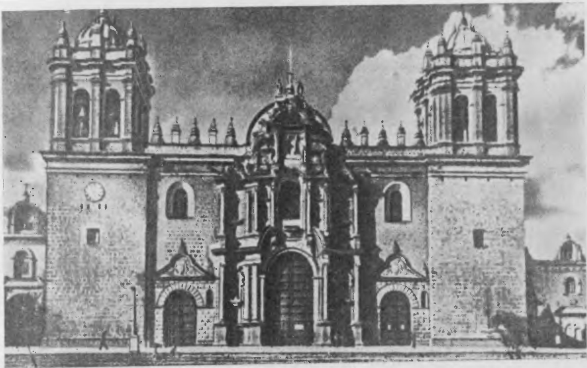
Собор в Куско