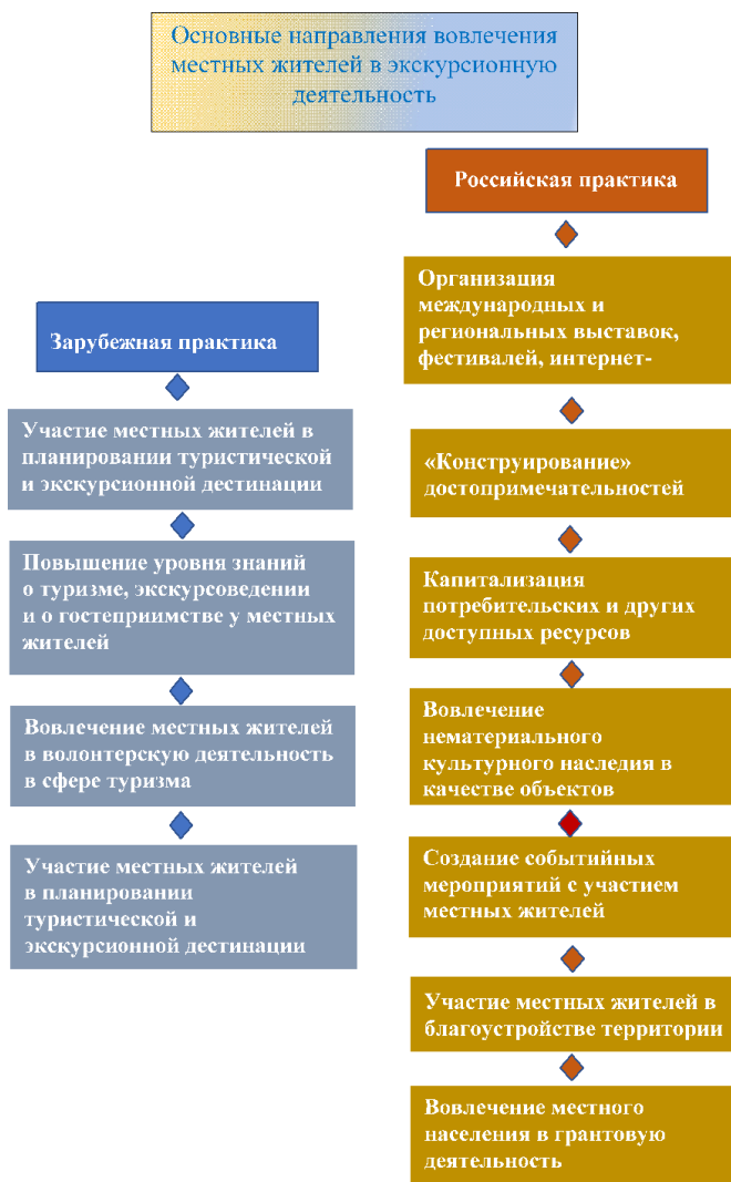
Рис. 2. Основные направления вовлечения местных жителей в туристическую деятельность

1. Участие местных жителей в планировании развития туристической дестинации. Исследователи подчеркивают важность вовлечения местных жителей в туристическую сферу, поскольку туризм оказывает влияние на экономику, социальную сферу, культуру и даже экологию