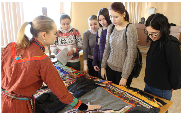
Рис. 3. Представители марийской д. Сарсы Красноуфимского городского округа Свердловской области проводят выставку национальных костюмов и ручного творчества

Местный житель может познакомить экскурсантов с традиционными марийскими ремесленными мастерскими, где создаются уникальные национальные изделия, а они обычно находятся во дворах сельских домов. Он может рассказать о том, какие традиционные элементы встроены в роспись местных домов, или о значении цветов и орнамента в местном национальном костюме (рис. 3).