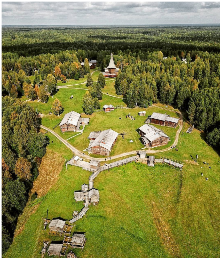
Рис. 1. Музей-заповедник деревянного зодчества «Малые карели» 1

Примером успешной интеграции экскурсий в местную экономику является создание тематических экскурсионных маршрутов, которые включают в себя посещение местных предприятий и ремесленных мастерских. Экскурсионный маршрут может вести через местные фермы, где посетители могут увидеть процесс производства локальных продуктов и даже участвовать в нем. Это не только способствует росту доходности фермеров, но и обогащает опыт экскурсантов.