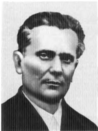
Иосиф Броз Тито – председатель Союза коммунистов Югославии. Организовывал отправку балканских добровольцев в Испанию