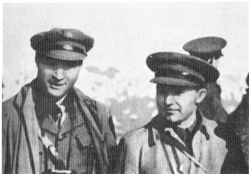
Военные советники – полковник Родионов (Р.Я. Малиновский) и комдив Максимов (К.А. Мерецков)