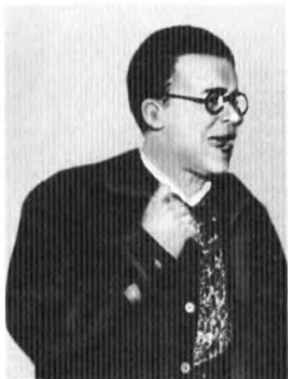
Сантьяго Каррильо – деятель испанского коммунистического движения