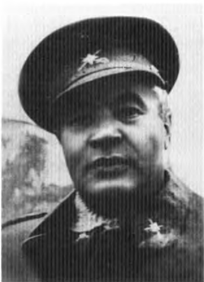
Кароль Сверчевский – командовал 14-й интернациональной бригадой и 35-й интернациональной дивизией республиканской армии Испании (вверху справа)