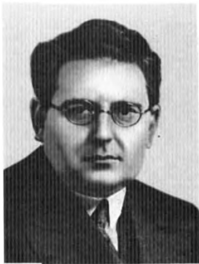
Витторио Кодовилья–секретарь Южноамериканского бюро Коминтерна, член Интернациональной Контрольной Комиссии Коминтерна. В 1938–1939 гг. работал в Париже по оказанию помощи республиканской Испании