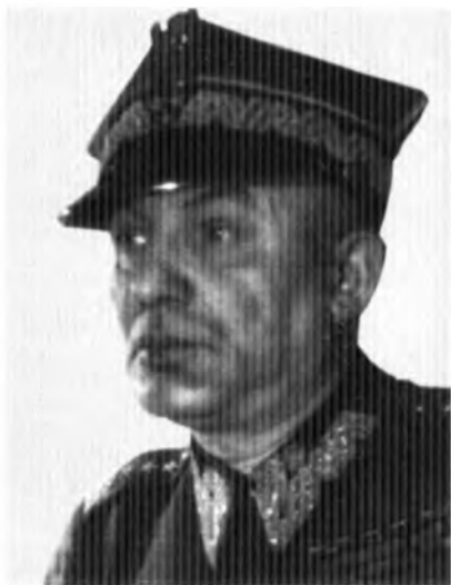
Хуан Модесто – командир знаменитого 5-го полка, ставшего в годы Гражданской войны базой для подготовки руководителей интербригад (вверху слева)