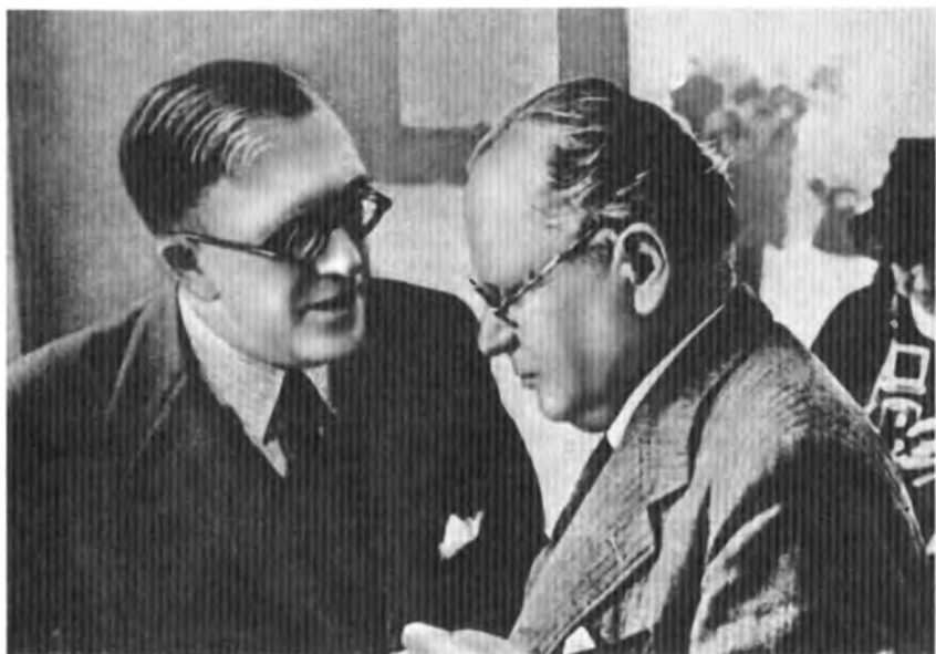
Хулио Альварес дель Вайо на встрече с М. Литвиновым