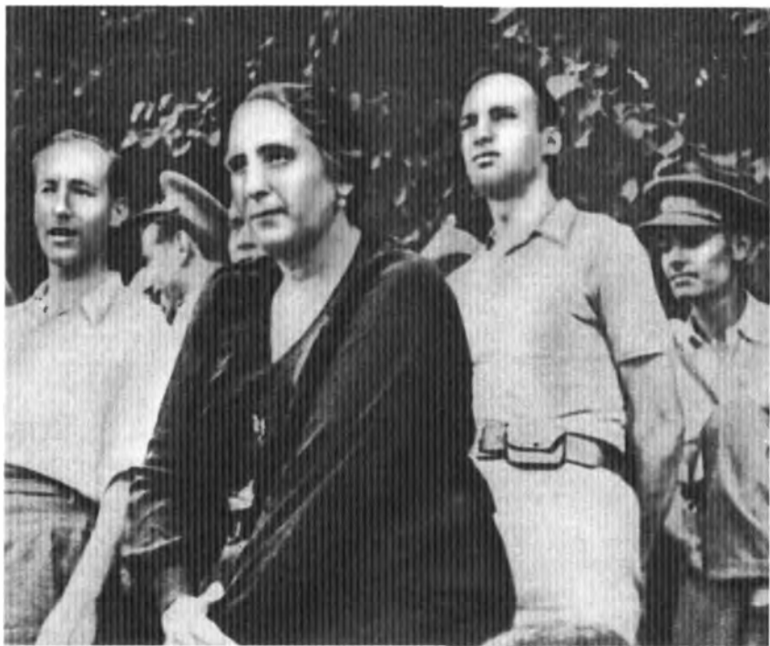
Долорес Ибаррури среди бойцов 5-го полка