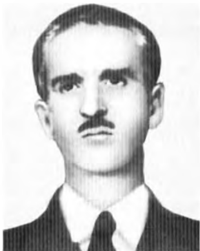
Полковник Игнасио Идальго де Сиснерос – командующий республиканской авиацией