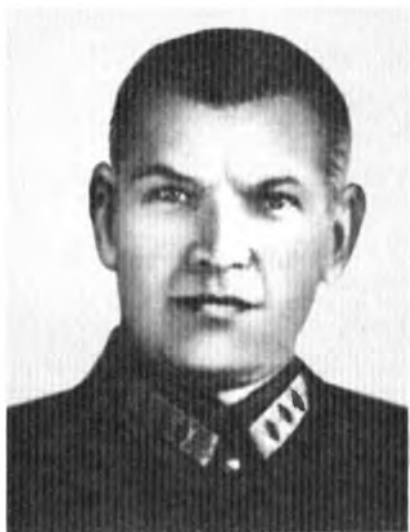
Генерал Я.К. Берзин. В 1936–1937 гг. был главным военным советником в Испании