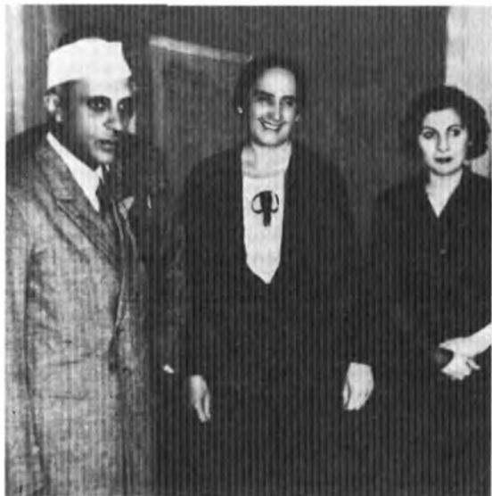
Долорес Ибаррури во время встречи с Джавахарлалом Неру в Барселоне в 1938 г.