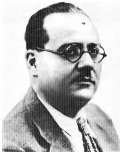
Хуан Негрин – премьер-министр республиканской Испании