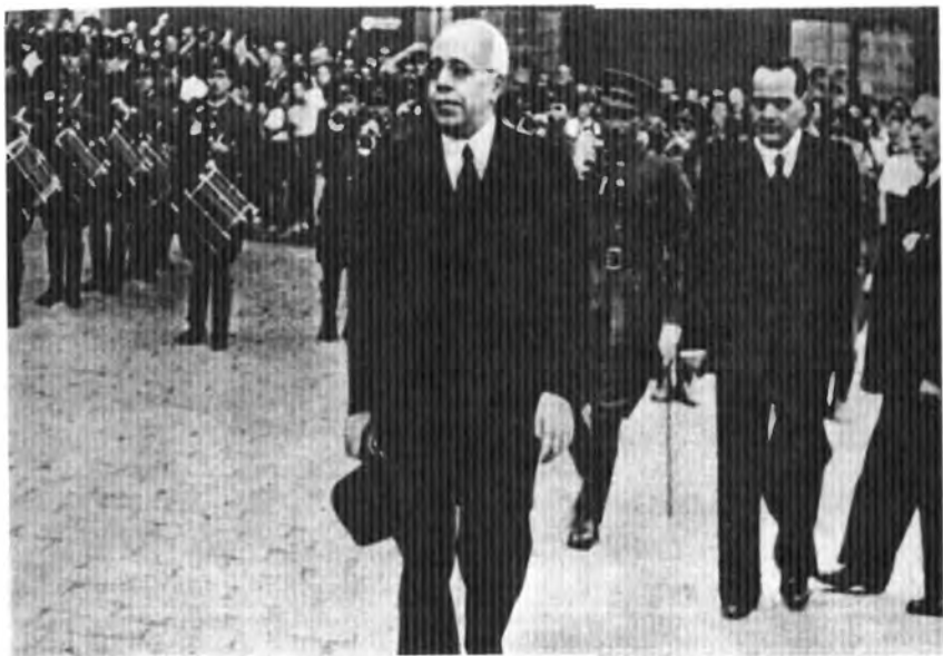
Президент Испанской республики Мануэль Асанья