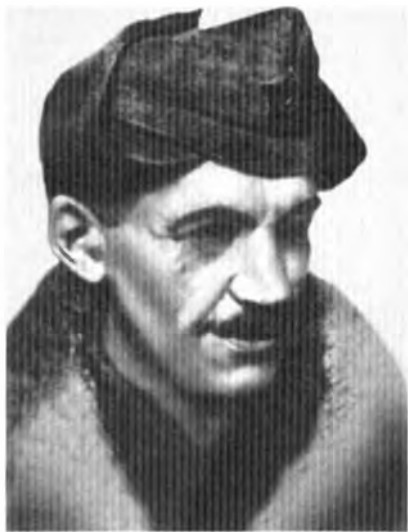
Ганс Баймлер – один из руководителей компартии Германии. Политкомиссар батальона им. Тельмана. Погиб в Испании в битве за Мадрид