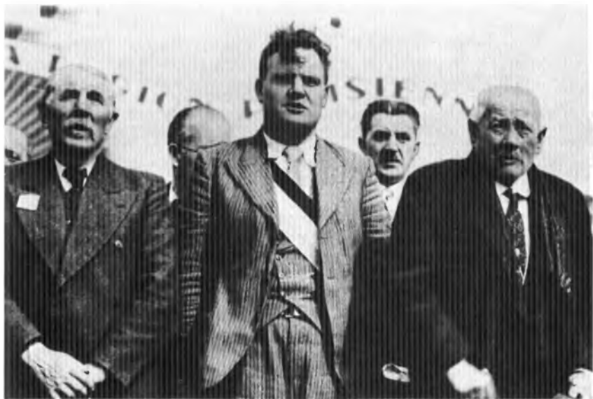
Марсель Кашен (слева) – деятель международного коммунистического движения; Морис Торез (в центре) – генеральный секретарь ФКП. Оба они принимали активное участие в деятельности Коминтерна и в заседаниях его секций по обсуждению положения в Испании