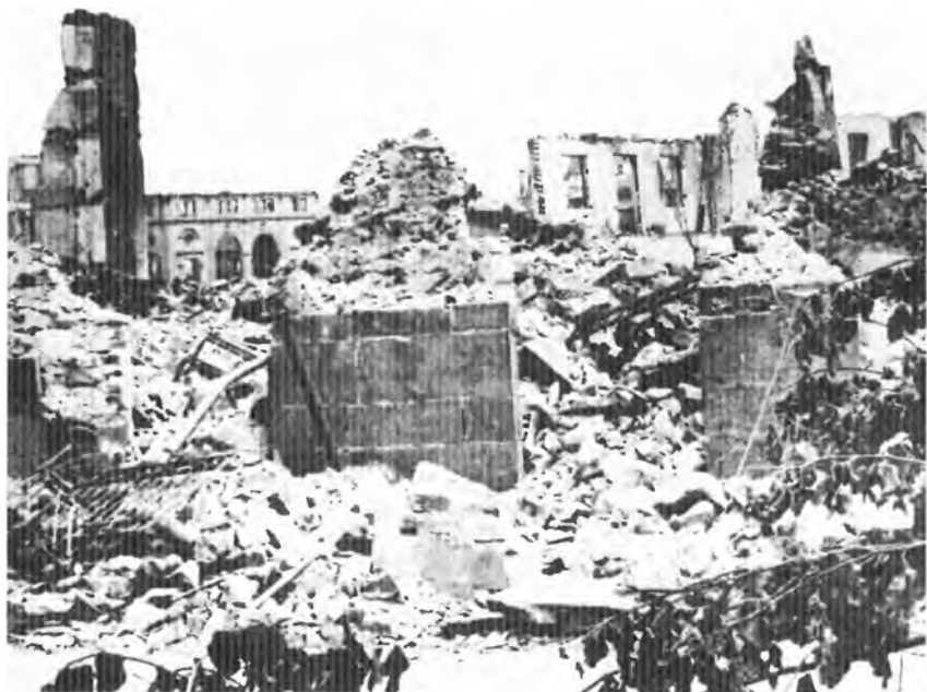
Так выглядела столица Страны Басков – Герника после бомбардировки в апреле 1937 г.