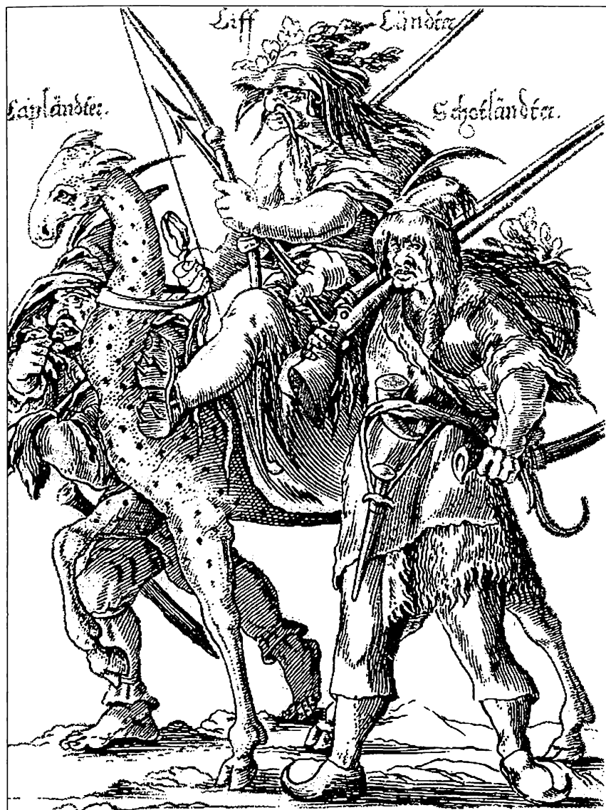
Карикатура начала XVII в. Жители северных регионов Европы