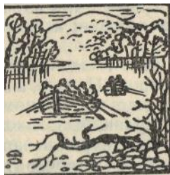
ОБОЗРЕНИЕ РЕКИ УССУРИ И ЗЕМЕЛЬ К ВОСТОКУ ОТ НЕЕ ДО МОРЯ