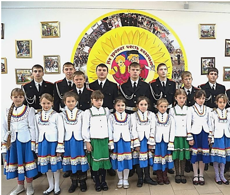
Общеобразовательное учреждение с кадетскими классами обучения. г. Курганинск. 2013 г.

ния для детей, попавших в трудную жизненную ситуацию, по развитию адаптационных способностей к окружающей действительности». С этой целью был разработан пакет документов, регламентирующих деятельность казачьих классов в общеобразовательных учреждениях.