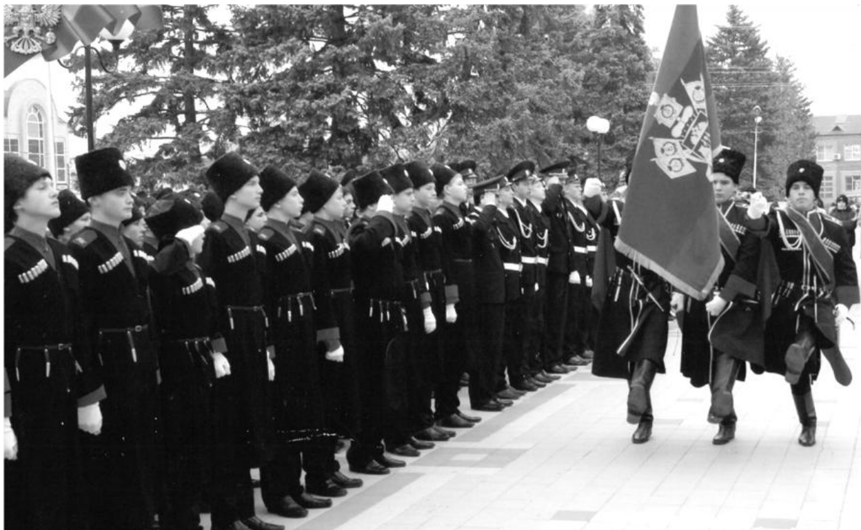
Курганинский казачий кадетский корпус. 1 ноября 2011 г.

Директор ФПС Российской Федерации К.В. Тоцкий информировал, что «ежегодно ФПС РФ привлекается в составе добровольных казачьих дружин к участию в охране Государственной границы около 1 000 членов казачьих обществ». И здесь же предлагал, что «при разработке проекта федерального закона "О российском казачестве" предусмотреть вознаграждение за добровольное участие граждан в охране Государственной границы из средств федерального бюджета. Денежное вознаграждение за сутки участия в охране границы члену казачьего общества может быть определено в пределах 100 рублей» 1 .