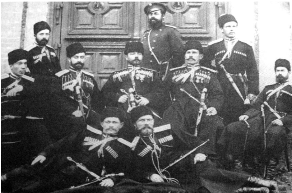
Казаки Кубанского войска – конвойцы. Начало XX в.

Около ½ средств казачьего хозяйства шло на обеспечение военной службы, сокращались и паевые наделы. После революции казачество, не сразу, объединялось как во-