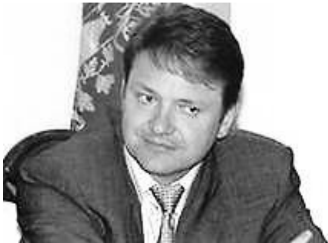
Губернатор Краснодарского края Александр Николаевич Ткачёв

Формирование на правовой основе казачьих дружин совместно с полицией по поддержанию общественного порядка можно причислить к самостоятельному направлению деятельности казаков. И эта акция не случайно получила положительный отклик среди населения края.