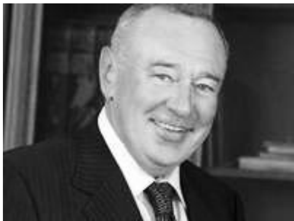
Чуб Владимир Федорович , губернатор Ростовской области

Трансформации, которые перенесло Донское казачье войско в предшествующие времена, содействовали тому, что на территории области войска оставалось, по приблизительным данным, около 100 тыс. казаков. В конце 1980-х гг. на территории войска развернулось движение за возрождение казачества. Верхушка казачества Дона оставалась приверженцем создания на территории Ростовской области казачьей республики. В период до 1996 г. действовала организация – Союз казаков Области Войска Донского.