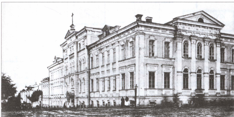
Здание, в котором располагалась колчаковская контрразведка в г. Берёзовский