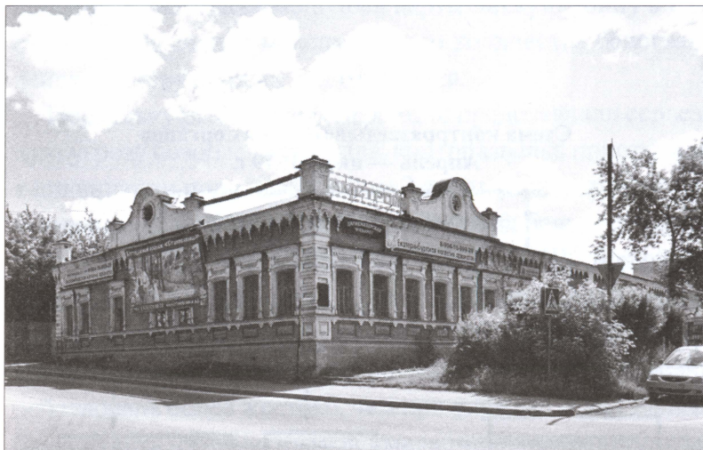
Здание Военного контроля в Перми (ныне — Пермский институт культуры и искусства)