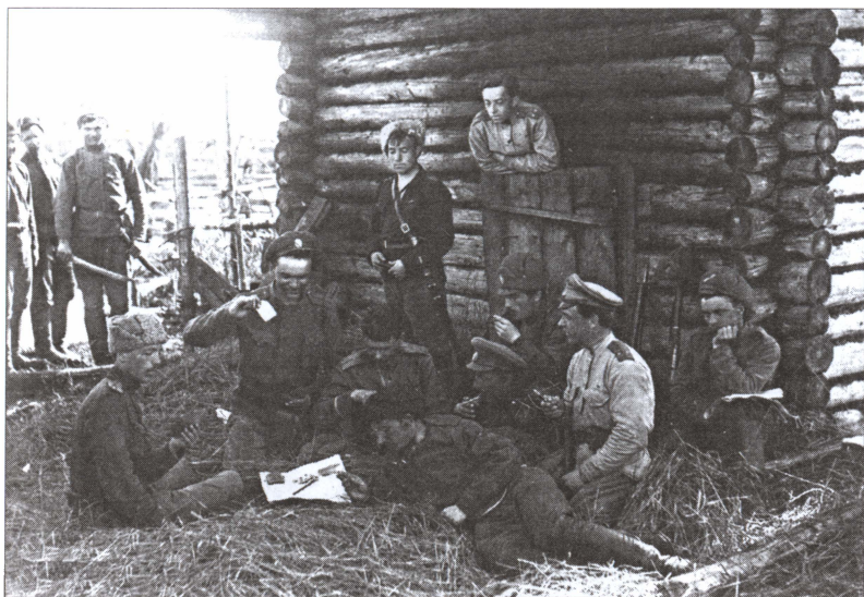
Колчаковцы на отдыхе