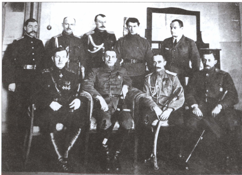
А.В. Колчак с офицерами штаба Сибирской армии