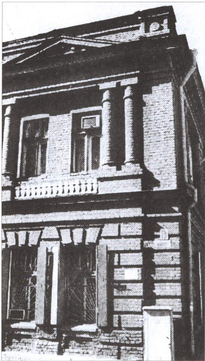
Резиденция Колчака в Омске