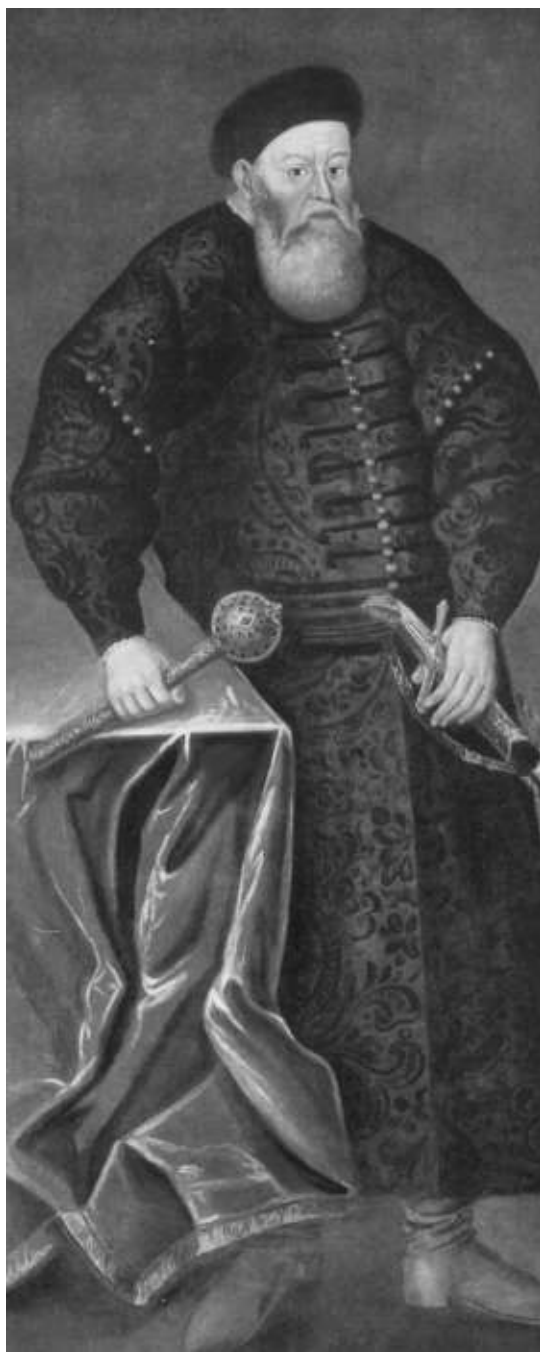
Ревнитель православия Константин Острожский. Его потомки примут католичество (неизвестный художник 1-й половины XVII века)