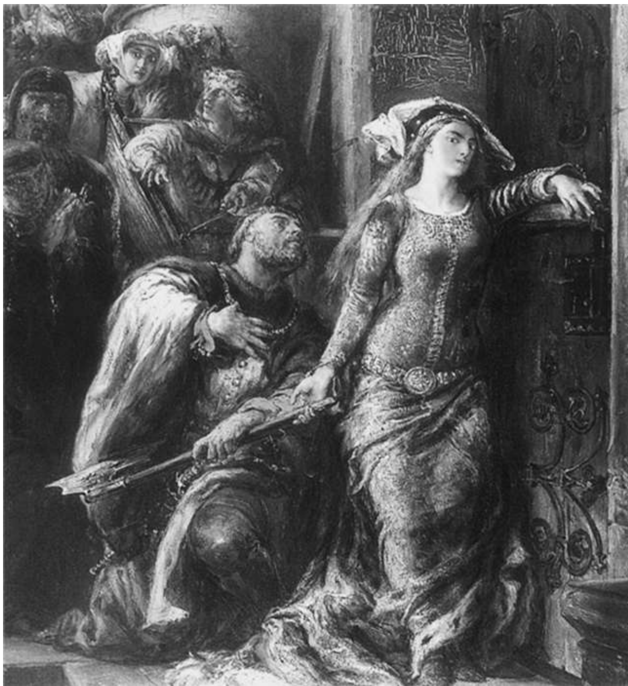
Ян Матейко. Димитр из Горая отговаривает Ядвигу от взлома двери в королевский замок в Кракове