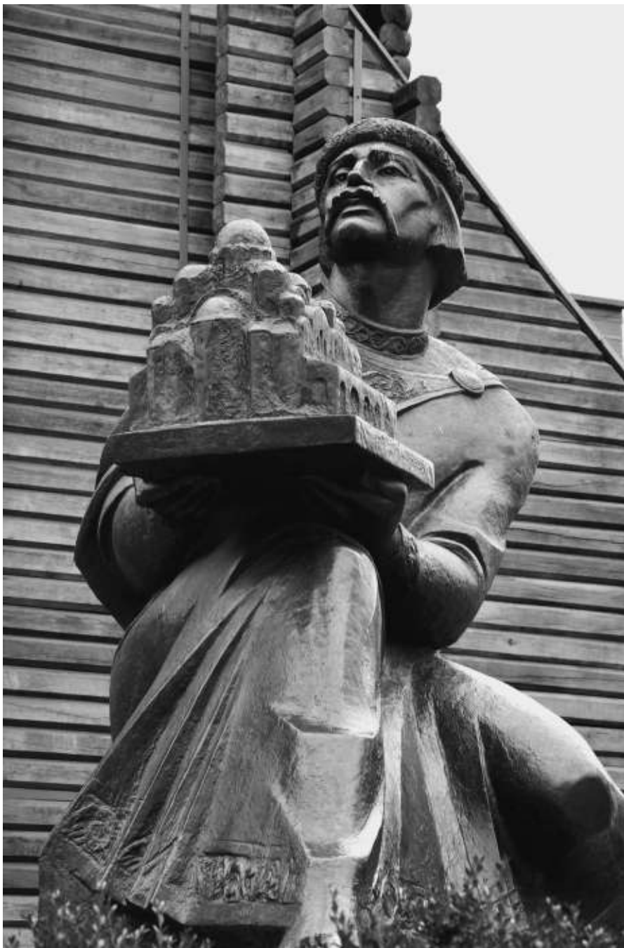
Бородатый Ярослав Мудрый в Ярославле и усатый Ярослав Мудрый в Киеве.