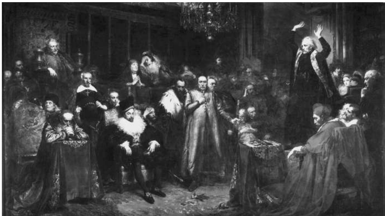
Ян Матейко. Брестская уния