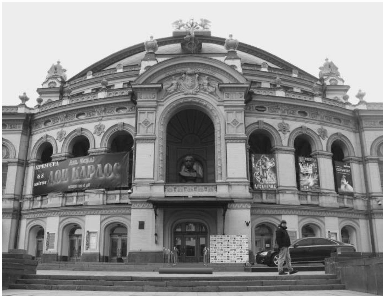
Вездесущий Тарас Шевченко: Шевченко в оперном театре им. Т.Г. Шевченко в Киеве.