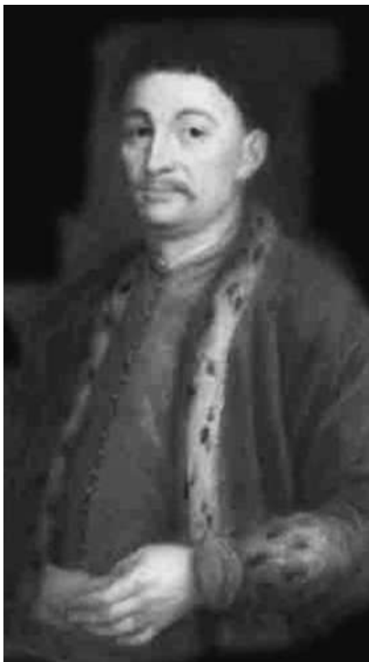
Главный противник Богдана Хмельницкого князь Ярема Вишневецкий