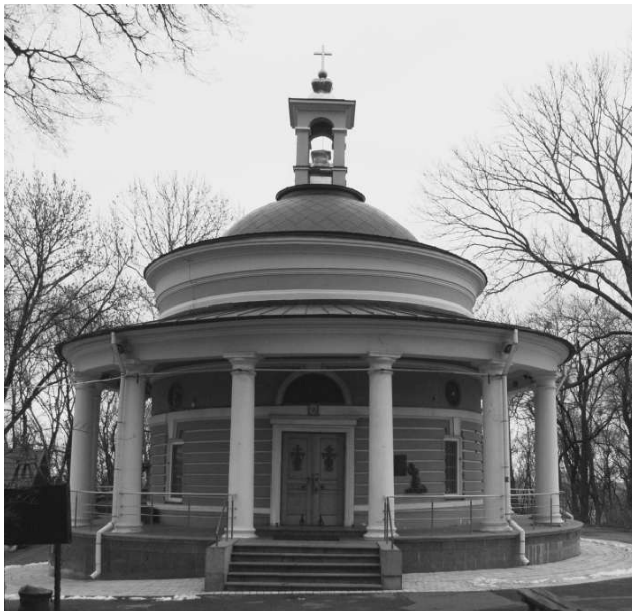
Аскольдова могила. Церковь над ней отдана униатам.