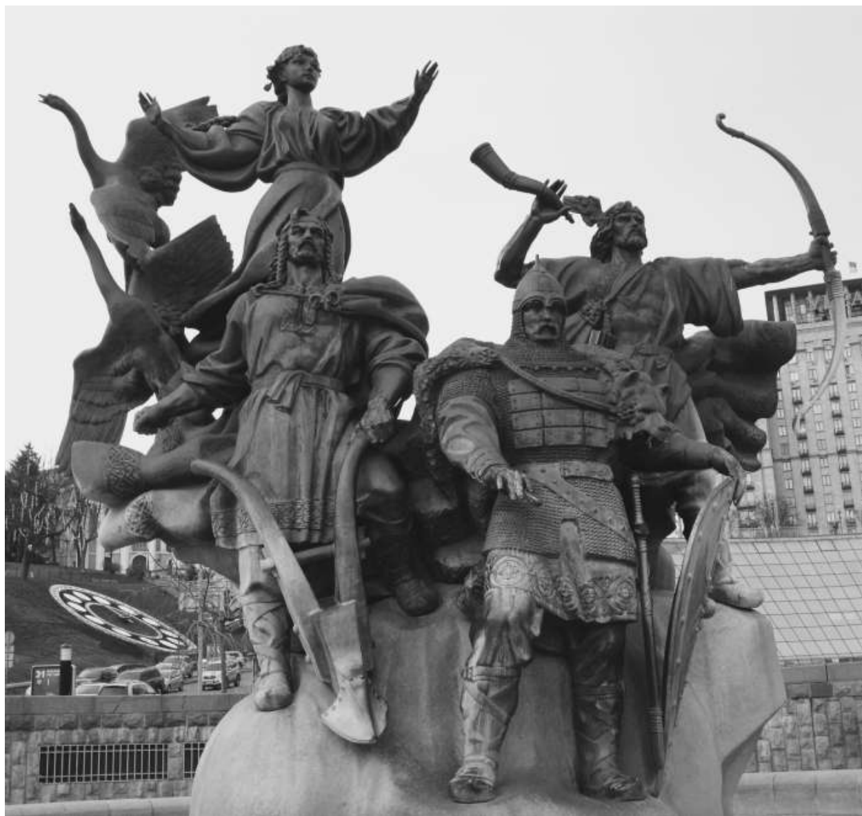
Веселая компания основателей града Киева: Кий, Щек, Хорив и сестра их Лыбедь.