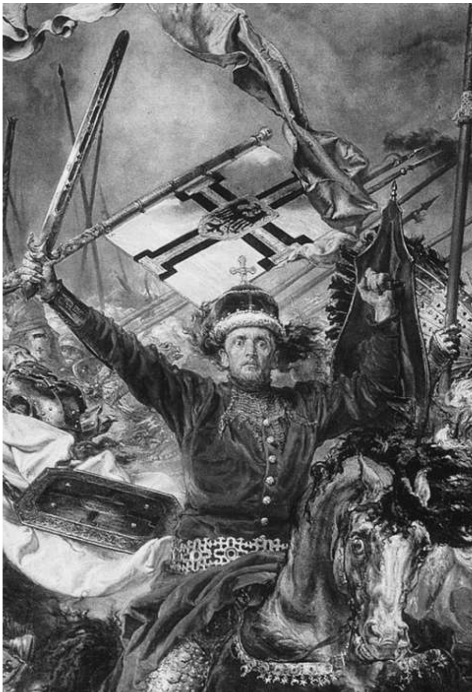
Ян Матейко. Витовт под Грюнвальдом