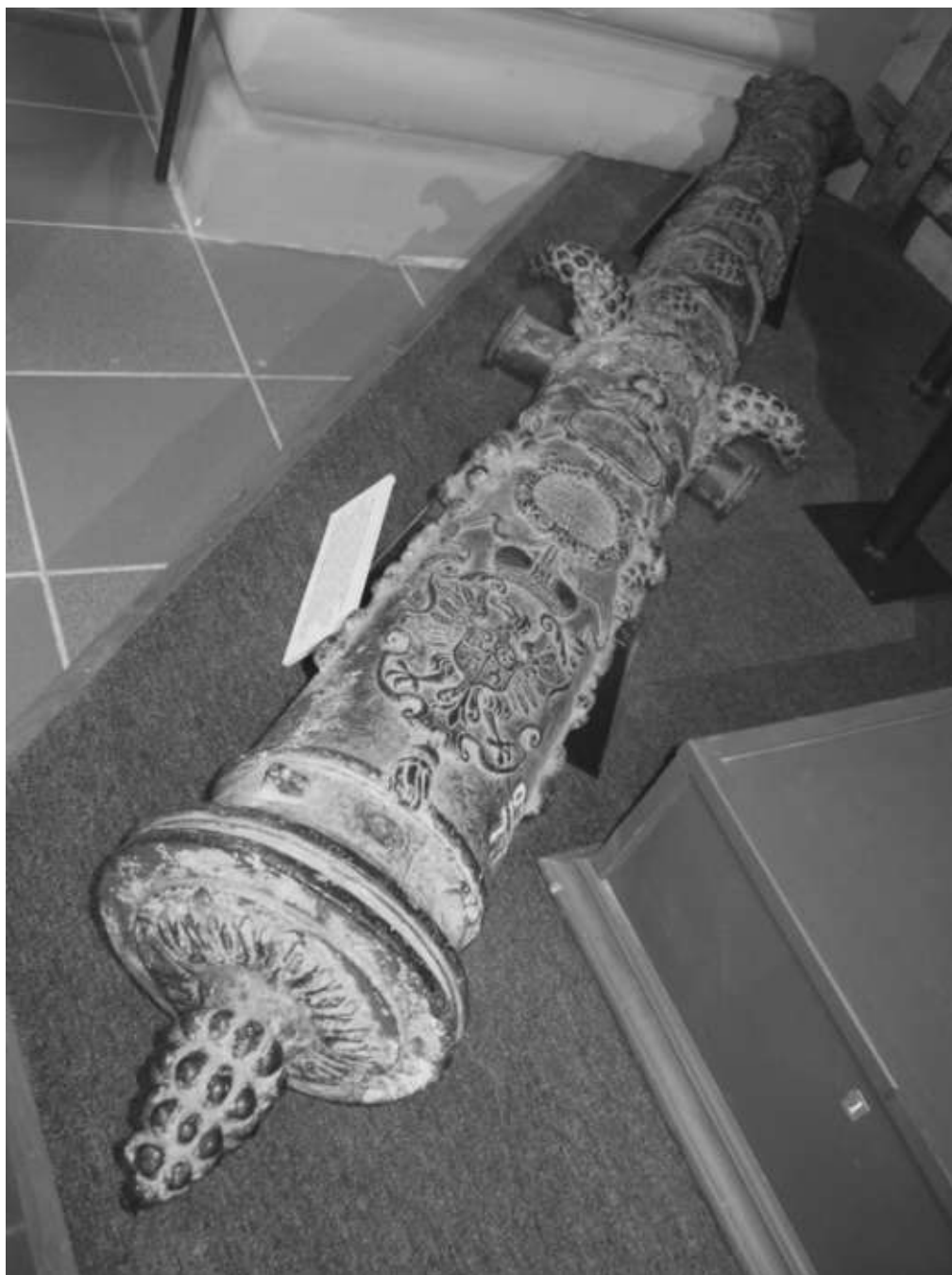
1-фунтовая пушка «Чаша изобилия». Отлита в Несвиже в 1600 г.