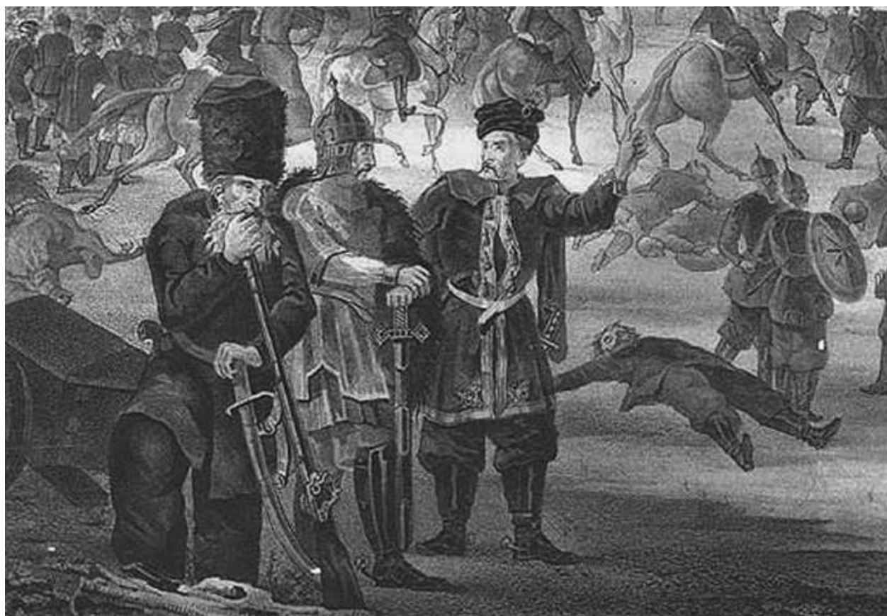
Казак и польские паны. Литография XIX века