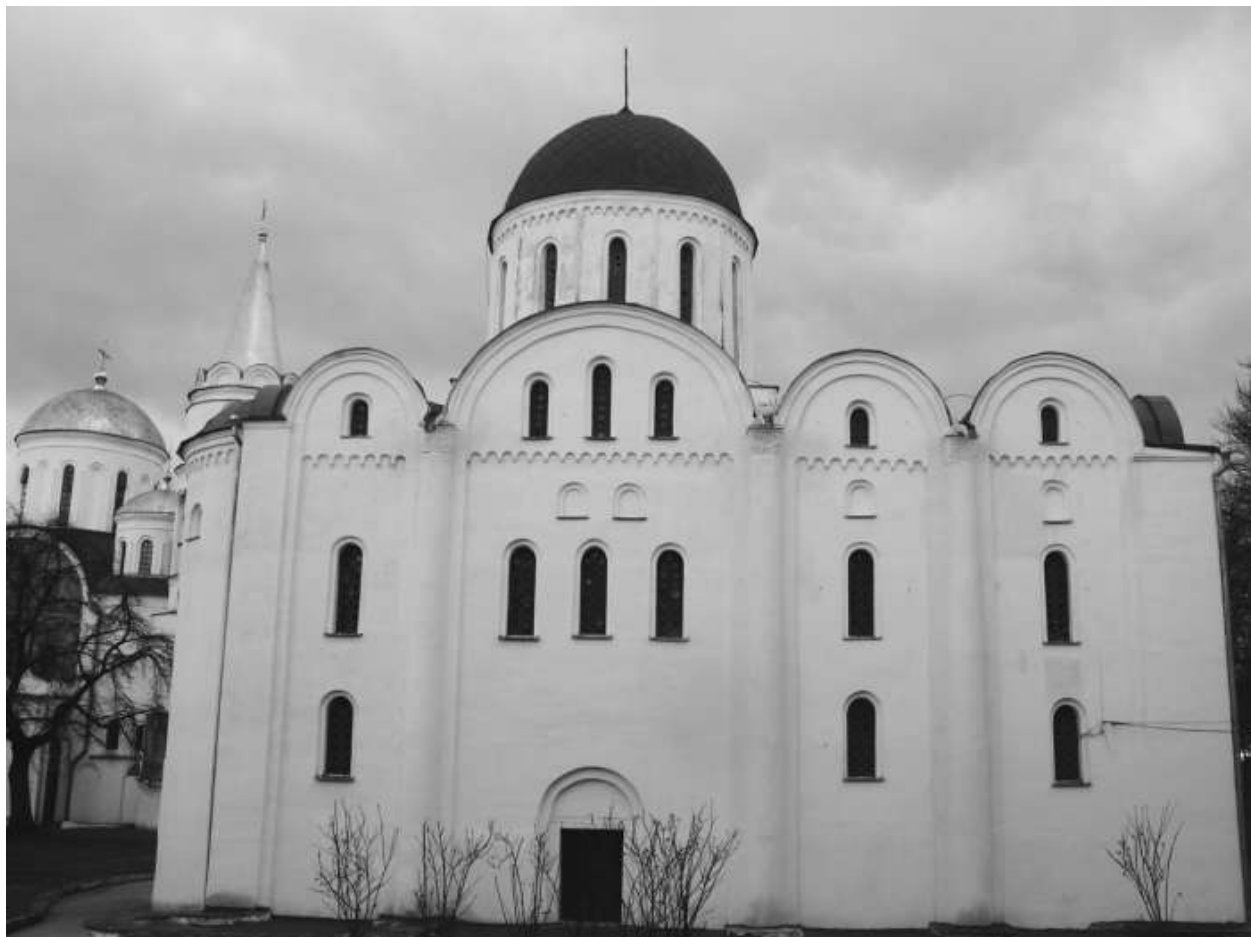
Борисоглебский собор в Чернигове. Современный вид.