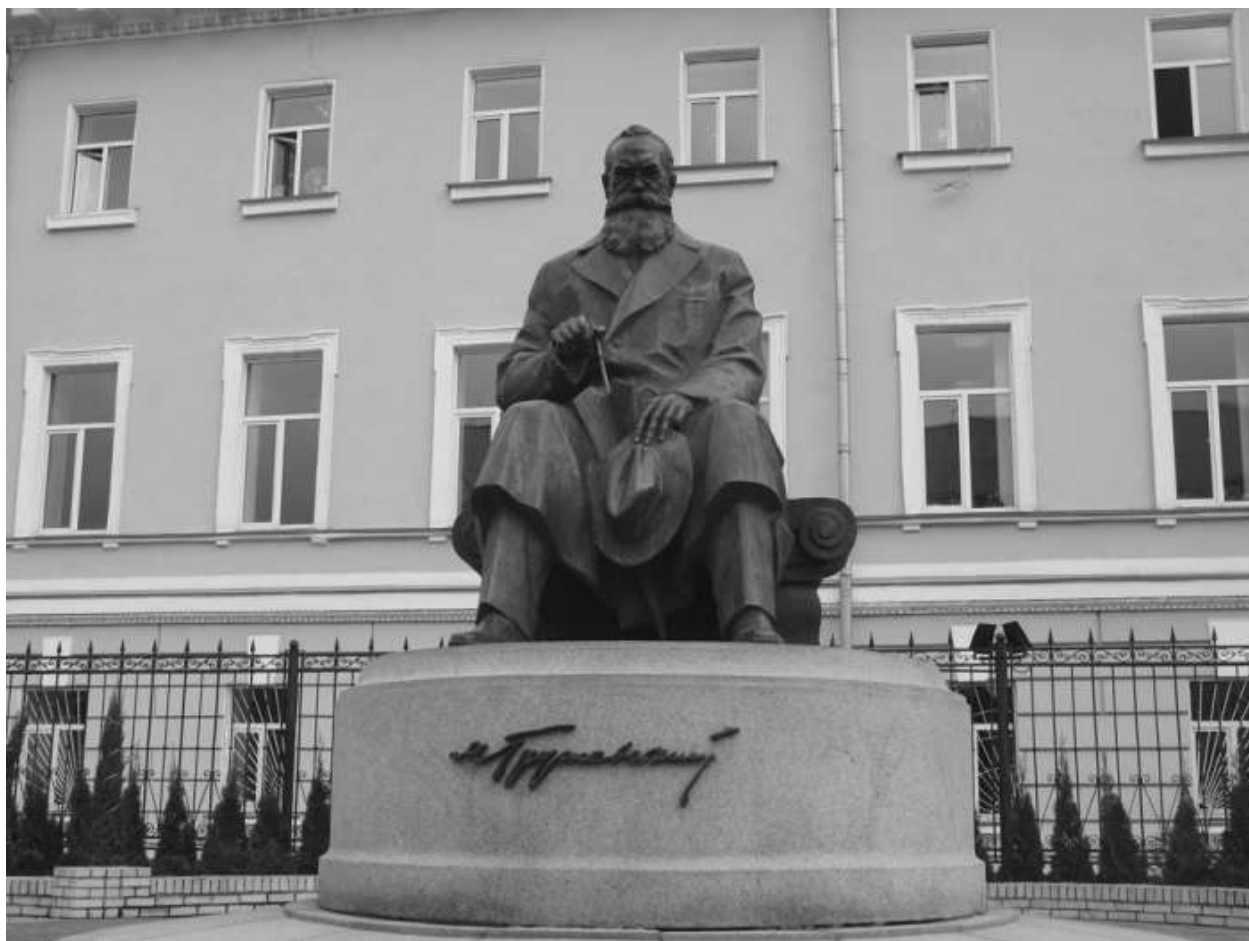
Главный «незалежный» историк Михайло Грушевский.