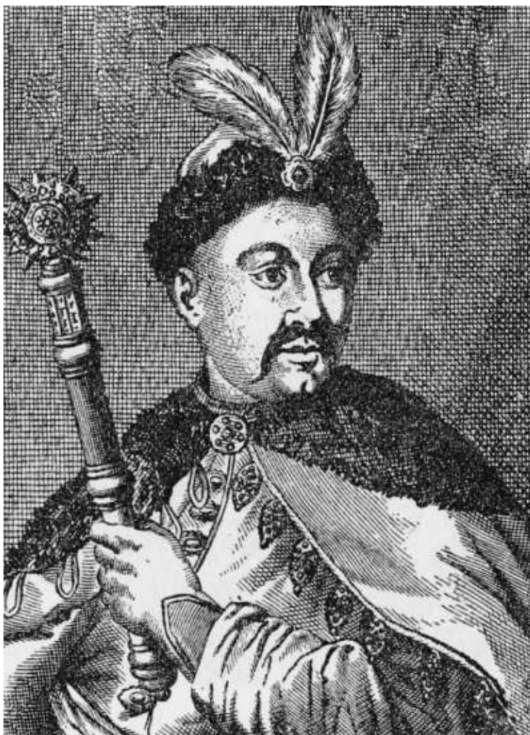
Гетман Юрий Хмельницкий