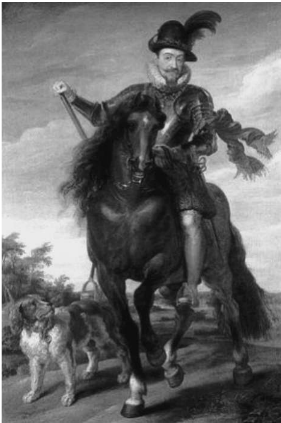
Рубенс. Король Польский и Великий князь Литовский Сигизмунд III