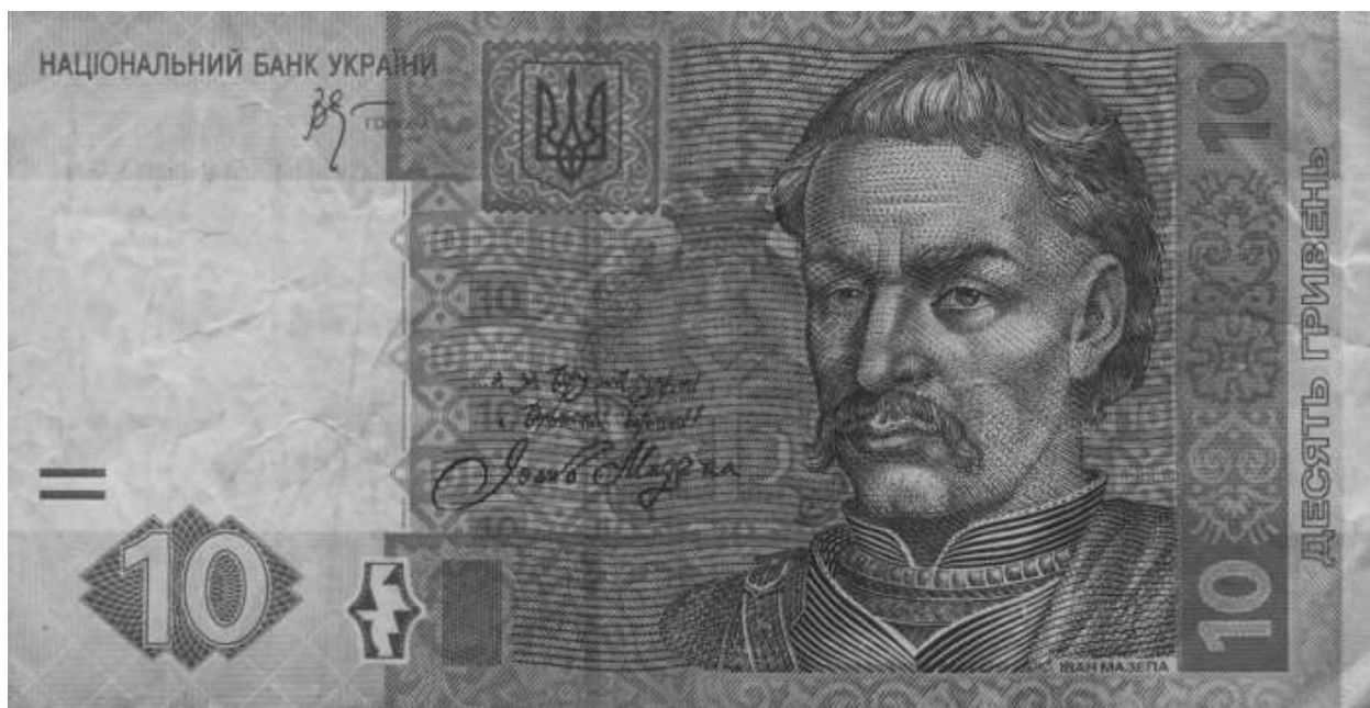
Национальный герой Иван Мазепа на 10-гривенной купюре