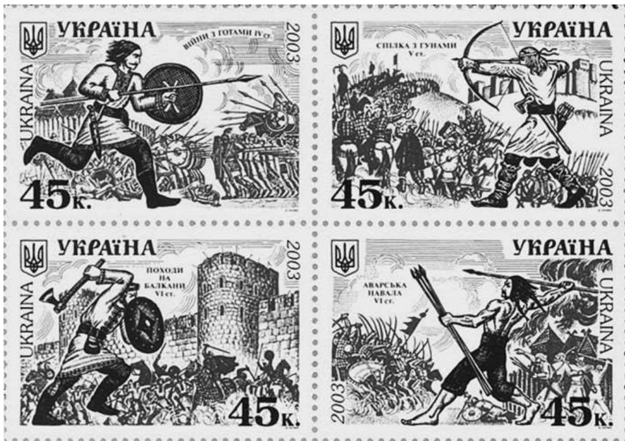
Воины-«укры» IV–VI веков на современных «незалежных» марках