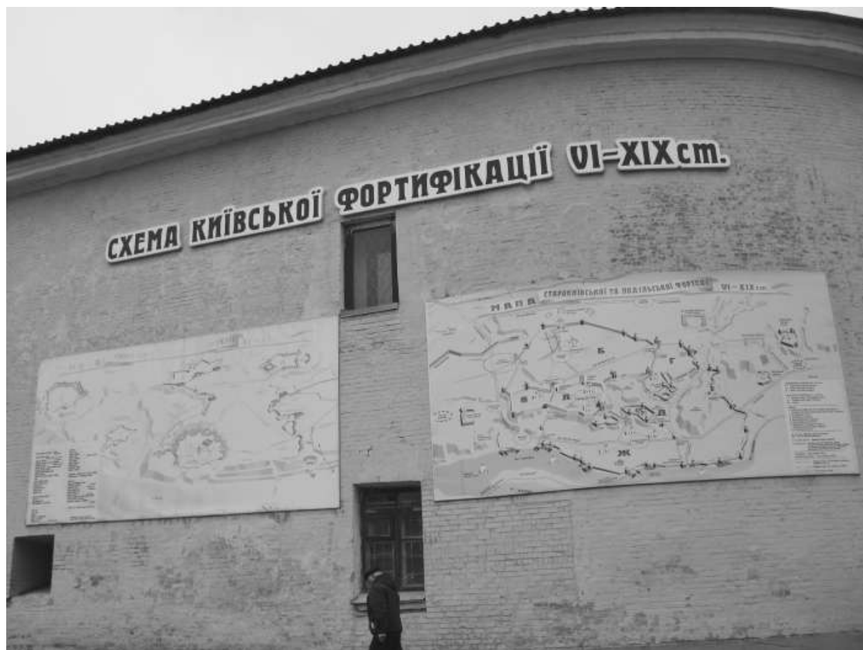
Киевская фортеция, «основанная» в VI веке