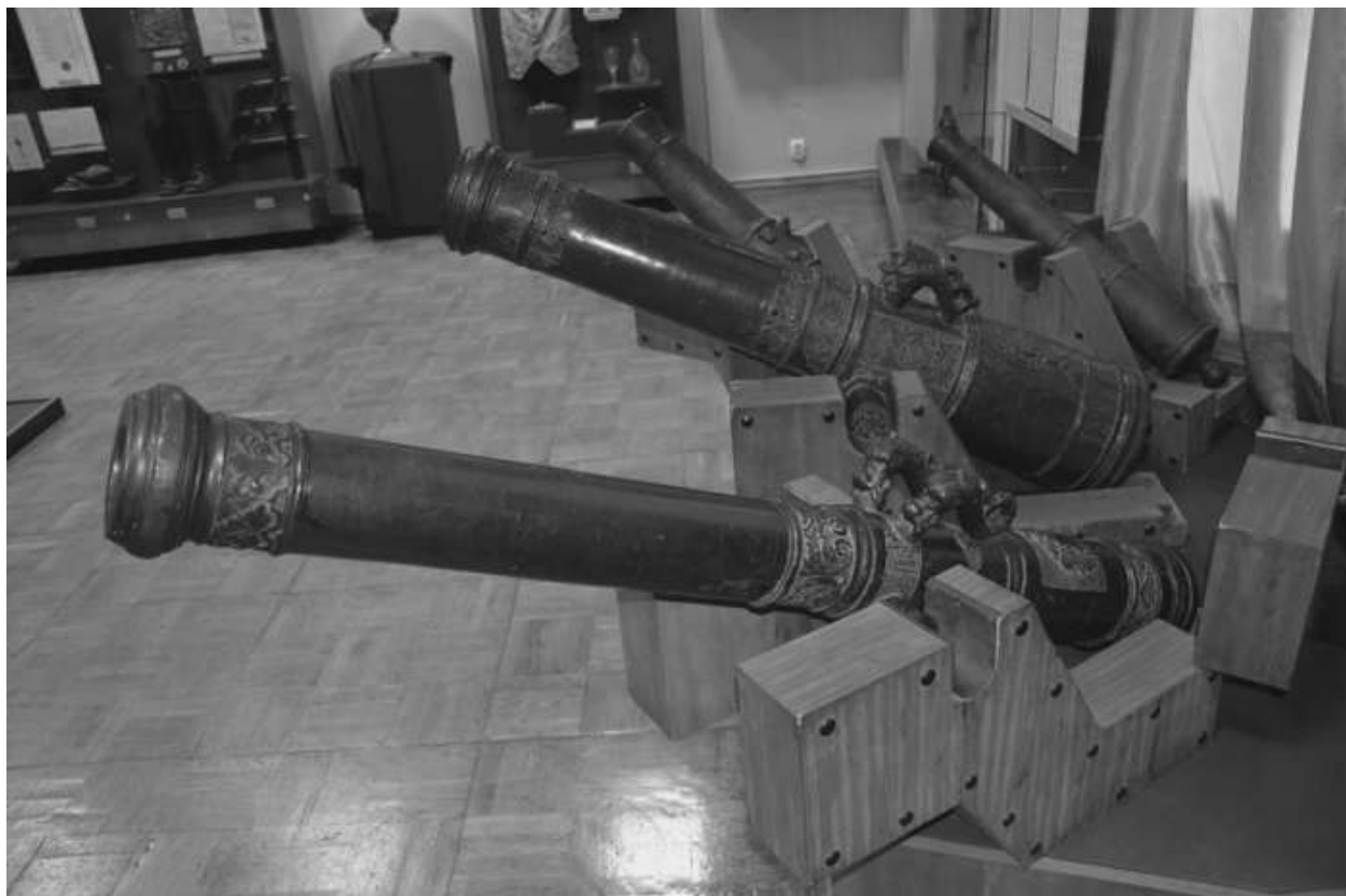
Пушки, отлитые в Глухове в 1713 – 1717 гг. по индивидуальным заказам полковников Михаила Милорадовича и Ивана Черныша.