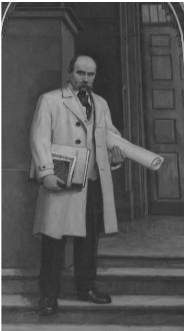
Шевченко в Киевском университете им. Т.Г. Шевченко.