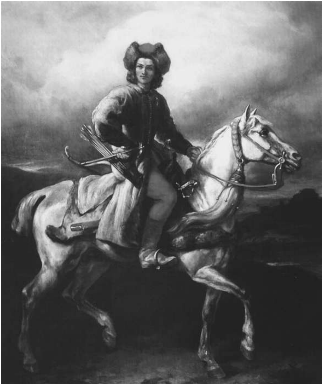
Рембрандт. Лисовчик (польский офицер начала XVII века)