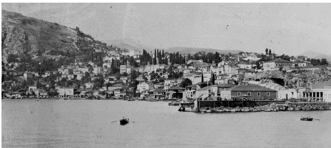
Панорама Трапезунда 1916/17 г.