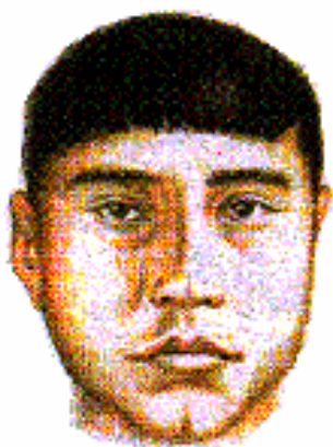
Арктический антропологический тип

Особое место в антропологической классификации народов Сибири занимает амуро-сахалинский антропологический тип. Его характерными признаками являются: темная пигментация кожи, глаз и волос, жесткие волосы, иногда волнистые; сильно развит эпикантус; незначительный рост бороды, высокое и широкое лицо с сильно выступающими скулами; слабо выступающий нос с низким переносьем; толстые губы. Рост ниже среднего (160-161 см в среднем для мужчин). Вероятно, в прошлом этот антропологический тип был широко распространен в амуро-сахалинском регионе. К наиболее древним представителям этого типа относятся сахалинские и амурские нивхи. В качестве заметного компонента он наблюдается у ульчей и орочей. Ульчи, вместе с тем, занимают промежуточное место между негидальцами и нивхами, обнаруживая черты смешения байкальского и амуро-сахалинского антропологических типов.