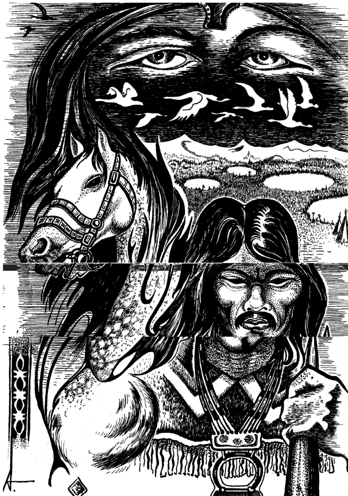
"Якут" Худ А.Д. Тимофеев