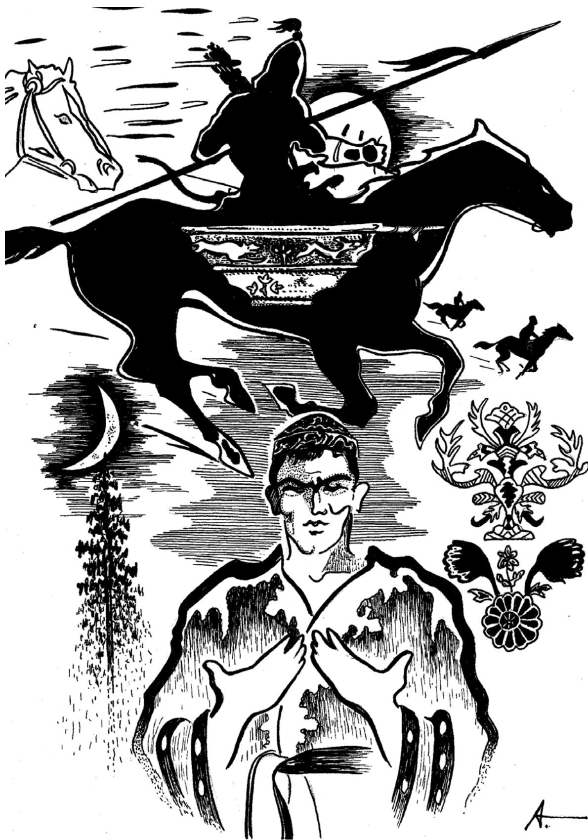
"Сибирский татарин" Худ. А.Д. Тимофеев