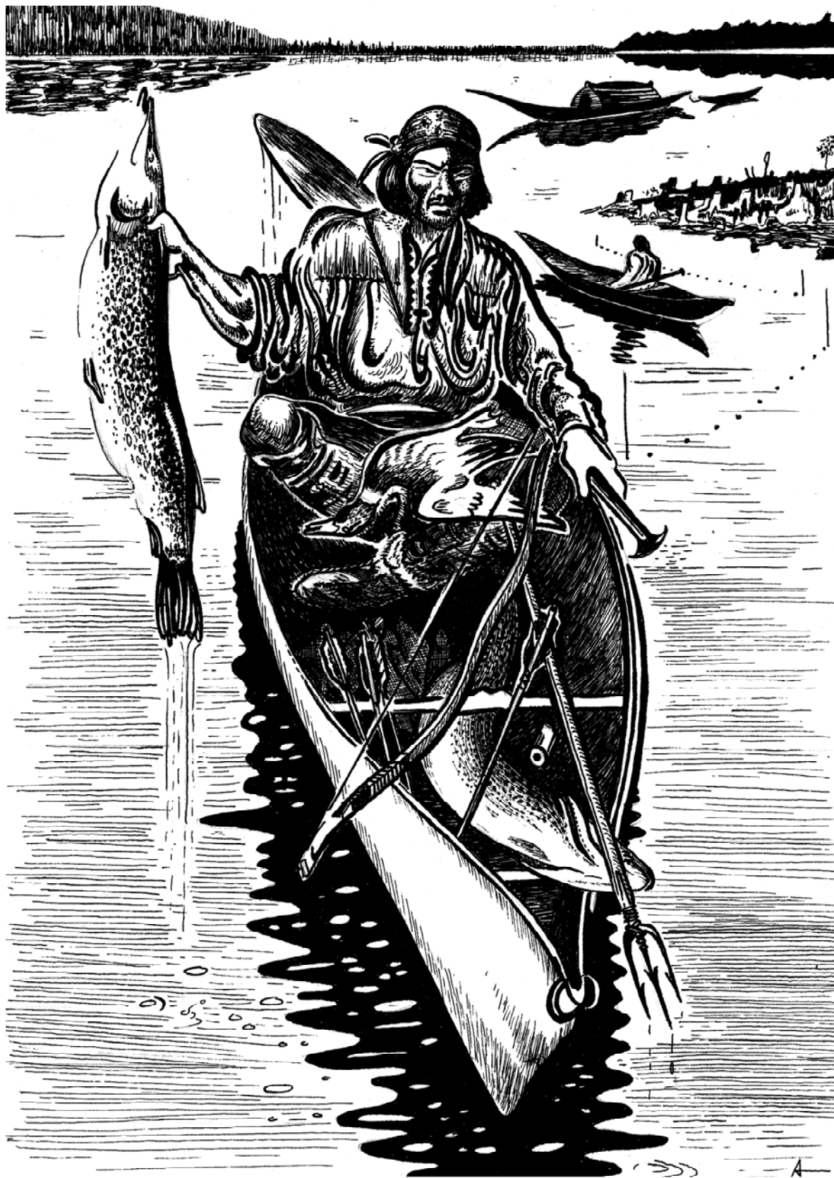
"Селькуп" Худ А.Д. Тимофеев