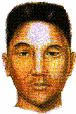
Центральноазиатский антропологический тип

Северная часть Средней и Восточной Сибири населена представителями байкальского или палеосибирского антропологического типа. Формирование его относится к эпохе неолита. Характерными особенностями этого типа являются: низкий рост (ниже 160 см в среднем для мужчин), сильно развитый эпикантус, слабый рост бороды, высокое, широкое и плоское лицо с сильно выступающими скулами, слабо выступающий нос с низким переносьем, мягкие волосы, светлая кожа, тонкие губы и очень высокая, выступающая вперед верхняя губа. К представителям этого типа относятся эвенки и эвены. Он прослеживается также у тунгусоязычного населения Нижнего Амура и Сахалина - негидальцев и ороков, которые отличаются от представителей байкальского типа очень низким ростом (155-156 см в среднем для мужчин). Некоторые черты байкальского типа наблюдаются у якутов и прослеживаются у орочей и нанайцев.