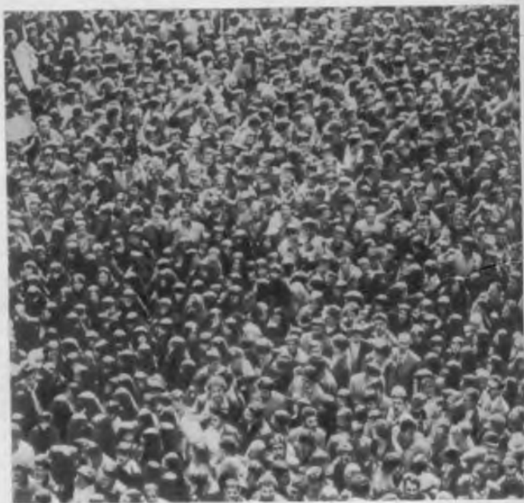
Молодежь протестует против введения чадры (1979 г.).