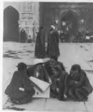
На площади у мечети обсуждают политические проблемы.