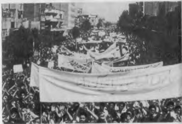
Массовая народная демонстрация 7 сентября.