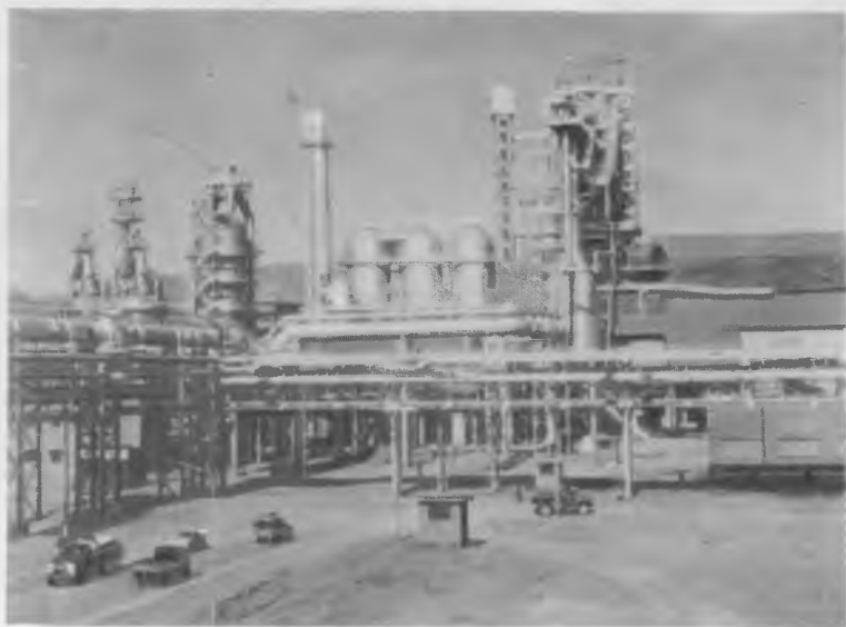
На Исфганском металлургическом заводе, построенном с помощью СССР.