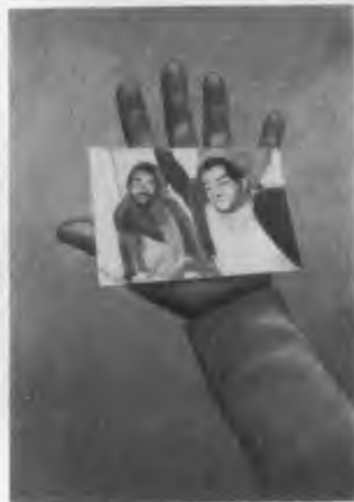
Фотография жертвы шахской охраны САВАК.