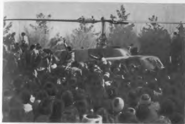
Вертолет с Хомейни на кладбище мучеников.