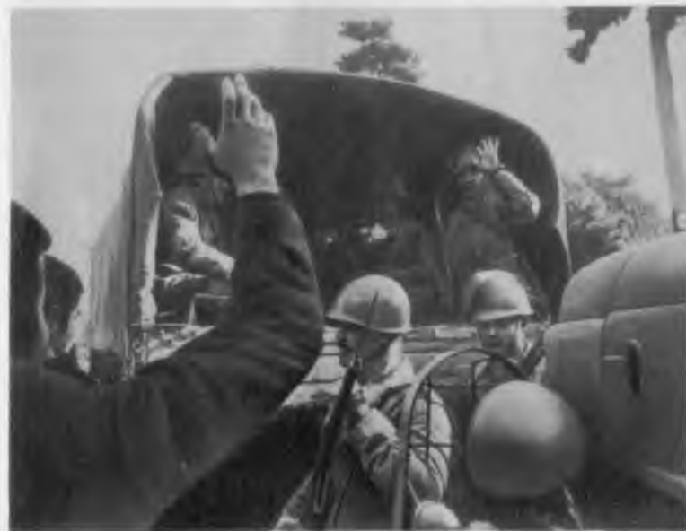
Свидетельство преступлений САВАК и США.