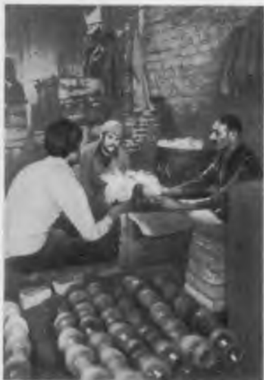
В мастерской ремесленника.