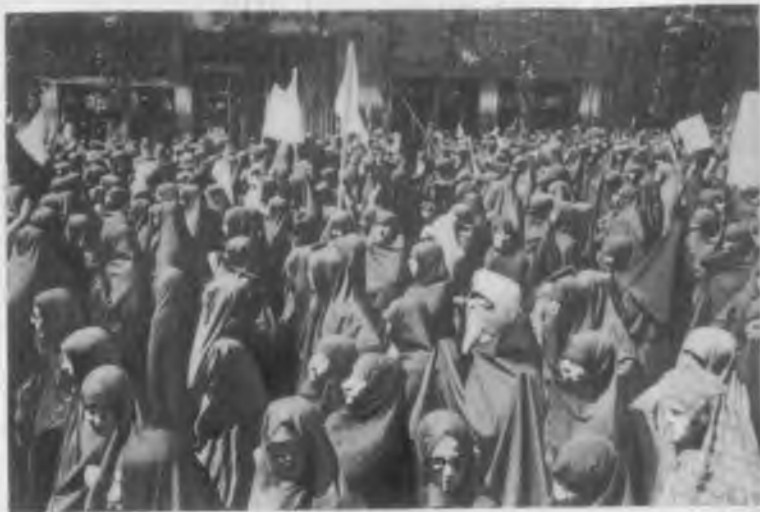
Антишахская демонстрация женщин.