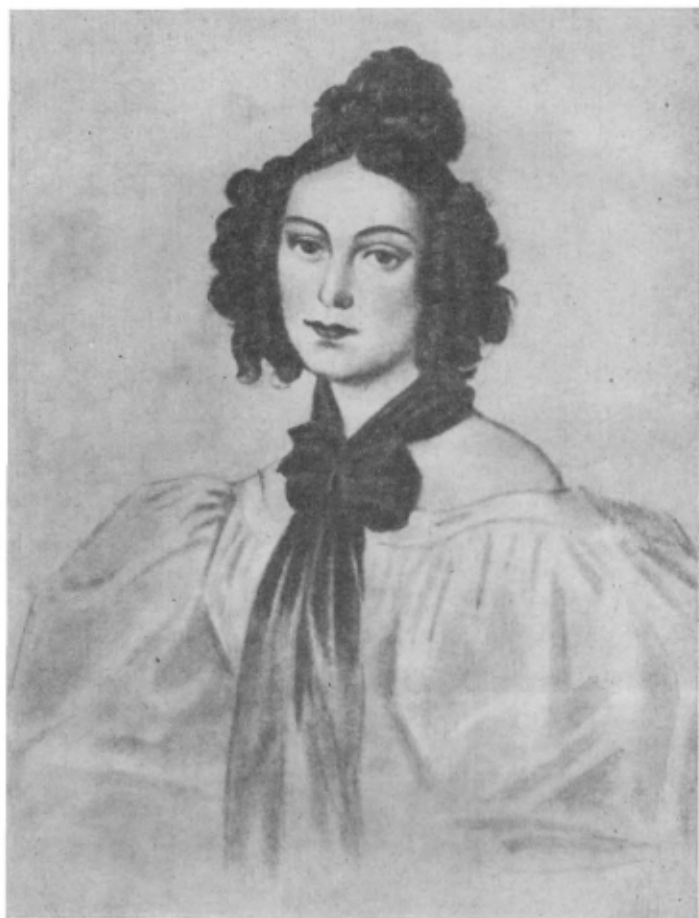
К. П. Ивашева

Акварель Н. Бестужева. Петровский завод. 1831 г.