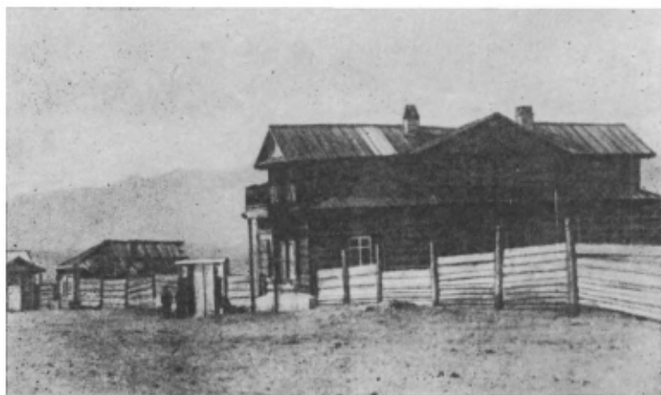
Дом Трубецких в Чите