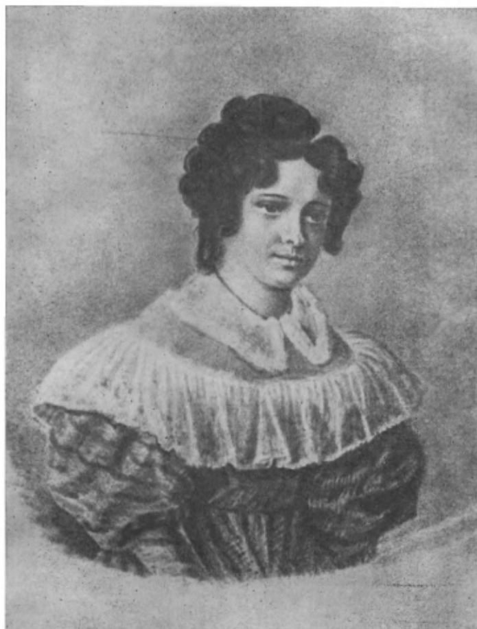
А. И. Давыдова

Акварель Н. Бестужева. Петровский завод. 1830—1839 гг.