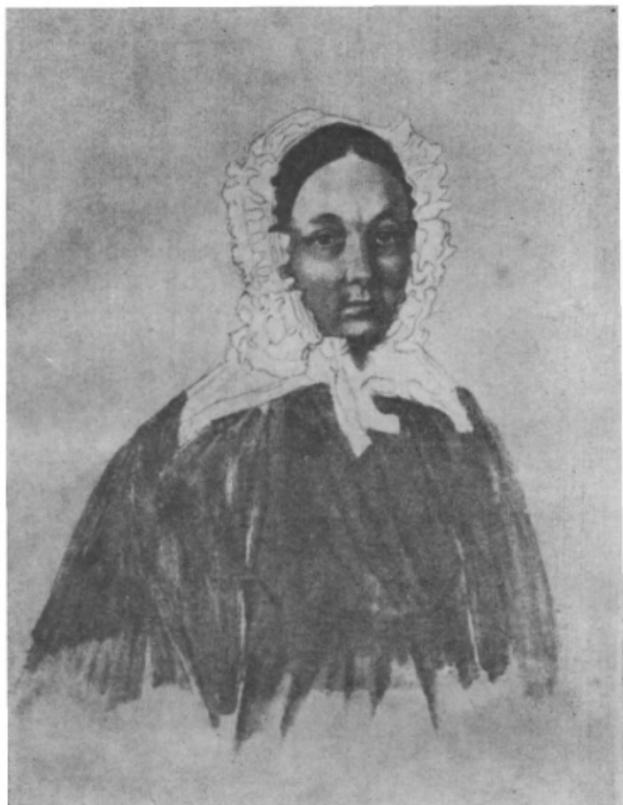
М. К. Юшневская

Акварель Н. Бестужева. Петровский завод. 1838—1839 гг.