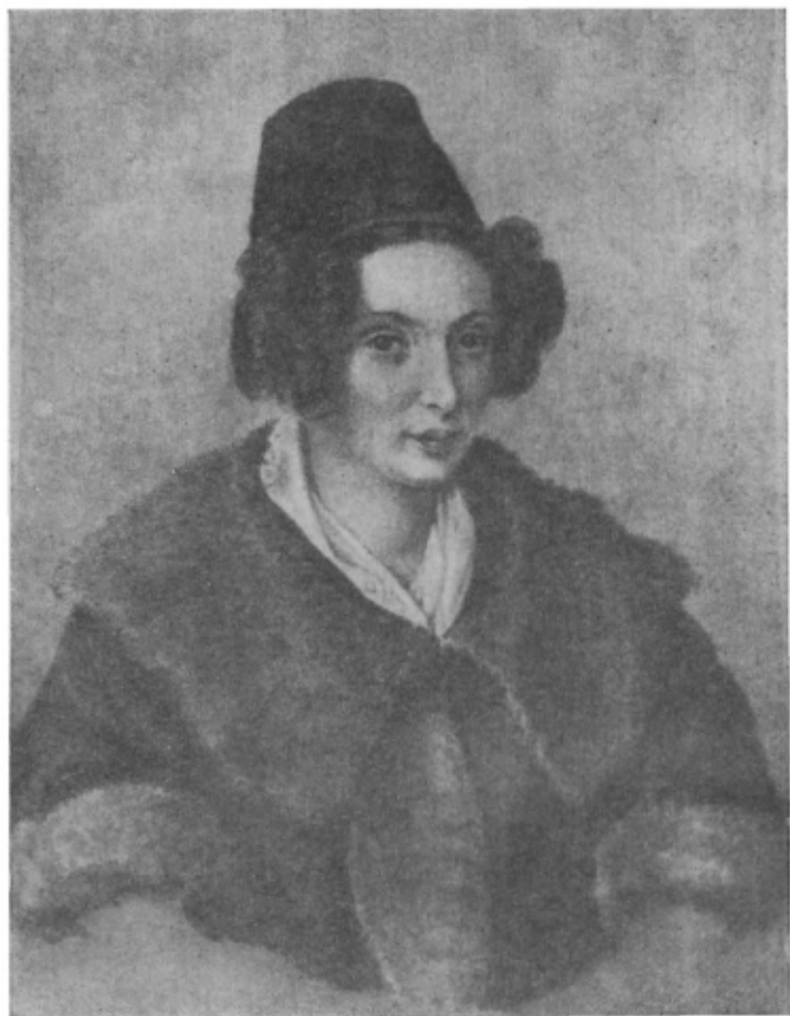
А. Г. Муравьева

Акварель Н. Бестужева. Петровский завод. 1832 г.