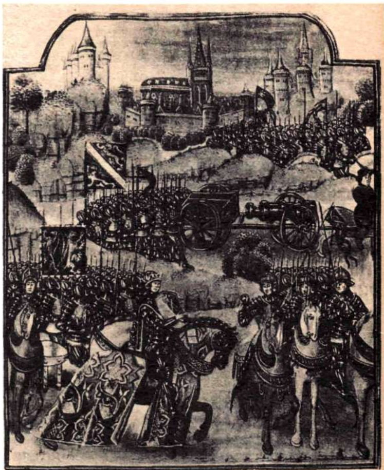
ПОХОД ПЕРСИДСКОГО ЦАРЯ КИРА. Иллюстрация к французскому изданию «Воспитания Кира» Ксенофонта (XV в.)