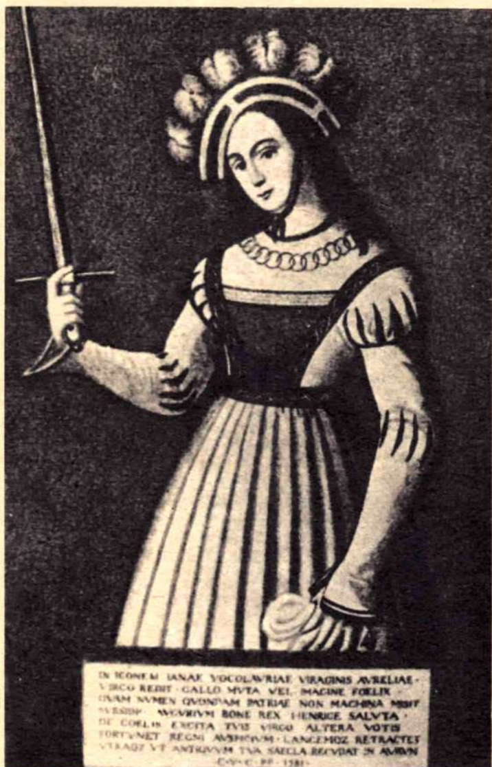
ЖАННА Д'АРК. Так называемый «портрет эшевен»