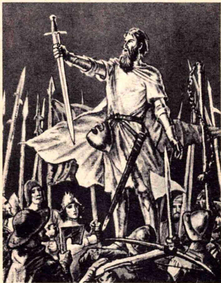
ДОЛЬЧИНО ВЫСТУПАЕТ ПЕРЕД ПОВСТАНЦАМИ (рис. И. Кускова в кн: С. Жидков. «Дольчино». М., 1965)