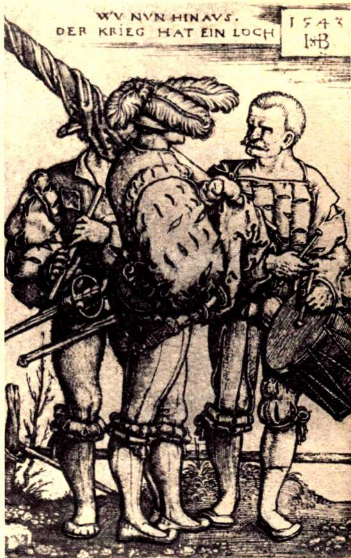
БАРАБАНЩИК, ФЛЕЙТИСТ И ЗНАМЕНОСЕЦ ВРЕМЕН КРЕСТЬЯНСКОЙ ВОЙНЫ В ГЕРМАНИИ. Гравюра Ганса Бегема (1543 г.)