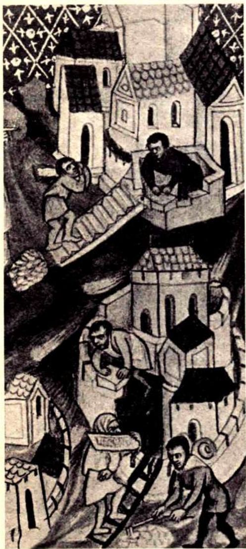
СТРОИТЕЛЬНЫЕ РАБОТЫ. Миниатюра XV в.