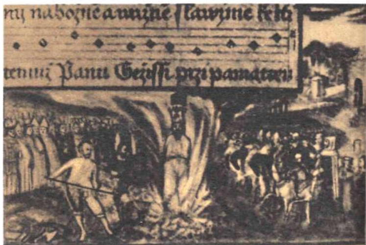
СОЖЖЕНИЕ ЯНА ГУСА. Миниатюра XV в.

слуга божий, всем верным чехам. Я радуюсь тому, что у меня еще есть время написать вам сие послание. Прошу вас, не пугайтесь, когда услышите сообщение о моей смерти. Думайте обо мне не как о мертвом, а как о живом, дабы я и впредь жил в ваших деяниях. Я прошу вас прежде всего любить друг друга и верно стоять за божью правду. Не позволяйте врагам запугивать вас угрозами и приказами: они разлетятся, как мотыльки, и разорвутся, как паутина. Не бойтесь ни боли, ни мук. Знайте, меня не сломили угрозы врагов — я не отрекся ни от единого своего артикула. Во имя вашего земного благополучия я прошу вас, паны, быть милостивыми к беднякам, верно править своими подданными. Купцов прошу справедливо торговать в лавках, а ремесленников — честно выполнять свои обязанности. Прошу магистров усердно обучать своих студентов, а студентов слушаться своих учителей».