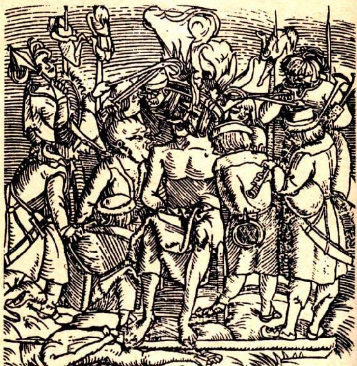
КАЗНЬ ДЬЕРДЯ ДОЖИ. Гравюра XVI в.