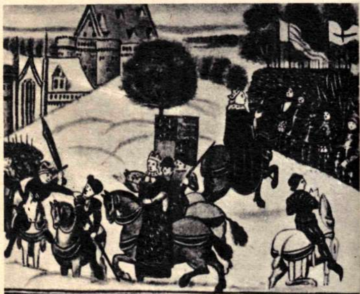
УБИЙСТВО УОТА ТАЙЛЕРА. Гравюра XV в.