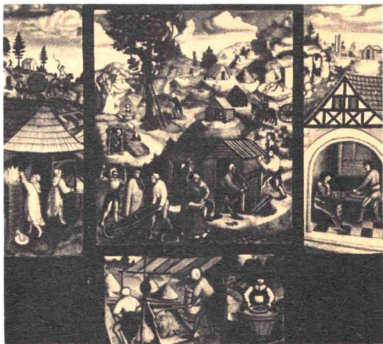
АННАБЕРГСКИЙ АЛТАРЬ. XV в.

истину, уста мои проклянут безбожников; я пришел в ваши благословенные пределы, о любезные чешские братья, чтобы отличить и истребить этих безбожников. Не мешайте, но помогите мне. Я обещаю вам великую славу и честь; здесь начнется новая апостольская церковь и изыдет отсюда во все страны мира». Но эти выступления привели Мюнцера к столкновению с местными утраквистами*, и он вынужден был бежать.