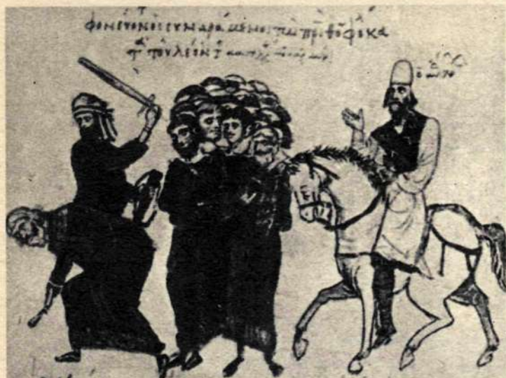
СЫН ИМПЕРАТОРА МИХАИЛА ФЕОФИЛ РУКОВОДИТ КАЗНЬЮ УЧАСТНИКОВ ОППОЗИЦИИ, IX в.