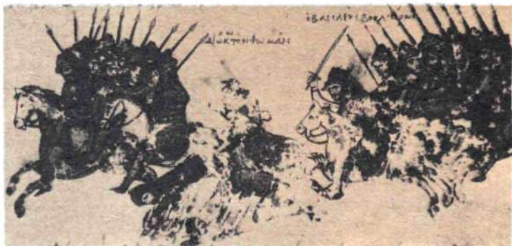
ЭПИЗОД СРАЖЕНИЯ МЕЖДУ АРМИЕЙ ФОМЫ СЛАВЯНИНА И ВОЙСКОМ ХАНА ОМУРТАГА. Миниатюра IX в.

ответственность за вражеское нашествие. Болгарский хан, конечно, в меньшей степени, чем константинопольское правительство, был заинтересован в борьбе с Фомой Славянином. Кроме того, и десятилетие договора, заключенного в 814 г., ожидалось лишь через два года. Появление болгар у стен Константинополя — бесспорный результат дипломатической инициативы, а может быть, и подкупа со стороны императора.