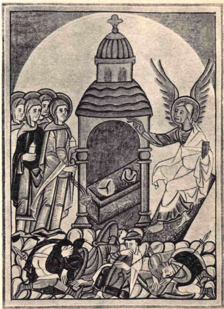
ОПЛАКИВАНИЕ ХРИСТА. Миннаторе ХІ в.