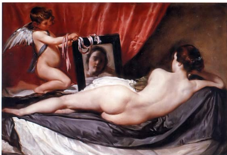
Веласкес. Венера перед зеркалом. 1651