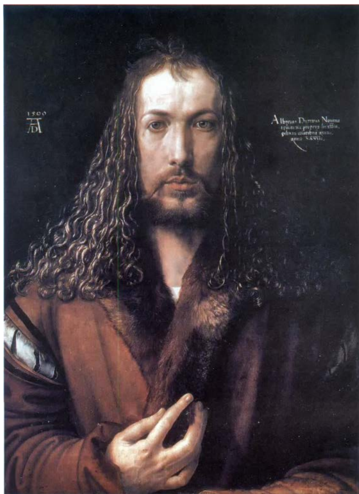
Дюрер. Автопортрет. 1500