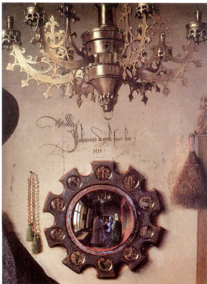
Ян ван Эйк. Чета Арнольфини (Фрагмент)