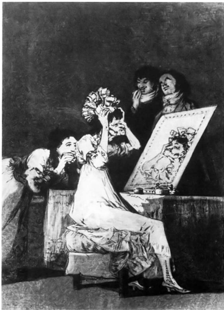
Гойя. До смерти. 1799