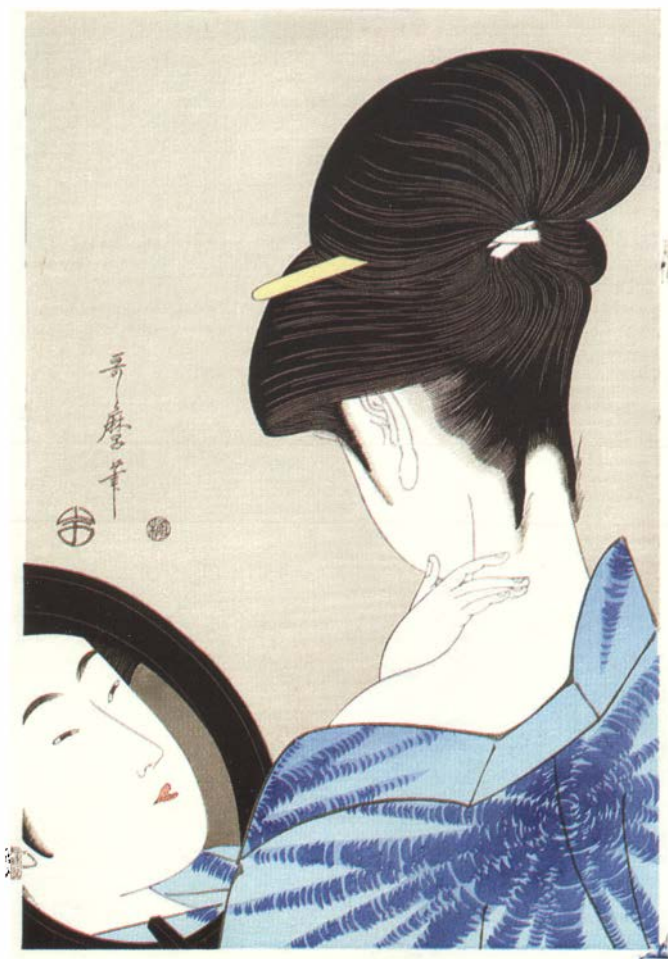
Утамаро. Красавица с зеркалом. 1792