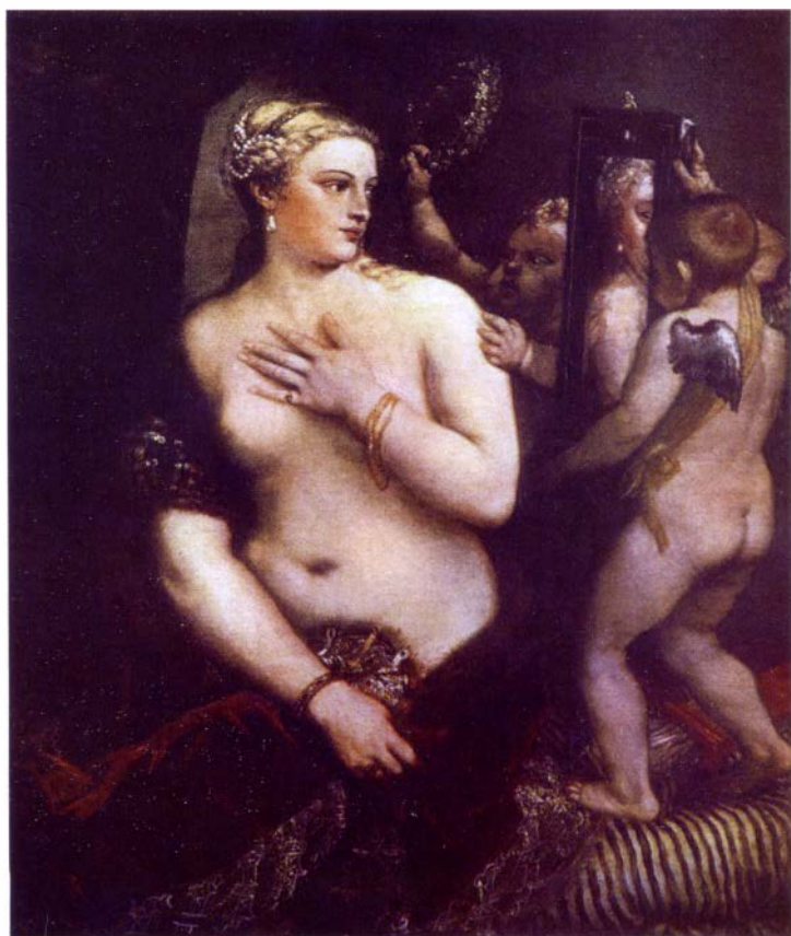
Тициан. Венера с зеркалом. 1555