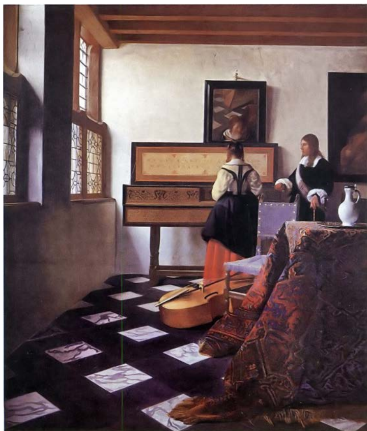
Ян Вермеер. Кавалер и дама у спинета. 1665