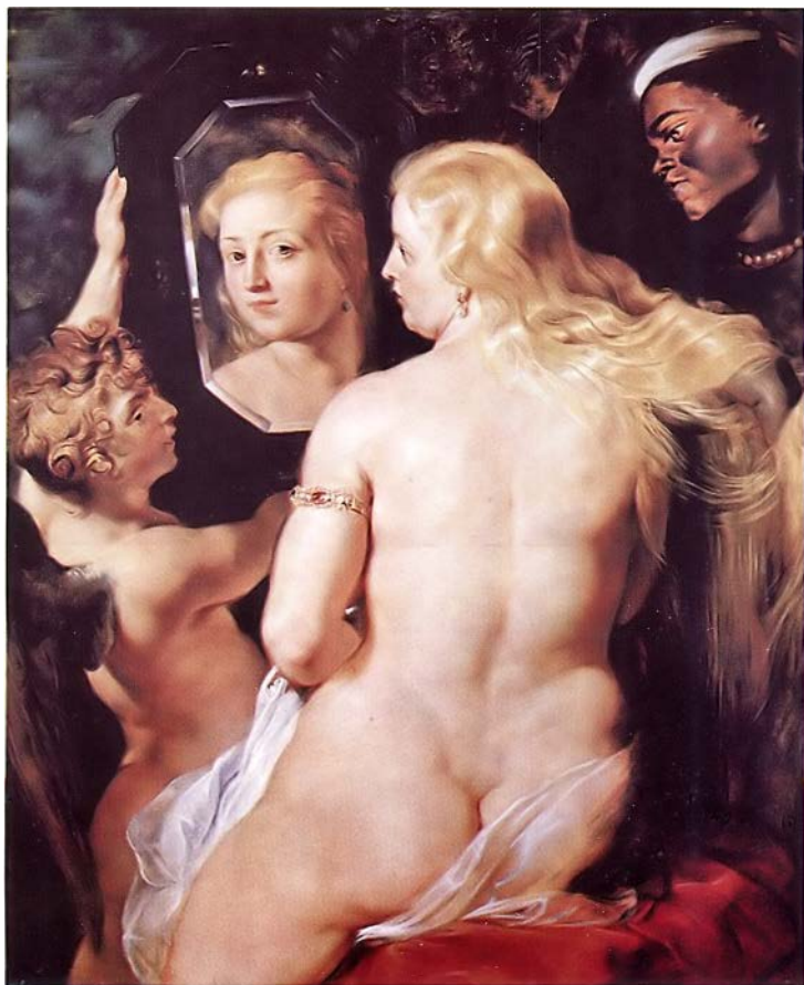
Рубенс. Венера перед зеркалом. 1615