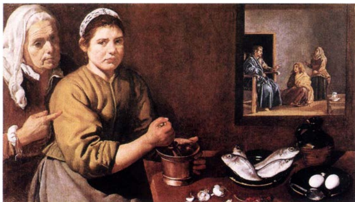
Веласкес. Христос в доме Марфы и Марии. 1620