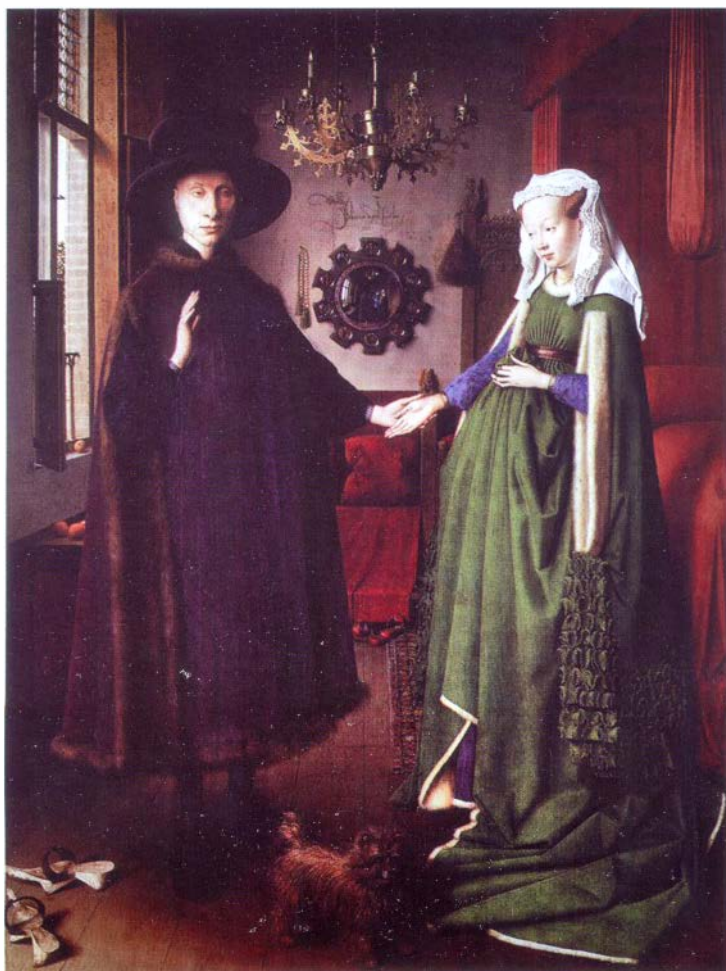
Ян ван Эйк. Чета Арнольфини. 1434