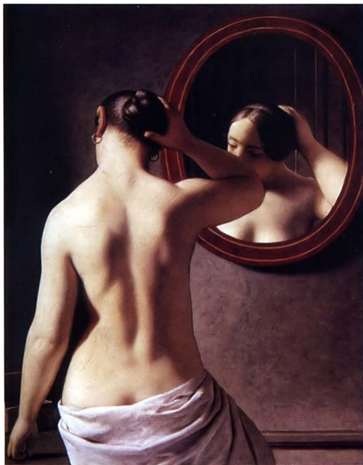
Эккерсберг. Женщина, стоящая перед зеркалом. 1841