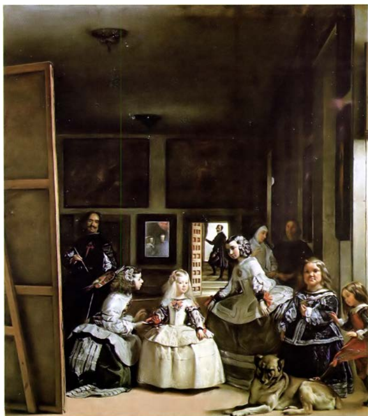
Веласкес. Менины. 1654