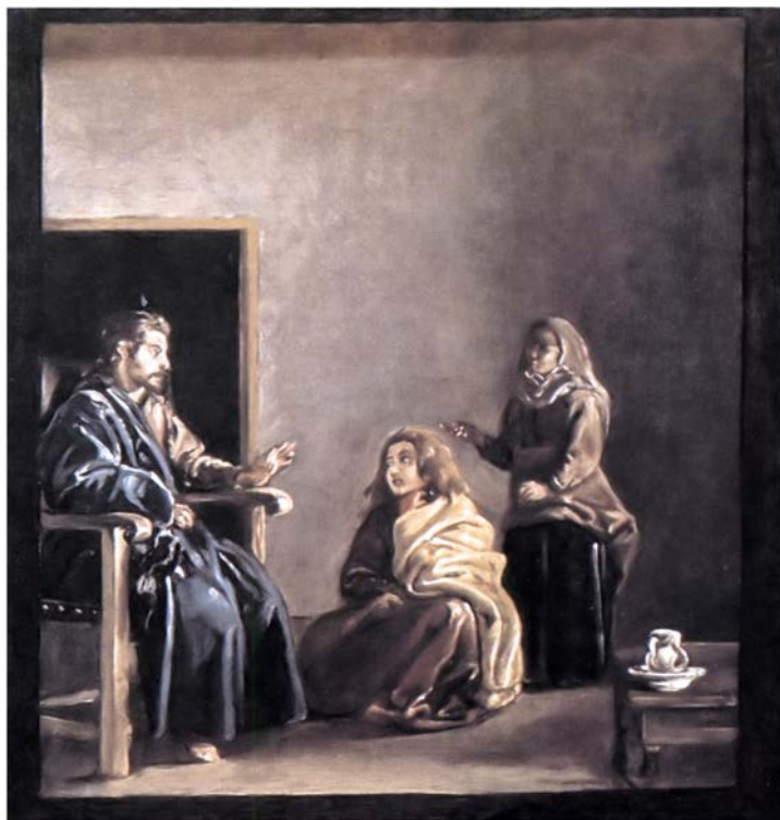
Веласкес. Христос в доме Марфы и Марии (Фрагмент. Изображение в зеркале)