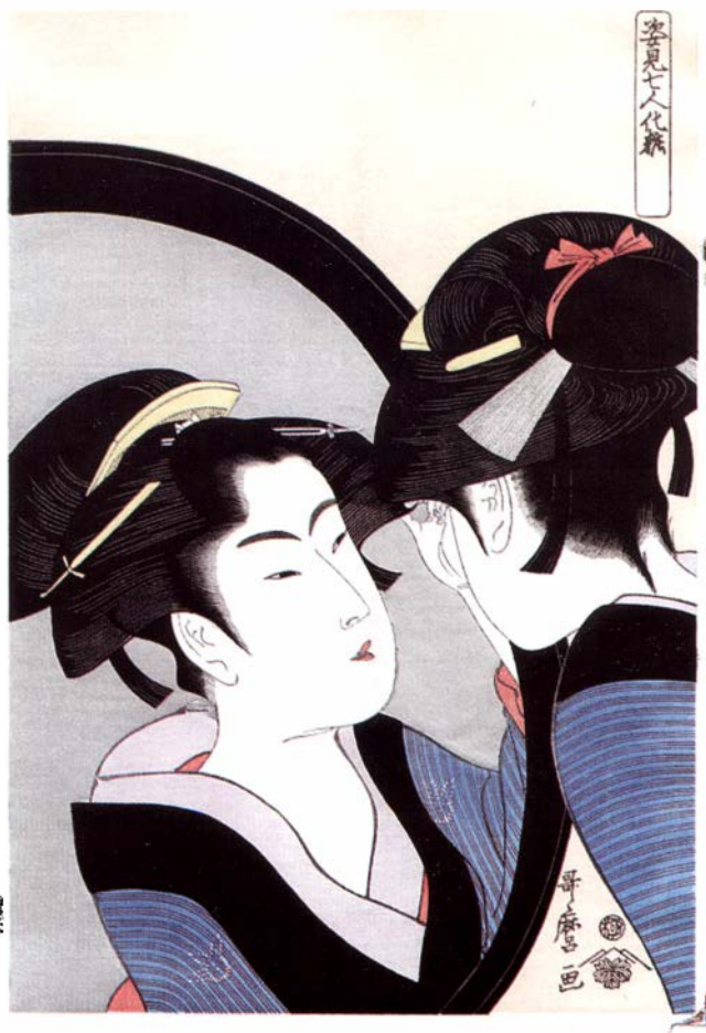
Утамаро. Женщина, смотрящаяся в зеркало. 1792