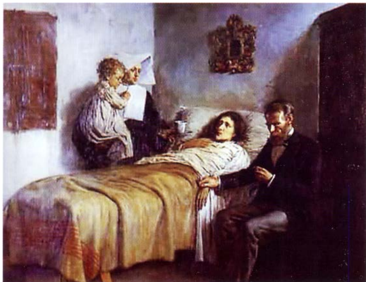
Пикассо. Наука и милосердие. 1897