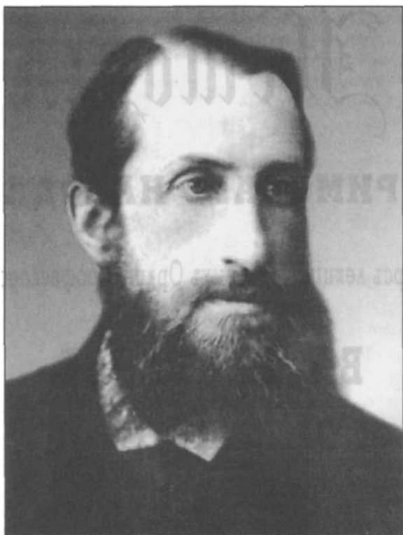
Владимир Иванович Герье