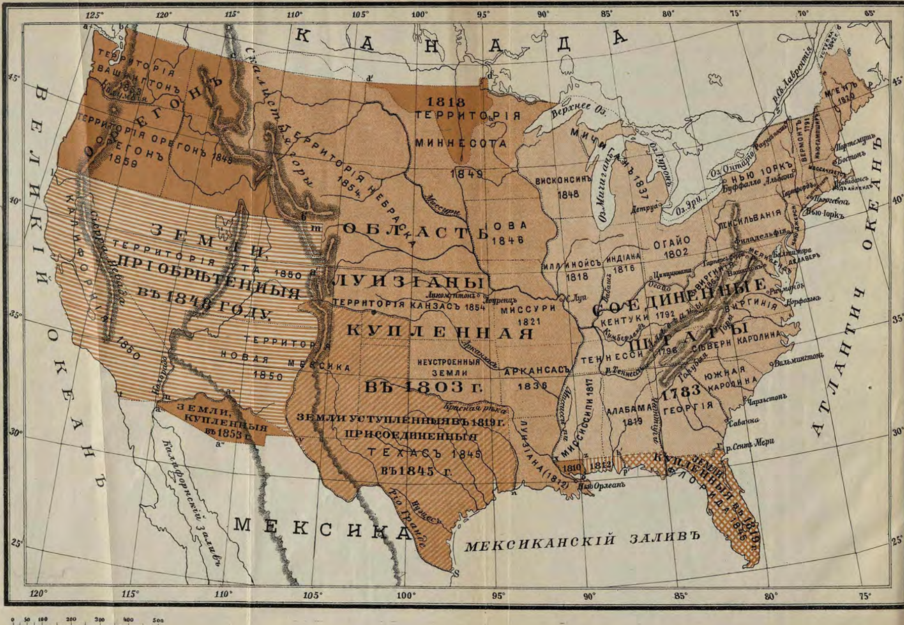
Карта № 2, къ главамъ V—IX.