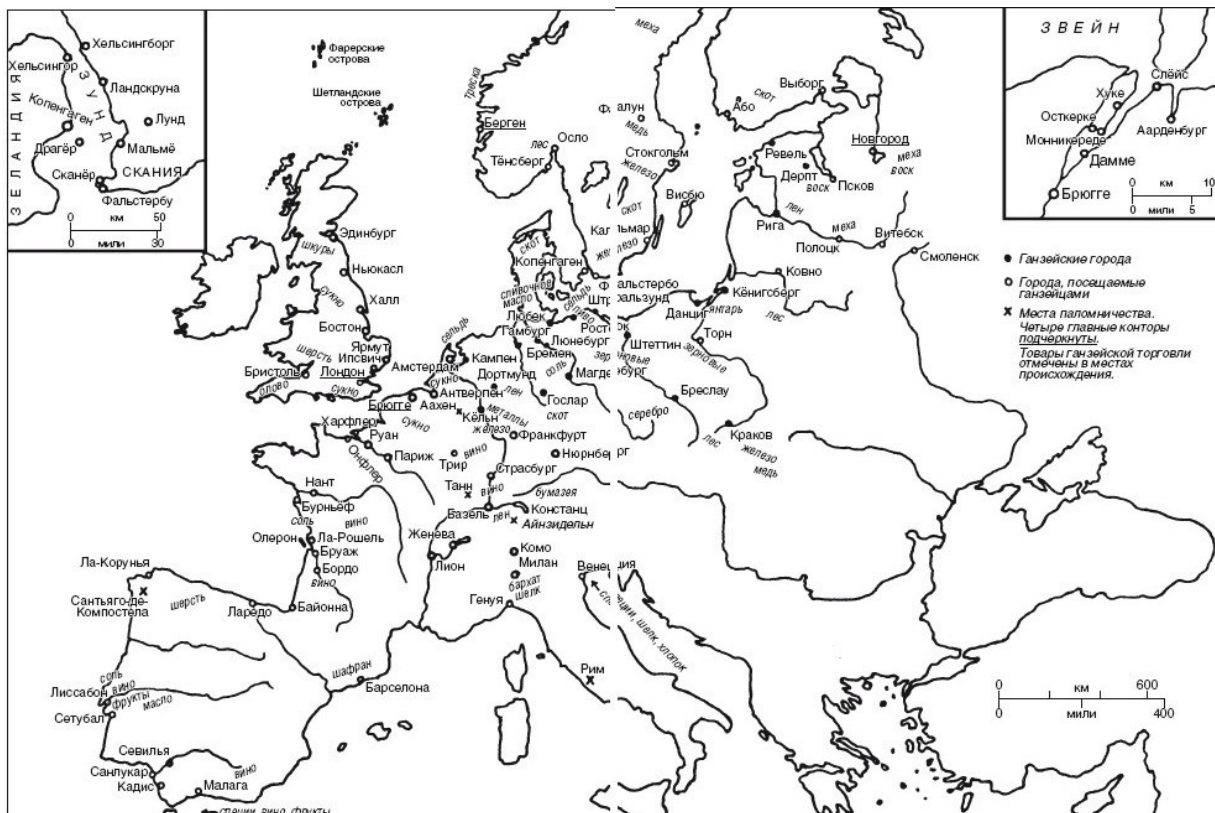
Ганзейская торговля в Европе (XV в.)

Но какие города входили в Ганзу во второй половине XIV в.? Данный вопрос всегда считался одним из самых сложных в истории союза. Ответ может различаться в зависимости от того, какой смысл вкладывать в понятие «ганзейский город». Оно может означать либо «город, чьи купцы, находясь за границей, принимались в контору и пользовались ганзейскими привилегиями», либо «город, который принимал активное участие в организации и операциях Ганзейского союза и нес свою долю расходов», иными словами, город, который, прямо или косвенно, получал приглашения на Ганзейские соборы.