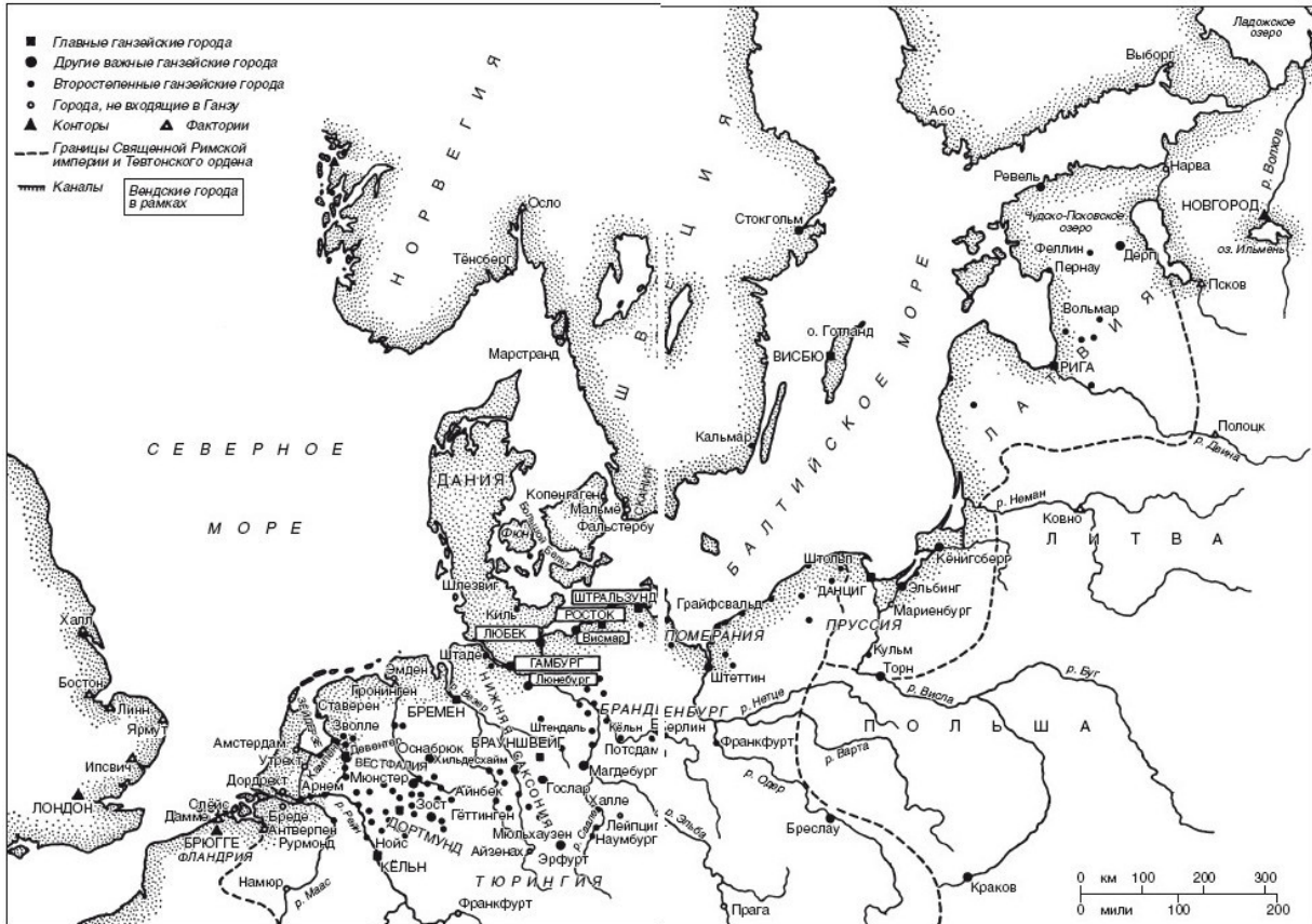
Ганзейские города (XIV–XV вв.)

На востоке уния 1386 г. между королевством Польским и Великим княжеством Литовским не слишком меняли общее положение. В одном смысле христианизация Литвы, последнего оплота язычества в Европе, благоприятствовала проникновению Ганзы в страну. Более серьезным ударом стало поражение Тевтонского ордена при Танненберге в 1410 г. Авторитет Тевтонского ордена, который немало способствовал росту престижа Ганзы, оказался подорван. Долгий период смуты, пагубной для торговли, окончился Торуньским миром в 1466 г. По условиям мирного договора Восточная Померания, устье Вислы, Торн, Данциг и Эльбинг переходили в руки поляков. И все же эти политические потрясения не имели продолжительного влияния на ганзейскую торговлю, что доказывает последующее развитие Данцига (Гданьска).