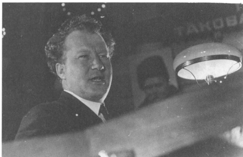
П.Ф. Юдин на I съезде ССП СССР