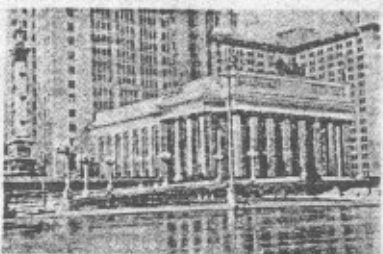
Актовый зал — один из архитектурных шедевров Московского государственного университета. Сдача в срок работы бригады архитекторов: Козлова и Козлова. На снимке: зал в стадии строительства.