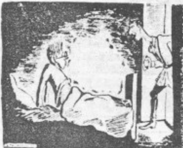
Или сверхкооперативное руководство

3 Почему так трудно учиться в школе? Почему так трудно учиться в школе? Почему так трудно учиться в школе?