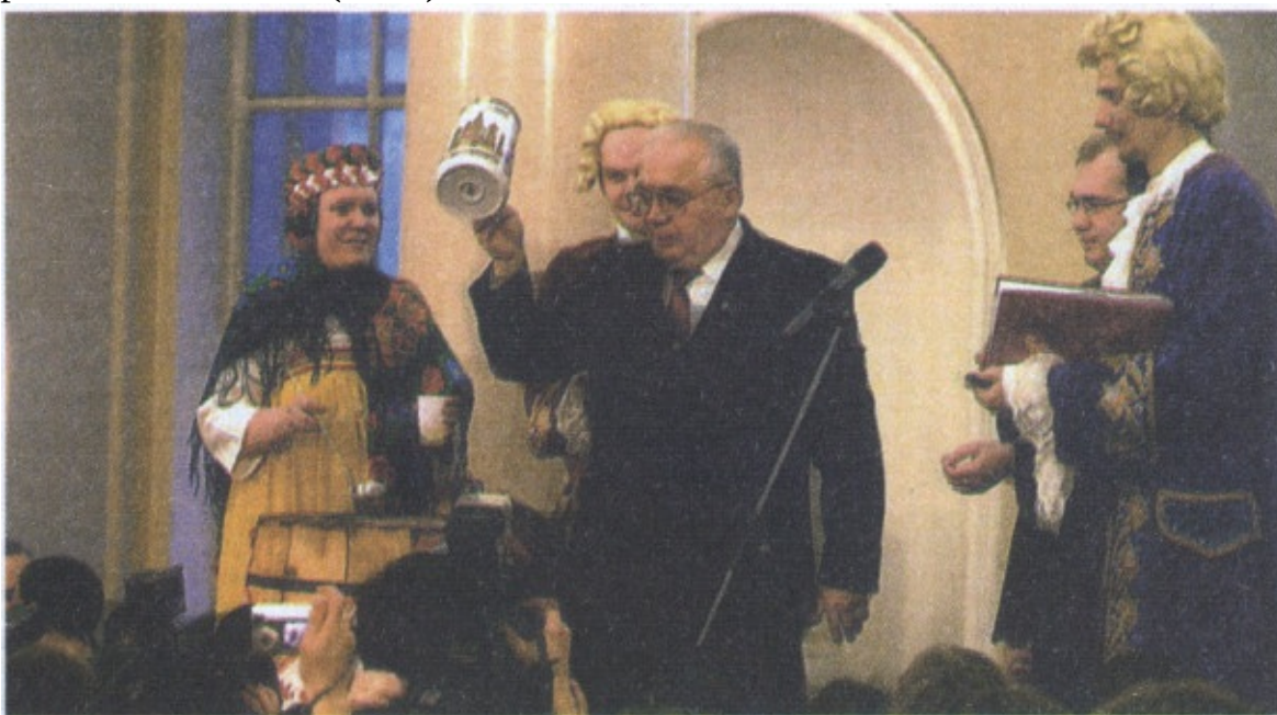
Татьянин день – день основания университета