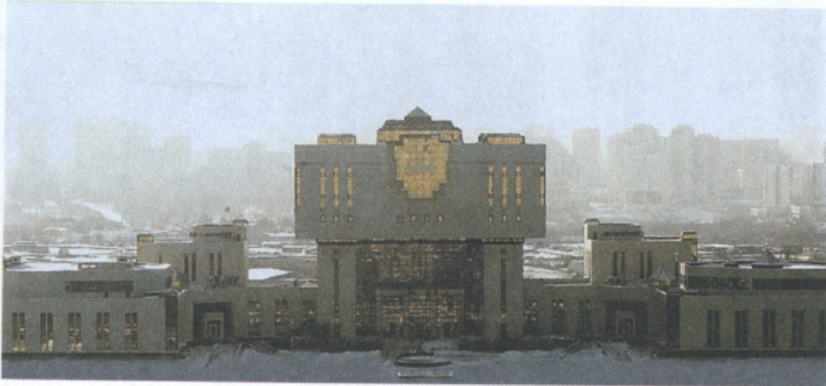
Фундаментальная библиотека Московского университета (декабрь 2004)