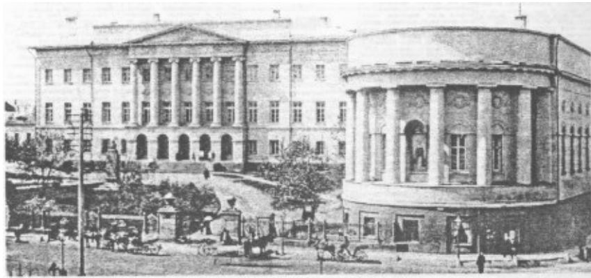
Аудиторный корпус университета в конце XIX века