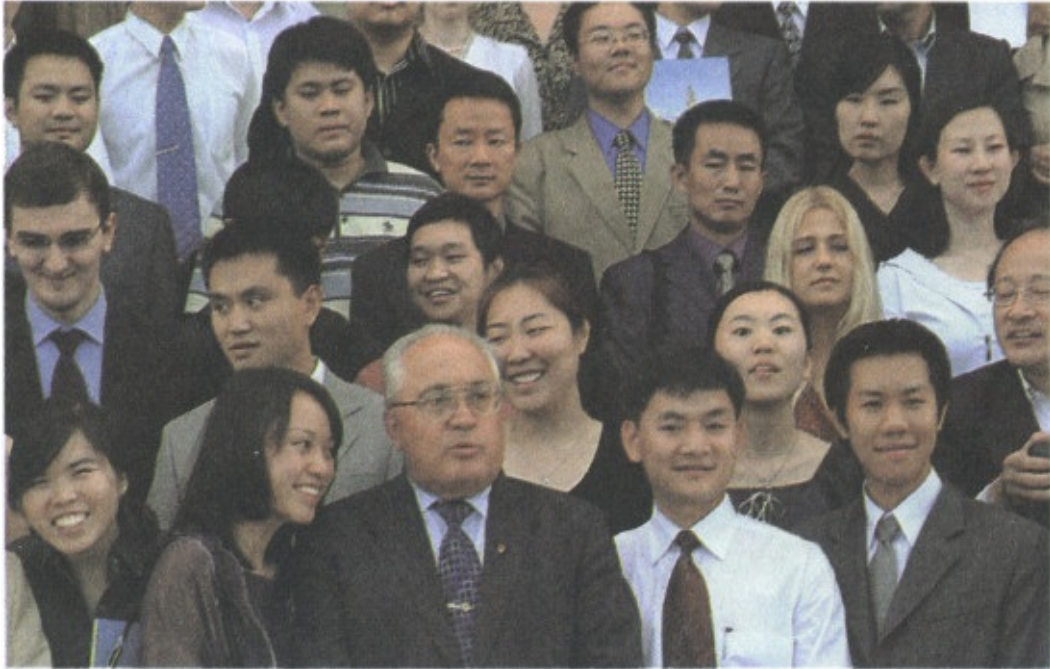
Иностранные студенты-выпускники МГУ