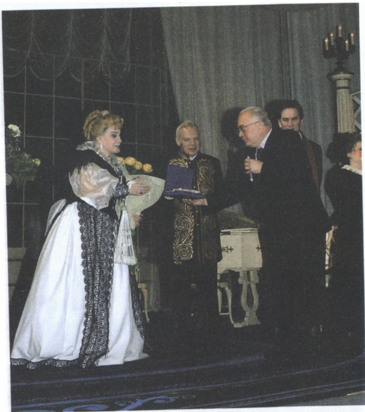
Московский университет принимал участие в создании Малого театра. Профессора и преподаватели МГУ в гостях у коллектива Малого театра