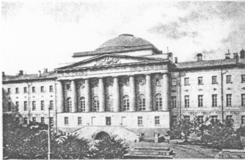
Главное здание университета в конце XIX века