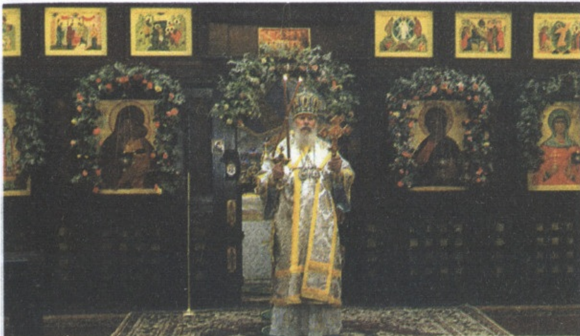
Богослужение Патриарха Московского и Всея Руси Алексия Второго в церкви Св. Татианы (2004)