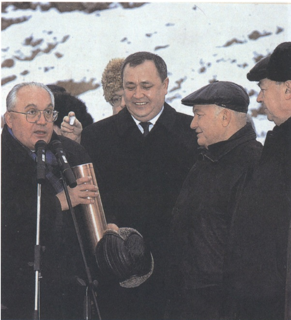
Мэр Москвы Ю.М. Лужков и ректор МГУ В.А. Садовничий закладывают капсулу в фундамент нового корпуса библиотеки МГУ (24 января 2003)