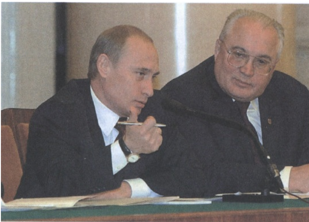
Президент Российской Федерации В.В. Путин на заседании VII Съезда Российского Союза ректоров (2002)