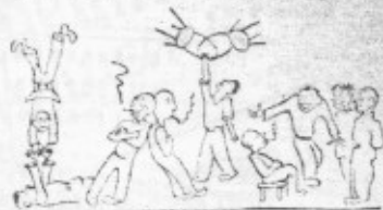
Стратегия победы в игре — это умение анализировать ситуацию и принимать правильные решения.

Вопрос. Почему так трудно учиться в школе?