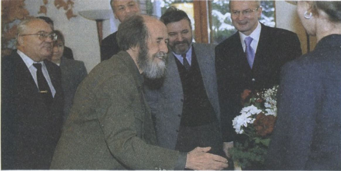
Встреча с почетным профессором МГУ А.И. Солженицыным (2003)