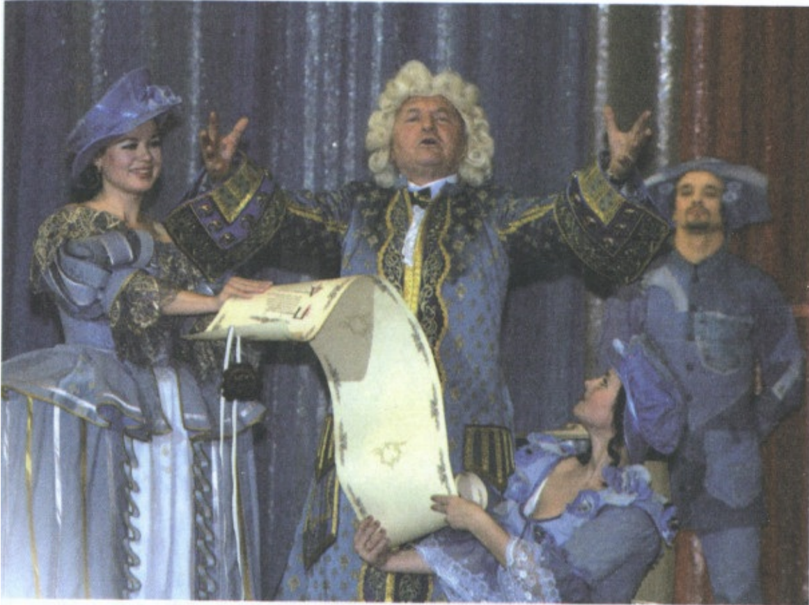
Мэр Москвы Ю.М. Лужков читает «Оду во славу университета» (январь 2005)