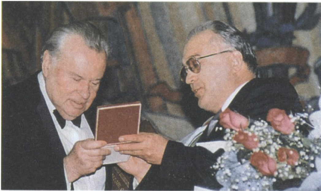
Народный артист СССР, почетный профессор МГУ Е.Ф. Светланов (1998)