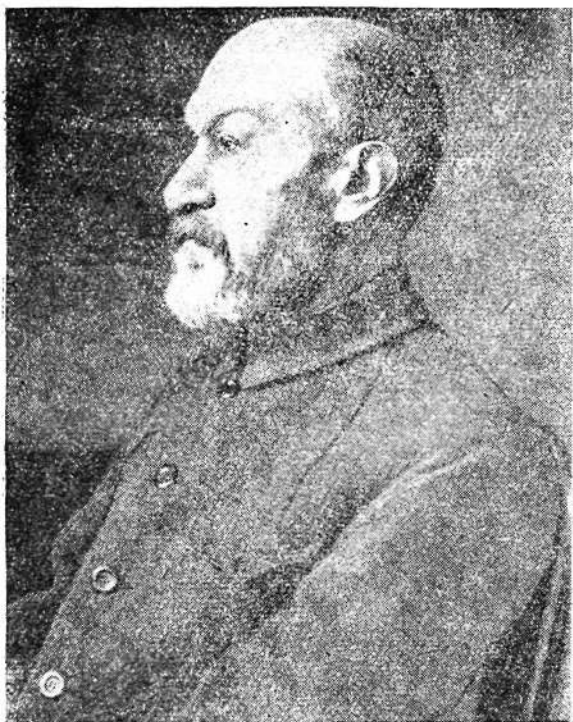
Рис. 8. Василий Владимирович Бартольд.

Целью поездки было «в дополнение к письменным известиям о прошлом страны 63 собрать на месте сведения о следах, оставленных прежними обитателями ее», по возможности дать краткое описание развалин городов, укреплений и т. п.