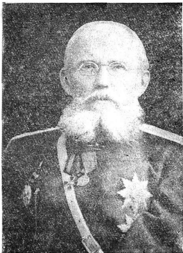
Илья Гитович Пославский.