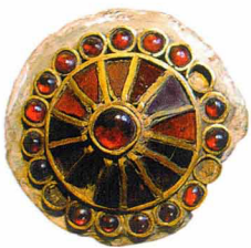
Навершие рукояти меча из гробницы боспорского аристократа. Первая половина V века

готу, готу же полезно подражать римлянину». Самобытная демократия не мешала королям признавать себя подданными византийского императора, и даже политически независимые государства франков, ост- и вестготов, лангобардов и гепидов считали себя вассалами империи, ее неотъемлемой частью. Могущественный король франков Хлодвиг — один из первых Меровингов — получил звание консула, а Теодорих был наместником византийского императора и проникновенно сообщал в письме византийскому двору: «Мы преклоняемся перед титулами, даруемыми императором, более, чем перед нашими собственными».