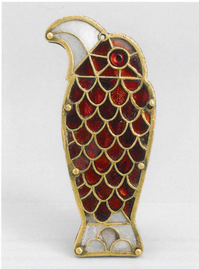
Накладка на ремень. Могила варварского вождя у села Концешты. Начало V века

за наемнические услуги, оказанные римлянам каким-нибудь вождем. Но кто же похоронен в этой могиле — гуннский или готский князь, римский офицер? Один персонаж, который был одновременно и готом по происхождению, и римским генералом по должности, хорошо известен как раз в это время. Это Гайна — начальник императорской гвардии в Константинополе, на закате своей карьеры бежавший «домой» — за Дунай, к соплеменникам. Не его ли это могила? Ответить уверенно на этот вопрос невозможно.