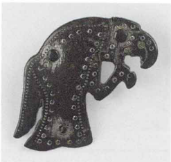
Броши Одина. Пара германских накладок. VII век