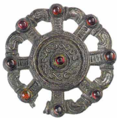
Стайка птиц на круглой фибуле. VII век

IV века, при императоре Константине, изображения орлов на штандартах стали вместо объемных плоскими и, по-видимому, именно такой образ заимствовали германцы.