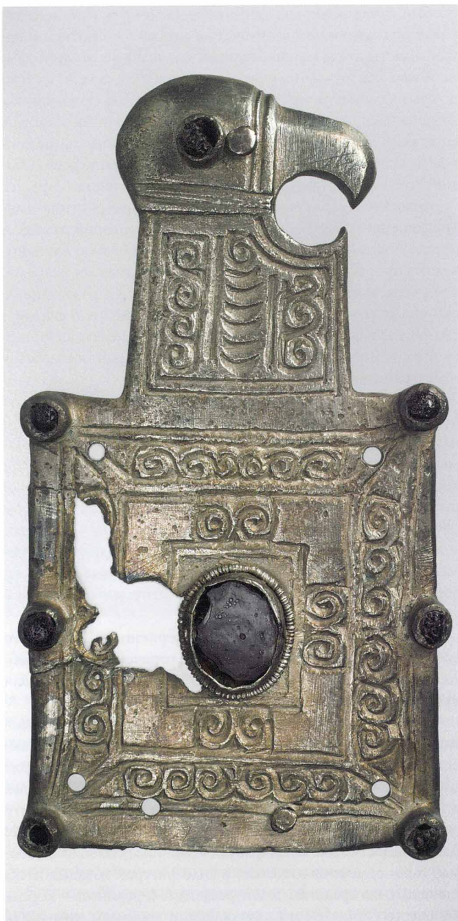
Деталь готской пряжки. Начало VII века