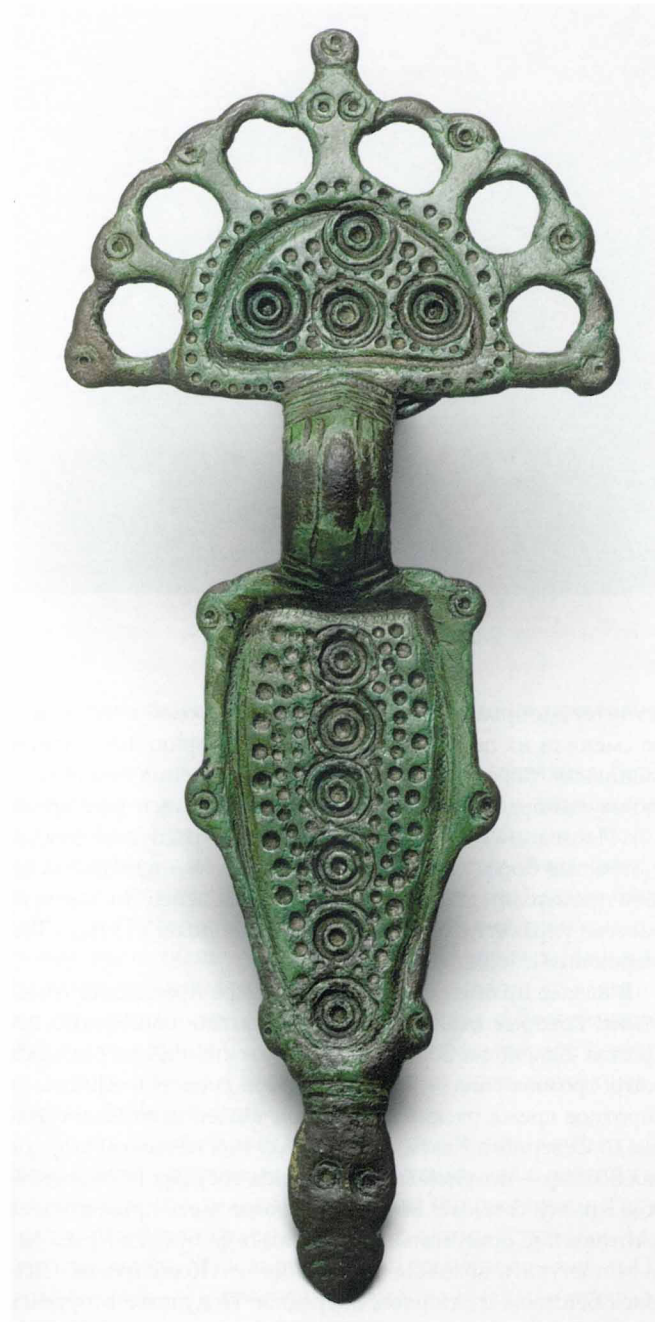
Антская фибула из Поднепровья. Кайма из птичьих головок германского образца. Первая половина VII века

Население различных областей домена Хлодвиг, включая бургундов и саксов, объединилось и после казни злополучной Брунгильды провозгласило единым монархом Хлотаря II. Случилось это в 584 году. Династическим усобицам пришел конец. Поэтому за Хлотарем и его сыном Дагобертом, наряду с прозвищем «длинноволосые», закрепился еще