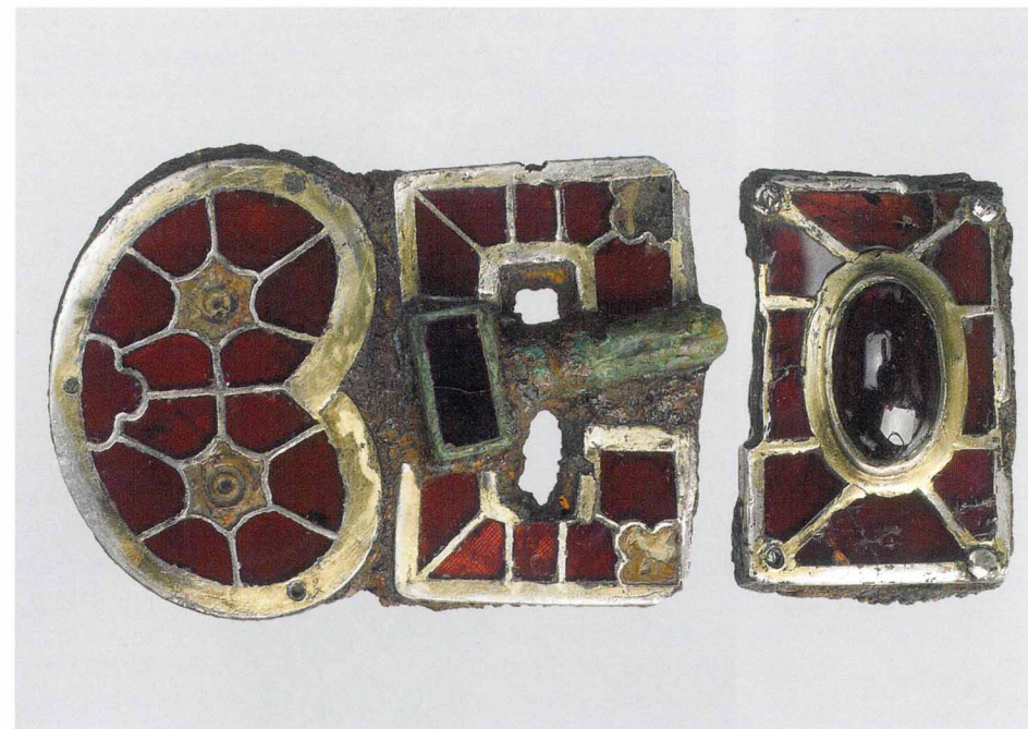
Пряжка и накладка. Работа средиземноморских мастеров. V век

датируется первой третью V века, временем, довольно ранним для этого стиля.