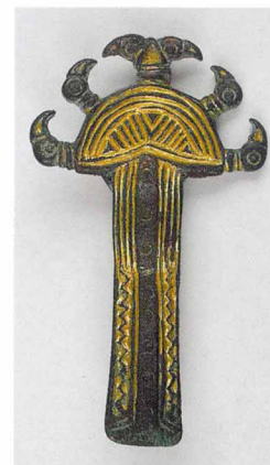
Франкская фибула. Середина VI века