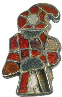
Орел, выполненный в технике перегородчатой инкрустации. Франки. VI век

Многовековая история Рима, прошедшая в непрерывных войнах, научила императоров не только усмирять агрессивность соседних народов, но и извлекать из нее пользу. Различные германские племена, периодически прорывавшиеся сквозь линию пограничных лагерей («лимес»), вовсе и не надеялись сокрушить Вечный город, вполне осознавая свою малость на фоне его величия. Все крупные нашествия германцев — это «бегство вперед», вызванное бедствиями в самом варварском мире: голодом, войнами, эпидемиями, природными катастрофами. Римская империя казалась полудиким и полуголодным племенам землей обетованной. Тюркский каган писал императору Юстиниану: «В вашей империи есть все, включая, кажется, даже невозможное». Вот почему многие племена предпочитали искать средства к существованию не грабежом, а защитой римских провинций. Варвары охотно становились римскими солдатами. Такое положение дел вполне устраивало и империю.