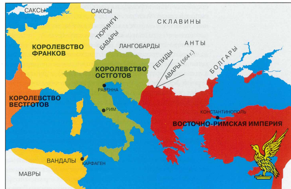
Страны и народы Европы в начале эпохи Меровингов

Для римских граждан поздней империи воинская служба перестала быть «священным долгом и почетной обязанностью». Когда германский вождь Одоакр выступил против Ромула Августула, последнего императора Запада, на его защиту встали только незначительные подразделения римской армии, полностью состоящие из варваров-германцев. Уже в середине V века в составе римских войск на территории Италии не осталось почти ни одного римского по