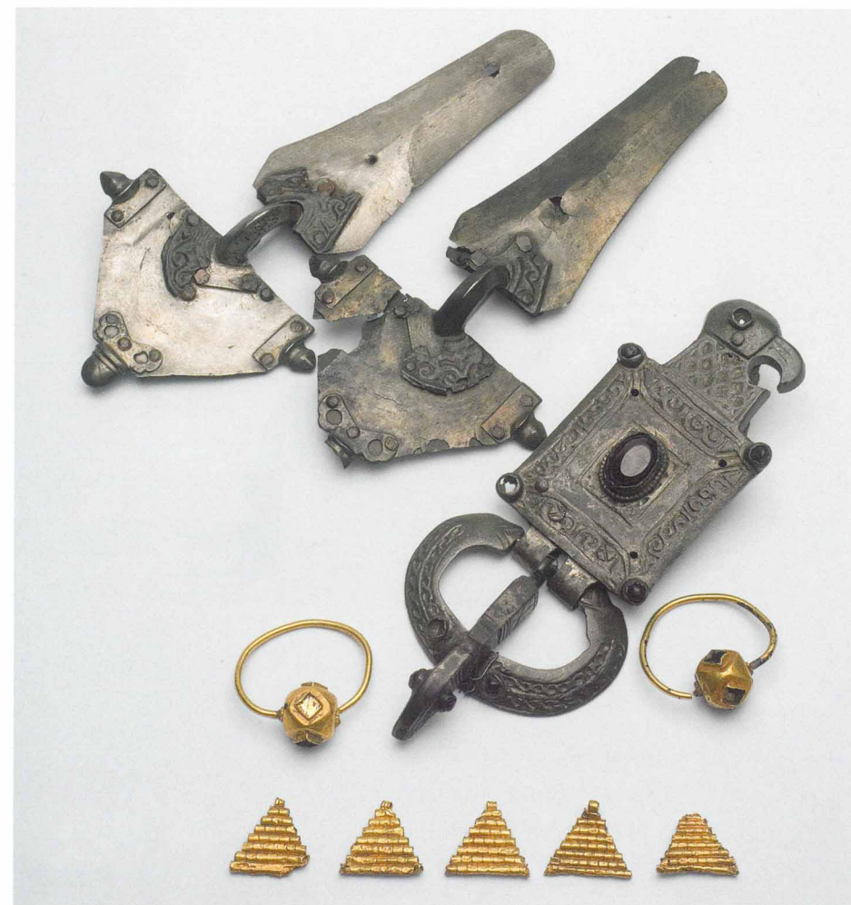
Типичный женский набор украшений готов: двупластинчатые фибулы, серьги, подвески, орлиноголовая пряжка. V–VI века

В этом суровом образе с хищным обликом зарождающаяся единая Европа нашла универсальный символ, настолько богатый внутренним содержанием и знаковым выражением, что он был способен объединить мировоззрение и римлян, и варваров; и франков, и славян; и королей, и воинов;