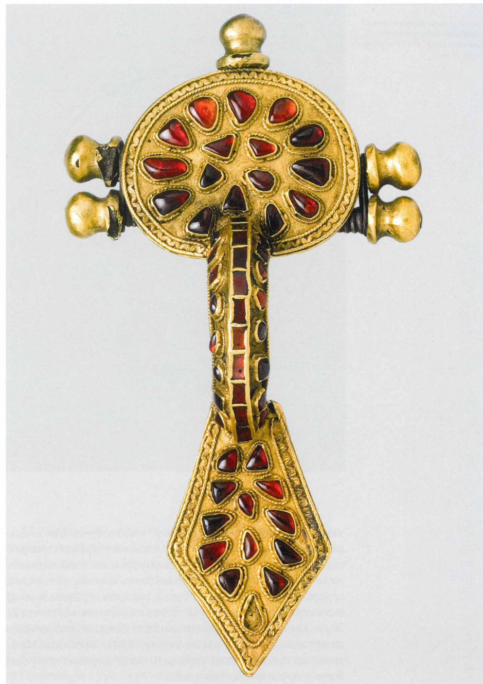
Готская фибула, украшенная в полихромном стиле. Клад у села Нежин. Середина V века

Варварская «аристократия» очень полюбила подобные украшения. Наверное, цветовая гамма полихромного стиля хорошо соответствовала ее вкусам и мировоззрению: помпезные