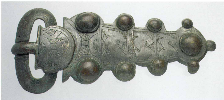
Пряжка с гравированным орнаментом. Франки. Начало VII века

сменившись более скромными, хотя и не менее замысловатыми серебряными изделиями с гравированным рисунком.