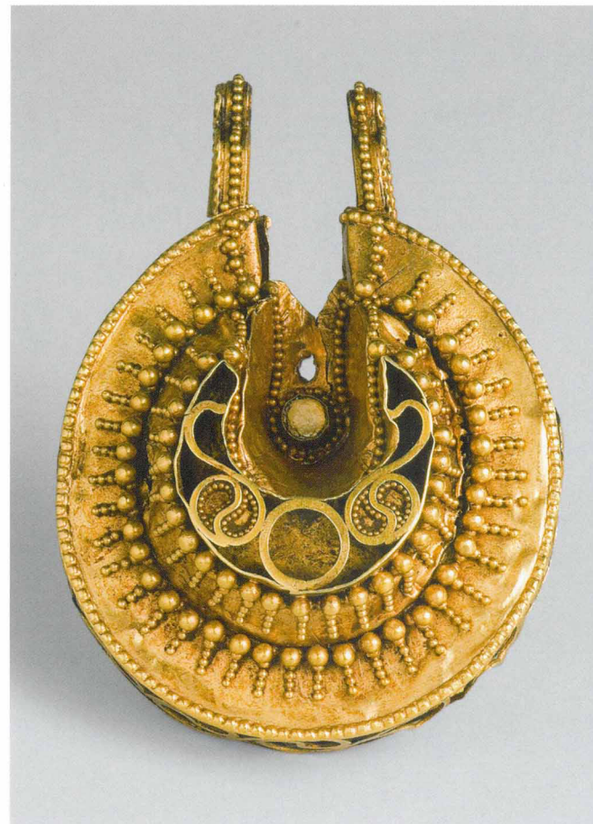
Подвеска — колт. Причерноморские кочевники — болгары. VI век

золотые вещи с гранатами словно густо забрызганы каплями крови, а блеск зерни вокруг усиливает эффект призрачного мерцания золота. Особенно популярны были женские застежки — фибулы, которые носились парами на плечах и скрепляли детали одежды. Тяга к роскоши привела к тому, что в середине V века такие застежки увеличились почти до 30 см в длину, а весить могли полкило каждая. Тяжкая ноша на хрупкие женские плечи, но зато какая красивая! Мужчины же предпочитали украшать самое дорогое, что у них было — оружие и боевых коней.