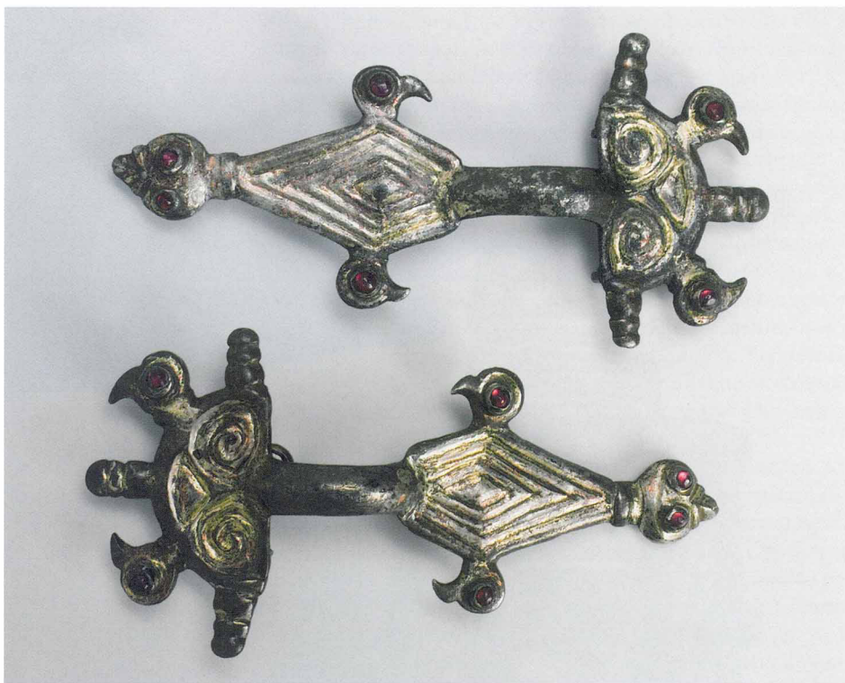
Пальчатые фибулы Боспора, изготовленные по образцам италийских украшений. Первая половина VI века

и не дал ему имени? Не был ли этот символ позаимствован в эпоху активных контактов с империей, когда легионы с их орлами-штандартами перестали быть римскими по составу и превратились в германские подразделения? И не демонстрация ли это единства происхождения народов франков и римлян, на котором настаивают генеалогические легенды Меровингов? Вполне возможно.