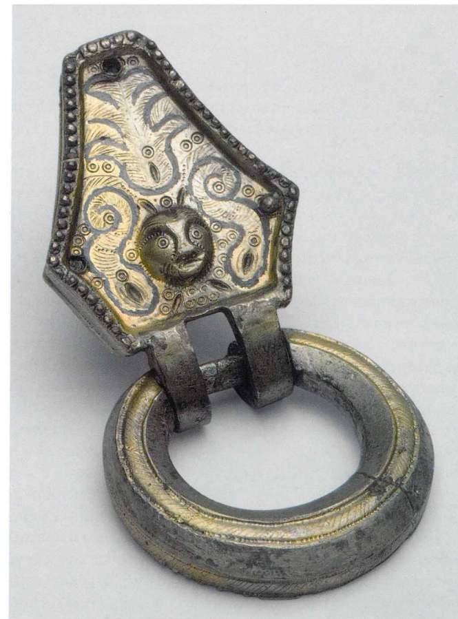
Пряжка из погребения гуннского вождя. На поясе степняка — бог морей в окружении морских животных. Середина V века

Сыну легендарного Меровея, Хильдериху, было уготовано стать первой исторической фигурой в династии, хотя никакими громкими деяниями он не прославился. «Король Хильдерик» — гласила латинская надпись на массивном золотом перстне, красовавшемся на пальце мужчины, захоронение которого было обнаружено в 1653 году в городе Турнэ (Бельгия). Мало того, еще и портрет короля был выгравирован в центре щитка — перстень использовался как печать. С копьем в руке, с длинными вьющимися волосами — настоящий Меровинг. Франки называли своих королей «длинноволосыми»: мужчинам королевской крови было запрещено стричь волосы от рождения и до самой смерти.