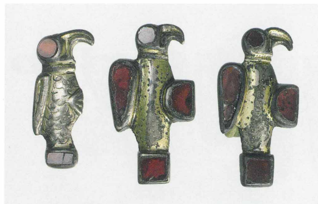
Фибулы в виде фигурок птиц. Франки. VI—VII века

И плакировка, и инкрустация проволокой по отдельности в античном мире практиковались и раньше, но сочетание их друг с другом — это по-видимому, собственная идея франкских мастеров. Их привлекала сравнительная простота и дешевизна этой техники, которая позволяла создавать видимость дорогих и массивных серебряных вещей. Площадь покрытия изделий серебром была так велика, что часто создавалось обратное впечатление — будто бы серебряная вещь инкрустирована железом.