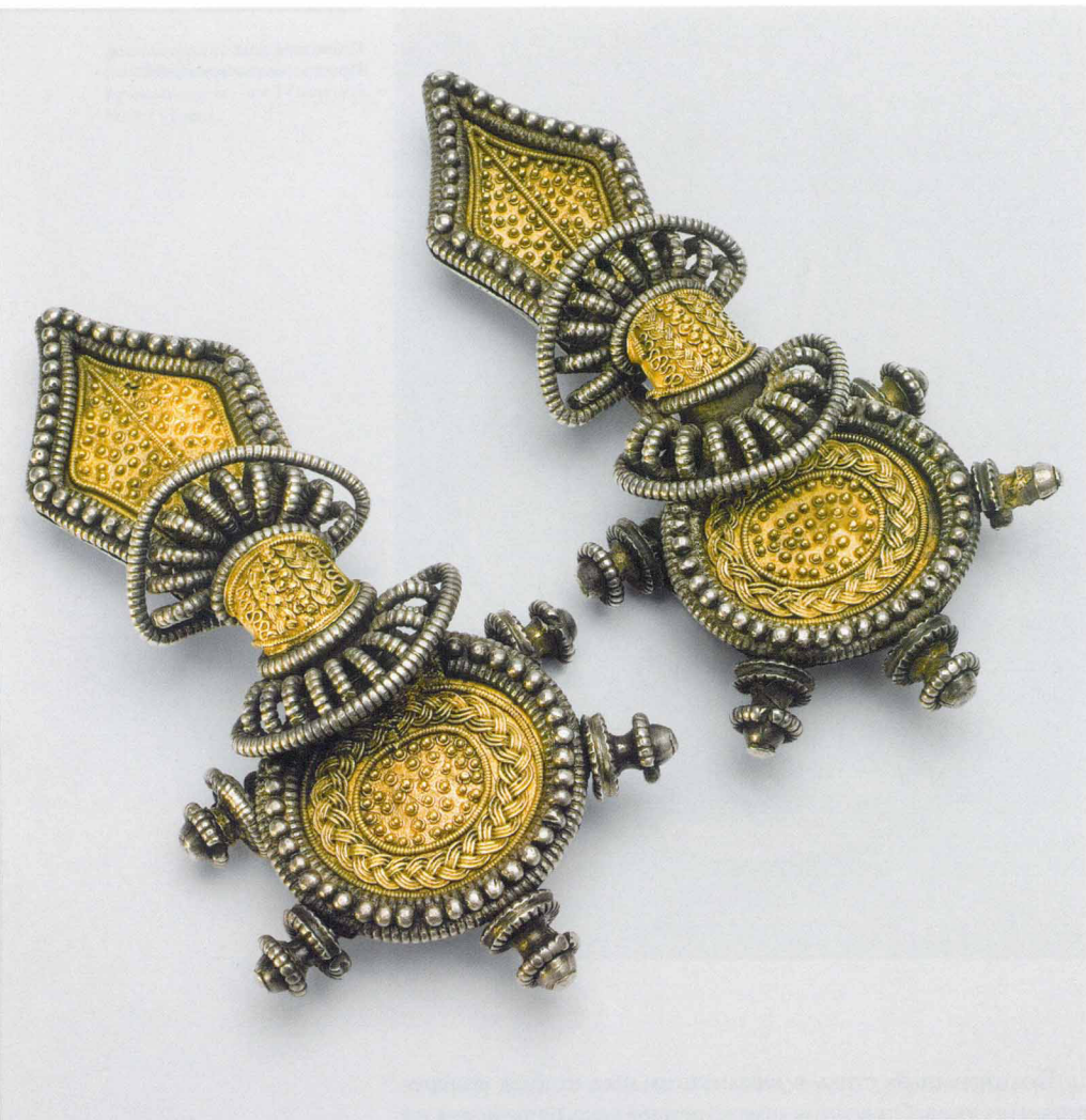
Двупластинчатые германские фибулы. Совершенная позднеримская филигрань. Начало V века