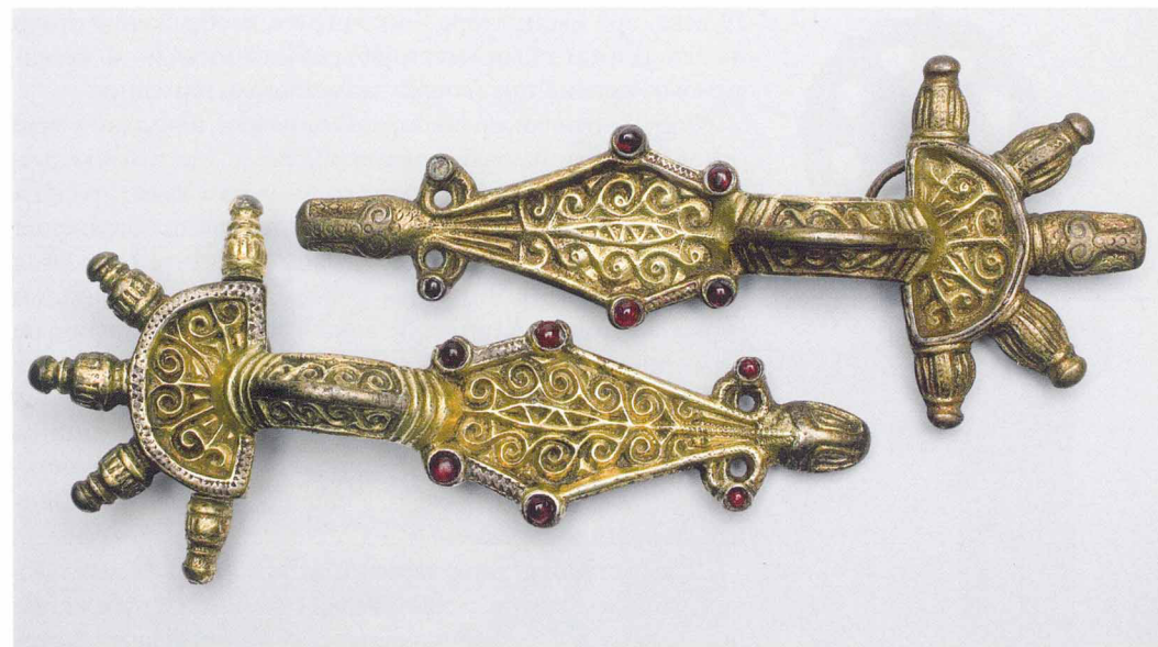
Пальчатые фибулы из Италии времен Теодориха Великого. Великолепный образец техники кербшнита

в часы досуга ювелирным ремеслом. Не его ли рук дело мы рассматриваем сейчас?