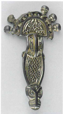
Лангобардская фибула из Равенны. Конец VI века