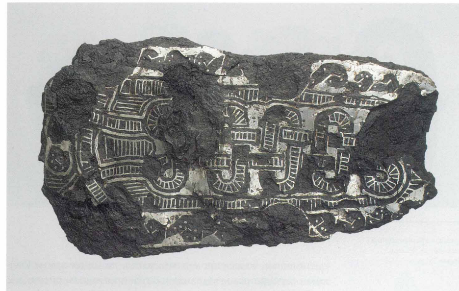
Железная поясная пластина с таушированным орнаментом. Франки. VII век

В начале правления Хлотаря II в мире произошли изменения, которые отразились и на развитии ювелирного искусства. Далеко на Востоке, в монгольских степях родилась новая грозная сила — каганат тюрков династии Ашина, за короткое время раскинувший свои владения от Саяно-Алтая до Северного Кавказа. В 576 году под натиском тюрков пал Боспор — полунезависимый город-государство в восточном Крыму, сателлит Византии. Вскоре здесь прекратилось изготовление оригинальных пальчатых фибул, и в Крым начали поступать похожие украшения из Поднепровья. Спасаясь бегством от тюрков, в Среднее Подунавье вторглись