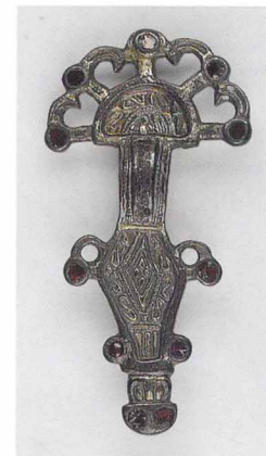
Италийская фибула с каймой из птичьих головок. Трехгранно-выемчатая резьба. Начало VI века

Пальчатые фибулы стали чрезвычайно популярны по всей Европе. Законодателями моды на первых порах выступали остготы Италии. Именно их продукция служила образцом для подражания у мастеров Крыма, Среднего Подунавья и Северной Европы. В середине VI века культурный центр сместился на север, к франкам, где стали возникать новые разновидности пальчатых фибул. А еще там особенной любовью были отмечены застёжки в виде фигурок хищных птиц. Даже один из представителей династии Меровингов — король Хильперих (561—584 гг.), как сообщают хроники, занимался