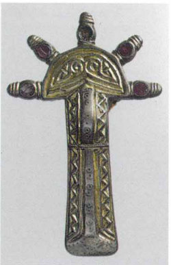
Пальчатая фибула франков. VI век

с собой моду на германские пальчатые фибулы, позаимствованную у союзников. Готские фибулы стали прототипами для изготовления собственных вариантов украшений, более крупных и не серебряных, а бронзовых. В VII веке уже трудно было представить себе антскую даму без пары фибул на плечах. Орнамент на днепровских фибулах был более простым, но любовь к орлиным головкам привилась и здесь.