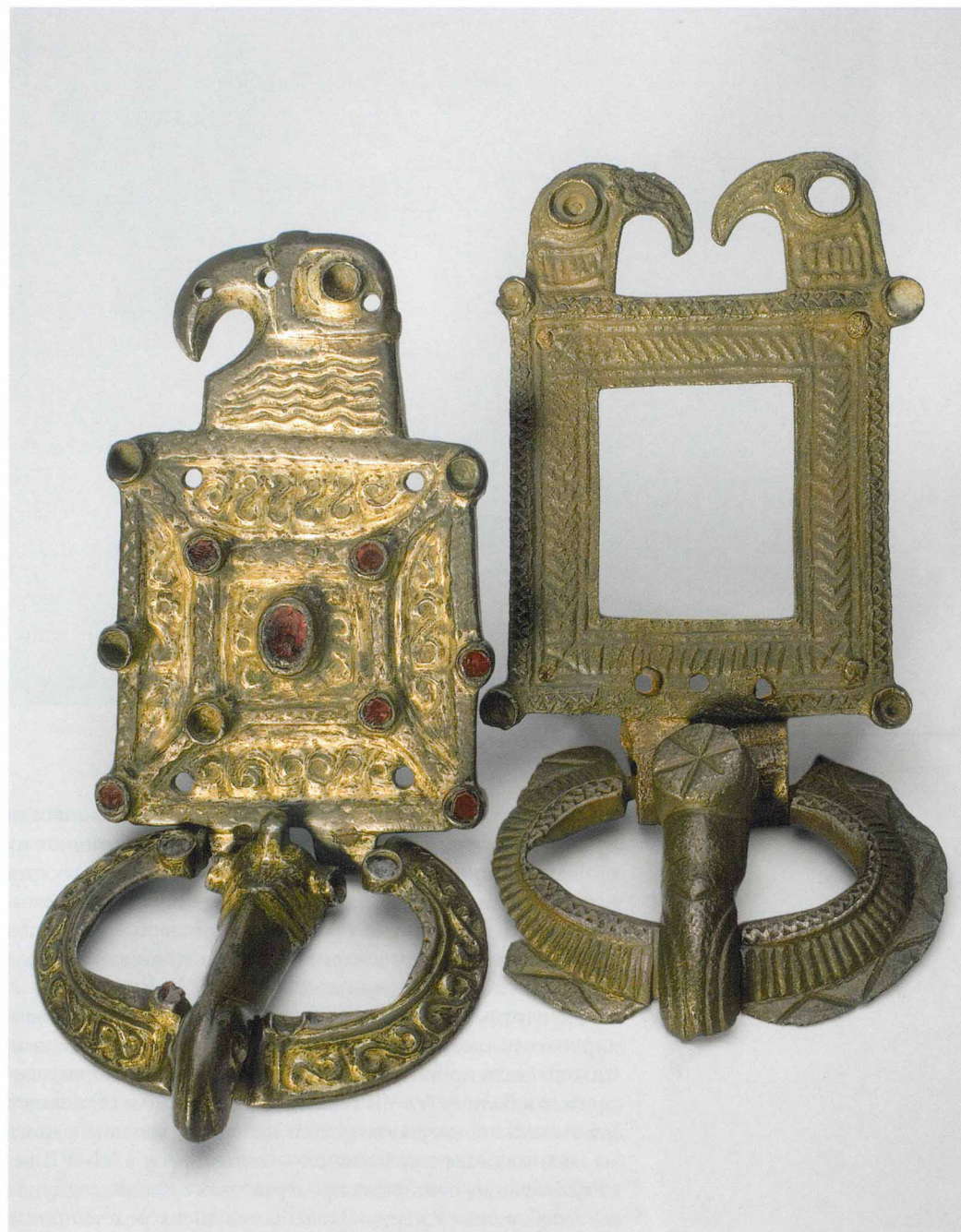
Орлиноголовые гепидские пряжки из Крыма. Вторая половина V века

И еще одна деталь смущает в образе этой птицы. Древнегерманская мифология чрезвычайно образна, богата сюжетами, событиями, как правило, подробно описываются судьбы каждого из ее героев. Единственный персонаж, «биография» которого полностью отсутствует, — этот орел. У него даже нет личного имени, при том что имена имеют не только все одушевленные персонажи германских мифов, включая животных, но даже мечи, топоры, корабли. Орел безымянен. Кто, когда, почему посадил его на вершину мирового древа