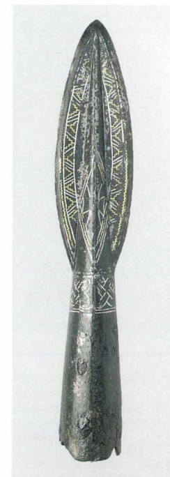
Наконечник копья, инкрустированный серебряной проволокой. Аламанны. VII век

Удивительным образом характерный набор женских украшений в V—VII веках идентичен на огромных пространствах