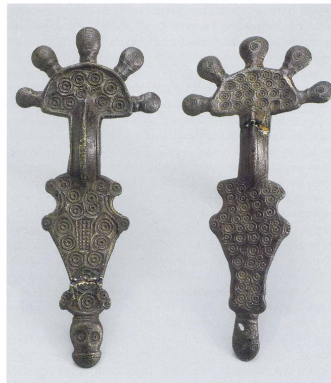
Пальчатые фибулы днепровского типа. Крым. Первая половина VII века

Но спустимся с мирового древа обратно на землю. Популярность пальчатых фибул со временем возросла настолько, что они стали проникать даже в иную этническую среду, например к балтам. А в VII веке пальчатые фибулы становятся неотъемлемой частью женского набора украшений одного из главных славянских племен — антов. Анты в VI—VII веках обитали на обширных пространствах от низовьев Дуная до левобережья Днепра. Западнее жили их родственники