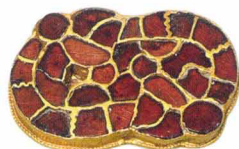
В хитросплетении перегородок фибулы можно различить две птичьи головы. Бавары. V—VI века

Великолепный образец ювелирного искусства клаузоны — накладка в виде орла, найденная в погребении варварского вождя на территории Румынии, у села Концешты. Горделиво поднятая голова, мощный клюв, инкрустированный перламутром, великолепное оперение, не просто точно переданное формой ячеек, но еще и дополненное листочками рифленой золотой фольги, подложенными в каждую (!) ячейку. Такая потрясающая по тонкости работа могла быть выполнена только в одной из мастерских Римской империи, особенно учитывая, что погребение