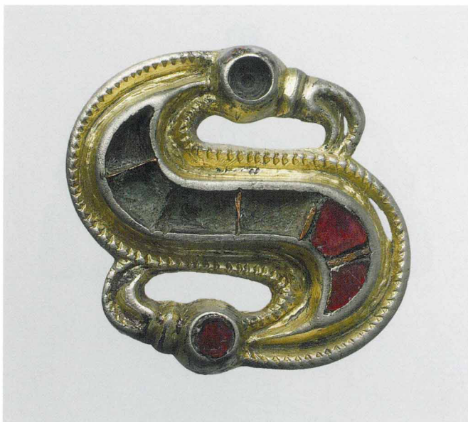
Фибула баваров в виде буквы S с двумя орлиными головками. VI век

и эпитет «добрые» короли. Но добрых королей очень быстро сменили их потомки, вошедшие в историю под именем «ленивых», так как реальные бразды правления они отдали своим майордомам, и усобицы продолжились уже среди них. Последний Меровинг Хильдерик III, «распустив волосы и отрастив бороду, восседал в одиночестве и изображал из себя правителя», как писал один из летописцев. Хильдерика сместил управитель его собственного дворца в 751 году. Так Меровинги сменились Каролингами.