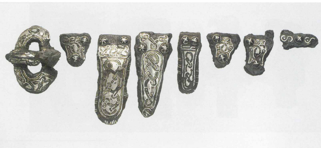
Детали воинских поясов франков. Тауширование. VII век

от Крыма до Испании, населенных различными германскими племенами. Отличаются лишь незначительные элементы убранства и их декор, но в целом набор аксессуаров стандартен: крупные серьги с бусиной на висках, пара фибул на плечах (кроме пальчатых, были еще гладкие, без орнамента — так называемые двупластинчатые фибулы), ожерелье из бус и подвесок, орлиноголовая пряжка на поясе. Костюм германской дамы, будь то вестготка, лангобардка или гепидка, строго следует одной общей традиции.