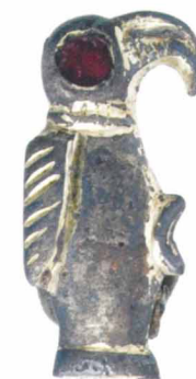
Фибула — птичка. Франки. VI век

Почему условной? Дело в том, что кризис назревал уже очень давно. После 330 года, когда в качестве столицы был освящен Константинополь, город Рим перестал быть резиденцией императорской власти, и западная половина навсегда утратила роль культурного и политического ядра державы. Еще задолго до 476 года целые области западной части империи, оккупированные варварами, стали отпадать от Рима. Все основные функции государства оказались сосредоточены в восточной части империи — Византии. В ее столице мало кто обратил внимание на то, что где-то на Западе, в Равенне, был смещен с престола малолетний Ромул Августул. Римские сенаторы давно говорили, что одного императора, в Константинополе, вполне достаточно.