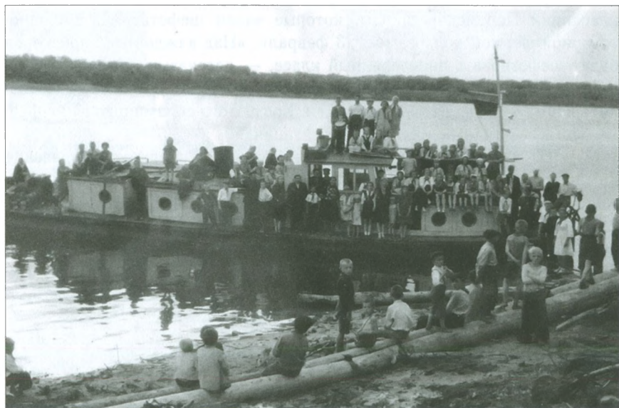
Катер с пионерами на борту. 50-е гг.