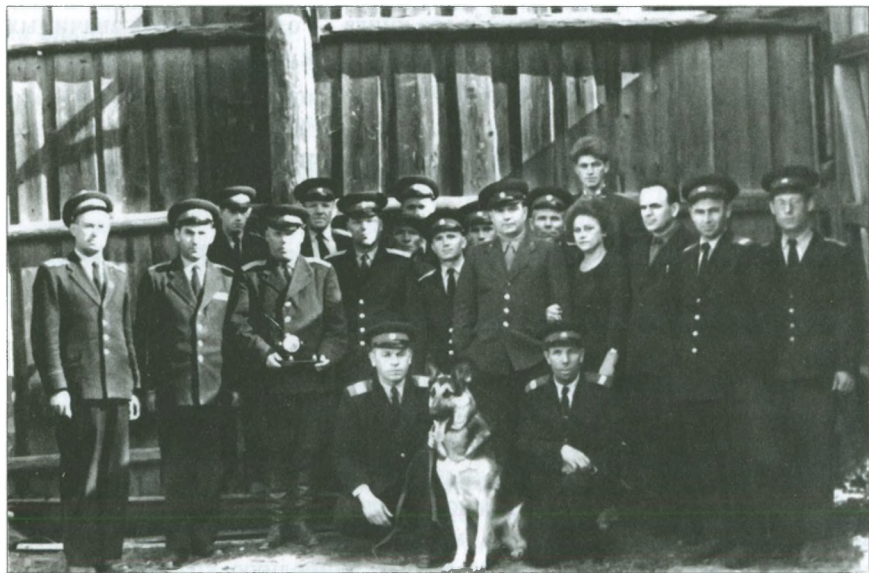
Сотрудники добрянской милиции. 1967 г.

Сразу два похожих случая пришлось на 1966 год. 16 апреля только чудо и отвага спасли ученицу второго класса из с. Липово, которая