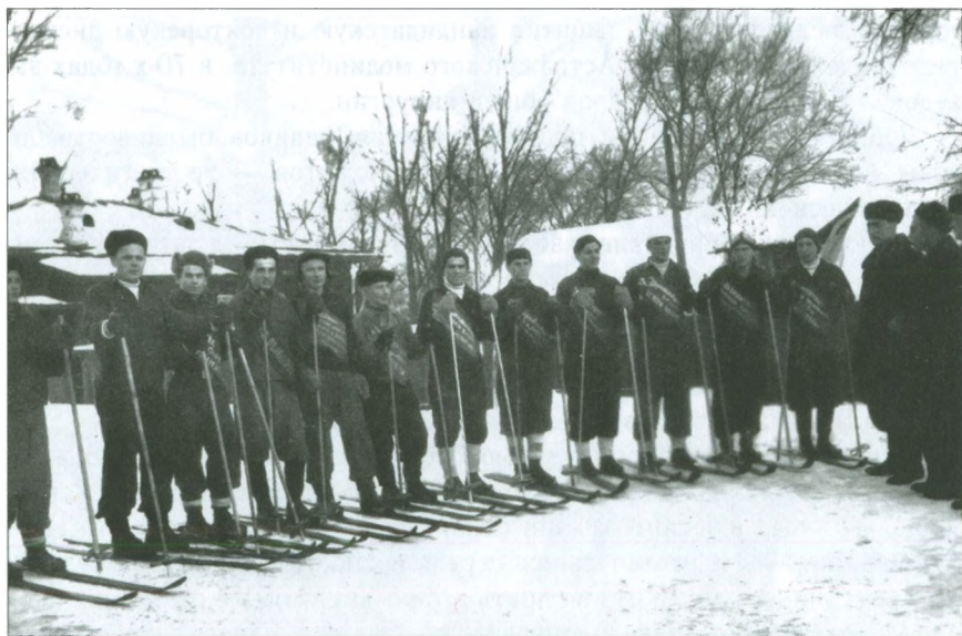
Добрянские лыжники-агитаторы. 1950-е годы.