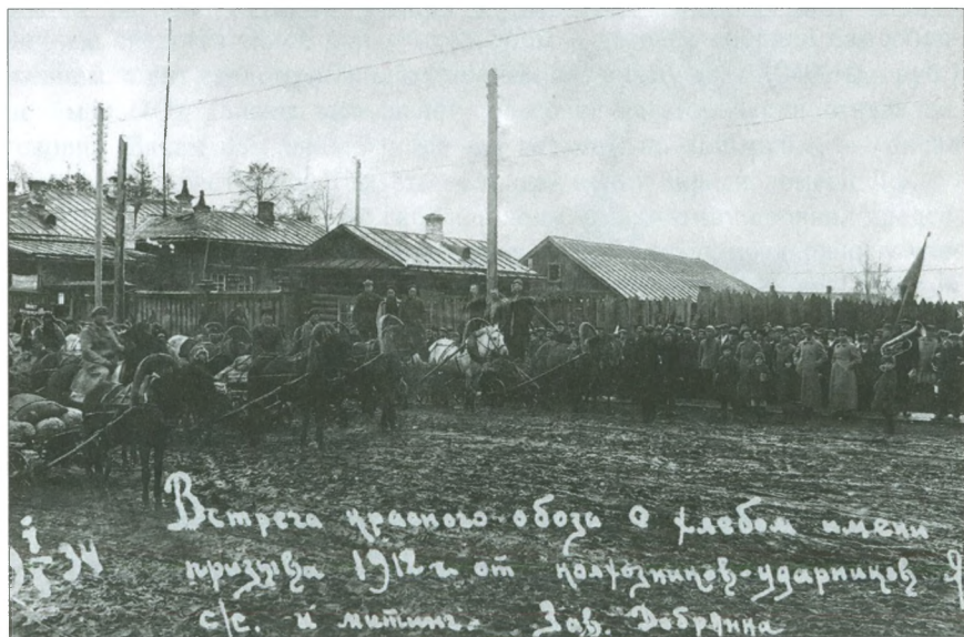
Встреча в Добрянке Красного обоза с хлебом. 1934 г.

В том же году за счет самообложения, сельхозналога и добровольного 10-процентного отчисления от заработка, сделанного слу-