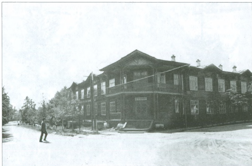
Старое здание Добрянской школы № 2. Построено в 50-х гг.