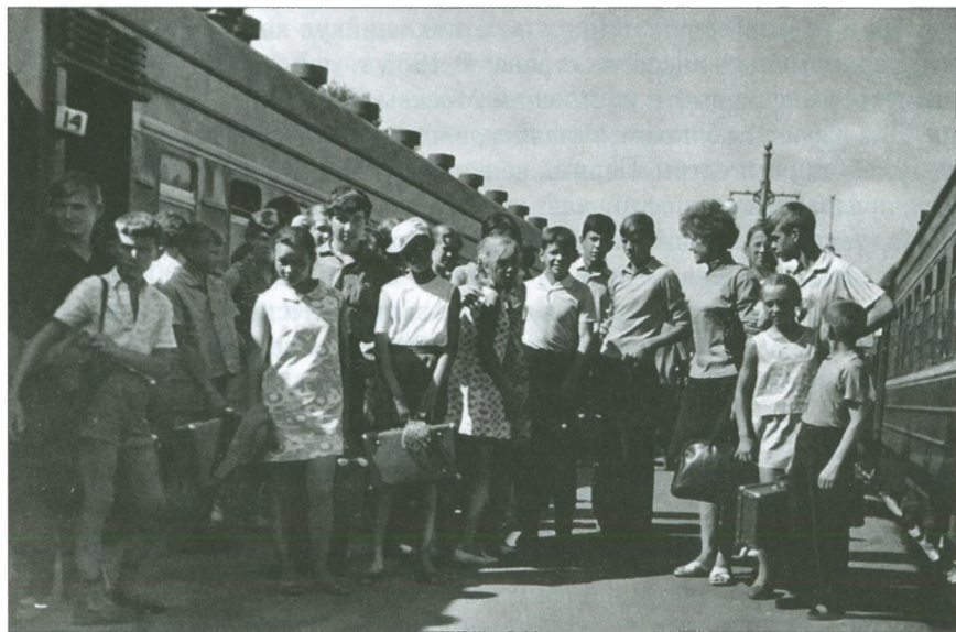
Добрянские школьники приехали на экскурсию в Одессу. 1970 г.

«Решено регулярно оказывать шефскую помощь совхозу «Память Ленина» в вывозке удобрений на поля, в ремонте сельскохозяйственной техники, в заготовке кормов и уборке урожая, — сообщалось в социалистических обязательствах нефтяников Полазны на 1966 год. — Промысловики обязались закончить строительство птицефермы на 5 тысяч кур в совхозе к 1 апреля, освоить средства на капитальное строительство механических мастерских на сумму 38 тысяч рублей».