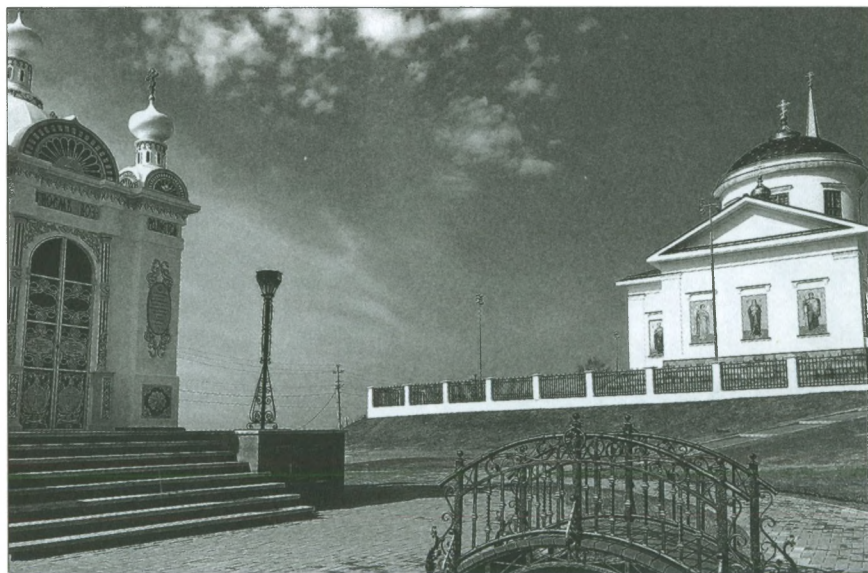
Добрянские энергостроители восстанавливают не только храм и часовню св. Александра Невского, но и территорию вокруг их. Фото 2019 г.

В 2014 году растущие барабан и колокольня были видны уже каждому добрянцу, но до этого на церкви были выполнены малозаметные со стороны, но сложные и важные работы по укреплению стен и монтажу нестандартных перекрытий. Купол и 36-метровая колокольня долж-