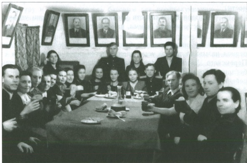
Праздничное застолье. 1954 г.