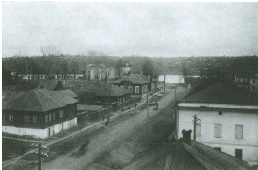
Добрянка. Ул. Советская. 40-е гг. XX в.

Кроме того, к декабрю 1942 г. добрянцы отправили в качестве подарков бойцам Северо-Западного фронта 721 посылку общим весом 14 тонн, а также новогодние подарки в виде 379 посылок, которые потянули на 7580 кг. Подобные посылки отправлялись бойцам и по случаю других праздников: 8 Марта, 1 Мая, 7 ноября.