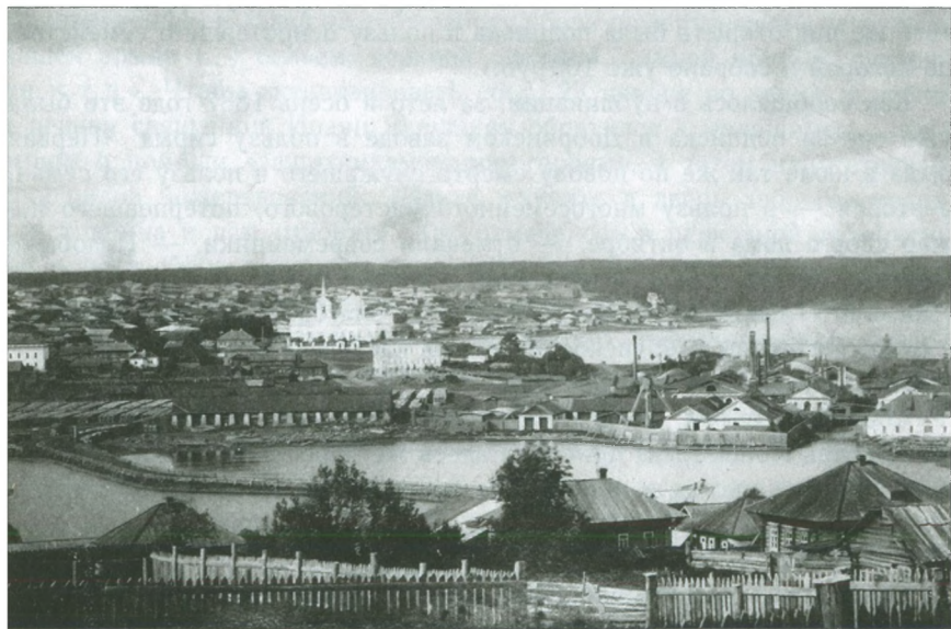
Вид на верхний завод и центр поселка из Задобрянки. Конец XIX — начало XX в.