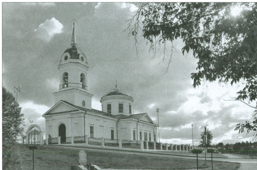
Церковь Рождества Пресвятой Богородицы. 2019 г.