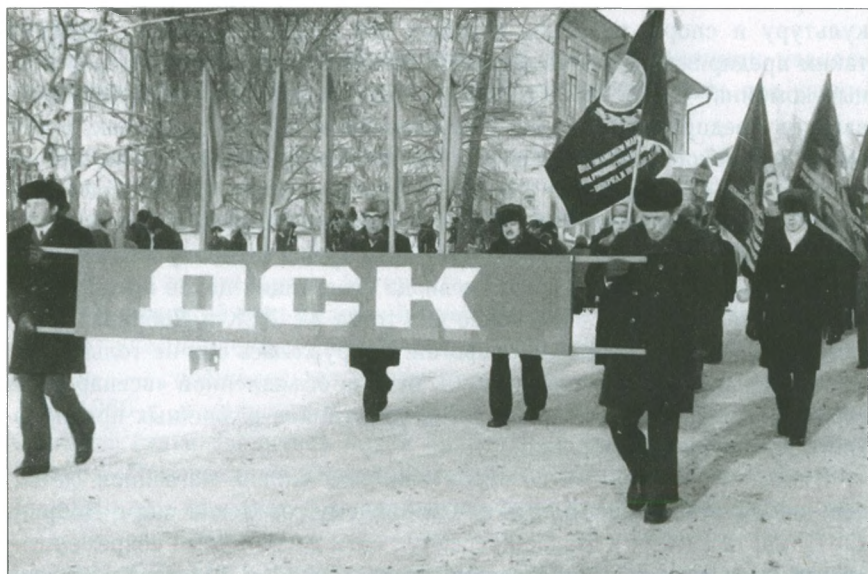
Работники ДСК на демонстрации 7 ноября 1978 г.

Не забывал профсоюз и о педагогах, в том числе общественниках.