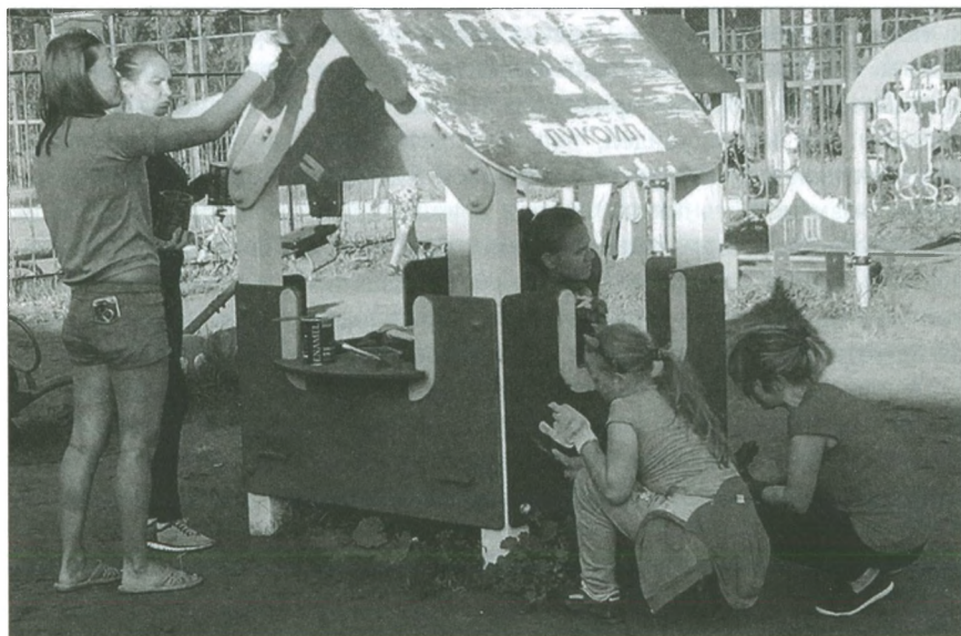
Волонтеры из Полазны сотворили десятки добрых дел. 2019 г.

Обогащало оно не только тех, кто нуждался в помощи, но и тех, кто ее оказывал. «Я в волонтерском объединении почти три с половиной года. В этом году я учусь в школе для старшеклассников. Учиться