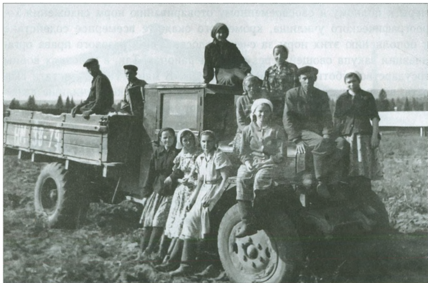
Работники Добрянского райпромкомбината на сенокосе в колхозе им. Кирова. 1956 г.

Само понятие «шефская помощь» в местной прессе впервые встречается в 1953 г., когда со ссылкой на постановление сентябрьского пле-