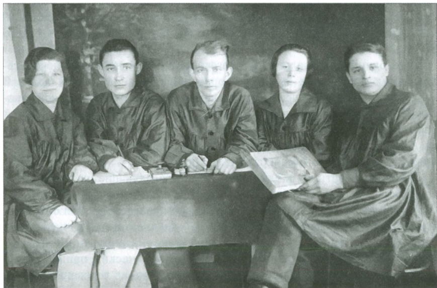
Добрянские комсомольцы, участники «Живой газеты». 20-е гг.

Так, в 1922 г. именно спектакли позволили сохранить школу в с. Сенькино, где «население еще не совсем проснулось» и не желало «обеспечить школу всем необходимым». «Обратили на это внимание работники просвещения и решили помочь школе своими силами.