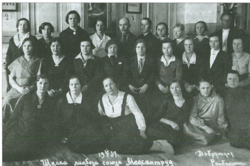
Участники школы ликбеза Союза медсантруд. 1937 г.

В том же году наши земляки были благодарны ясельным работни-