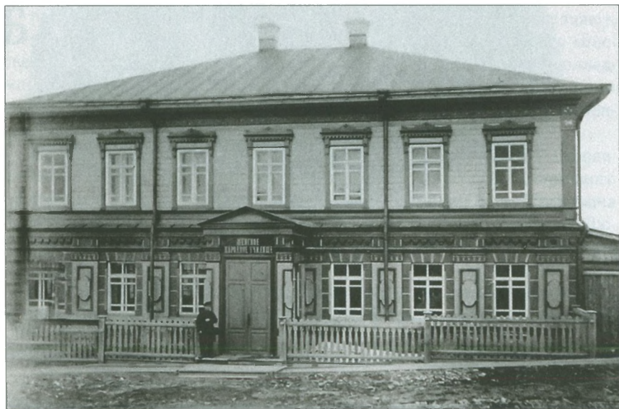
Добрянка. Женское народное училище. Фото не ранее 1894 г.

В самом конце 1894 года «на основании Высочайшего соизволения» министр народного просвещения Российской империи И. Д. Делянов разрешил установить в зале училища портреты попечительницы и ее покойного мужа. «Пусть же это Высочайшее соизволение послужит наградой за все труды и заботы, вложенные госпожой попечительницей