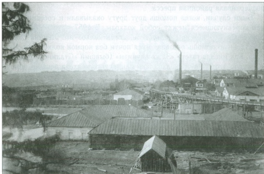
Добрянский завод в начале 50-х гг. XX в.

«Помощь промышленных предприятий колхозам — дело огромной