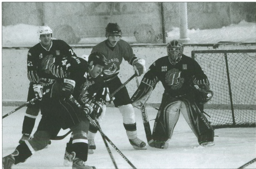
В 2012 году добрянские хоккеисты сыграли на своем льду товарищеский матч с хоккеистами из Канады.

Похожие акции проводились в Добрянке и без участия иностранцев. Например, в преддверии 65-летия Дня Победы в 2010 году благодаря инициативе администрации, активности общественников из ТОС и неравнодушию ряда предпринимателей были отремонтированы квартиры десяти ветеранам. «Мы ищем ветеранов, нуждающихся в ремонте жи-