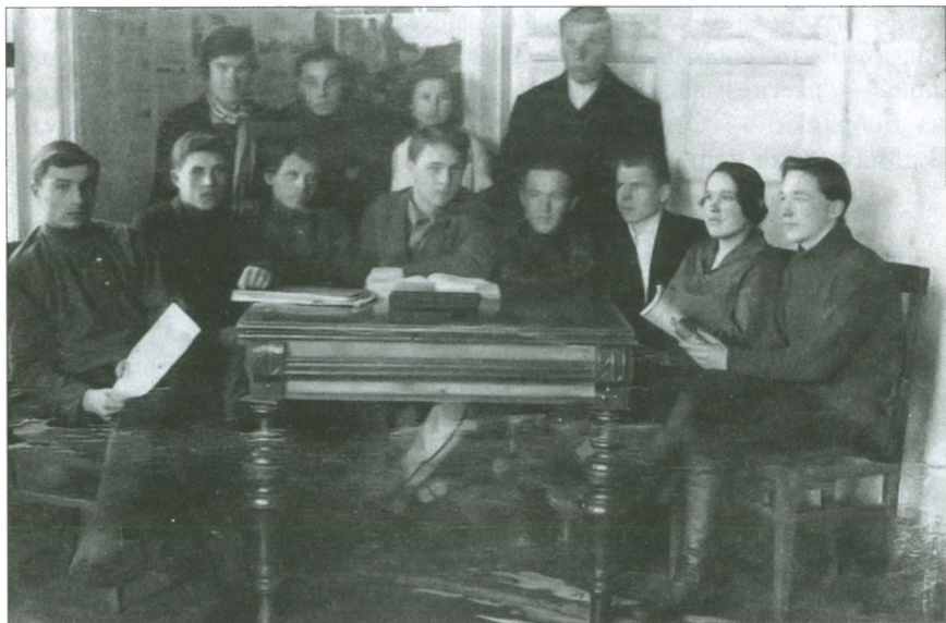
Добрянка. Комсомольский актив. Конец 1920-х гг.

В августе 1929 года рабочие парозлектрического цеха Добрянского завода подписали договор о социалистическом соревновании с крестьянами Дивинского сельсовета. В нем рабочие пообещали не только «изжить прогулы, пьянство и разгильдяйство на производстве» и повы-