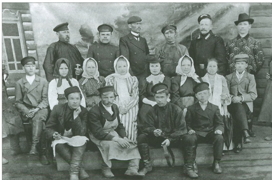
Самодеятельные актеры из Полазны. Нач. XX в.

Спектакль, пусть даже любительский, требовал определенных денежных сумм на изготовление декораций, костюмов, другого реквизита,