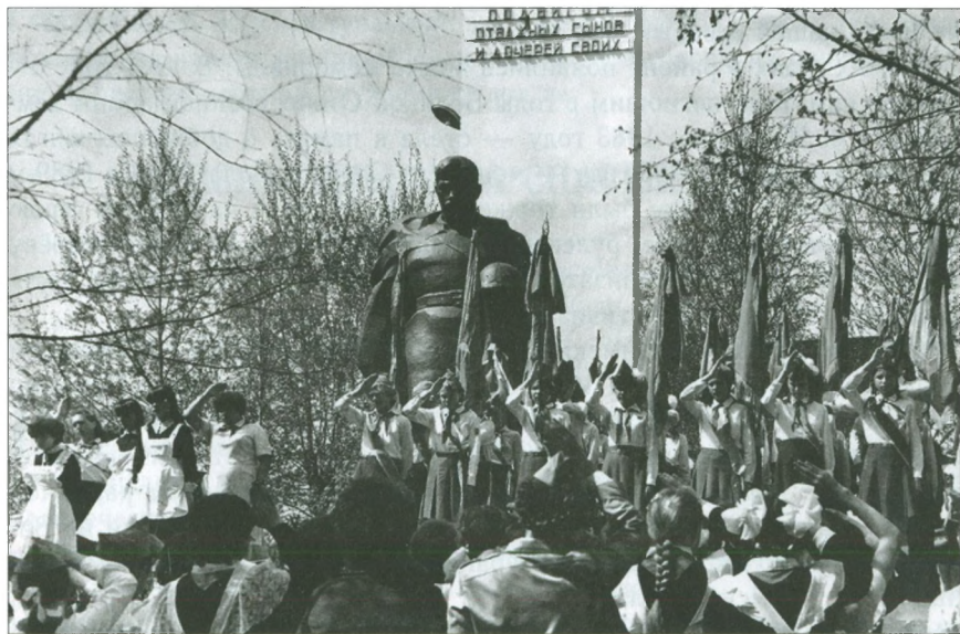
Участники пионерского слета у памятника воинам-добрянкам. 1984 г.