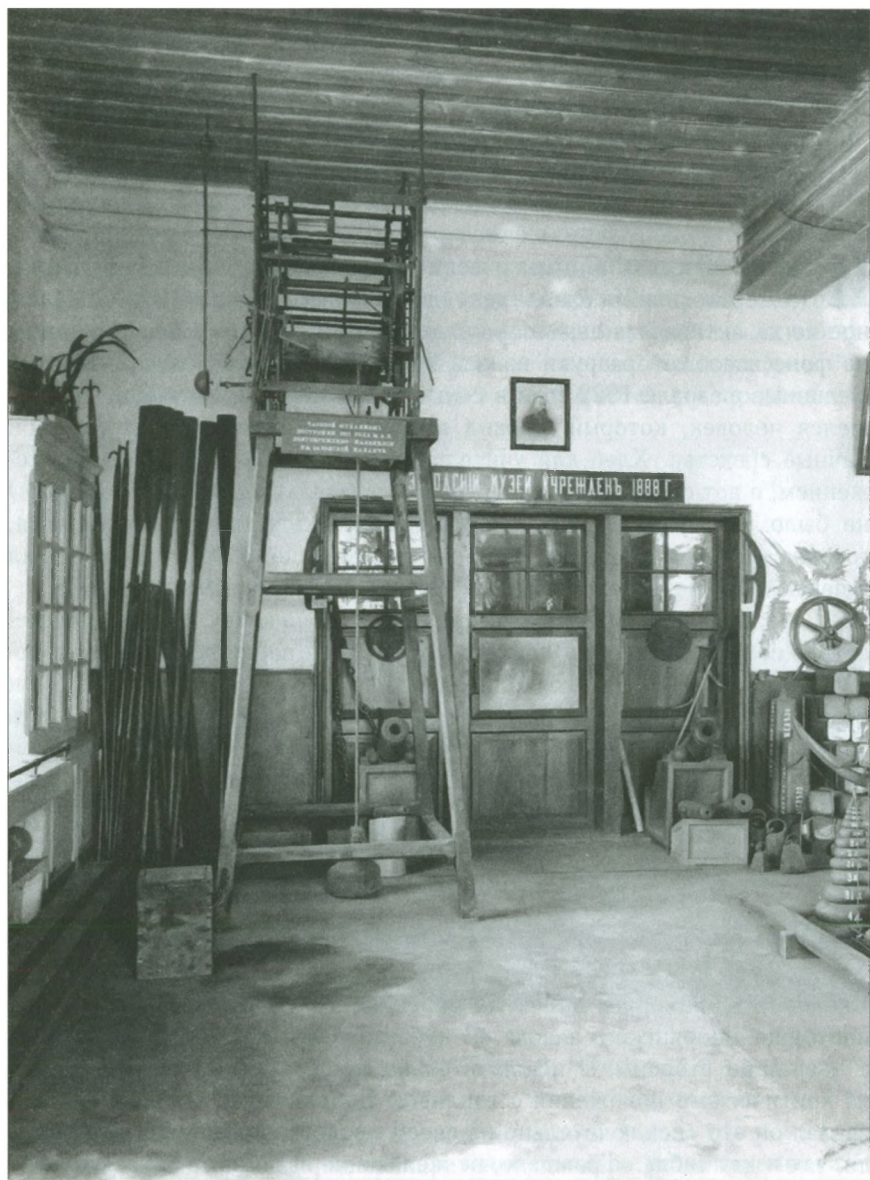
Одна из экспозиций Добрянского музея. Открыт в 1888 г.