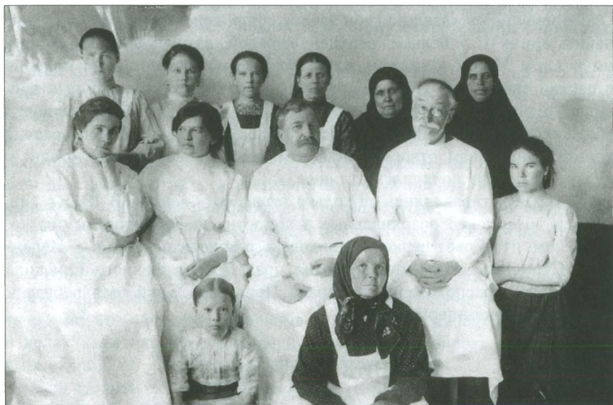
Служащие Добрянской земской больницы. Начало XX в.