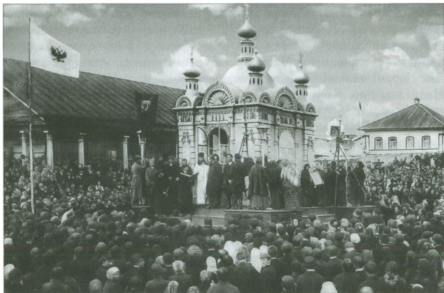
Открытие часовни в Добрянке. 1892 г.