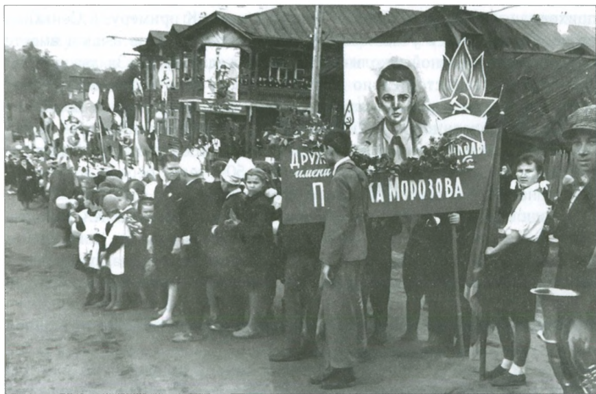
Учащиеся Добрянской школы № 2 на праздновании Дня пионерии. 1964 г.