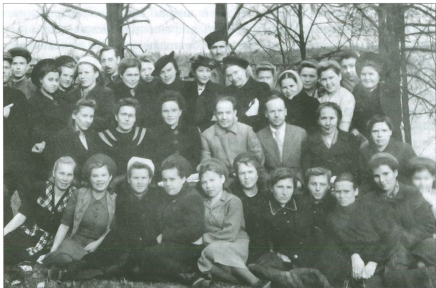
Участники районного совещания медработников. 1947 г.