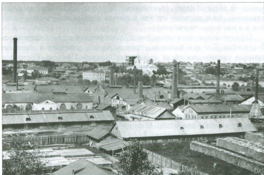
Верхний завод и Рождество- Богородицкая церковь со строящейся колокольней. 1909 г.

Она была открыта при Рождество-Богородицкой церкви еще в 1889 году, но долгое время ютилась в «нижнем этаже» одного из церковных домов. «Что это было за помещение — без грусти нельзя и вспоминать. Наполовину врытое в землю, темное, сырое, тесное и холодное, оно скорее пригодно было выполнять назначение подвала, чем служить такому важному делу, как народное образование», — сообщалось в одной из публикаций «Пермских губернских ведомостей». Не соответствовали своему назначению и другие по-