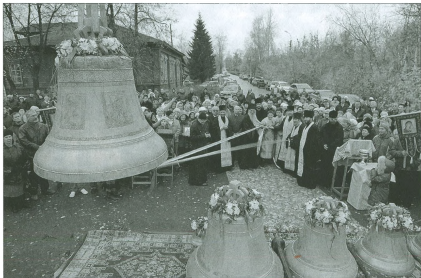
Освящение колоколов для восстанавливаемой Рождество- Богородицкой церкви. 2014 г.