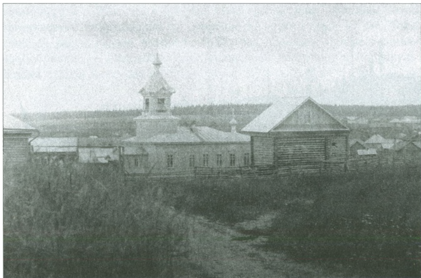
Село Висим. 1915 г.

Есть также данные, что за год до этого висимцы в добровольном