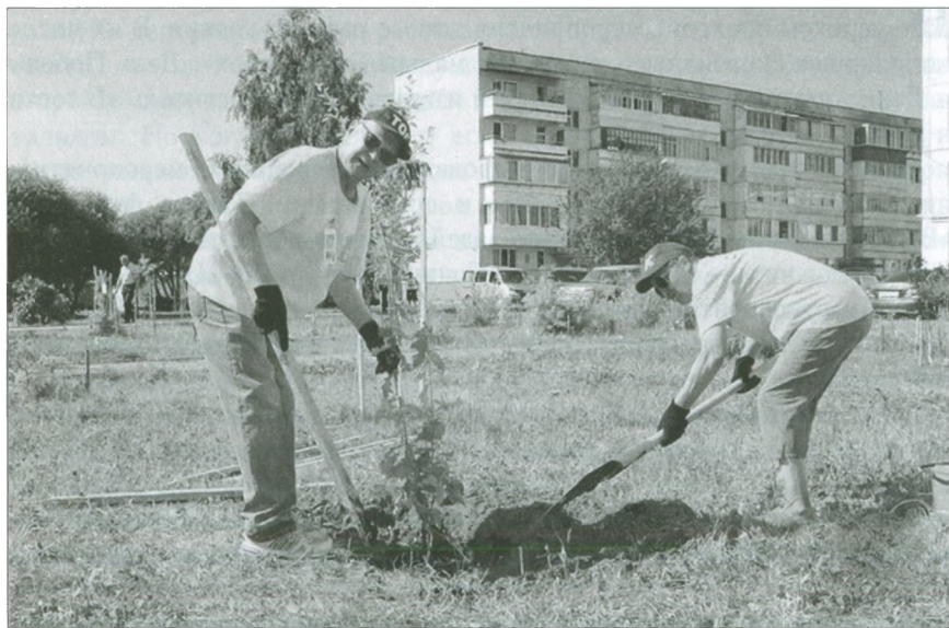
Одна из забот активистов ТОС — благоустройство. Фото 2018 г.

Огромную роль на ниве благотворительности играют органы территориального общественного самоуправления (ТОС), которые объединяют