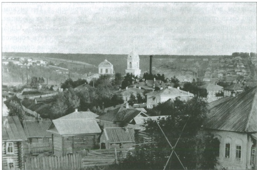
Центральная часть Добрянки и Рождество-Богородицкая церковь. Фото начала XX в.

В 1900 году существующее в Добрянском заводе церковно-приходское попечительство состояло из 104 членов. Имея «небогатые средства», оно тем не менее занималось выдачей «бедным посильных пожертвований к праздникам Пасхи и Рождества Христова». Всего за год пособия получили 32 человека на сумму 65 р. 50 коп., а еще «трое полу-