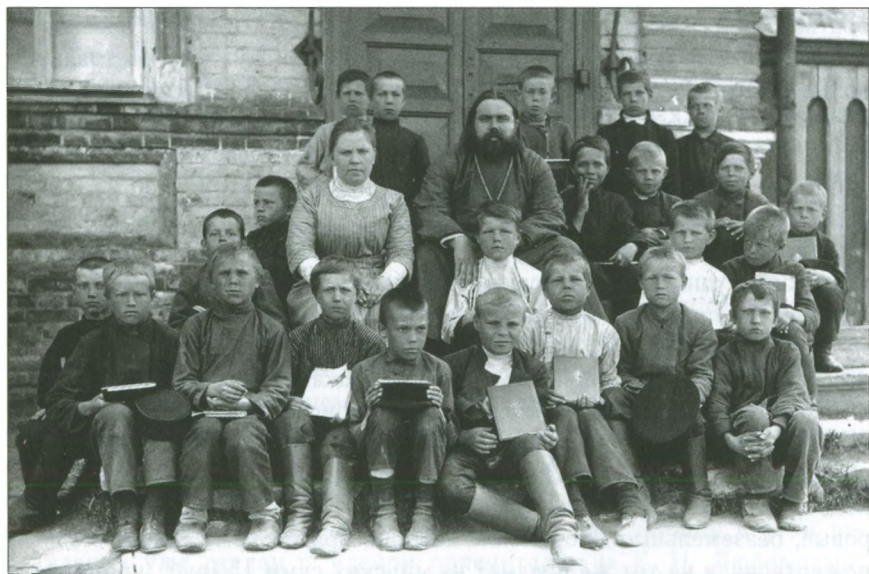
Добрянские школьники на рубеже XIX–XX вв.

нодушными к страданиям своих единоверцев и что по мере своих средств пожертвования «на разоренных и замученных Славян» делают и богатые, и бедные. «Страдания Балканских Славян приводят жителей Добрянского завода в возбужденное состояние. Богатый и бедный жертвуют по мере средств (...) и сумма таких пожертвований простирается уже до 800 рублей. Разшевеленные рассказами о бедствиях даже нищие-убогие отдают собранные копейки на помощь бедствующим: «Мы сыты, а там голодны». Одна 70-летняя старушка пожертвовала 10 рублей, которые она сберегла (...) на поминок по старости. С охотой жертвуют и староверы (кержаки) даже до 5 рублей. Не отстали в сочувствии к Славянам и дети наши, обучающиеся в 2-классном народном мужском училище, пожертвовав 6 руб. 12½ коп.».