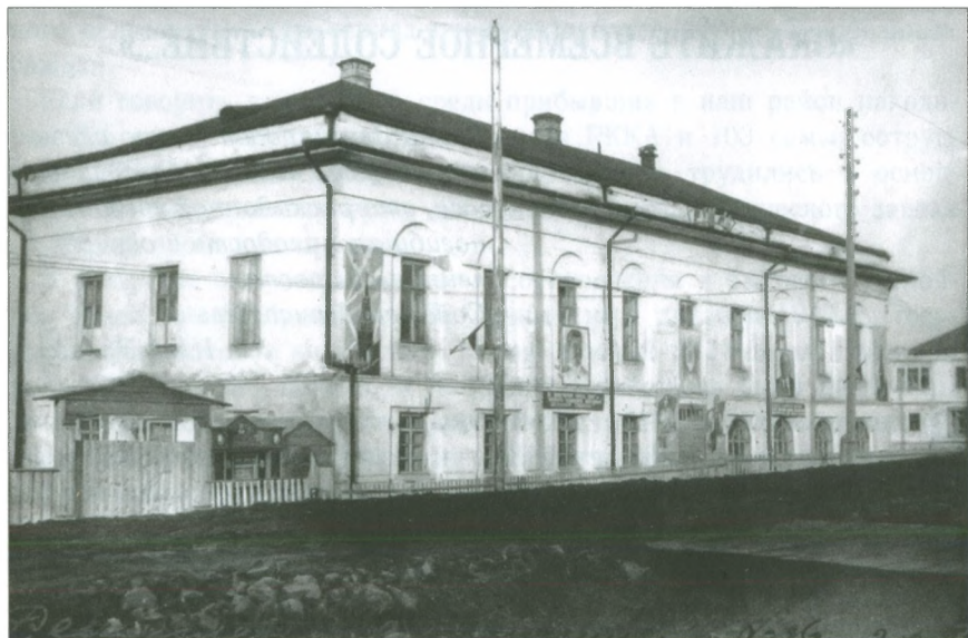
Добрянское ремесленное училище № 16.

В 1941 г. в эвакуацию в Полазну прибыло знаменитое Ленинград-