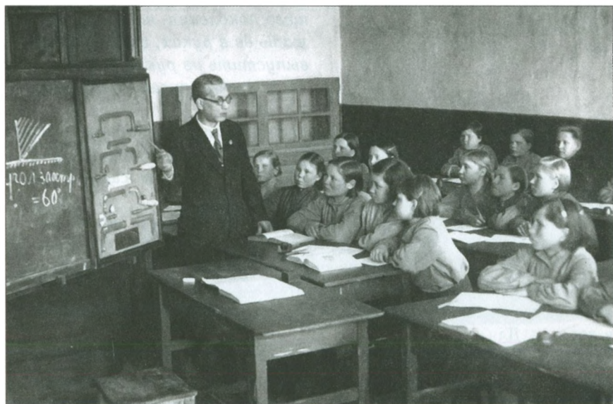
Занятия в ремесленном училище (ПУ) № 16. Вторая половина 40-х гг.

Впрочем, школьники трудились тогда не только на полях и фермах, но и в лесничествах. Обычной практикой был сбор еловых и сосновых шишек, из которых добывались затем семена «для восстановления наших лесов». «Школьники в течение февраля и марта собрали и сдали на склад лесничества 1107 килограммов шишек, — писал в 1952 г. районной газете в корреспонденции из Полазны лесничий Смирнов. — За проявленную отзывчивость и активность в сборе шишек учащимся Полазненской школы лесничеством объявлена благодарность».