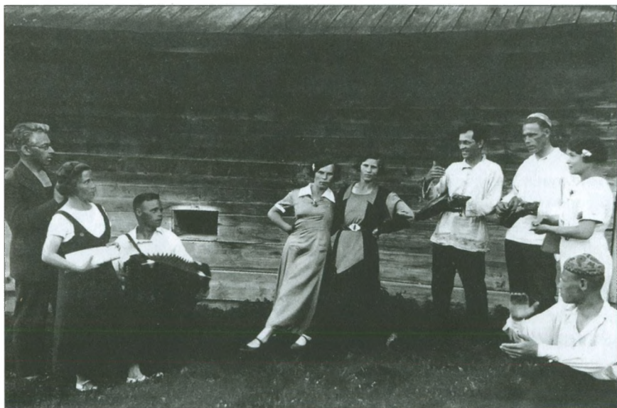
Вступление участников добрянской агитбригады. 30-е гг.

Лучшие человеческие качества наших земляков особенно проявились в годы военного лихолетья.