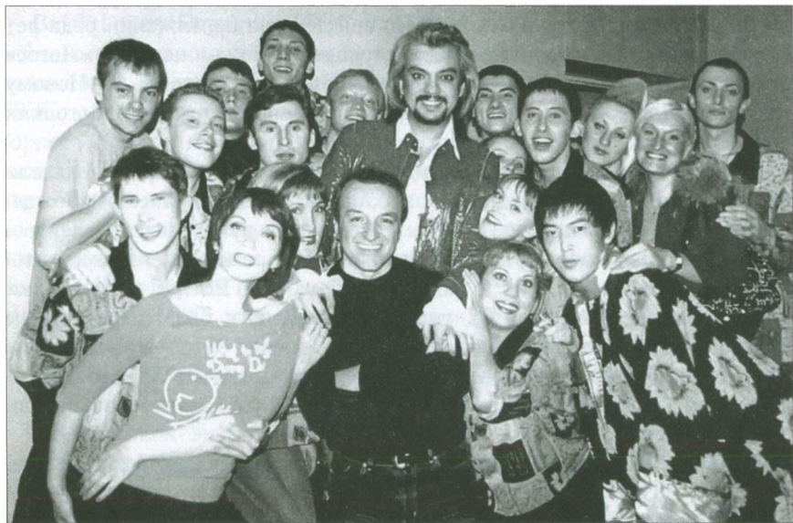
Добрянская команда КВН «Есть контакт!» после выступления на Первом канале с Филиппом Киркоровым. 2004 г.

Весомый вклад вносили автотранспортники в развитие культуры. Ими, в частности, был учрежден денежный грант для Добрянского краеведческого музея. Но самое яркое проявление подобной деятельности заключалось в поддержке кавээндовского движения. В том числе масового, школьного. Как рассказывала в 2007 году капитан добрянских кавээнщиков Г. В. Данилюк, представители АТК-2 бывали практически