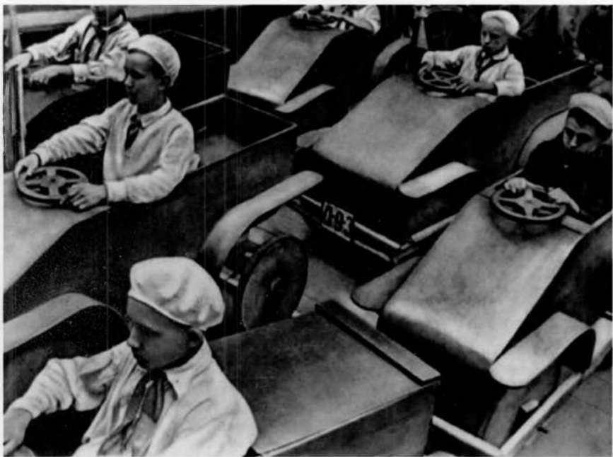
Школьники-автомобилисты. 1930-е гг. Фотоальбом «Советская детвора» (М., 1936).