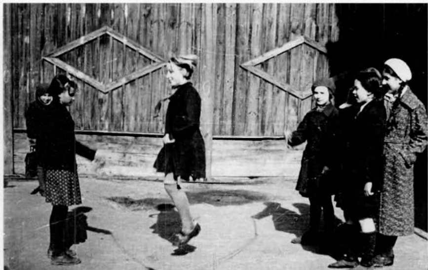
В школьном дворе, 1930-е гг. Московский музей образования.