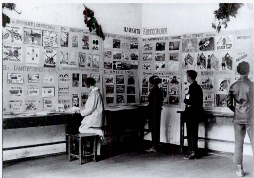
Выставка плакатов в летней школе, конец 1920-х гг. Московский музей образования.