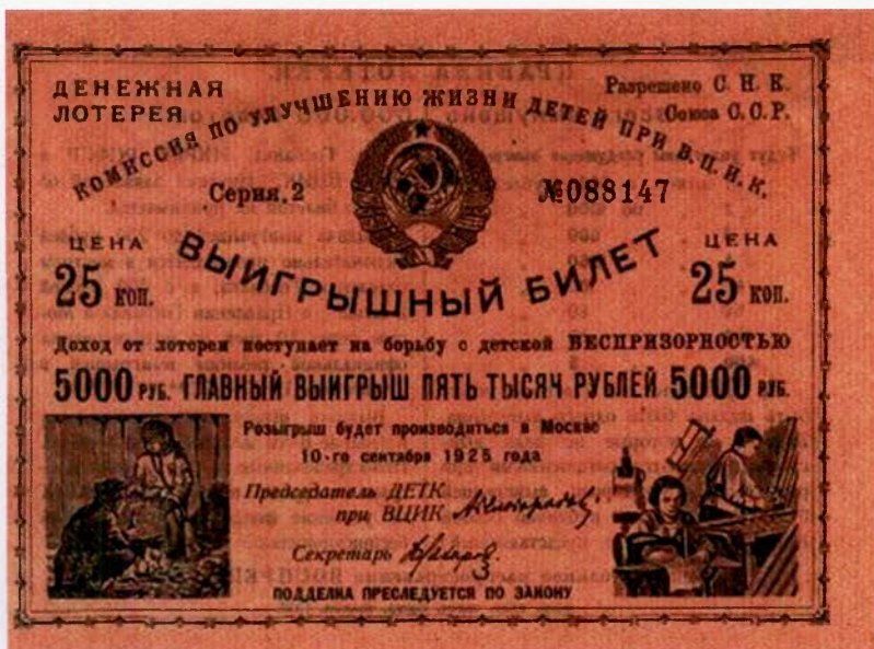
Лотерейный билет Деткомиссии ВЦИК, 1925 г.