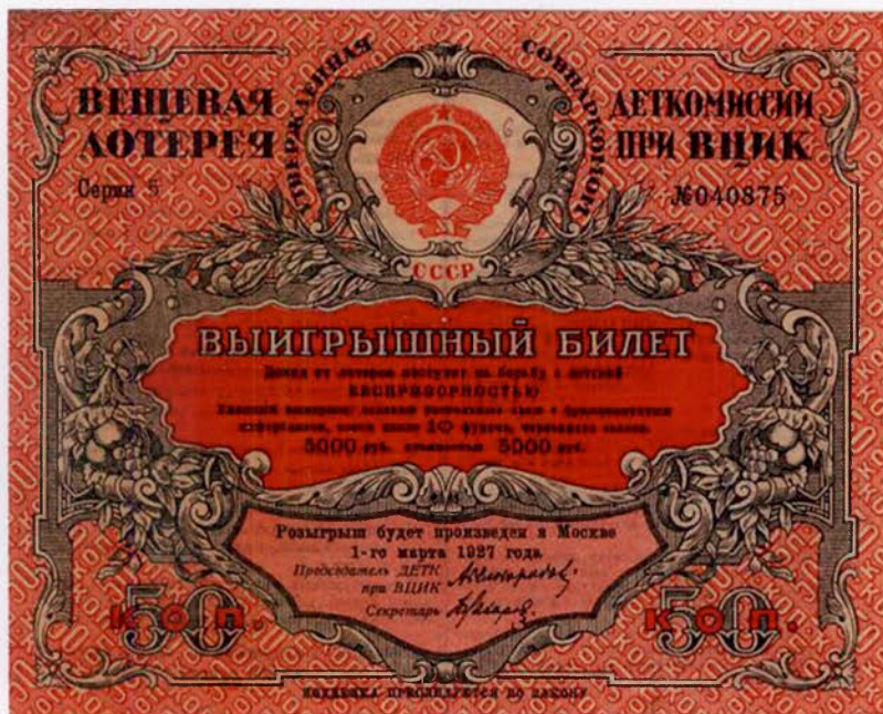
Лотерейный билет Деткомиссии ВЦИК, 1927 г.