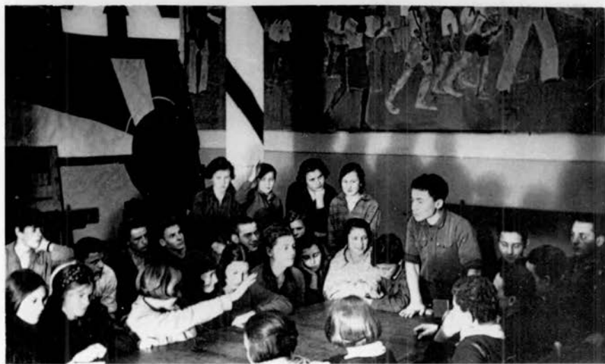
Школьный совет МОПШК. 1926. Московский музей образования.