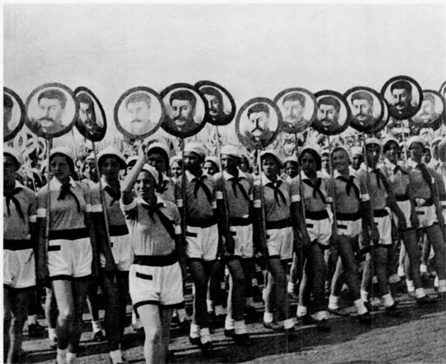
Праздничный пионерский марш. 1930-е гг. Фотоальбом «Советская детвора». (М., 1936).