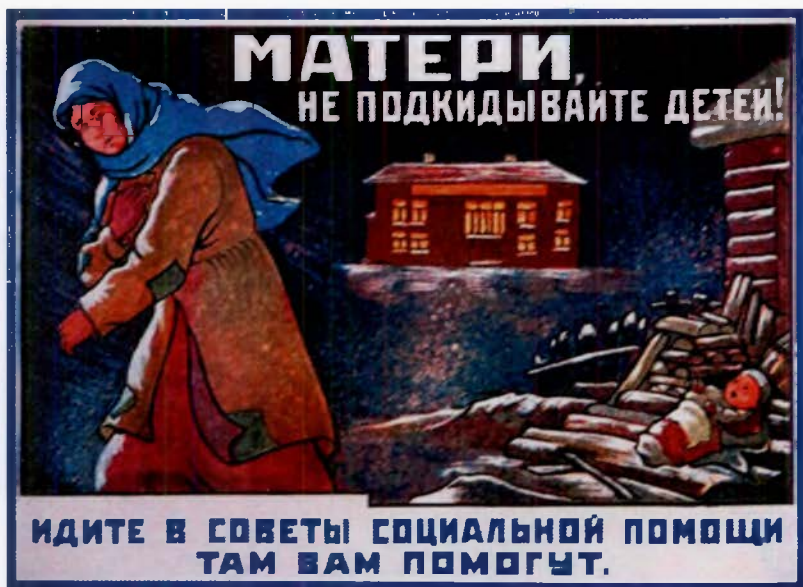
Неизвестный художник (предположительно А. Соболева), 1925 г.