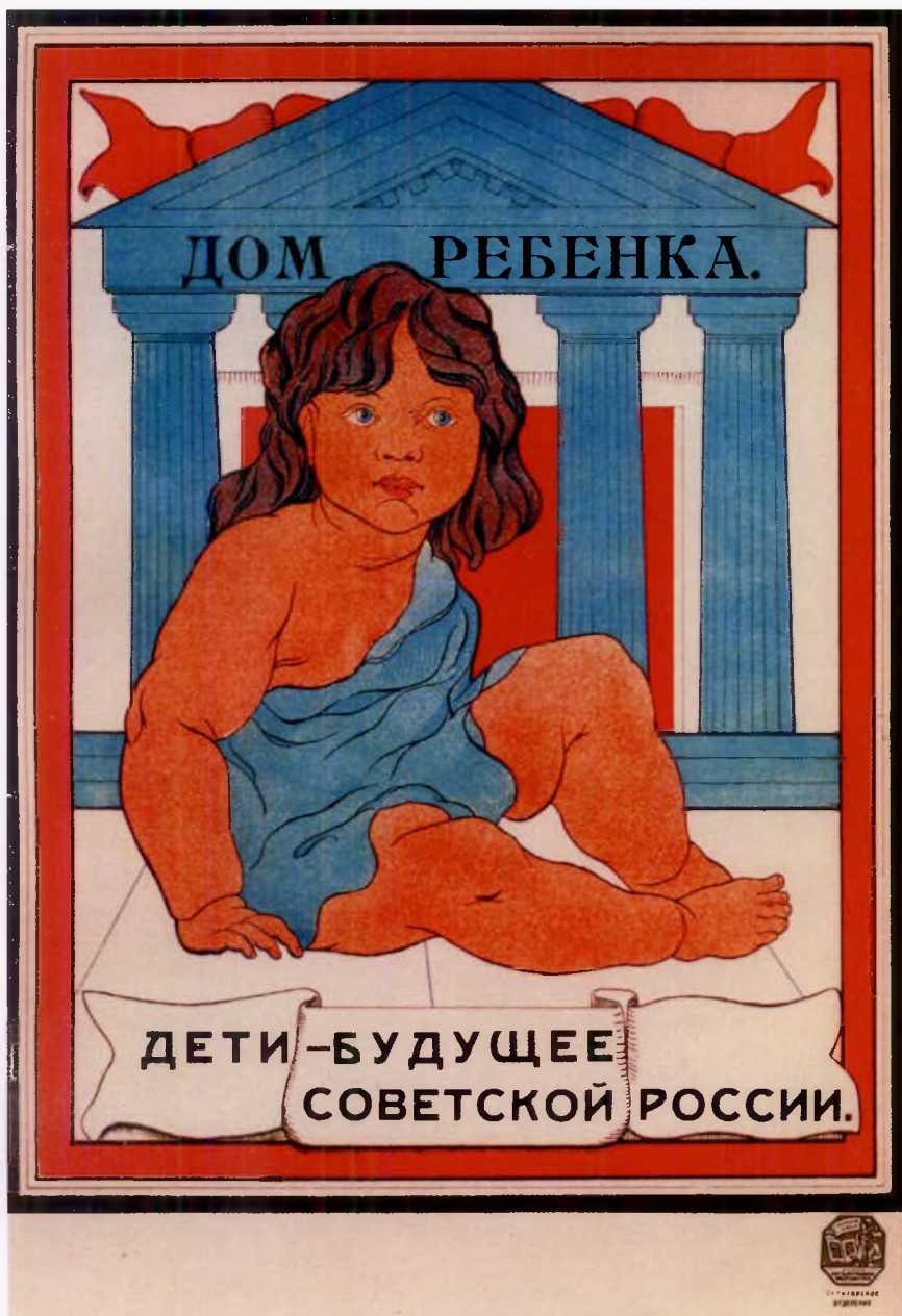
Неизвестный художник, 1920 г.