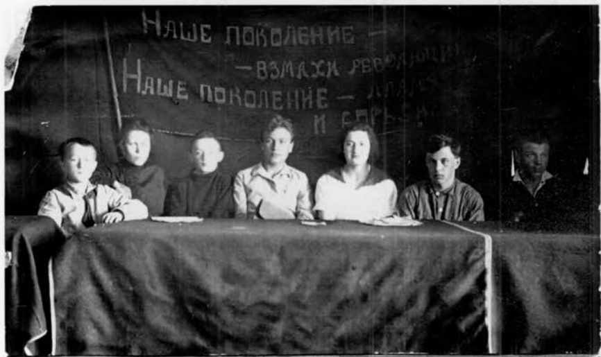
Конференция учащихся МОПШК, 1922—1923. Московский музей образования.