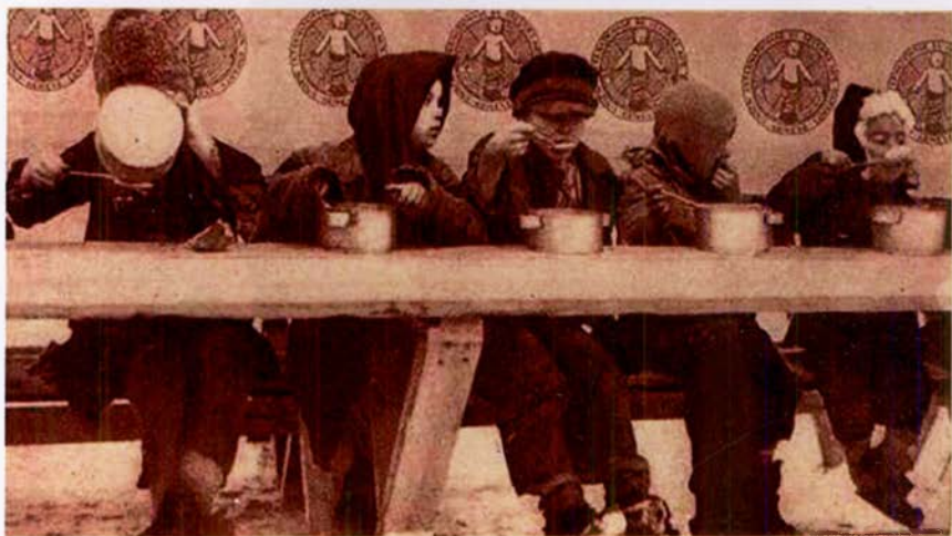
La famine en Russie. VII.

11 francs par mois suffisent à nourrir un enfant pendant un mois. 55 fr. lui sauvent la vie!