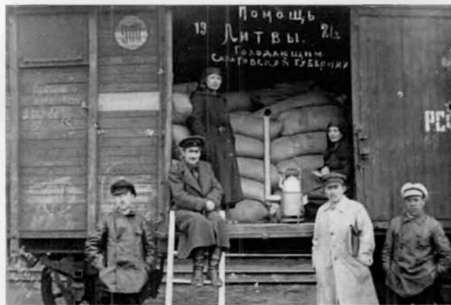
Помощь Литвы голодающим Саратовской губернии, 1921 г.