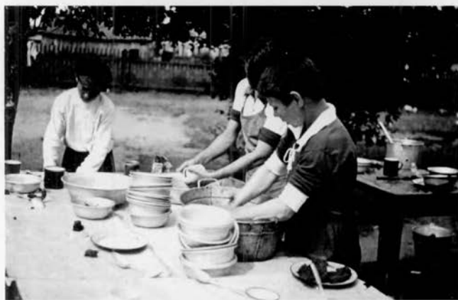
Уборка в столовой летней школы. 1920-е. Московский музей образования.