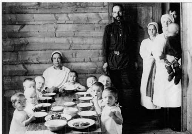
Детский сад совхоза им. Сталина. Московский музей образования.