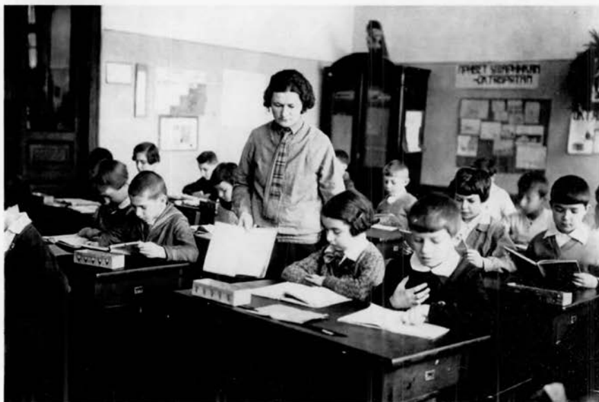
Урок 2 класса МОПШК. 1934-1935 учебный год. Московский музей образования.