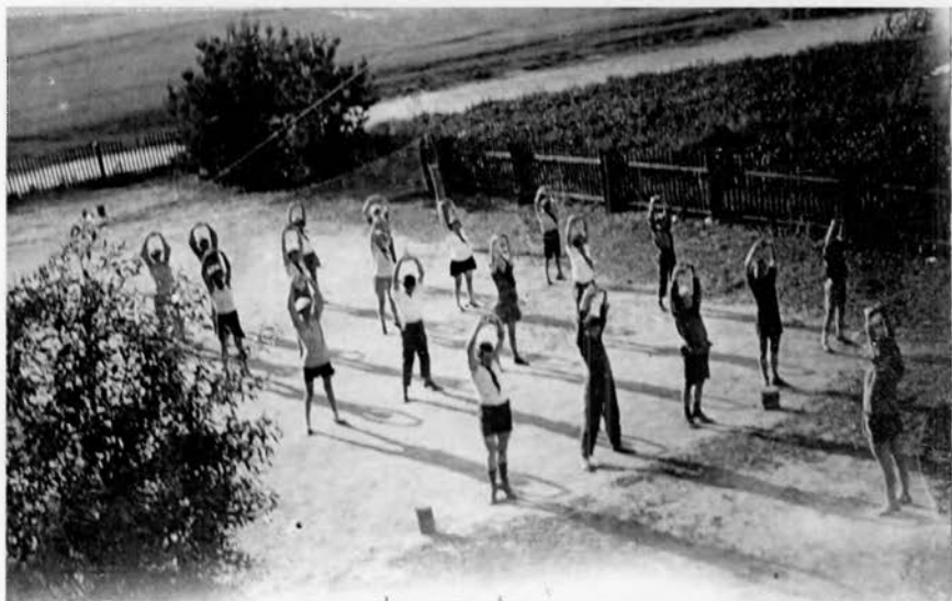
Физкультура в летнем лагере, 1928.