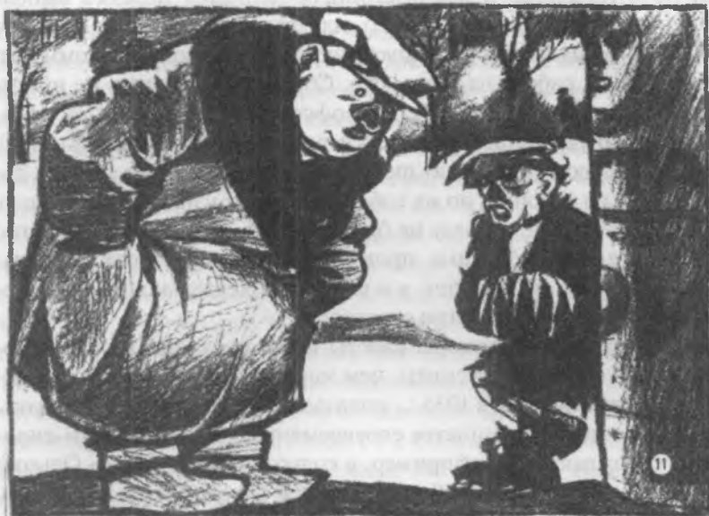
ЧЕЛОВЕК В ШУБЕ:—Смотрю я на этих полуголых беспризорных—и у меня прямо мороз по коже