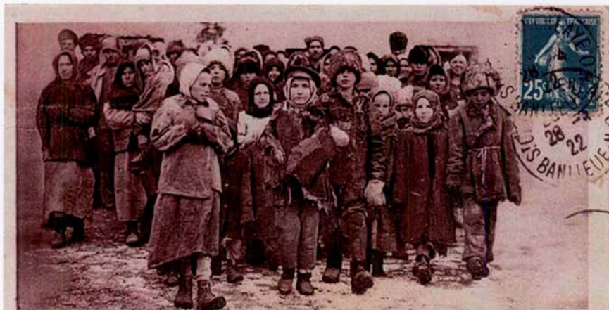
La famine en Russie. V.