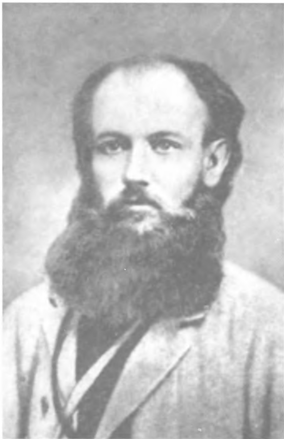
П. А. Кропоткин. Фото 1873 г.