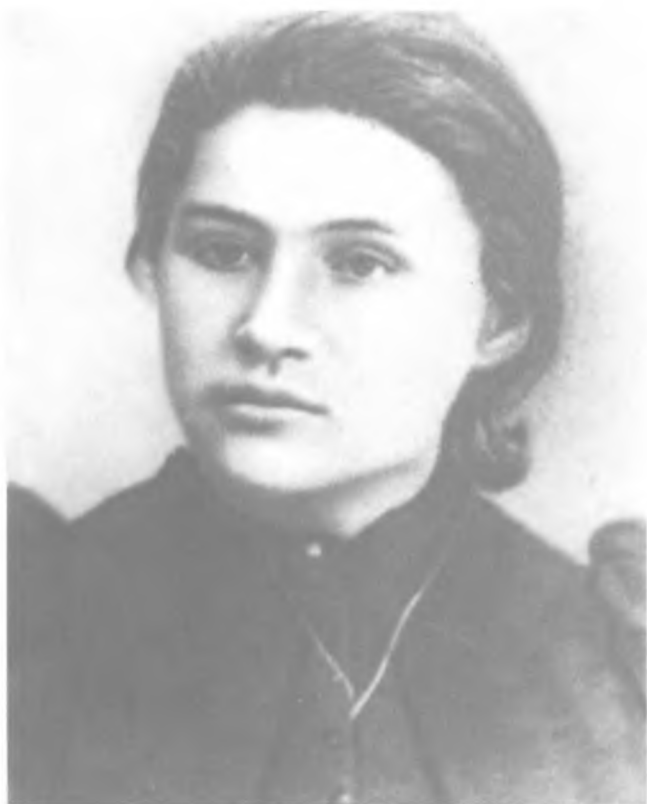
В. И. Засулич. Фото 1877 г.