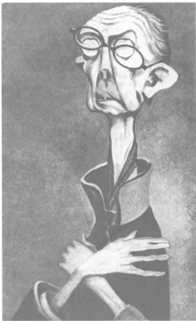
Карикатура на К. П. Победоносцева