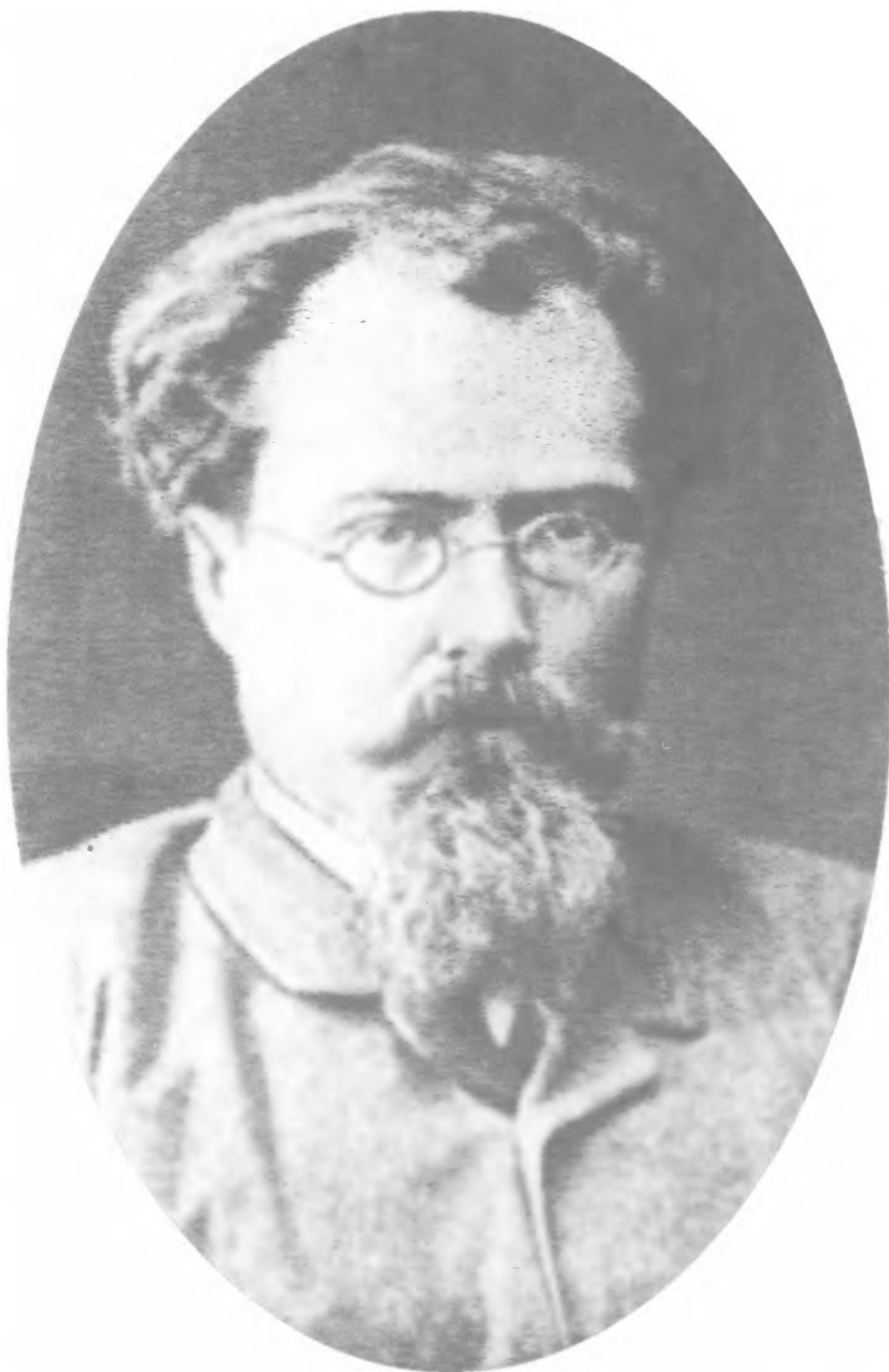
Г. А. Лопатин. Фото. 1884 г.