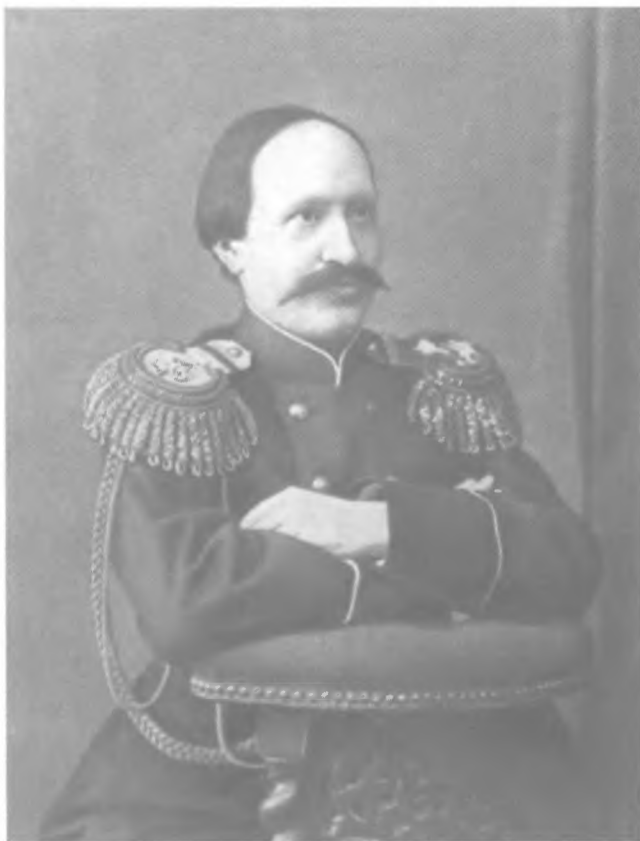
Н. П. Игнатъев. Фото