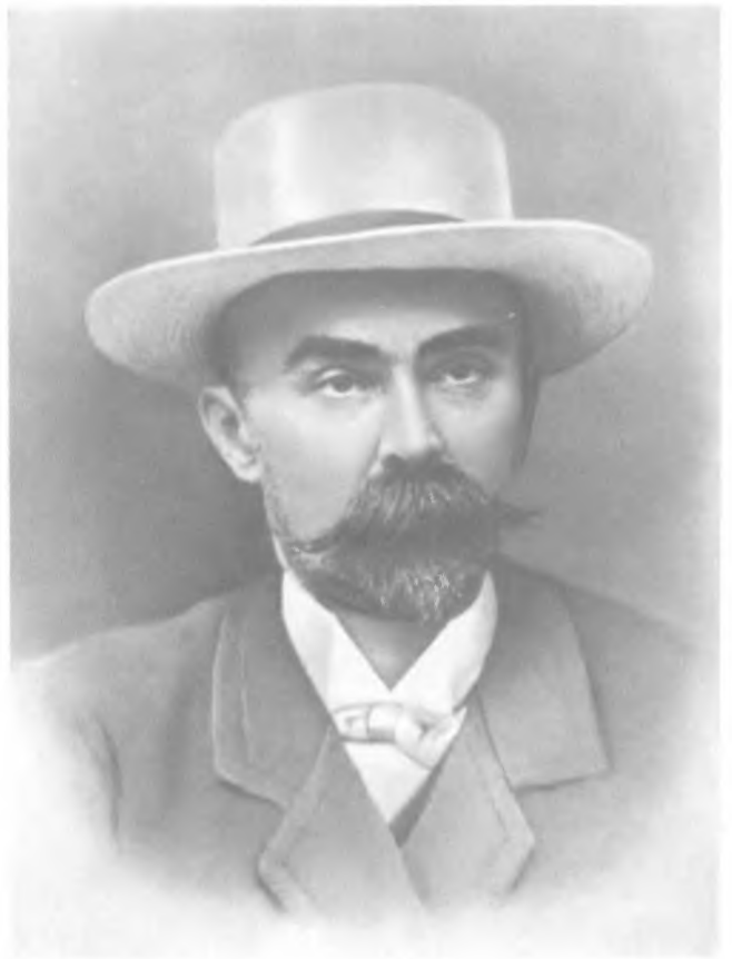
Г. В. Плеханов