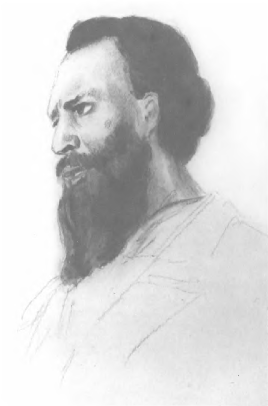
А. И. Желябов на суде по делу 1 марта 1881 г. Рис. с натуры К. Е. Маковского. 1881 г.