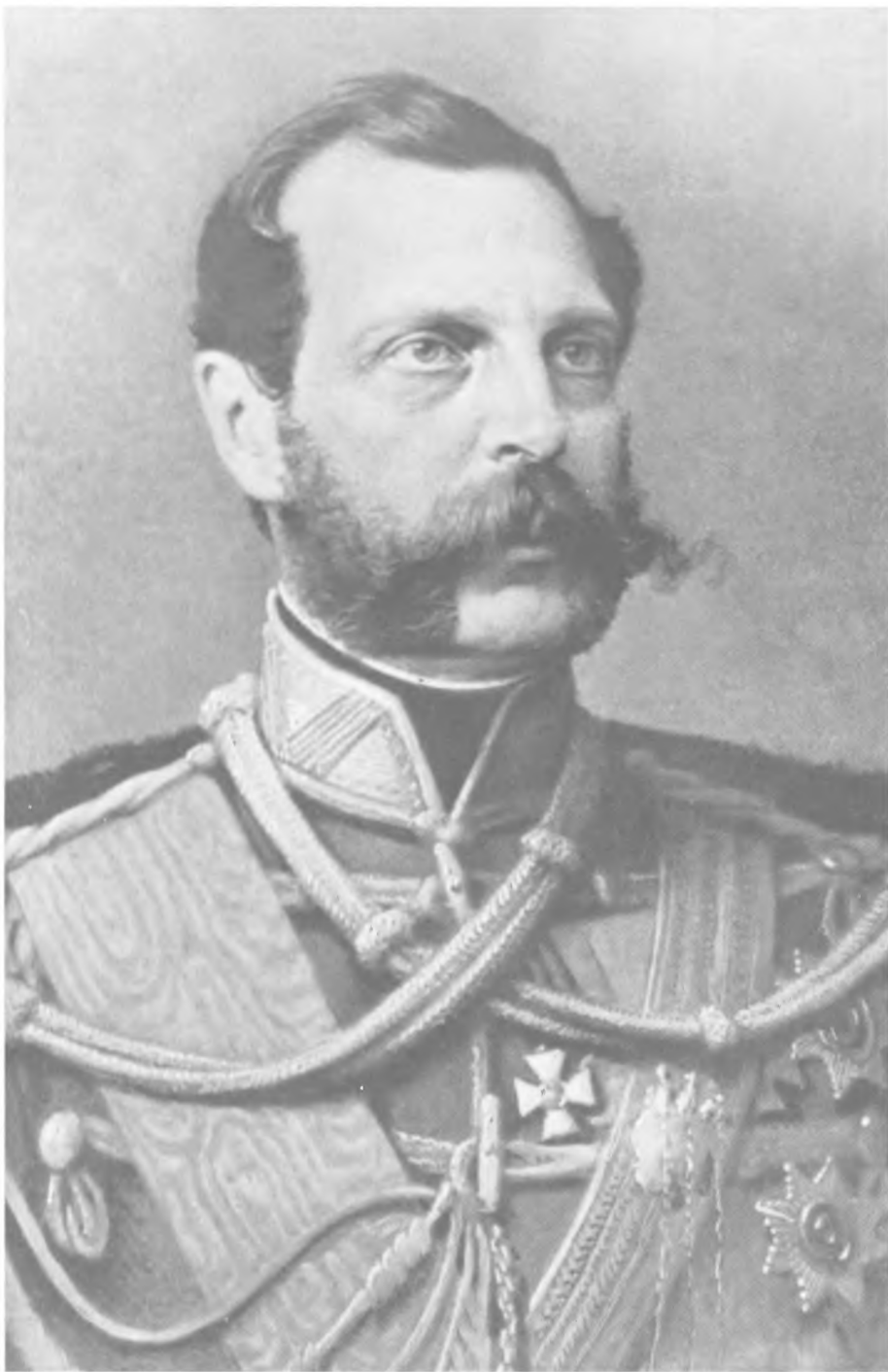
Александр II. Портрет работы И. Н. Крамского. 1870 г.