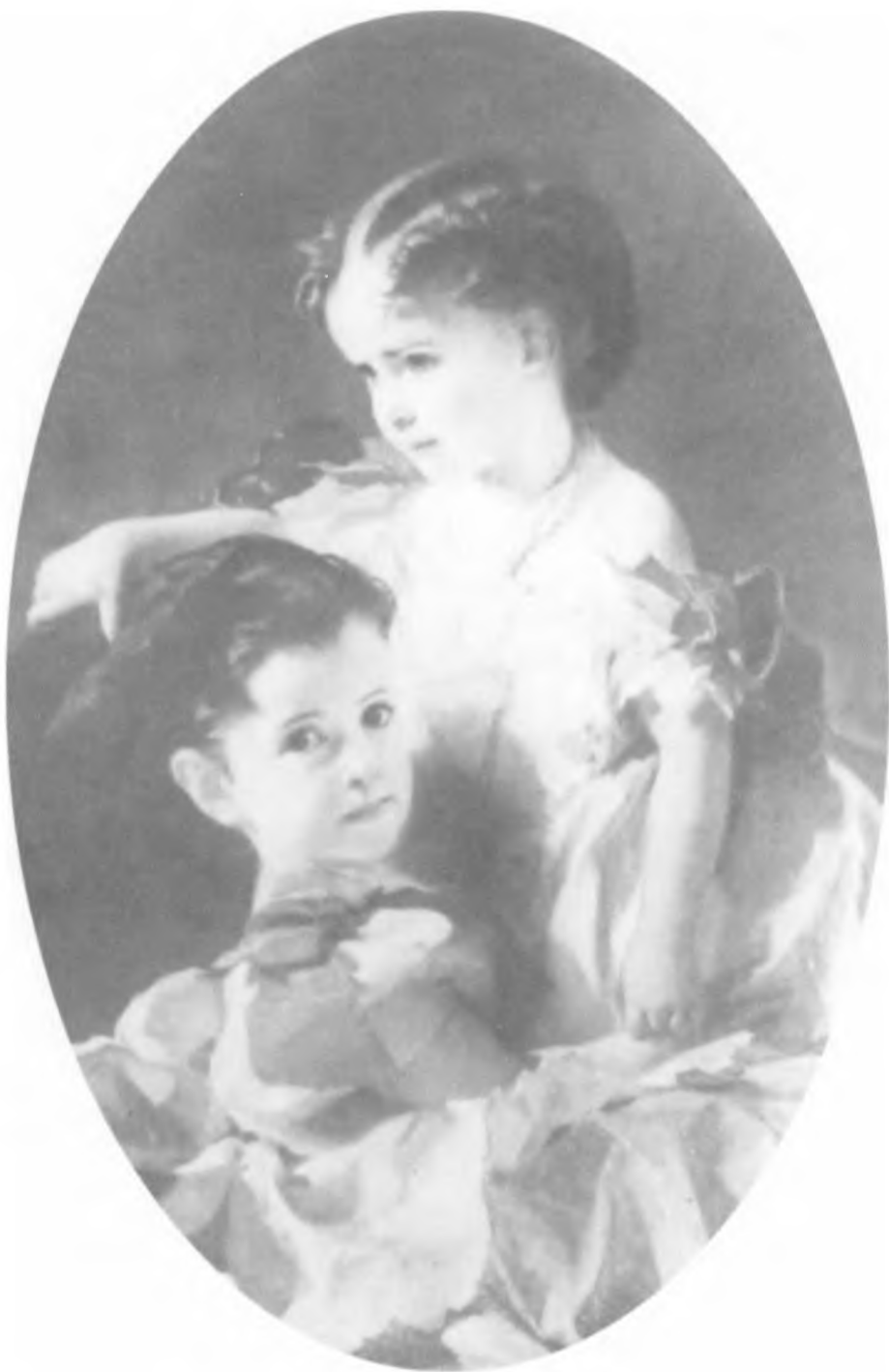
Софья Перовская (вверху) и ее сестра Маша. Портрет работы И. К. Макарова. 1859 г.