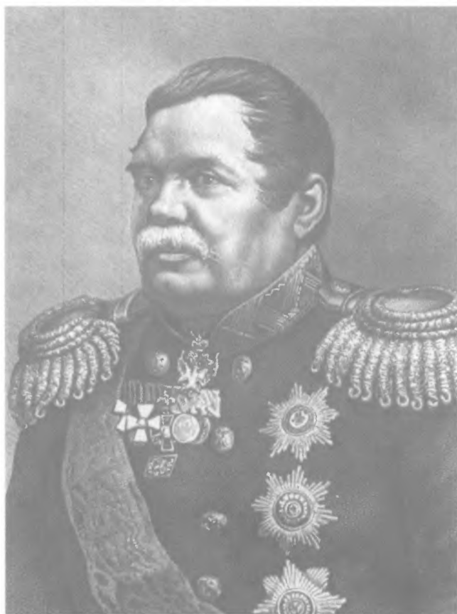
М. Н. Муравьев ("Вешатель"). Фото 1866 г.