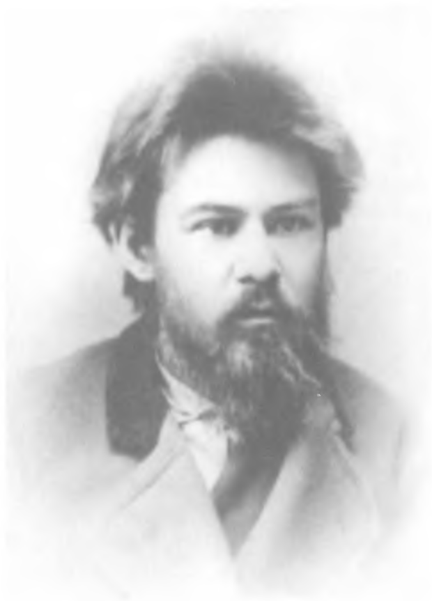
Л. А. Тихомиров