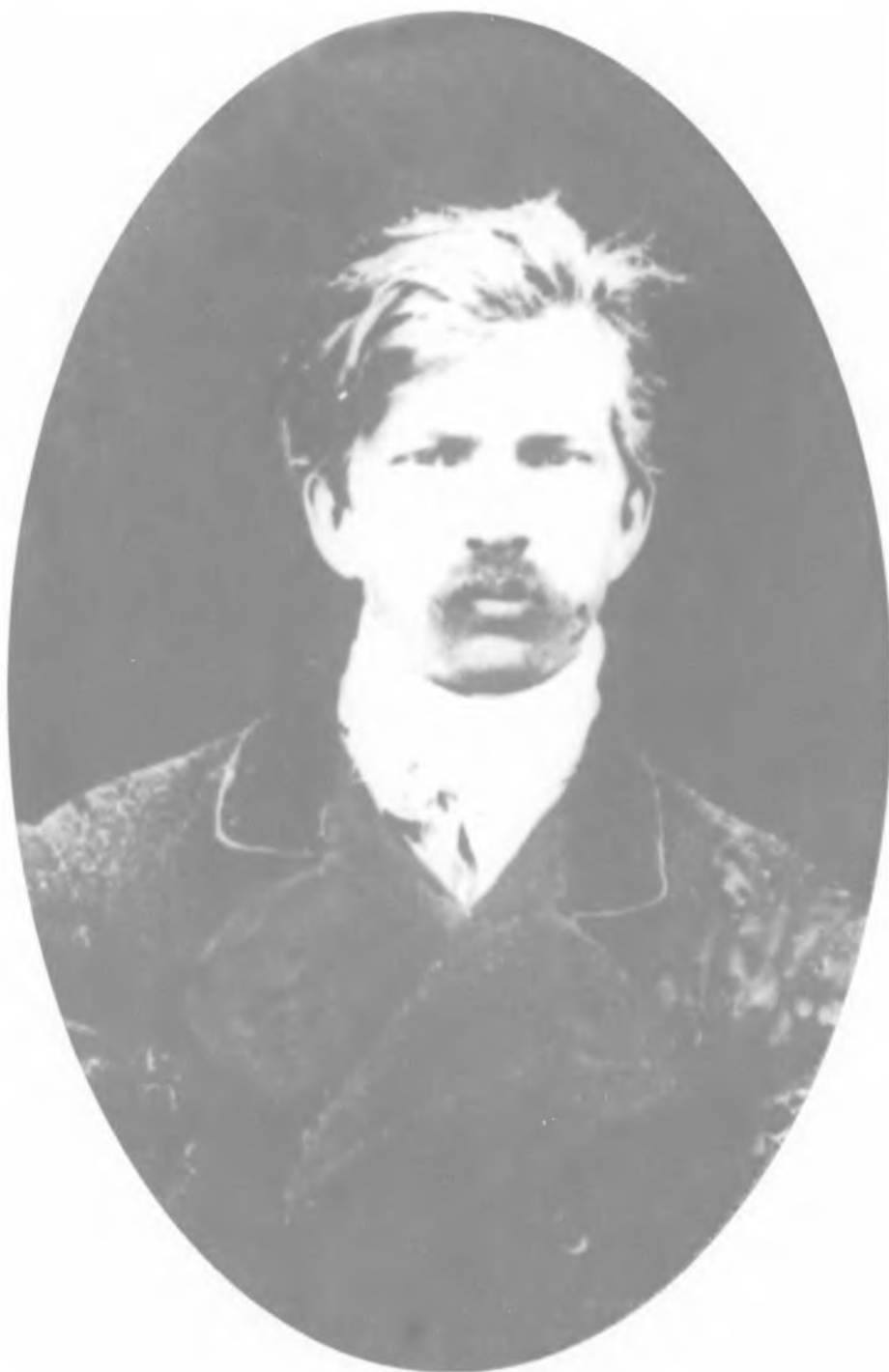
А. К. Соловьев после его покушения на Александра II. Фото 1879 г.