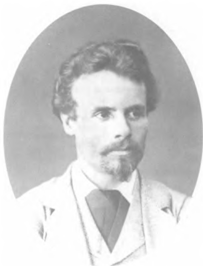
М. Ф. Грачевский. Фото из альбома Александра III. 1882 г.