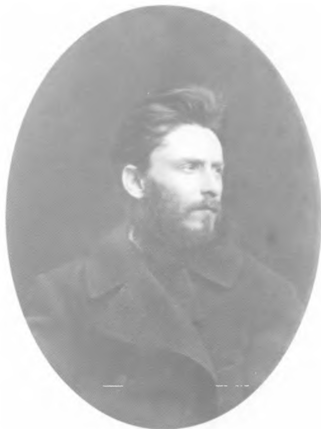
М. Ф. Фроленко. Фото из альбома Александра III. 1881 гг.