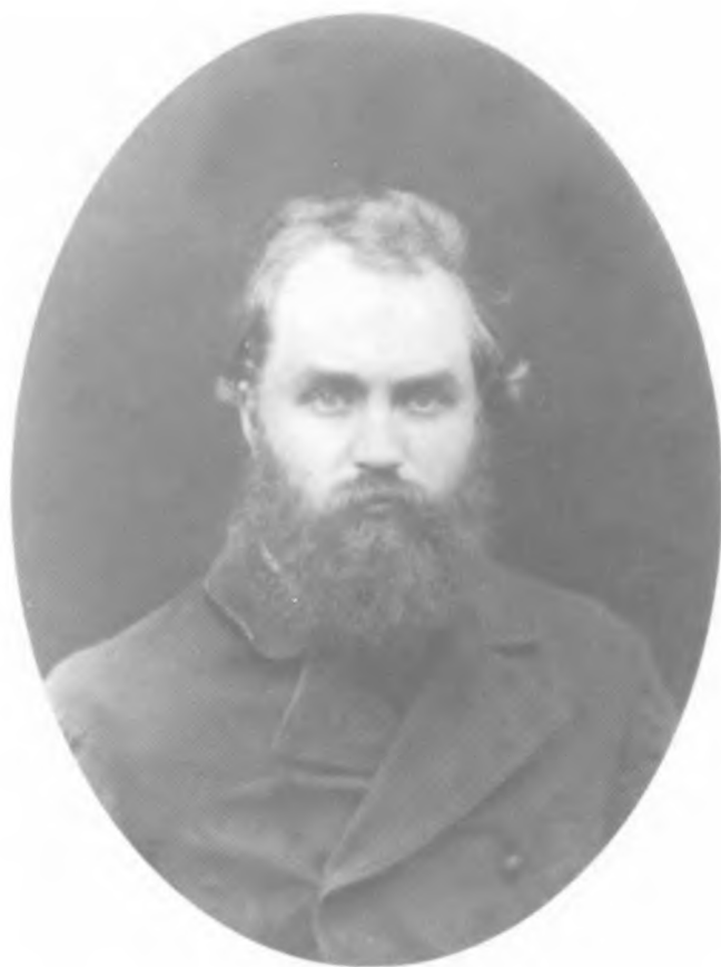
А. Д. Михайлов. Фото из альбома Александра III. 1880 г.