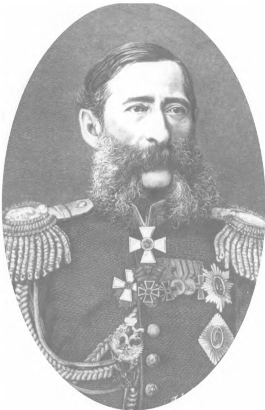
М. Т. Лорис-Меликов