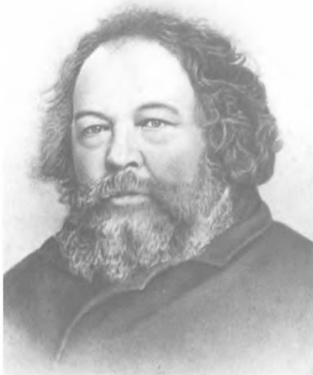
М. А. Бакунин. Фото 1874 г.