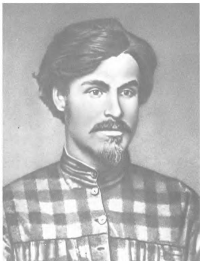
С. Н. Халтурин