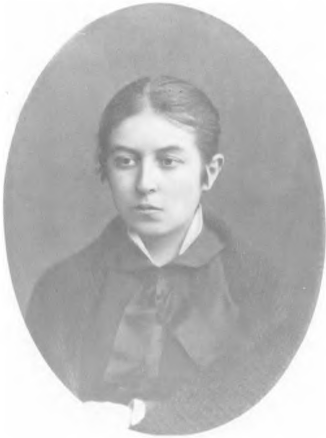
В. Н. Фигнер. Фото из альбома Александра III. 1883 г.