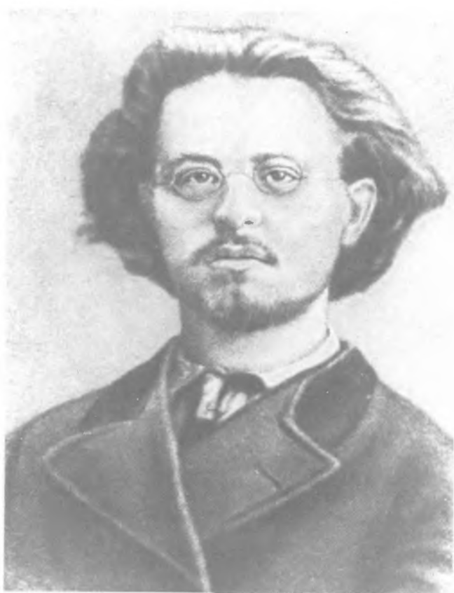
Н. А. Морозов. Фото. Нач. 1870-х гг.