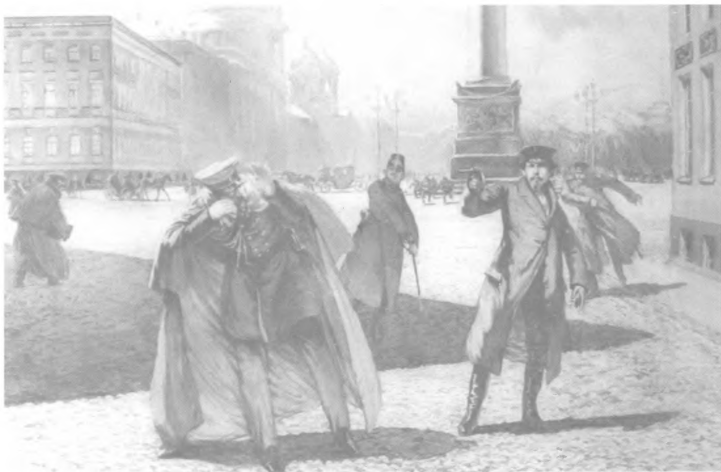
Покушение А. К. Соловьева на Александра II. Рис. Д. Н. Кардовского. 1931 г.