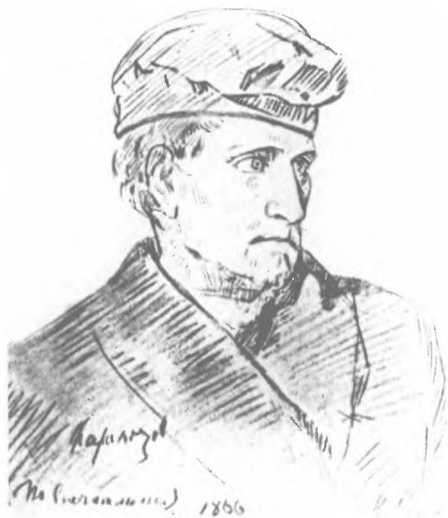
Д. В. Каракозов перед казнью. Рис. И. Е. Репина. 1866 г.