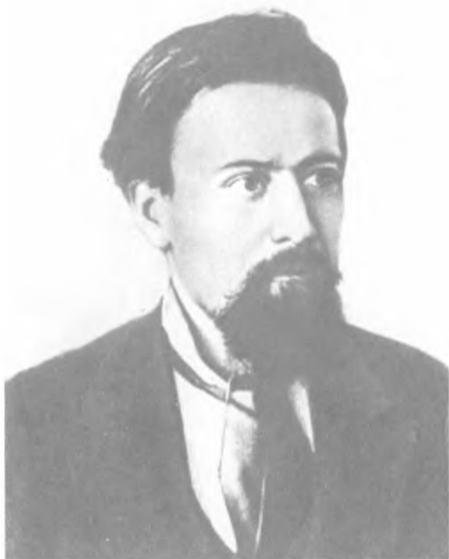
Н. И. Кибальчич