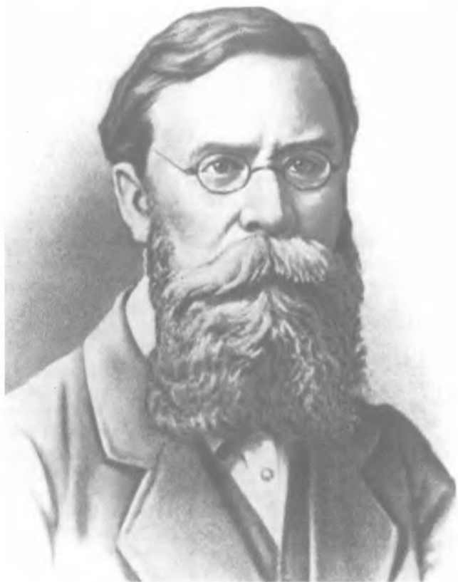
П. Л. Лавров. Фото. 1870-е гг.