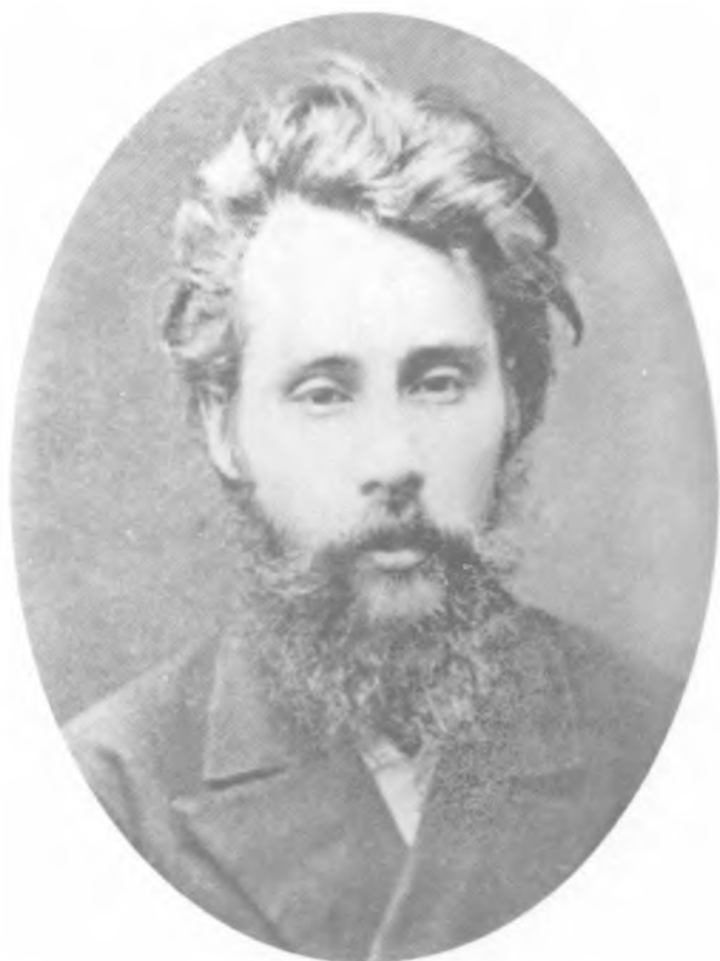
А. А. Квятковский. Фото 1880 г. (?)