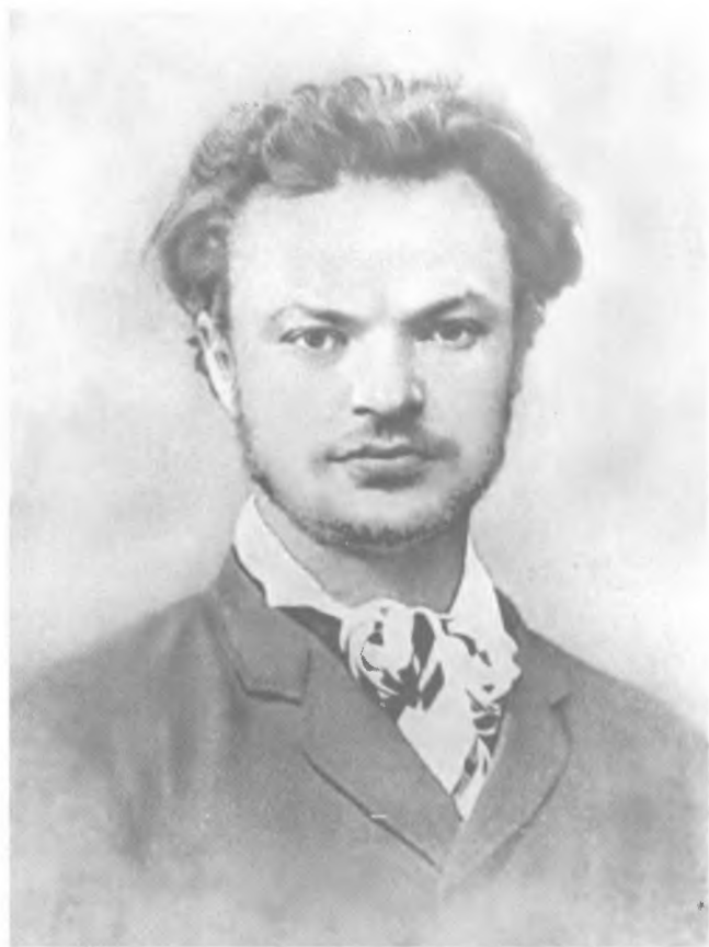
С. М. Кравчинский (Степняк). Фото 1878 г.