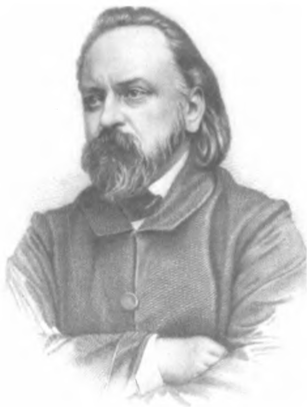
А. И. Герцен. Гравюра А. Леммеля. 1850-е гг.