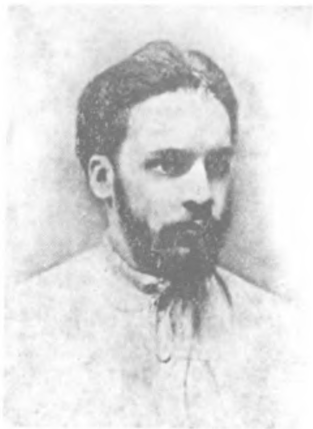
М. В. Куприянов. Фото. 1870-е гг.