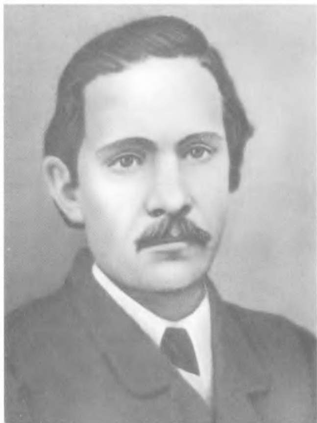
П. Н. Ткачев. Фото. 1870-е гг.