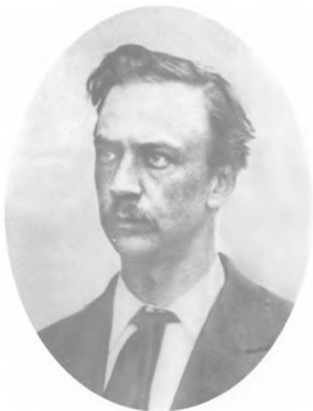
Н. Е. Суханов. Фото 1881 г.