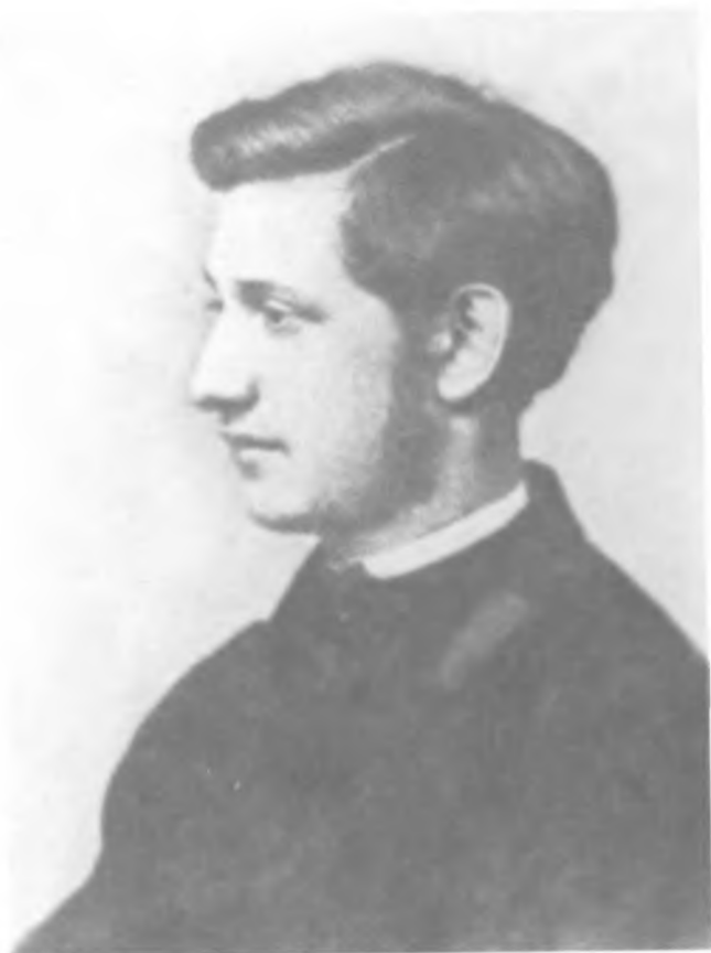
М. А. Натансон