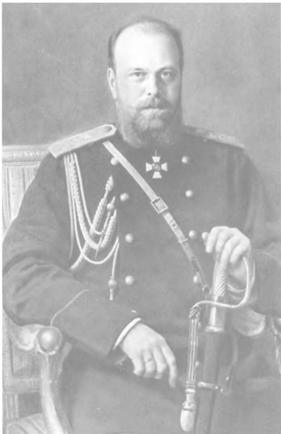
Александр III. Портрет работы И. Н. Крамского. 1886 г.