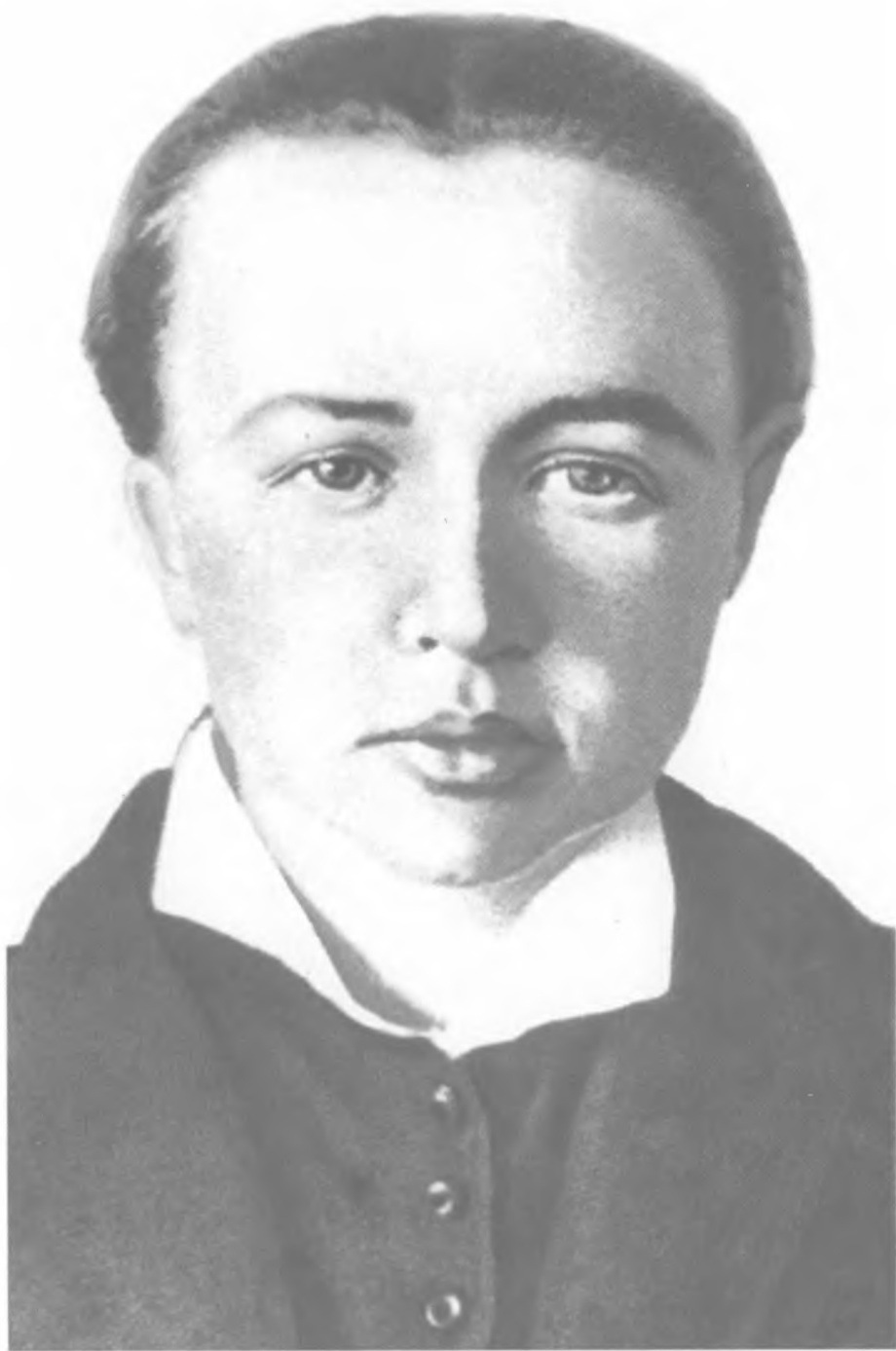
С. Л. Перовская. Фото 10 марта 1881 г. (в день ареста, за 24 дня до казни)