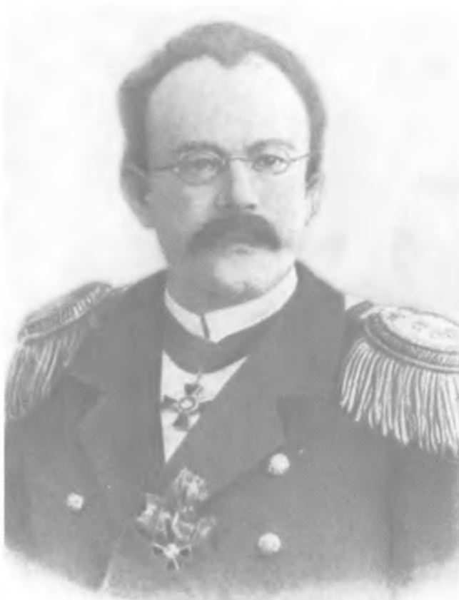
В. Н. Миклухо-Маклай. Фото 1905 г.