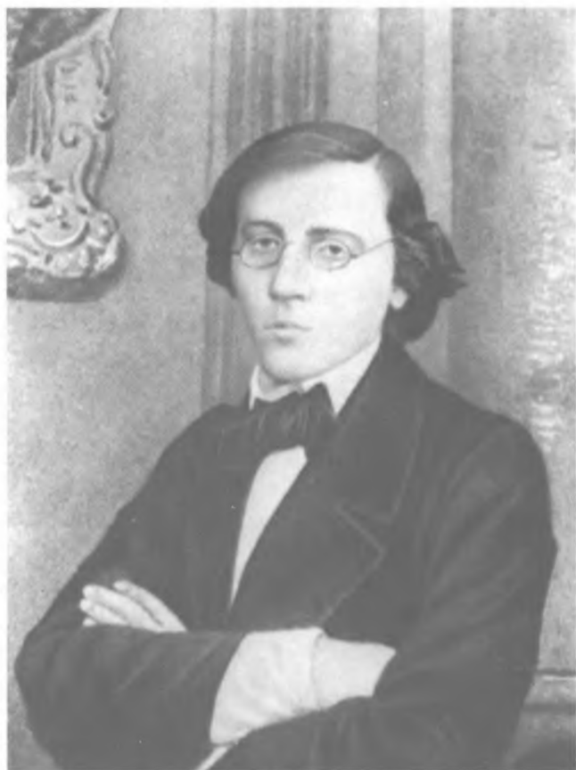
Н. Г. Чернышевский. Фото 1857 г.