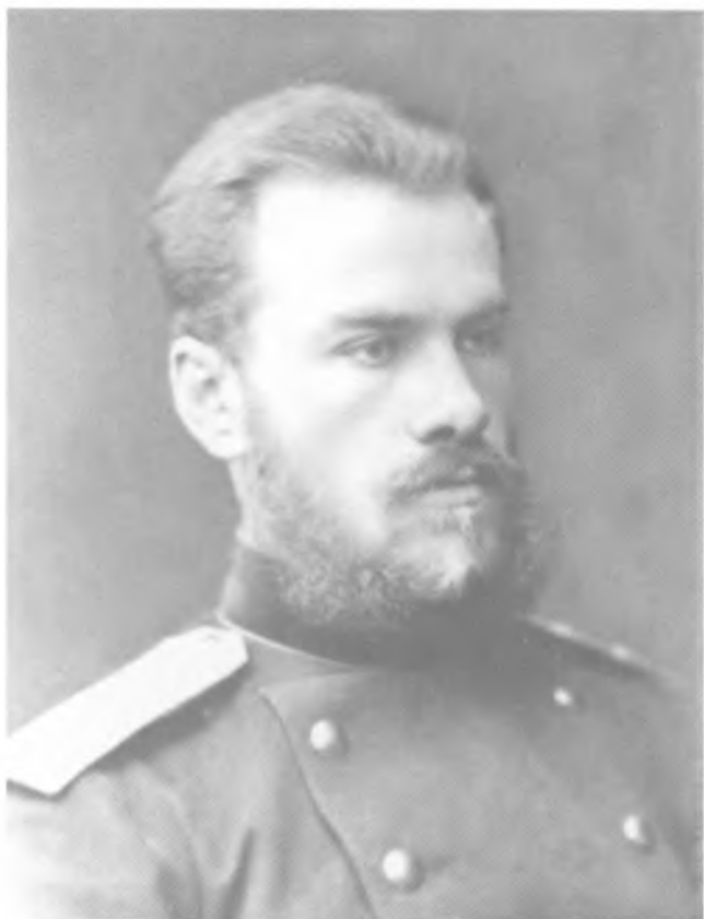
Н. М. Рогачев. Фото из альбома Александра III. 1883 г.