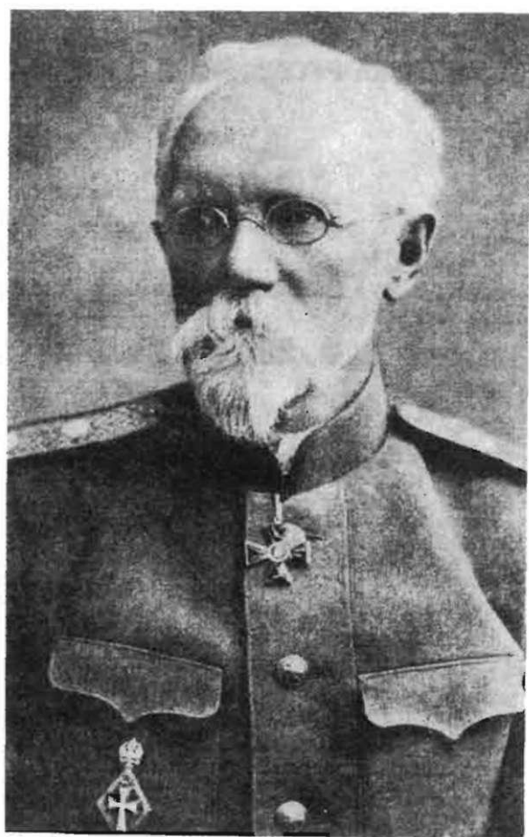
Евгений Францевич Шурло (1853–1934)