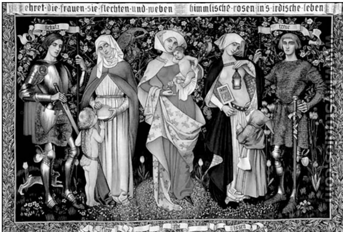
Храбрость, Забота, Любовь, Мудрость, Верность. Гобелен 1912 года

потомстве, даже о сыновьях, хотя забота об их воспитании и обучении и должна лежать на муже. Даже если леди не слишком расположена к такой ответственности, она постоянно должна помнить, как важно научить детей дисциплине. Истинная леди всегда должна быть в курсе, насколько хорошо ведут себя ее дети, и кто отвечает за их образование и уход за ними, и как хорошо этот человек справляется со своей работой. Хорошие дети – это лучшая страховка, уважение и украшение, которое может иметь любая леди. И самое лучшее, что можно сказать о леди – это то, что она заботится о своих детях. Разумная и мудрая леди будет любить своих детей и будет энергично их обучать. Она убедится, что ее дети умеют возносить молитвы Богу и читать и писать, и убедит их отца, что они должны быть обучены латыни и прочим наукам. Когда дети вступят в возраст понимания, она позаботится, чтобы они были обучены подобающим манерам, управлению и всему, чему должны быть обучены дети лорда. Мудрая леди будет пристально наблюдать за всеми, кто имеет доступ к ее детям, и немедленно заменять воспитателей, чье поведение и характер не соответствует возложенной на них ответственности.