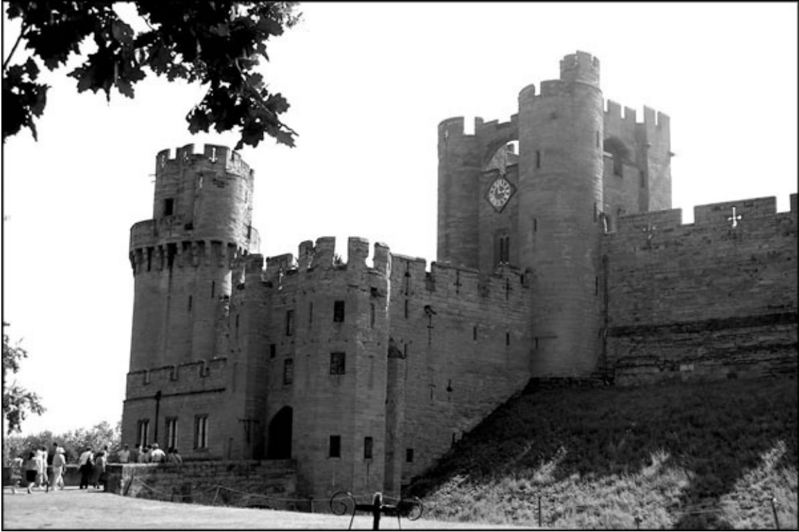
Уорикский замок в Англии

Следующий Томас де Бьючамп, 12-й граф Уорик, снова оказался в оппозиции к королю. Правил тогда Ричард II. Надо сказать, вражда там была действительно не на жизнь, а на смерть, но история повернулась в пользу графа. Англия получила новую династию, и Уорик сохранил и жизнь, и владения. Он построил в замке башню Гай Тауэр (в честь оппозиционера-деда?), и соединил ее стеной с Гейтхаус Тауэр.