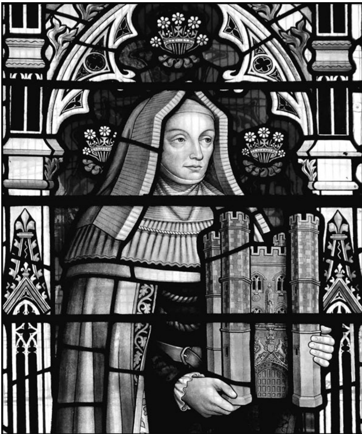
Леди Маргарет Бьюфортс витража в церкви св. Ботолфа

Письма цистерцианского аббата Эйлреда к своей сестре, ставшей отшельницей, почти пугают своей свирепой страстностью: «Пусть для алтаря твоего будет достаточно распятия со Спасителем нашим на нем, что будет постоянно напоминать тебе о его страданиях, которые ты должна прочувствовать. Его руки протянуты, чтобы заключить тебя в объятия, его