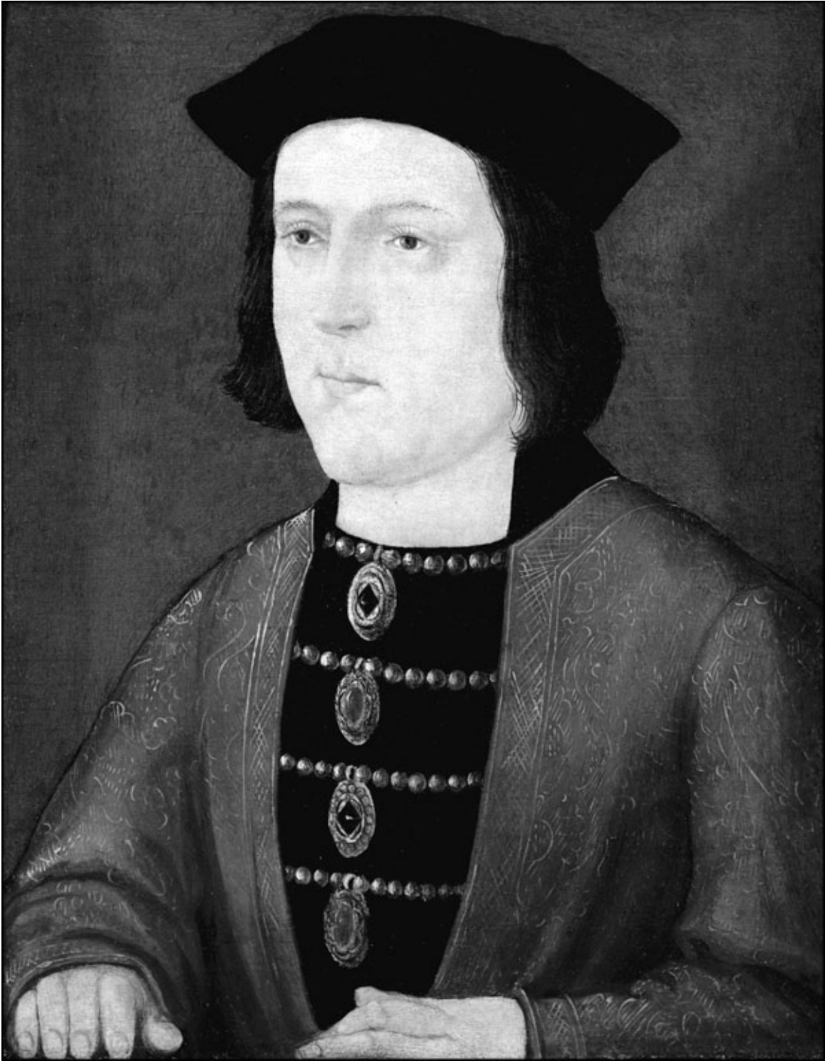
Портрет Эдуарда IV. Неизвестный художник XV века

Перейдем от королей к королевам. Эдит Эдуарда Исповедника умерла от какой-то болезни после смерти мужа в возрасте 50 лет. Матильда Вильгельма Завоевателя родила девять или десять детей и умерла в