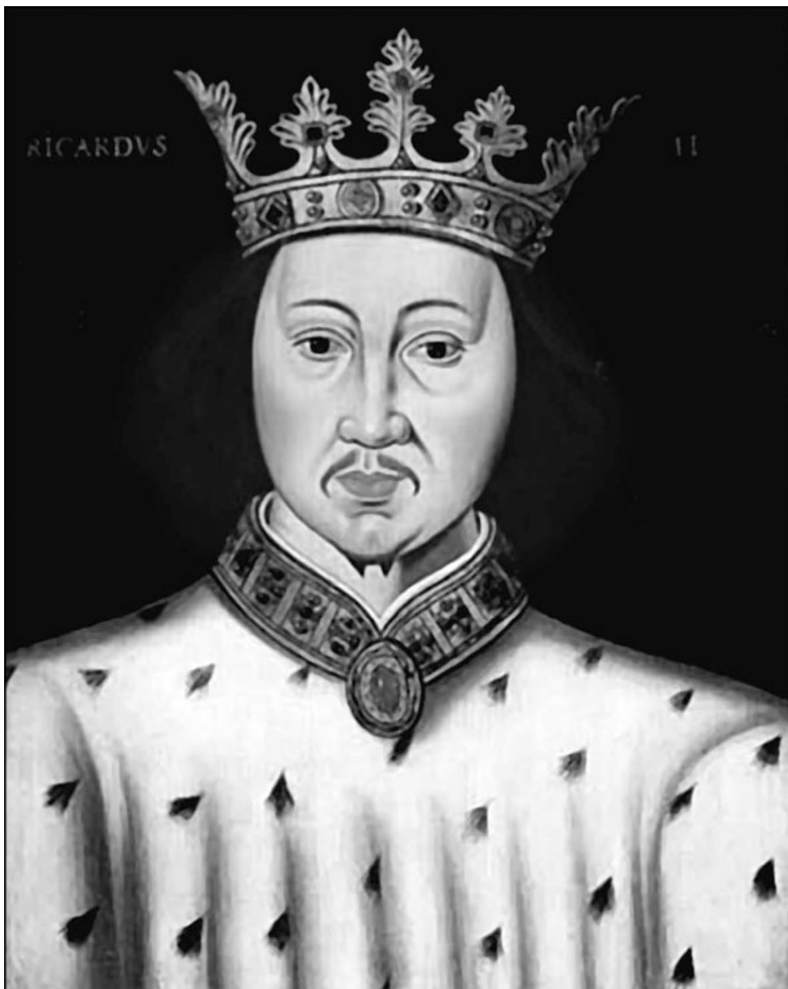
Портрет Ричарда II. Неизвестный художник XVI века

Самым знаменитым бастардом Генри II был Джеффри Плантагенет, который начал канцлером у отца и стал архиепископом Йоркским, ухитрившись рассориться на этом посту и с королем Джоном, и с королем Ричардом – своими братьями по отцу. У короля Джона признанных