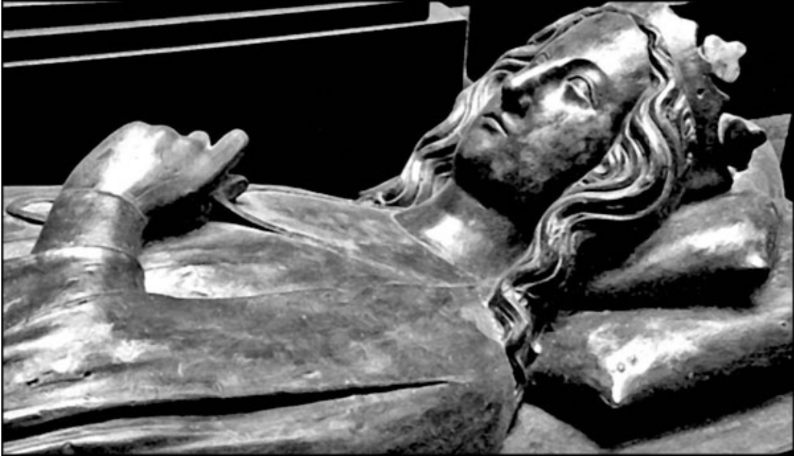
Элеанора Кастильская. Рельефное изображение с гробницы

И пусть англичане не любили Элеанору Кастильскую, вспоминали они ее всегда с уважением. Более того, Эдвард I остался на страницах истории одним из немногих английских монархов, никогда не имевшим интрижек на стороне и не прижившим ни одного бастарда.