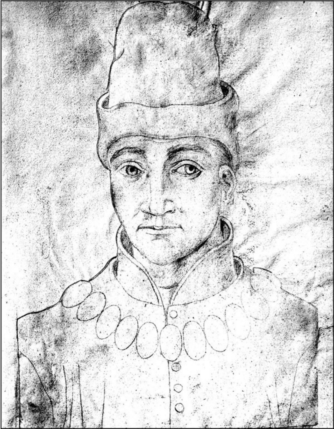
Хэмфри, герцог Глостерский. Рисунок XV век

И вышло так, что еще до того, как нога Маргарет Анжуйской ступила на английскую землю, ее репутации уже был нанесен ущерб: Хэмфри Глостер, не могущий себе больше позволить ущипнуть кардинала,