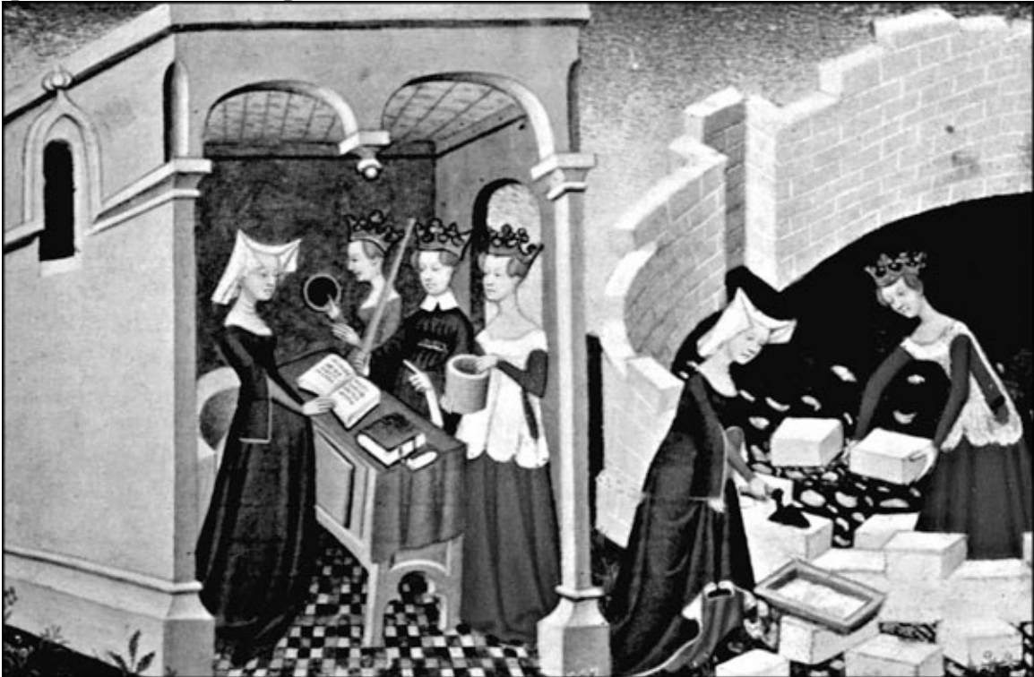
Иллюстрация к Кристины Пизанской «О Граде женском». Рукопись XV века

вассалов, не так ли? Более того, она ведь не допустит, чтобы работающая сеть взаимных услуг, знакомств, благотворительности, которой она управляла при жизни мужа, стала бесхозной и бесполезной только потому, что в семье леди случилось несчастье. Репутацию нужно поддерживать, а связи подпитывать. Что, в свою очередь, накладывает определенные требования на стиль жизни вдовой леди, если она решит остаться некоторое время незамужней по истечении срока траура. Социальность и гостеприимность – да, веселые приемы, драгоценности и яркие одежды – нет и нет. Никакого смеха, никаких песен и танцев на людях, даже если леди по натуре к ним предрасположена. Особенно осторожной следует быть перед мужчинами, которые могут истолковать ее веселость неправильно – и с неприятными для леди последствиями.