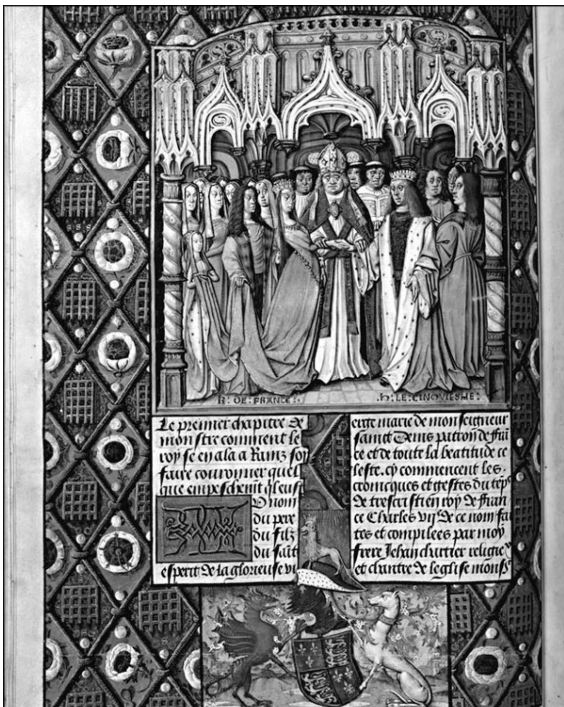
Бракосочетание Генри V и Кэтерины Валуа. Миниатюра XV века

Их действительно соединили родители, потому что леди Маргарет стала женой лорда Томаса в возрасте 7 лет, в 1367 году. Жениху было 15. Собственно, все мужчины из рода Беркли женились рано. Морис Беркли, родившийся в 1289 году, женился на Эве ле Зух, когда ему было восемь, и