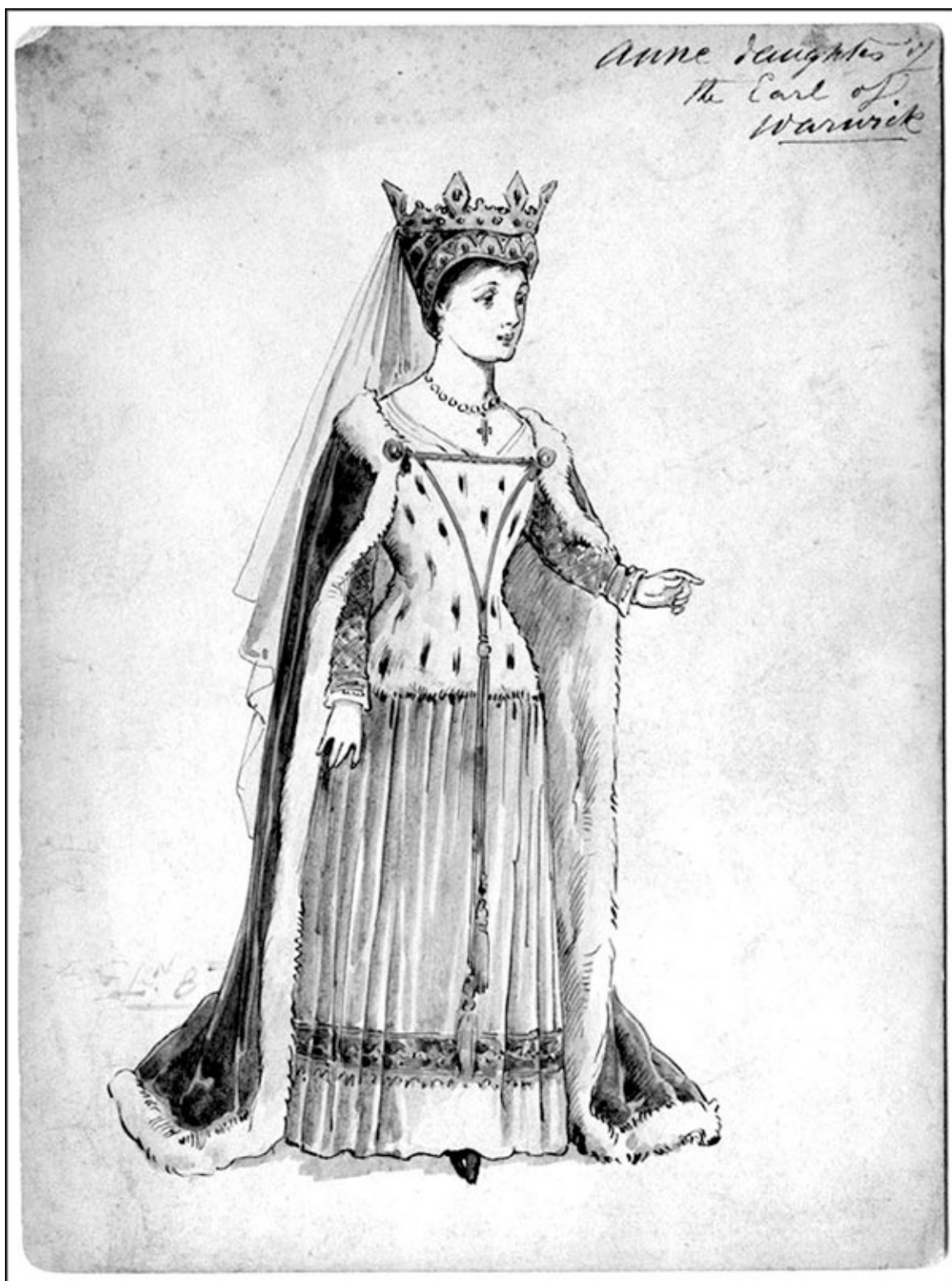
Портрет Анны Бьючамп. Начало XX века

Когда граф стал врагом короля Эдварда, его супруга последовала за ним в изгнание, во Францию, и лично присутствовала при бракосочетании