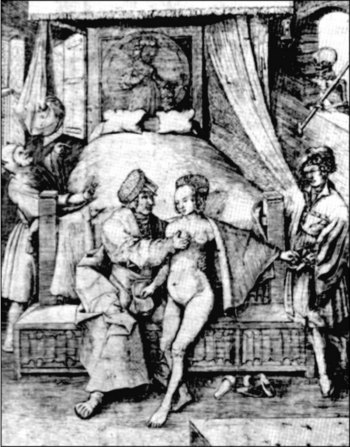
Проститутка ворует у клиента деньги для своего сутенёра

Собственно, в Англии такие люди находились. Поскольку городские муниципалитеты без восторга относились к наличию публичных домов и «частных практик» на своей территории, в обычае олдерменов было