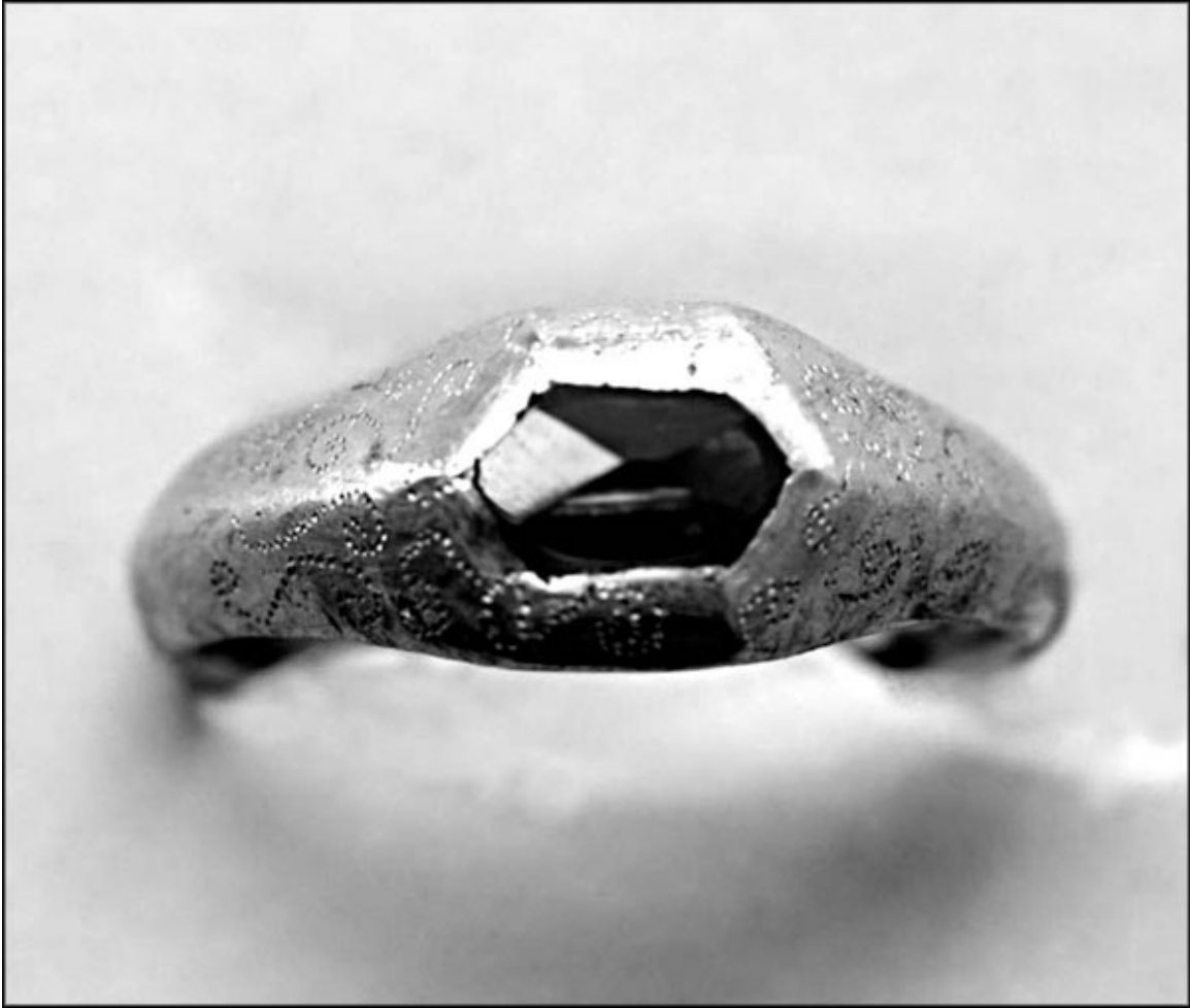
Средневековое кольцо, золото и сапфир. Надпись на кольце «Loyal Desir» – «Верный в своем желании». Начало XV века.

В середине и конце Средних веков развод существовал в двух формах. Во-первых, в случае, когда брак изначально был неправомерен, то есть, если у одного из супругов где-то существовала уже половина и это было скрыто. Во-вторых, если пара попадала под какой-то пункт из длиннейшего листа препятствий к браку: генетическое родство или даже родственные связи через браки родственников (самая популярная причина), импотенция супруга, подтвержденная жюри из десяти-двенадцати «матрон», принуждение к браку силой или запугиванием, несовершеннолетие, имеющийся в наличии официальный обет безбрачия, ситуация, когда один из супругов не состоит в христианской вере. Собственно, все эти препятствия сосредоточены на периоде до вступления в брак, они как бы делают этот брак ненастоящим. Эти разводы признавались по принципу «a vinculo», и расставшиеся супруги считались как бы и не вступавшими никогда в брак. Правильнее назвать эту форму развода аннулированием