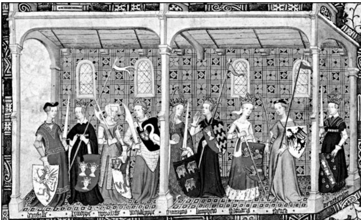
Дамы-рыцари. Из манускрипта «Странствующий рыцарь», 1400 год

Удивительно мало пишут об этом событии, поэтому многие о женщинах-рыцарях просто никогда не слышали. Членов ордена называли Cavalleras, Equitissae и Militissae. Для них была учреждена форма, напоминавшая форму капуцинов, они были освобождены от налогов, они получили право участвовать в тех же сборах, что и мужчины, сидеть выше их и передавать рыцарский титул по женской линии. Известно, что в 1472 году, при осаде бургундцами Бове, атака была отбита под руководством Жанны Аше, члена Ордена Топора. Орден никогда не был расформирован, и предполагается, что он исчез сам по себе, со смертью последней женщины-рыцаря. Если исчез.