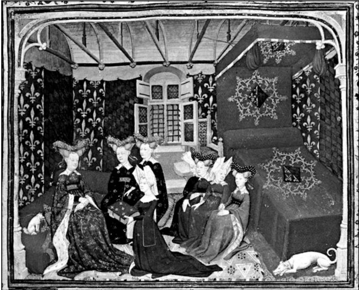
Кристина Пизанская презентует свою книгу королеве Изабелле Баварской. Миниатюра начала XV века

просыпались в походных палатках, а то и на крепостных стенах под звуки начинающегося штурма. Но здесь речь идет о другом. Речь идет об искушении почувствовать себя лучше других, за которым может последовать искушение вспомнить о нанесенных обидах и почувствовать себя вправе отомстить за эти обиды сладко и основательно. Речь идет об упоении властью, и эта тема никогда не теряла актуальности.