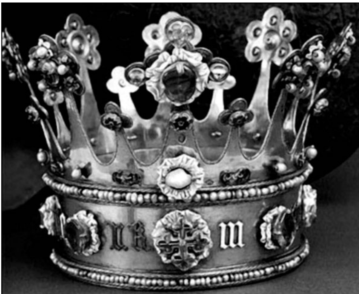
Корона Маргарет Йоркской из Аахенского кафедрала. 1467–1468 года

На портрете Маргарет Йоркской изображены еще несколько украшений. Подвеска в виде буквы В (Burgundy), комбинированная с жемчужиной (marguerites), брошь в виде золотой маргаритки и колье. Относительно колье тоже идут дебаты (оно не сохранилось), но это украшение идеально подходит к короне, которая совершенно точно принадлежала этой даме, так что можно с достаточной уверенностью сказать, что колье было, и что оно принадлежало Маргарет Йоркской. Главной причиной дебатов служит комбинация белых и красных роз в колье. С белыми розами, эмблемой Йорков, все более или менее понятно. Но что делают на колье красные розы, твердо ассоциирующиеся у наших современников с домом Ланкастеров? Правда, скорее всего, заключается в том, что в 1460-х, когда Маргарет выходила замуж, никакие красные розы Ланкастеров не символизировали. Красные розы в колье символизируют Карла Смелого, цветами которого были красное и черное.