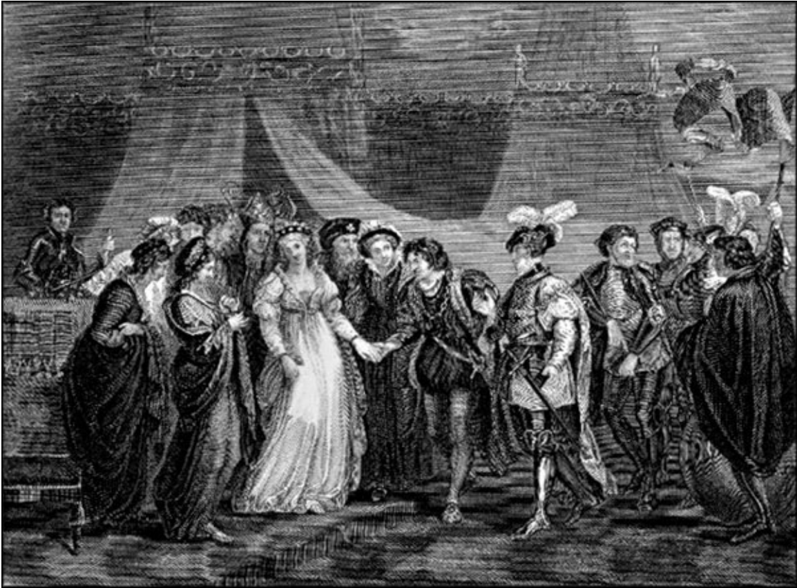
Катерину Валуа представляют Генри V. Гравюра Томаса Стотарда. Около 1830 года

Возникает очень сильное подозрение, что Эдмунд, сын Оуэна Тюдора, был на самом деле Эдмундом – сыном Эдмунда Бьюфорта, о чем свидетельствует и его герб, повторяющий герб Эдмунда Бьюфорта с модифицированным бордюром. В какой момент начались отношения между Катериной и Оуэном Тюдором? Были ли у них вообще отношения? Этого мы просто не знаем. В Средние века сертификатов о браке еще не было, и вполне возможно, что шустрый уроженец Уэльса просто взял «вину» на себя, прикинув, что, при доле удаче, это поможет ему в карьере. Как, в общем-то, и получилось. И если говорить о хорошо прослеживающихся в таких делах закономерностях, то брак Эдмунда Бьюфорта с Элеанор Бьючамп (вдовой) был заключен тайно и без лицензии, обязательной для лиц королевской крови. Пардон они получили и штраф заплатили только в 1438 году, хотя поженились, скорее всего, сразу после смерти Катерины Валуа в 1437 году. Впрочем, если Эдмунд Бьюфорт и Катерина Валуа были тайно женаты, это вовсе не делает Эдмунда Тюдора и его сына бастардами. Вернее, не делало бы, если бы эти Тюдоры носили