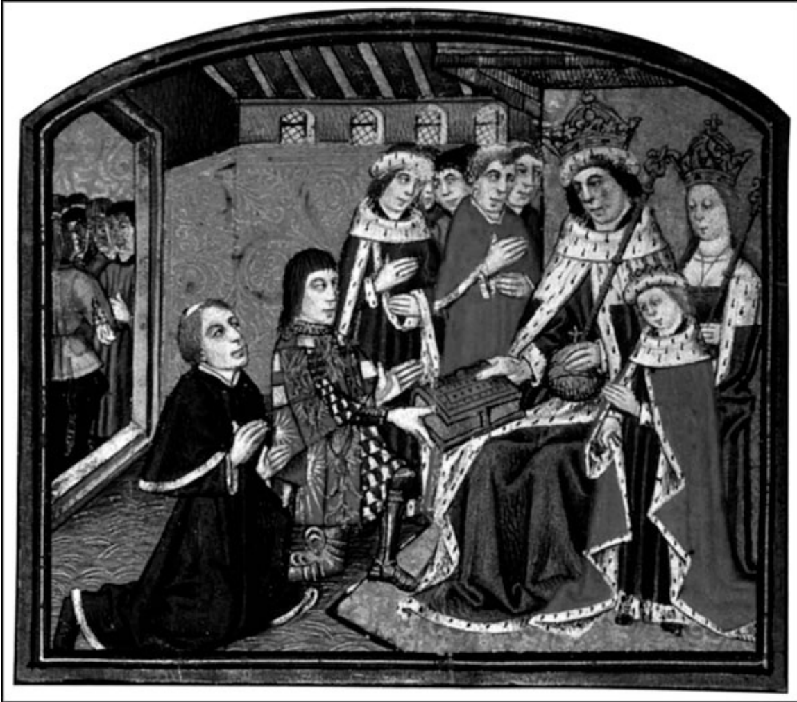
Эдвард IV с семейством принимают первую печатную книгу от графа Риверса. Миниатюра 1476 года