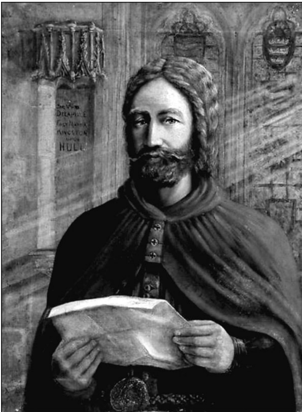
Воображаемый портрет Уильяма дела Поля, графа Саффолка. Художник Томас Тиндейл, 1888 год