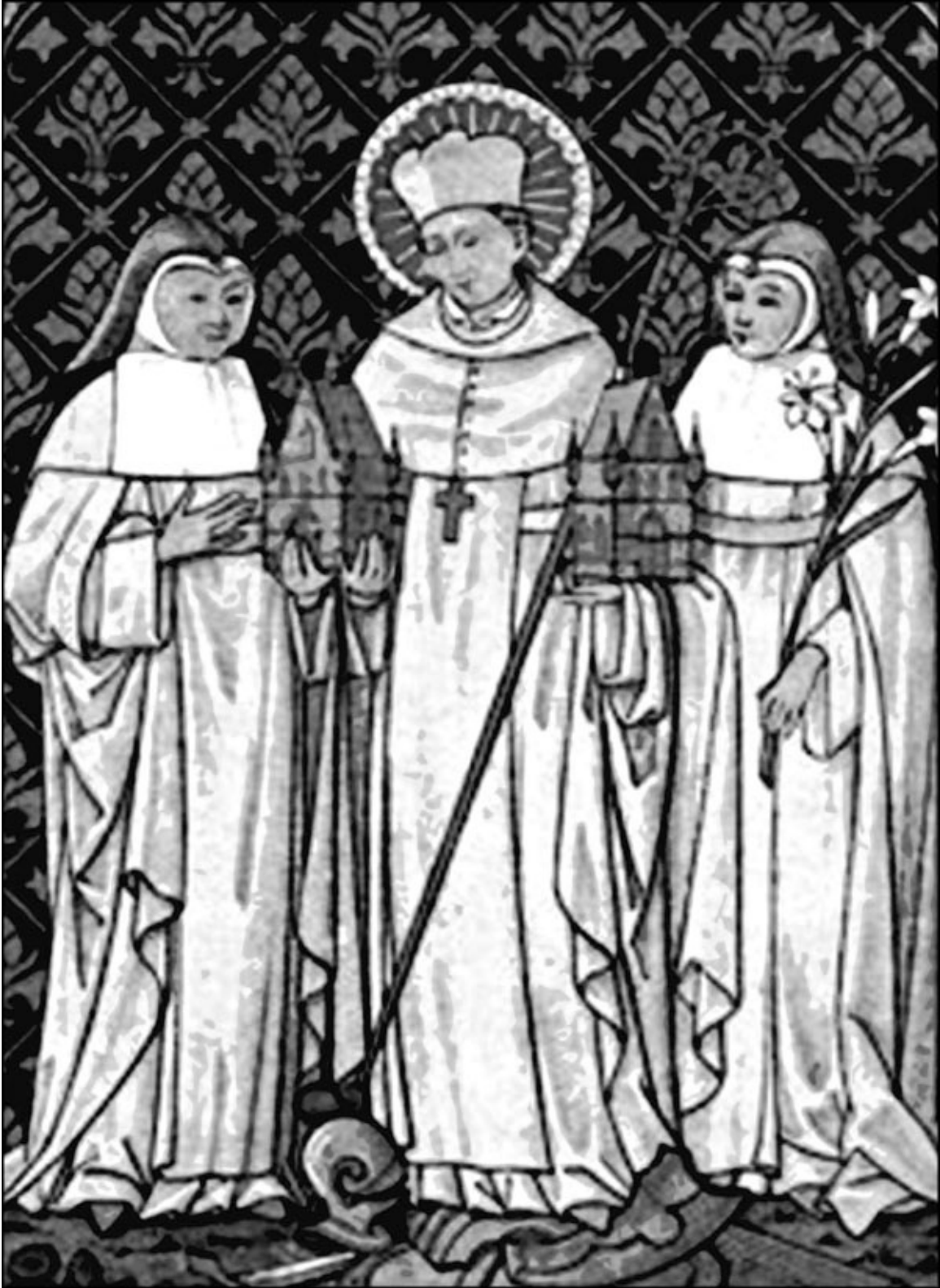
Святой Гильберт Семпрингхемский и 2 монахини

Католическая Энциклопедия упоминает, что Гильберт вернулся после